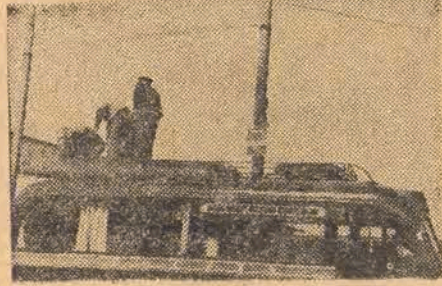
rekcji Poczt i Telegrafów za tę wspaniałą inicjatywę.