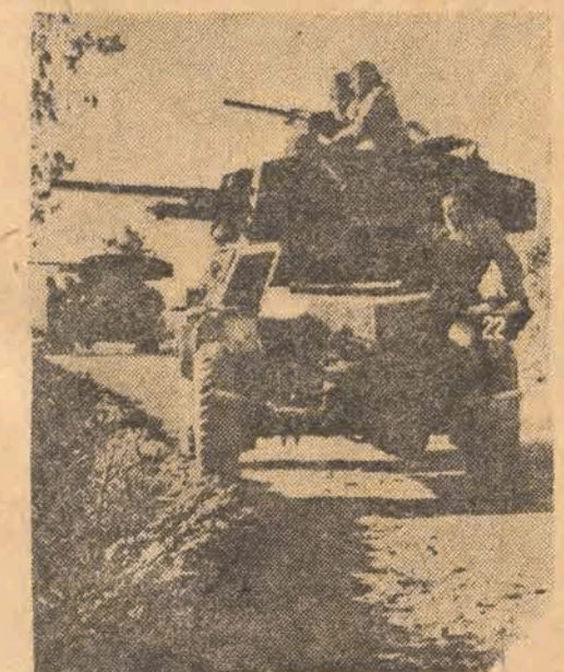
Dwa czołgi amerykańskie pod Drana, które wpadły bez walki w ręce wojsk Markosa.