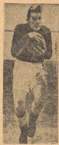
REYMAN bramkarz Czechosłowacji — w akcji.

(Z notatnika specjalnego wysłannika „Głosu Robotniczego)