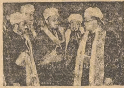
Król Transjordanii ABDULLACH w otoczeniu swojej świty.

żydowskie na Jaffę trwało nadal. Arabowie opuszczają miasto. Co godzina wyjeżdża 20 samochodów z uchodźcami. Do Libanu przybyło już podobno przeszło 20 tys. uchodźców arabskich.