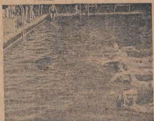
Na pływaniu W. P. w Warszawie

400 m stylem dowolnym mężczyzn: 1) Ramola (Międzyzw.) 5:30,6, 2) Marchlewski (Kolej.) 5:30,6, 3) Gremłowski (Międzyzw.) 5:43,4. Szfata 4x100 m stylem klasycznym kobiet: 1) Metalowcy — 6:50,1, 2) Samorządowcy — 6:55,7 3) Górnicy — 7:04,0. Szfata 3x100 m stylem zmiennym mężczyzn: 1) Metalowiec — 3:49,0, 2) Samorządowiec — 3:51,3, 3) Międzyzwiązkowiec — 3:58,7. Szfata 5x50 stylem dowolnym kobiet: 1) Metalowcy — 3:13,9, 2) Samorząd. — 3:20,6, 3) Międzyzw. — 3:30,7. 200 m stylem dowolnym mężczyzn: 1) Marchlewski (Kolej.) 2:29,4, 2) Ramola (Międzyzw.) 2:30,7, 3) Jerra (Międzyzw.) 2:38,9.