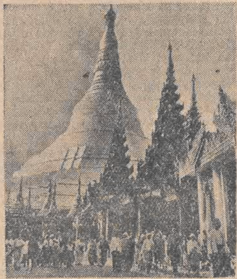
HAJDERABAD — stolica kraju, o tejże nazwie, liczącego 13 milionów mieszkańców.

LONDYN PAP. — Komunikaty wojenne, ogłaszane w New Delhi, notują dalszą ofensy-