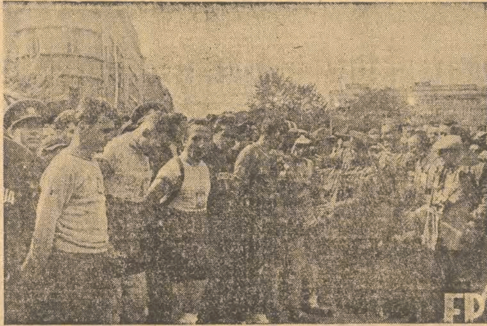
NA MECIE W BRNIE

Zawody samochodowe: godz. 10 impreza na ulicach Łodzi pod hasłami „Oszczędzajmy benzynę”.