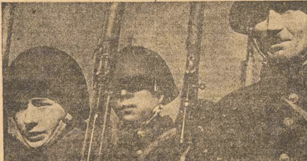
W dywizji im. Tadeusza Kościuszki walczyli ramię przy ramieniu ojciec i syn