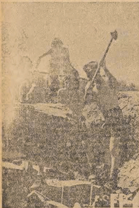
„Służba Polsce” — bataliony rzeszowskie we Wrocławiu przystąpiły do pracy w trzech punktach miasta. Odbudowa stadionu olimpijskiego, usuwanie ruin w mieście i budowa Wystawy Ziemi Odzyskanych. Kilka kompanii pracuje przy niwelowaniu terenów wystawowych