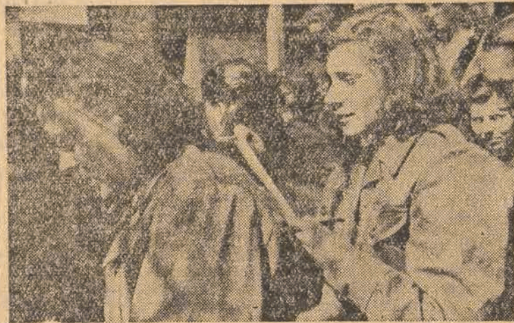
Fragment z życia obywateli dla przodowników gminnych PRW — kobiet woj. łódzkiego w Justynowie pod Łodzią

OGŁOZ GROMADZI 100 DZEWICZĄT i podlega „SŁUŻBIE POLSCE”