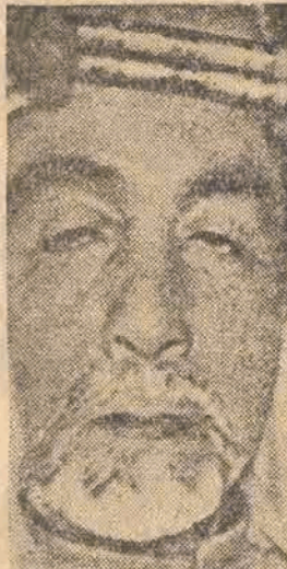
Emir Transjordanii Abdullah

NOWY JORK, PAP. Na posiedzeniu odbytym w poniedziałek wieczorem, Rada Bezpieczeństwa postanowiła przedłużyć o 48 godzin tj. do środy godz. 16 ostateczny termin ogłoszenia rozejmu w Palestynie.