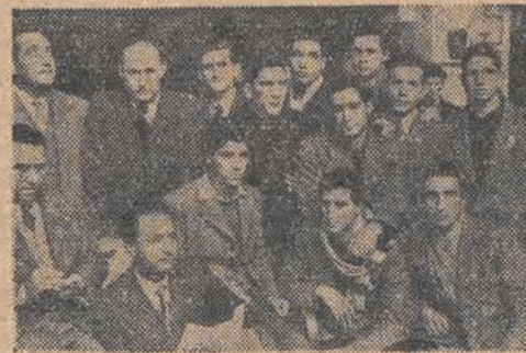
„Pięściarze włoscy po występie w Łodzi zmierzają się dzisiaj z reprezentacją Szczeci- na a w niedziele z reprezentacją Wybrzeża.