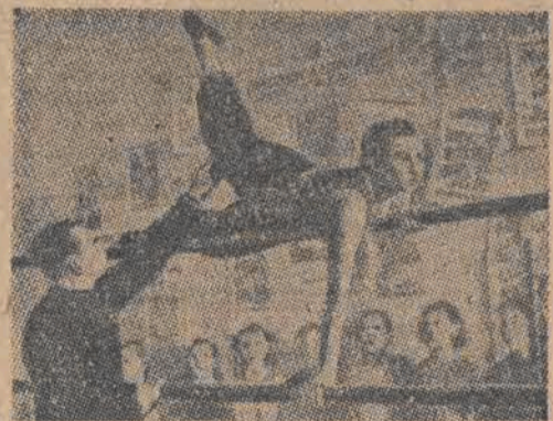
Młodzież szkolna w ZSRR z zamiłowaniem uprawia gimnastykę przyrządową.

Dużą rolę w rozwoju tężyzny fizycznej chłopców i dziewcząt odgrywa turystyka. W roku bieżącym ponad 4 miliony młodzieży radzieckiej spędziło lato na świeżym powie- trzu, w obozach wędrownych i na szlakach turystycznych ZSRR.