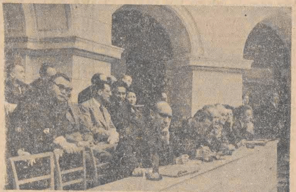
Delegaci partii komunistycznych i robotniczych z całego świata biorą udział w Kongresie w charakterze gości.