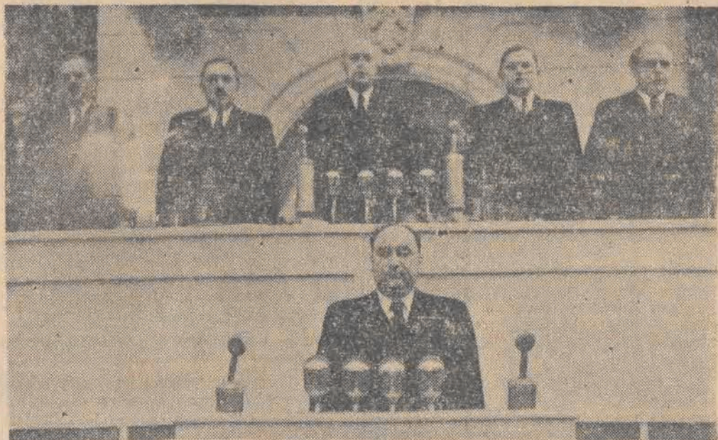
Tow. Ponomarenko wita 1-szy Kongres Polskiej Zjednoczonej Partii Robotniczej w imieniu Partii Komunistycznej ZSRR.