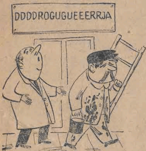
Gdy malarz szyldów się jąka

Na marginesie procesu szajki Dołęwskiego.