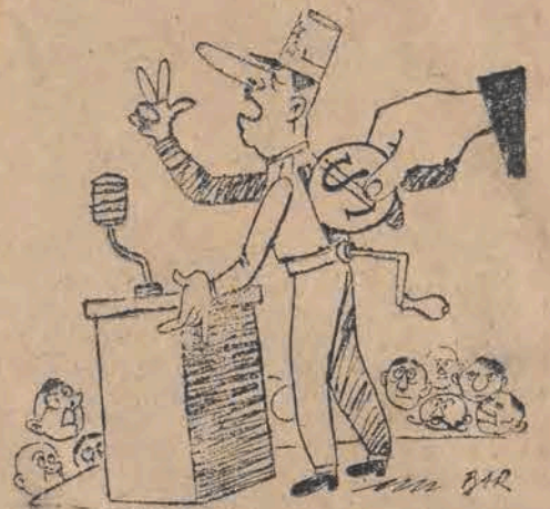
„Mowa jest złotem”