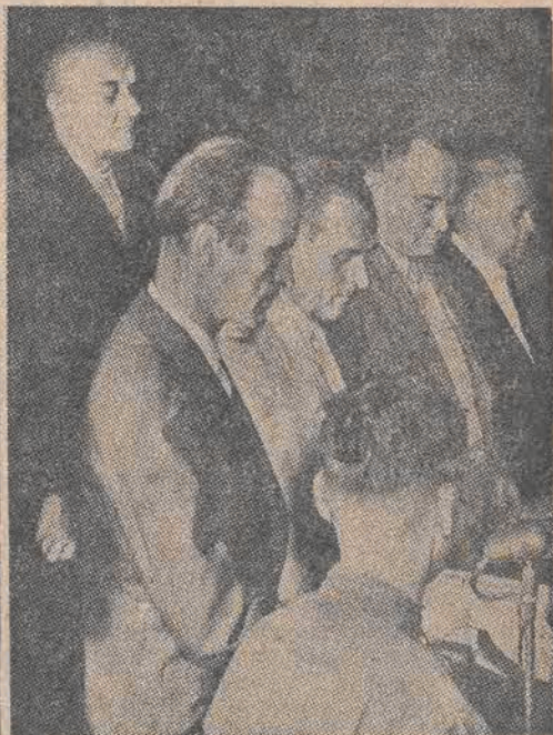
Alfred Krupp (pierwszy z prawej) w otoczeniu rekinów kapitału niemieckiego — słucha aktu oskarżenia przed trybunałem w Norimberdze.