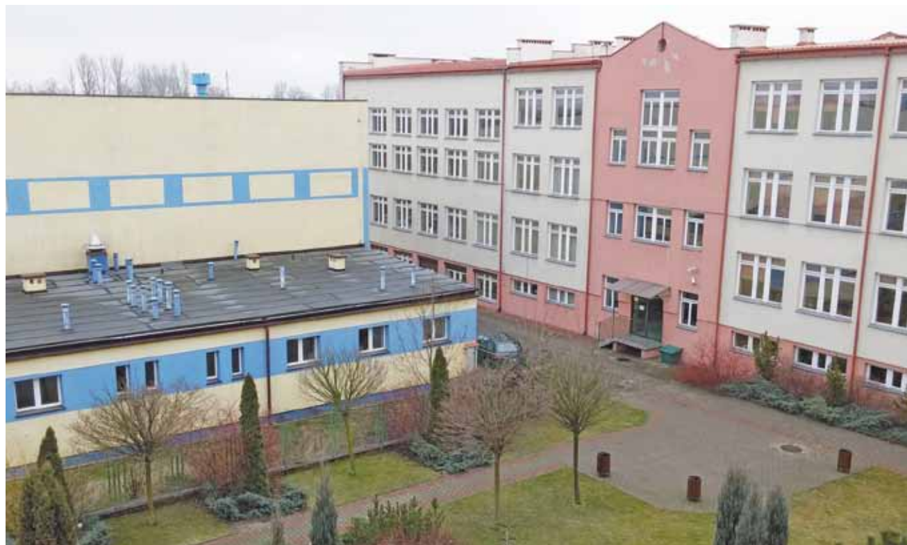
Widok na budynek ZSP nr 4 stojący równoległe do ulicy Kaliskiej (po prawej stronie) przez zielony dziedziniec szkoły, po lewej widać tył budynku basenu, który pierwotnie miał być salą gimnastyczną tej placówki. Pomiędzy obiektami brakuje jedynie łącznika, który zapewniłby komunikację między nimi.

Inwestycja, warta około 4 mln zł, ma się rozpocząć w tym roku i jest zaplanowana na najbliż-