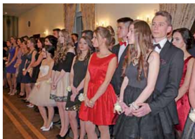
Uczniowie klasy IIIc czekają na rozpoczęcie części uroczystości na którą składał się program artystyczny, życzenia i podziękowania.