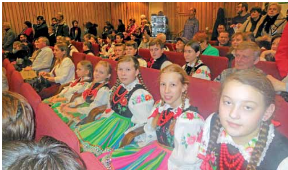
Koderki w oczekiwaniu na wyniki festiwalu w Teresińskim Ośrodku Kultury.

W tym roku było wyjątkowo dużo formacji ludowych i zespołów. Jury starało się wybrać tych,