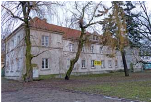
Budynek naprzeciwko starostwa (w sąsiedztwie ronda Księżwa Łowickiego) ponownie wystawiony jest na sprzedaż.

Starostwo Powiatowe w Łowiczu po raz kolejny wystawiło na sprzedaż budynek położony po przeciwnej niż urząd stronie ul. Stanisławskiego pod numerem 31 B, które przed kilkoma laty użytkował Zespół Szkół Ponadgimnazjalnych nr 3.