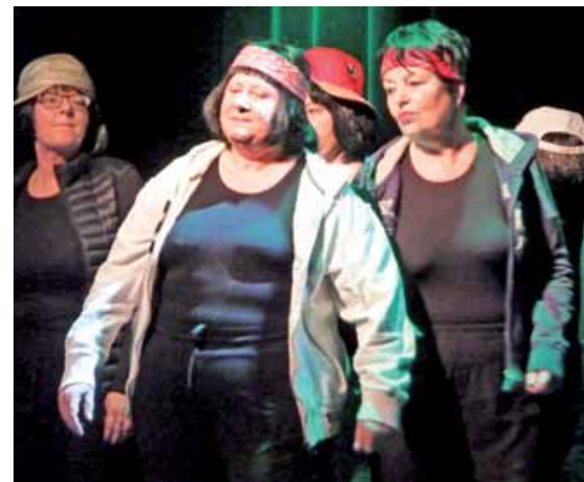
AleBabki w hip-hopowej odsłonie zrobili mocne wejście na scenę, później było jeszcze lepiej.

się w teatr 50+”, rozbawiła publiczność spektaklem tanecznym „Wirujący Senior”. 10 dziarskich pań pokazało na scenie, że bycie babcią to pojęcie względne. Publiczność nagrodziła gromkimi brawami i jeden, i drugi spektakl, z nadzieją, że przyszłoroczny Dzień Babci i Dziadka będzie mogła spędzić równie wyśmienicie.