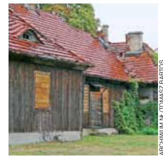
Stan drewnianej konstrukcji alkierzówki jest tragiczny.

Władze powiatu łowickiego, po nieudanej próbie znalezienia w drodze przetargu firmy lub osoby chętnej na rozebranie budynku alkierzówki na ul. Blich i pozyskanie z tej rozbiórki drewna, zdecydowały, że wystawią na sprzedaż całą nieruchomość. Stanie się to wiosną tego roku – najwcześniej na przełomie marca i kwietnia.