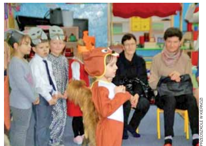
Przedszkolaki chętnie występowały przed babciami i dziadkami.

Zaproszeni na spotkania seniorzy mieli okazję podziwiać swoje wnuczka w krótkich programach artystycznych. Na scenie pojawiały się księżniczki, motylki, pszczołki, niedźwiadki, wiewiórki, zajączki i inne zwierzęta. Każdy z przedszkolaków miał przygotowaną niespodziankę – był to okolicznościowy