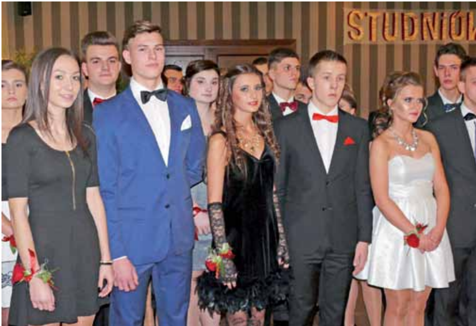
Uczniowie klasy IIIb.