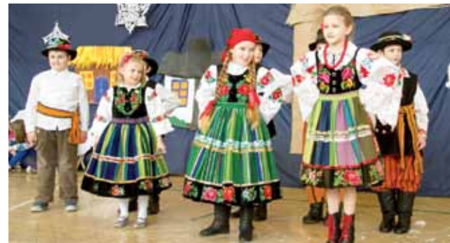
Uczniowie klasy II A śpiewali i tańczyli po łowicku.