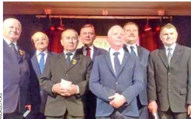
Organizatorzy spotkania oraz odznaczeni działacze ludowi na scenie Gminnego Domu Kultury w Zdunach.

Próby dociekania, dlaczego tak się stało, pozostały bez echa, podobnie jak pytania o to, co przemawiało za zmianą dotychczasowego zarządu. Co do pytania o wynik finansowy Stadniny Koni Walewice za rok 2015, to ANR odpowiada, że będzie on znany dopiero po zatwierdzeniu sprawozdania finansowego przez biegłego rewidenta, a więc za kilka miesięcy. ■