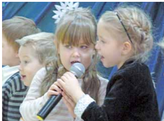
Wnukowie i wnuczki śpiewali zarówno chórem, w duetach, jak i solo.

Potem prezentowały się klasy I-III szkoły podstawowej, prezentując adekwatne do okazji wierszyki i piosenki, śpiewane solo, jak i chórem. Za program artystyczny odpowiedzialne były wychowawczynie poszczególnych grup i klas. Po tej części uroczystości nadeszła chwila,