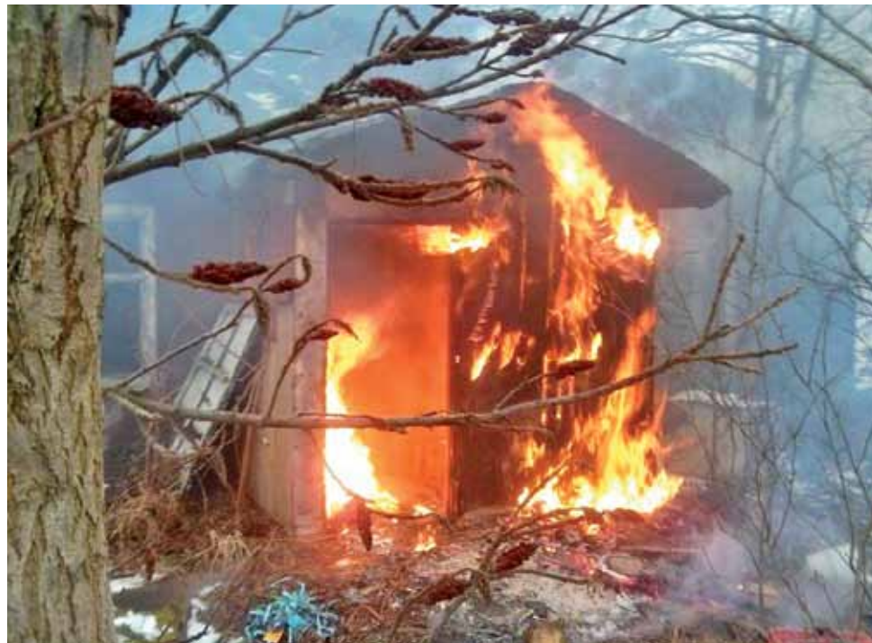
Pożar bardzo szybko się rozprzestrzenił. Człowiek spał właśnie w miejscu, w którym wybuchł największy ogień. Prawdopodobnie zginąłby, gdyby pomoc nadeszła kilka minut później.

Natychmiast go obudzili i wyprowadzili na zewnątrz. Na szczęście nie doznał żadnych obrażeń, choć prawdopodobnie tak by się skończyło, gdyby pozostał w budynku dłużej. – Kto wie, czy ten