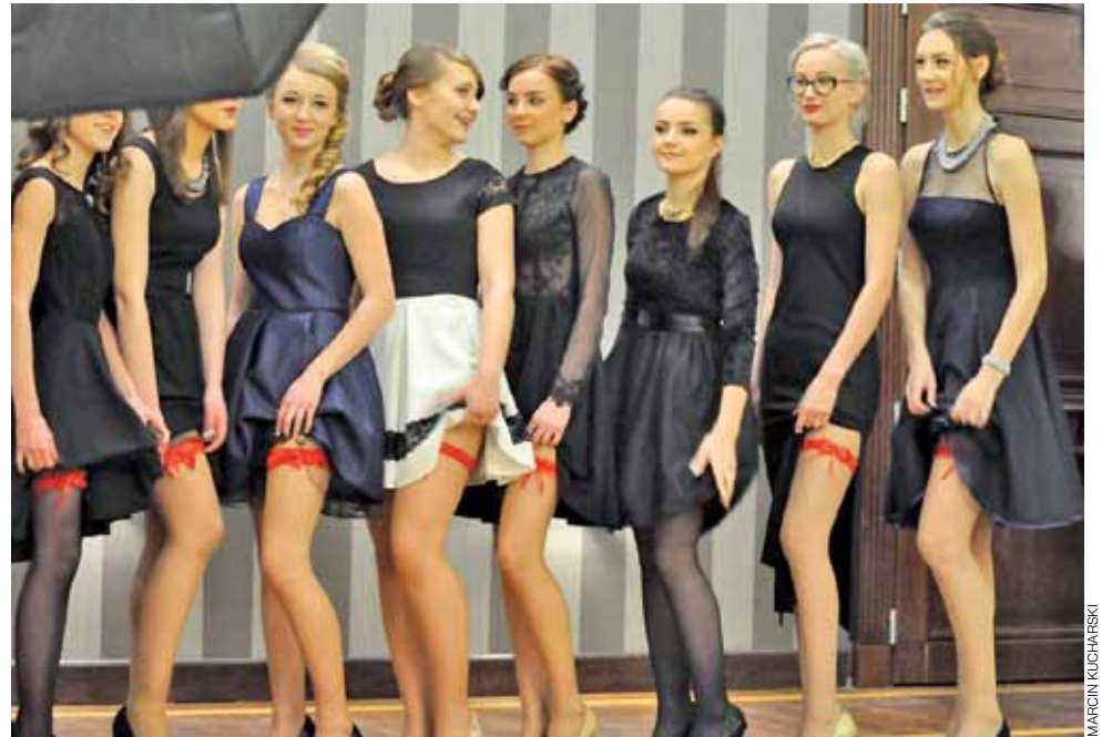
Dziewczyny z klasy III d w czasie sesji zdjęciowej towarzyszącej studniówce, prezentują czerwone podwiązki.