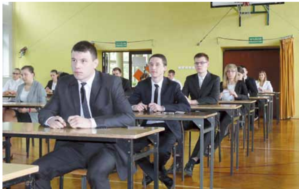
Szukając rozwiązania braku sali gimnastycznej szkoła adaptowała na ten cel aulę, gdzie uczniowie piszą egzamin maturalny. Sala jednak znajduje się na piętrze i korzystanie z niej w typowo sportowy sposób, jest bardzo kłopotliwe ze względu na hałas. Na zdjęciu aula ZSP nr 4 i maturzyści w 2015 roku.

budowę, mając względnie właśnie salę gimnastyczną. Dopiero w trakcie realizacji się to zmieniło i salę zagospodarowano na basen. Sala gimnastyczna w planach miała być połączona łącznikiem ze szkołą, po adaptacji basenu wystarczyłoby te plany zrealizować. ■