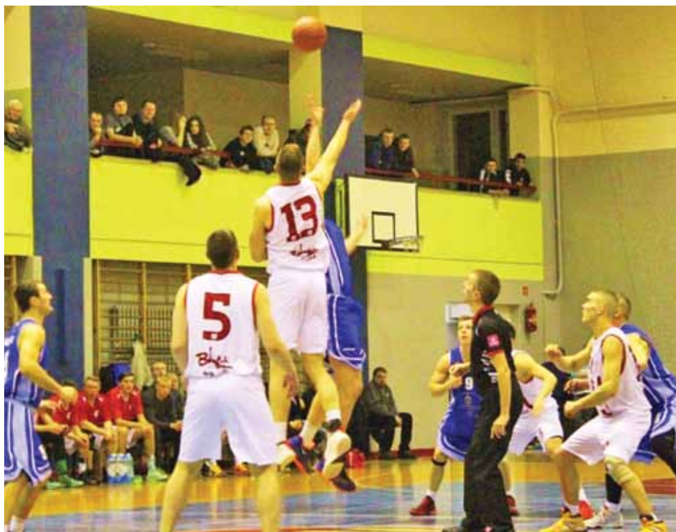
W Bielsku Podlaskim koszykarze Księżaka odnieśli 15. zwycięstwo w tym sezonie.

Po zmianie stron przewaga Księżaka nadal wzrastała. Łowiczanie wygrali trzecią odsłonę 20:13, a po 30 minutach walki wygrywali 61:41. Zaliczka 20 punktów dała Księżakom pełną kontrolę nad tym spotkaniem.