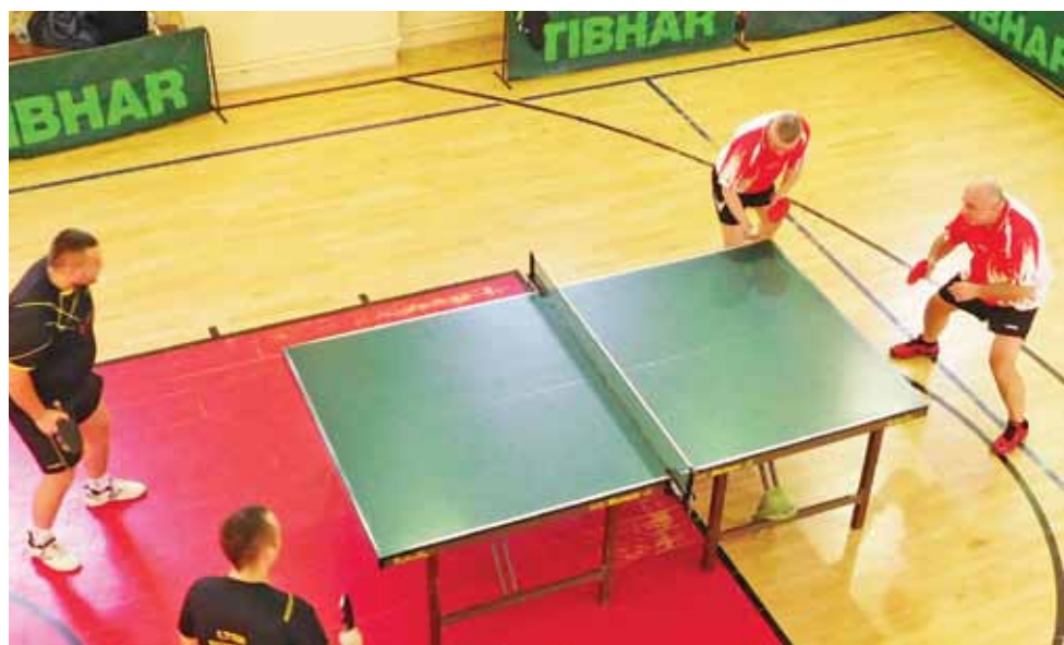
Drugoligowscy tenisści Księżaka gościli w sali ZSP nr 1 na ulicy Podrzecznej

Tenis stołowy | II liga tenisa stołowego