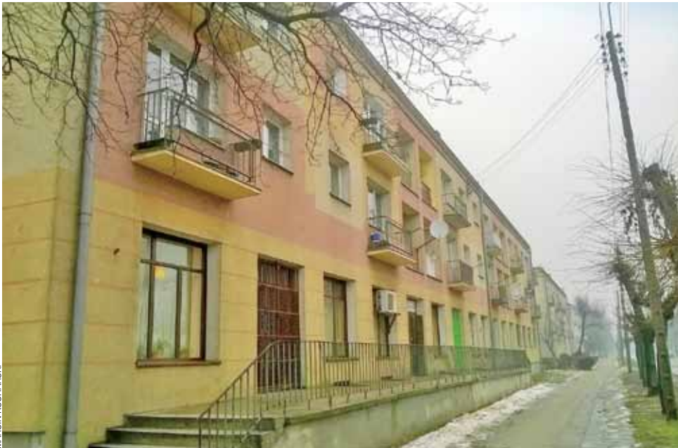
W tym roku elewacja bloku ma zostać myta oraz poprawiony będzie stan rampy i schodów.