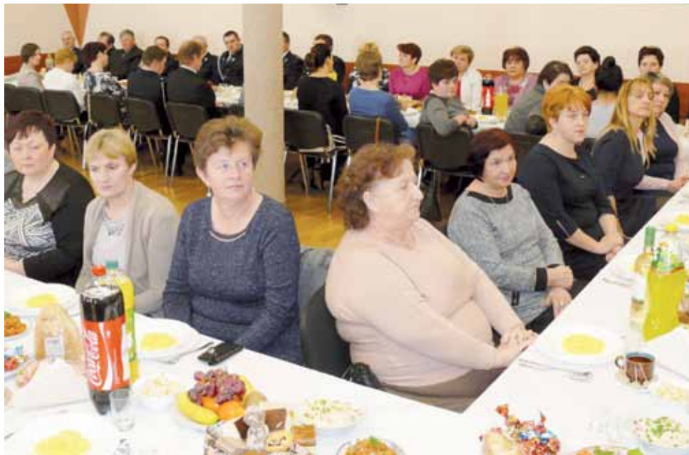
W noworocznym spotkaniu w bibliotece udział wzięło około 70 osób, głównie pań z KGW z terenu gminy Kocierzew Południowy.

Do Kocierzewa z całej gminy zjechały przedstawicielki wszystkich działających na jej terytorium 14 kół. Za stołami wraz z zaproszonymi gośćmi: przedstawicielkami OSP, przedstawicielkami organizacji z gmin: Chańsko, Zduny, Kiernozia, Nieborów i Bielawy, zasiadło prawie 70 osób. W spotkaniu udział wzięły także prze-