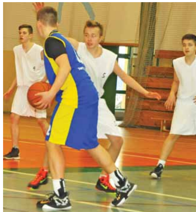
Kadeci Księżaka w każdym meczu walczą bardzo ambitnie.