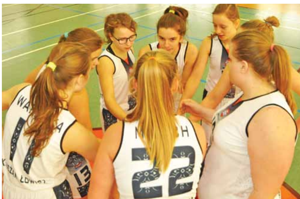
Łowiczanki wreszcie pokazały, że potrafią walczyć.

Nowy Łowiczanie Tygodnik Ziemi Łowickiej członek Stowarzyszenia Gazet Lokalnych