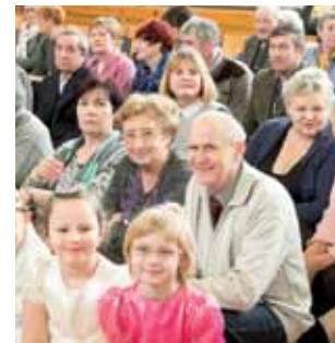
Na widowni zasiedli dziadkowie i babcie, w pierwszym rzędzie dzieci biorące udział w występach.

Po jasełkach przed gośćmi występowały dzieci z grup przedszkolnych, które zaśpiewały piosenki o babci i dziadku, następnie dzieci z „zerówek” tańczyły m.in. rock and roll’a. Uczniowie klas I-III recytowali wiersze i śpiewali piosenki, a także tańczyli. I A wykonała menueta, I B – trojaka,