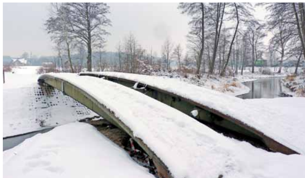
Most na Skierniewce w Arkadii na dniach doczeka się nowej nawierzchni i barierki, musi być jednak sucho i ciepło.

Przypomnijmy, że stara kładka, spinająca oba brzegi Skierniewki, została rozebrana jesienią ubiegłego roku. Zrobiło to Przedsiębiorstwo Rybackie w Łyszkowicach, które musiało mieć dostęp do brzegu rzeki w związku z prowadzonym umacnianiem skarp, które zalecono po wykonaniu modernizacji jazu położonego nieco w górę rzeki. Niestety stalowa konstrukcja kładki nie nadawała się do ponownego wykorzystania. Dlatego zastą-