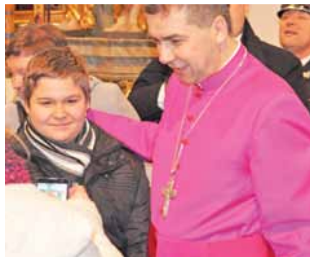
Zdjęcie z biskupem – to był tego dnia częsty widok.

W diecezji łowickiej od 2001 r. jest notariuszem kurii, referentem ds. katechetycznych i wizytatorem nauki religii. W latach 2001-2005 uczył religii w Klasycznym Liceum Ogólnokształcącym w Skierniewicach. Od 2005 r. jest członkiem Diecezjalnej Rady Duszpasterskiej Diecezji Łowickiej, a od 2013 r. cenzorem publikacji religijnych w tej diecezji.