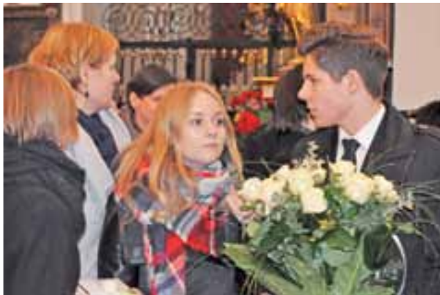
Zyczenia składali nowemu biskupowi ludzie w różnym wieku, nie brakowało delegacji szkolnych oraz innych młodych ludzi.