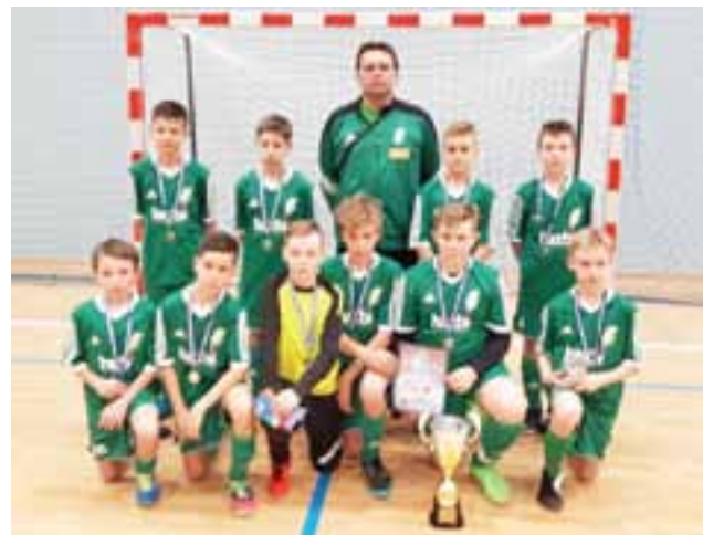
Pelikan 2004 walczył w turnieju halowym w Ciechocinku.

Łowiczanie wywalczyli zatem drugie miejsce w turnieju. Co ciekawe najlepszym graczem turnie-