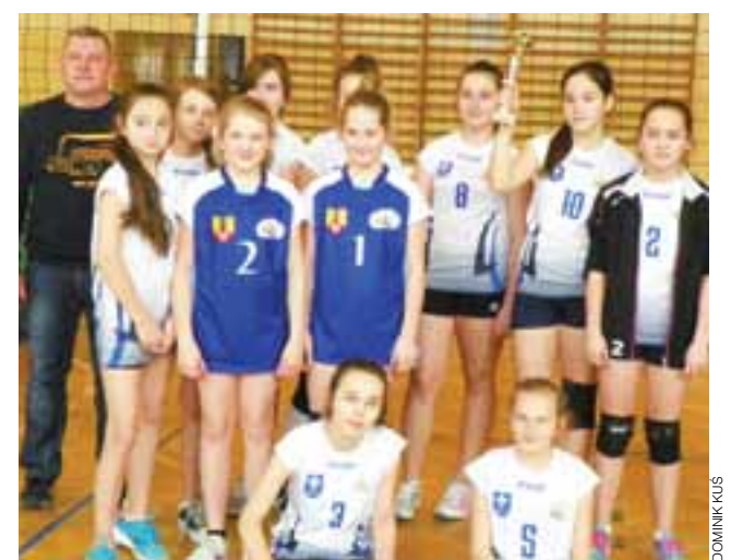
Mistrzynie powiatu łowickiego z SP Domaniewice.