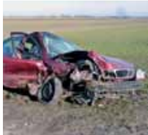
Lanosem podróżował 28-letni mieszkaniec gminy Kiernoza wraz z 7-letnim dzieckiem.

Policja wciąż wyjaśnia przyczyny i okoliczności tego wypadku. Wiadomo na pewno, że pojazd Peugeot 406 i Daewoo Lanos poruszały się w przeciwnych kie-