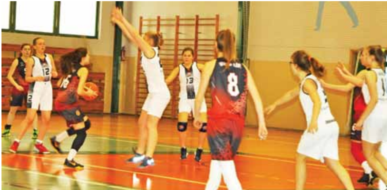
Tym razem łowiczanki zagrały słabe spotkanie.

Koszykówka | 15. kolejka wojewódzkiej ligi kadetek