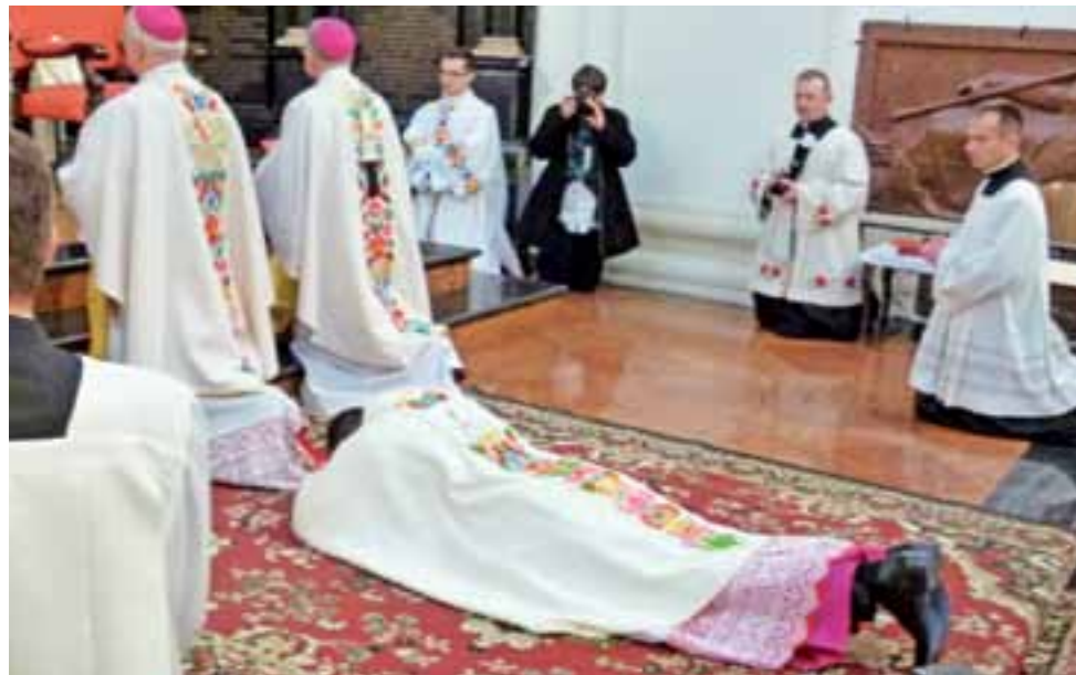
Na chwilę przed święceniami: elekt leży krzyżem, wierni zgromadzeni śpiewają litanię do Wszystkich Świętych.