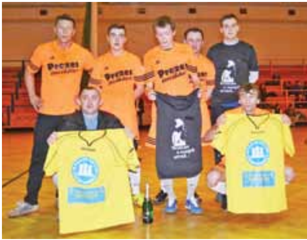
Chińska Stacja Paliw Haczykowsky Łowicz - mistrzem KIA Open I Ligi.