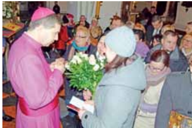
Chcących złożyć gratulacje było wielu, kolejka się nie zmniejszała...