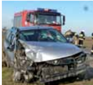
Peugeotem jechał 56-letni mieszkaniec gm. Sanniki. Maska została pokiereszowana.

runkach, a zderzenie miało charakter czołowy. 56-letni mieszkaniec gminy Sanniki podróżował Peugeotem w kierunku Łowicza, zaś w przeciwną stronę jechał 28-letni mieszkaniec gminy