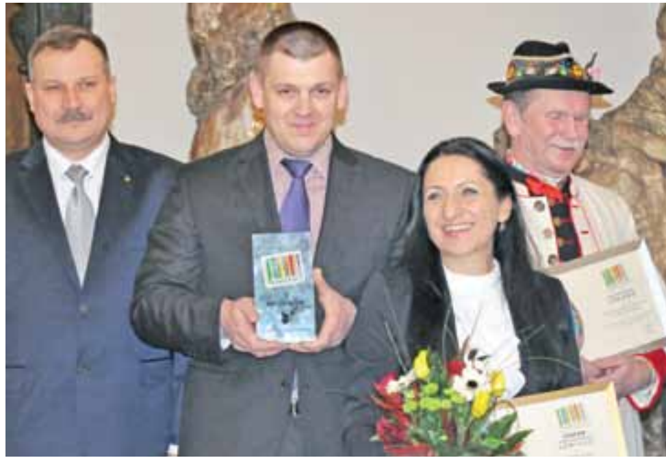
Agros Nova już wcześniej otrzymał Markę Regionalną Łowickie. Teraz więc przyszła kolej na Super Markę.

Powiat łowicki | Cztery marki i supermarka