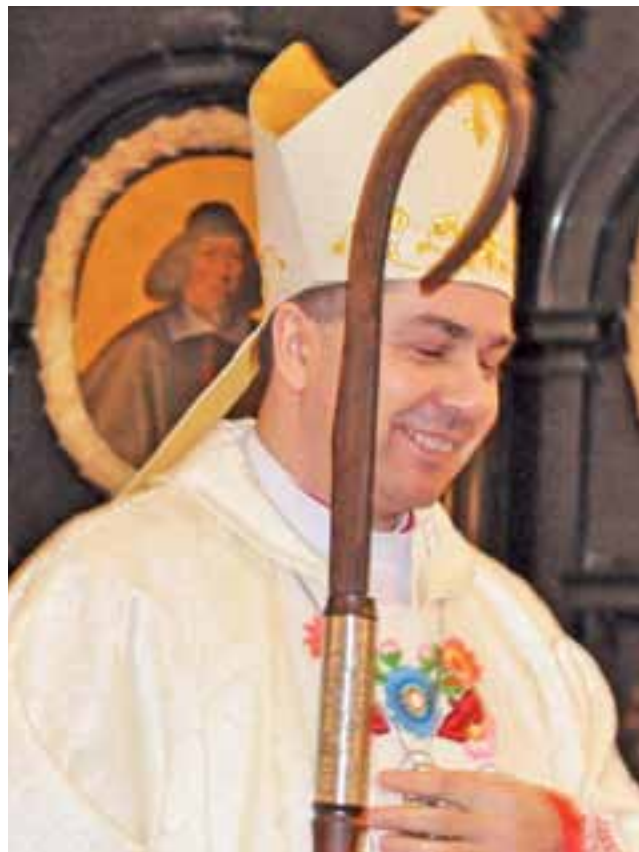
Biskup Osial już z nowym, prostym, ciemnym pastorałem – także symbolem pasterskiej władzy.

Nowy biskup udzielił Komunii Świętej najpierw swoim rodzicom, którzy siedzieli przez całą mszę naprzeciwko niego oraz wyszedł przed ołtarz udzielić komunii pozostałym członkom swojej rodziny. Po modlitwie, która nastąpiła po komunii świętej, nowy