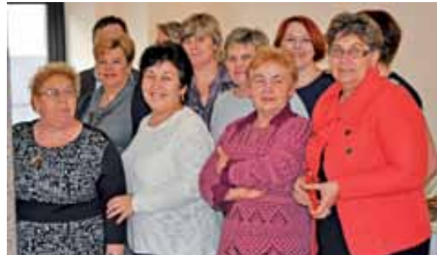
Gminny Dzień Kobiet przygotowały w tym roku panie z miejscowego Koła Gospodyń Wiejskich w Jamnie.

Wyremontowane pomieszczenia znajdują się na parterze miejscowej remizy OSP. Wyremontowana została nie tylko duża sala na parterze, w której będą mogły być np. urządzone przez mieszkańców