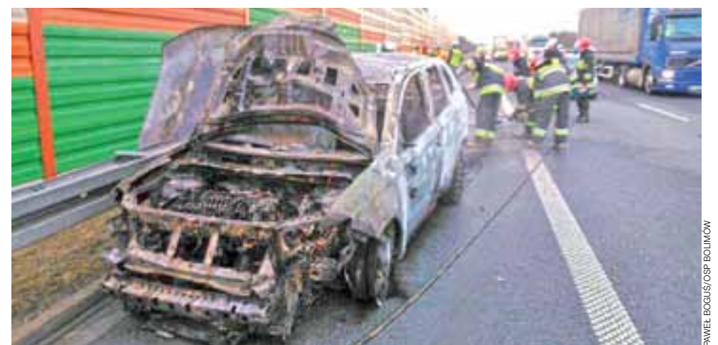
Mitsubishi Outlander spłonęło doszczętnie. Samochód wart był około 80 tys. zł.

Za rozboj grozi im kara do 12 lat pozbawienia wolności, z kolei za pobicie – w zależności od okoliczności – do 10 lat. aa