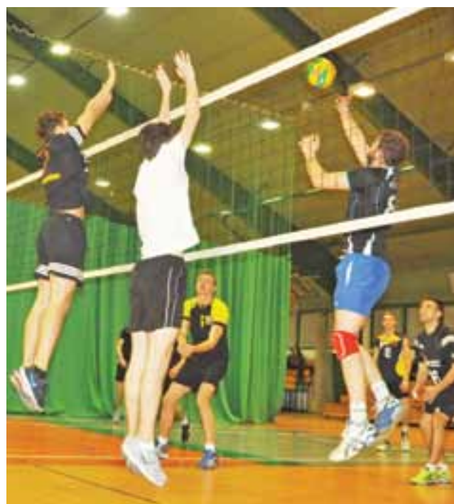
Wicelider UKS Korabka był lepszy w starciu z Chelmońskim.

Ostatnie ligowe mecze siatkarze rozegrają dopiero po feriach w piątek 4 marca 2016 roku o godzinie 17:30. W 10. kolejce XVII edycji SAM zagrają: OSP Seligów – UKS Korabka Łowicz (sektor A),