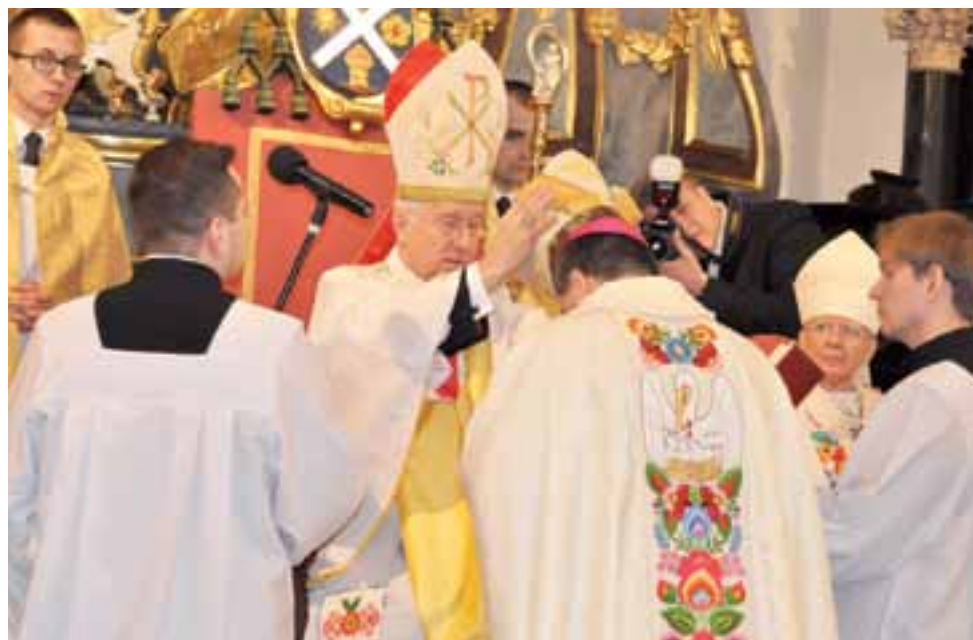
Biskup ordynariusz Andrzej Dziuba nakłada na głowę wyświęconego biskupa mitrę – znak władzy pasterskiej.