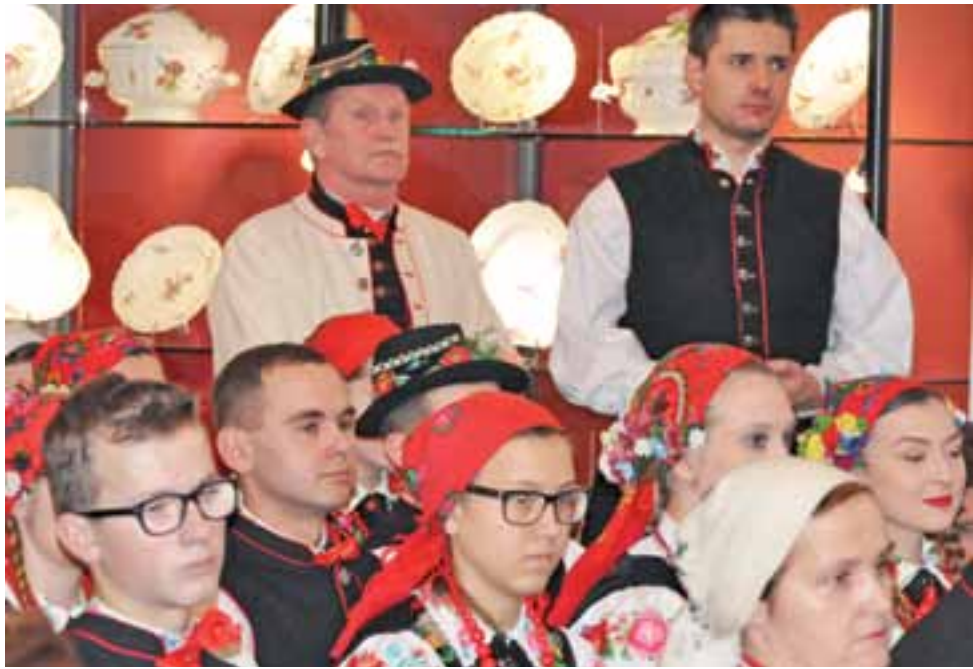
Zespół folklorystyczny Boczek Chelmońskie podczas gali wręczenia tytułów w Muzeum w Łowiczu.