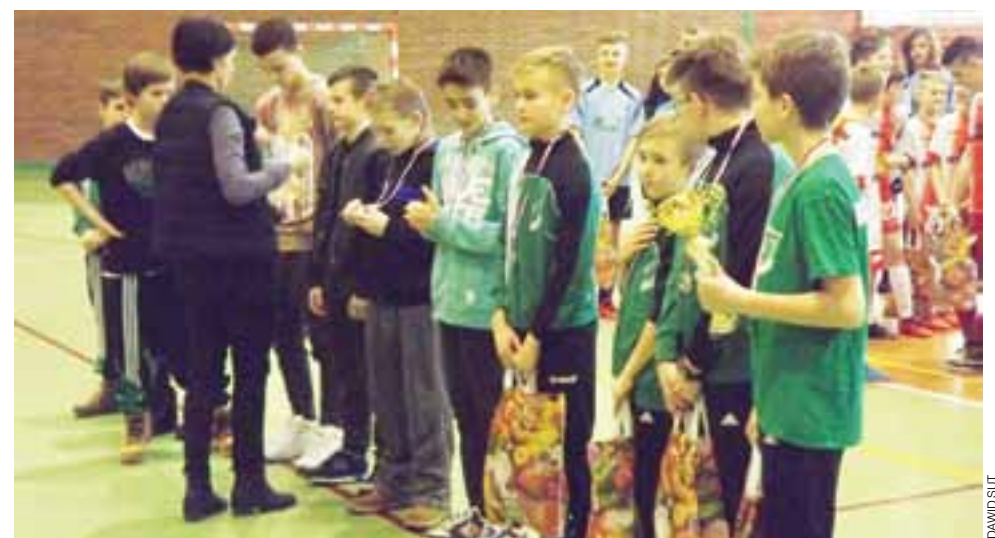
Pelikan 2003 zajął drugie miejsce w Iłowie.

– Bardzo dobrze zorganizowany turniej na bardzo ładnej hali. Każdy został upomniany medalem i otrzymaliśmy jeszcze nagrody od sponsorów. Poziom turniej nie był wielki, powinniśmy wygrać tę rywalizację. W finale straciliśmy gola, rywale później za