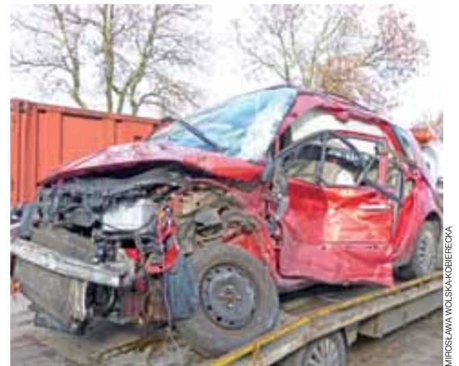
Tym Renault 21-letnia kobieta wyjeżdżała z posesji na ul. Poznańskiej, wymuszając pierwszeństwo na ciężarówce.

Ruch na drodze wojewódzkiej 584 jeszcze przez blisko dwie godziny odbywał się w sposób wahadłowy. Na miejscu działały dwa zastępy JRG z Łowicza, ochotnicy z Karsznicy Dużych, a także policja i służby medyczne. aa