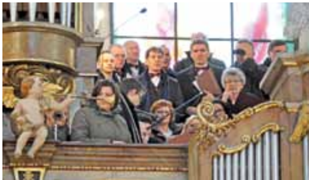
Na chórze – śpiewacy z Sochaczewa zajęli miejsca przy organie.