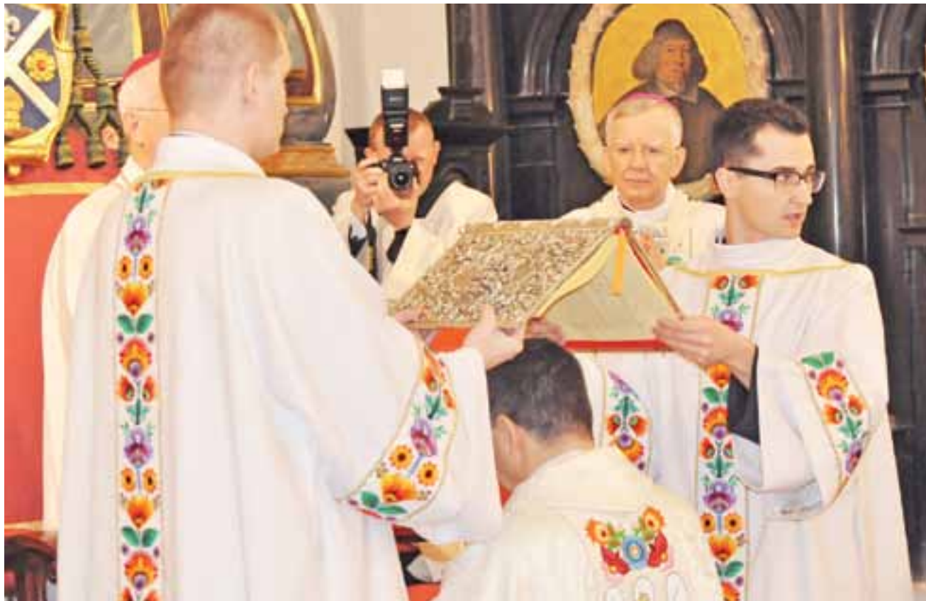
Księga Ewangelii jest trzymana nad głową biskupa nominata przez cały czas trwania modlitwy konsekracji.