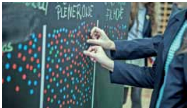
Kino plenerowe zwyciężyło w konsultacjach społecznych przeprowadzonych w łowickich liceach.

Pod koniec stycznia do „Fenixa” dotarło dość nietypowe narzędzie diagnozy – „Ucho Fenixa”. To wielki filmowy klaps wykorzystywany przez filmow-