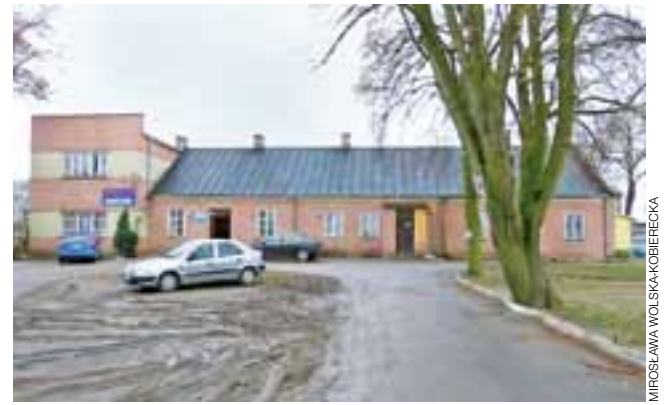
W ramach rewitalizacji centrum Zdun wyburzony będzie widoczny w tle parterowy budynek. Pomiędzy Urzędem Gminy a Domem Kultury powstaną parkingi, nowe ścieżki i zieleń.