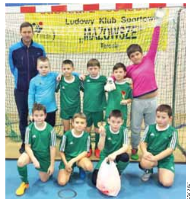
Młodzi gracze bardzo cieszyli się z wygranej w turnieju w Teresinie.