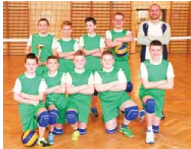
Mistrzowie powiatu w mini siatkówce z SP 7 Łowicz.

■ Wyniki rywalizacji: Grupa A: SP 1 Łowicz – SP Bednary 2:1 (25:13, 22:25, 15:7), SP Kocierzew – SP 1 Łowicz 2:1 (25:11, 16:25, 15:8), SP Bednary – SP Kocierzew 1:2 (25:13, 14:25, 11:15) Grupa B: SP 7 Łowicz – SP Bobrowniki 2:0 (25:11, 25:18), SP Bielawy – SP 7 Łowicz 0:2 (11:25, 8:25), SP Bobrowniki – SP Bielawy 2:0 (25:6, 25:7).