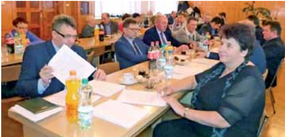
Przy omawianiu budżetu gminy Zduny na 2016 rok nie udało się utrzymać tak spokojnej atmosfery jaką widać na zdjęciu. Chwilami było nerwowo.

Wspomniana budowa hali sportowej dla Szkoły Podstawowej i Gimnazjum w Nowych Zdunach kosztować ma w tym roku 2.460.000 zł – jest to trzeci, ostatni rok tej budowy.