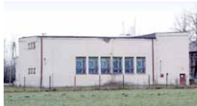
Dom Ludowy w Boczkach, w którym mieści się siedziba zespołu Boczki Chełmońskie ma być wyremontowany w 2017 roku.

ta. Ogólne koszty są przewidziane na 5 mln 126 tys. zł, gmina dołoży do niej ze swoich pieniędzy 1 mln 242 tys. zł. Resztę stanowić będzie subwencja oświatowa. Gmina złożyła w styczniu do Urzędu Marszałkowskiego w Łodzi w ramach RPO na lata 2014-2020 wniosek opiewający na ponad 420 tys. zł, w ramach którego przez najbliższe dwa lata w Gimnazjum w Kocierzewie Południowym odbywałyby się dokształcające zajęcia pozalekcyjne m.in. z matematyki, chemii i języka obcego, a także utworzono by pracownię fizykochemiczną i sieć informatyczną. Ponadto, uzyskując dofinansowanie, gmina miałaby możliwość zakupu tablicy interaktywnej i 25 laptopów do pracowni komputerowej, z której korzystają także uczniowie Szkoły Podstawowej. Udział gminy w kosztach to 7%.