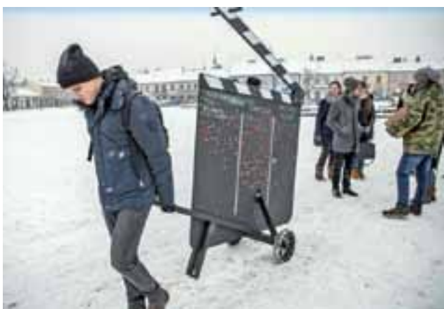
Ekipa projektowa i „Ucho Fenixa” wędrujące do szkół średnich.