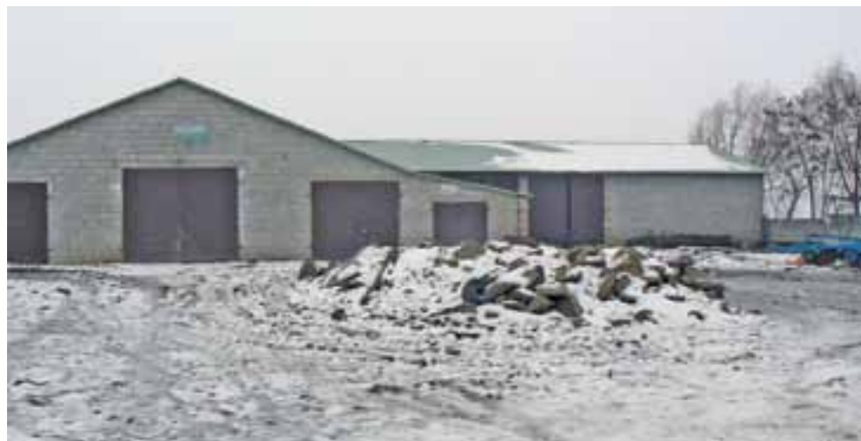
Inwestycja. Na budowę i wyposażenie tej obory poszły pieniądze z kredytów.

Później mundurowi założyli 64-latek sprawę o groźby karalne, pobicie i atak widłami. Kobieta twierdzi, że nic takiego nie miało miejsca. W procesie nie uczestniczyła osobiście, kilkakrotnie