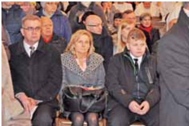
Najbliższa rodzina nowego biskupa zasiadła w pierwszych ławkach.