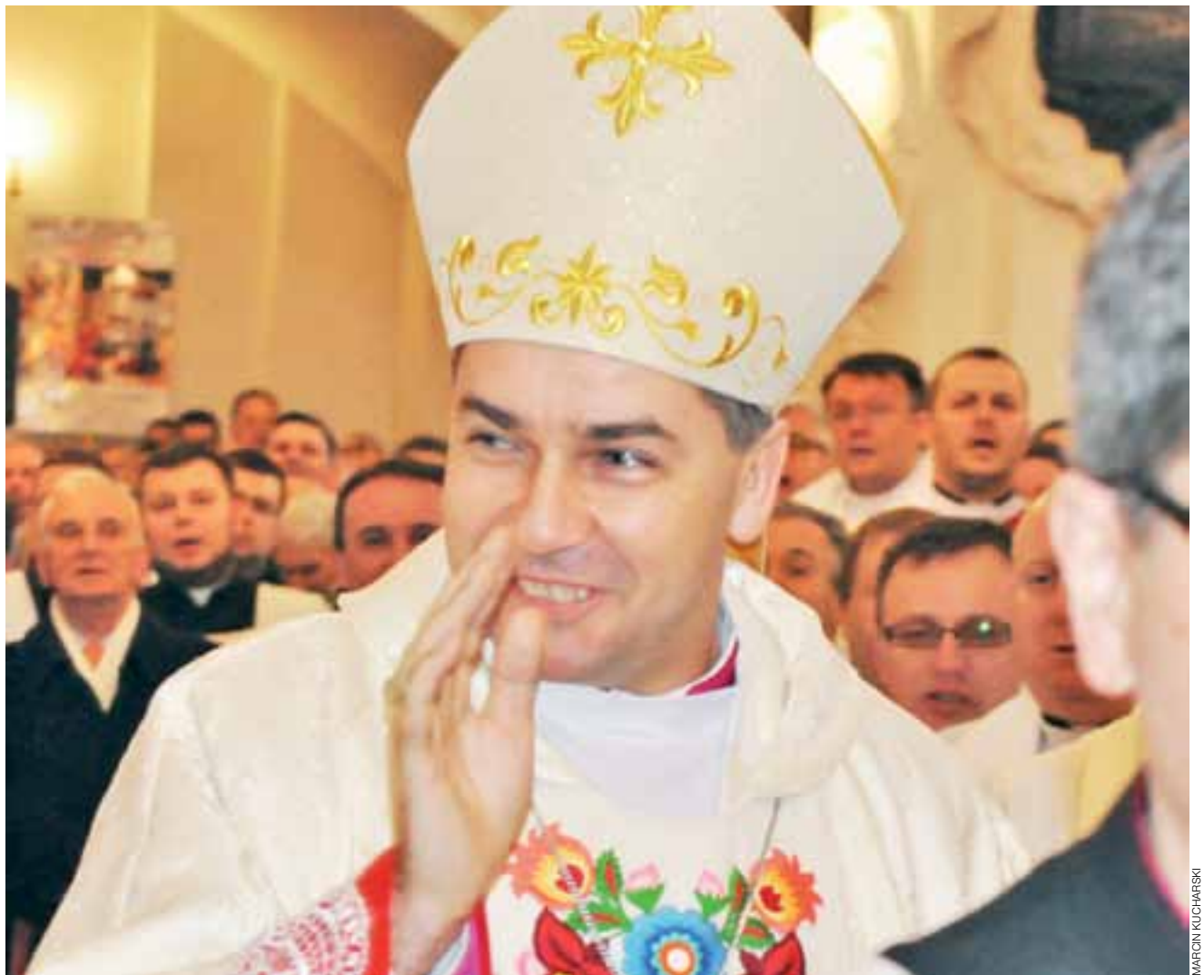
Już po ceremonii święceń. Nowy biskup przechodzi przez tłum wiernych, we wszystkich nawach katedry, i błogosławi ich.

pracując jednocześnie w kurii oraz naukowo.