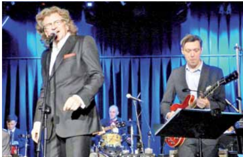
Zbigniew Wodecki z orkiestrą i chórem Mitch & Mitch czarował publiczność.

Zbigniew Wodecki, niczym sceniczny amant, brylował mię-