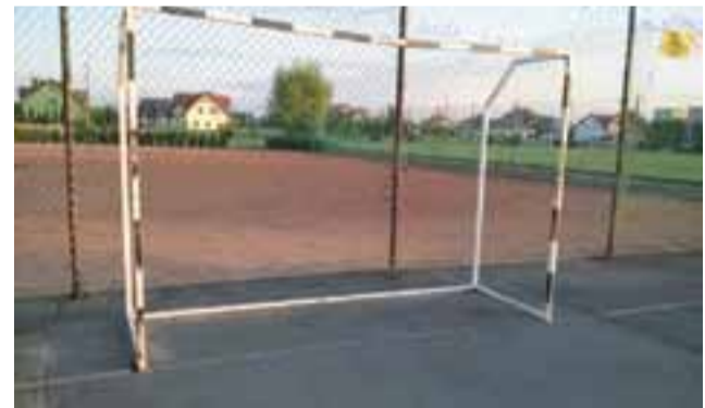
Stare bramki, stara nawierzchnia, ale boisko miało „swój klimat”.

Zużyty asfalt ma zastąpić nawierzchnia tartanowa, zamontowane zostaną nowe bramki oraz namalowane zostaną nowe linie na boisku: do gry w piłkę nożną, koszykówkę oraz do piłki siatkowej. – Nowością będzie też zastosowanie boiska do gry w siatkówkę – w części, w której nie ma koszy do koszykówki. Będzie możliwość zamontowania słupków do siatki, które będą na wyposażeniu szkoły – powiedział nam inicjator spotkania, radny z Bratkowic Krystian Cipiński. Boisko nie będzie powiększane.