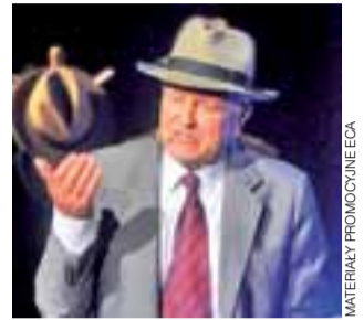
Jan Nowicki podczas festiwalu filmowego w Płocku.

Jana Nowickiego nie trzeba specjalnie przedstawiać. Jest aktorem teatralnym, filmowym i telewizyjnym, pedagogiem i również reżyserem. Zagrał m.in. szulera w filmie „Wielki Szu”, Ketlinga w „Panu Wołodyjowskim”. Młodsze pokolenie może go znać z filmów „Młode Wilki” czy komedii „E=mc²”. Towarzyszący Nowic-