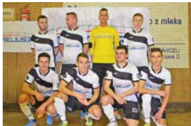
Toreliusz pokonał Alcatraz i wygrał II ligę