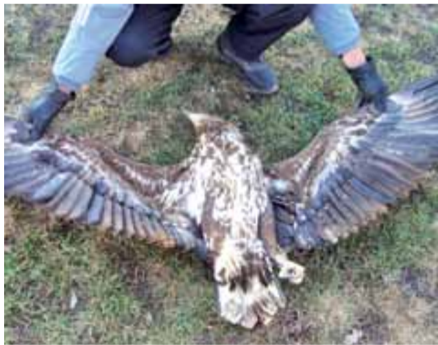
Martwy, młody bielik znaleziony w okolicach Walewic. Prawdopodobnie przyczyną jego śmierci był uraz, jakiego doznał na szyi.