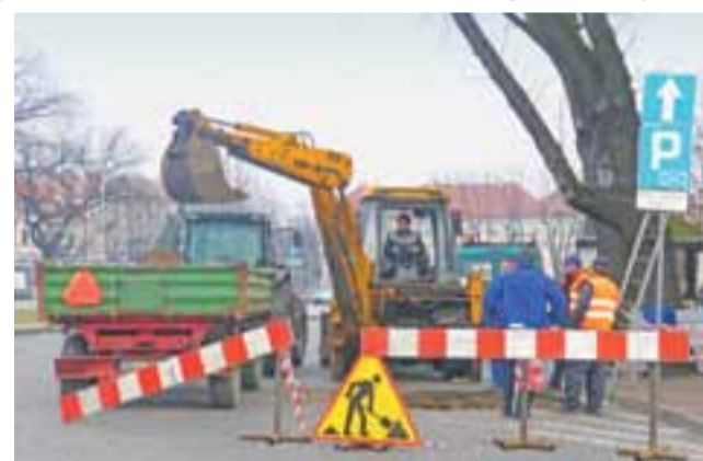
Pracownicy Zakładu Usług Komunalnych z Łowicza w ostatnich dniach wymienili zasuwę na sieci wodociągowej na Starym Rynku, oprócz tego jedną naprawili i zainstalowali jedną nową.

16 lutego dokonali wymiany zasuwę na magistrali wodociągowej o średnicy 200 mm, na skrzyżowaniu Starego Rynku z ulicami Pijarską i Zduńską. Prace spowodowały odcięcie zasilania w wodę na ponad godzinę kamienic południowej pierzei Starego Rynku oraz ulicy 11 Listopada. W piątek, 12 lutego, w sąsiedztwie tego miejsca dokonali naprawy uszkodzonej zasuwę wodociągowej. Zaś kilka dni wcześniej, w okolicy połączenia ul. Podrzecznej i Starego Rynku, zamontowali nową zasuwę w miejscu, w którym dotąd jej nie było.