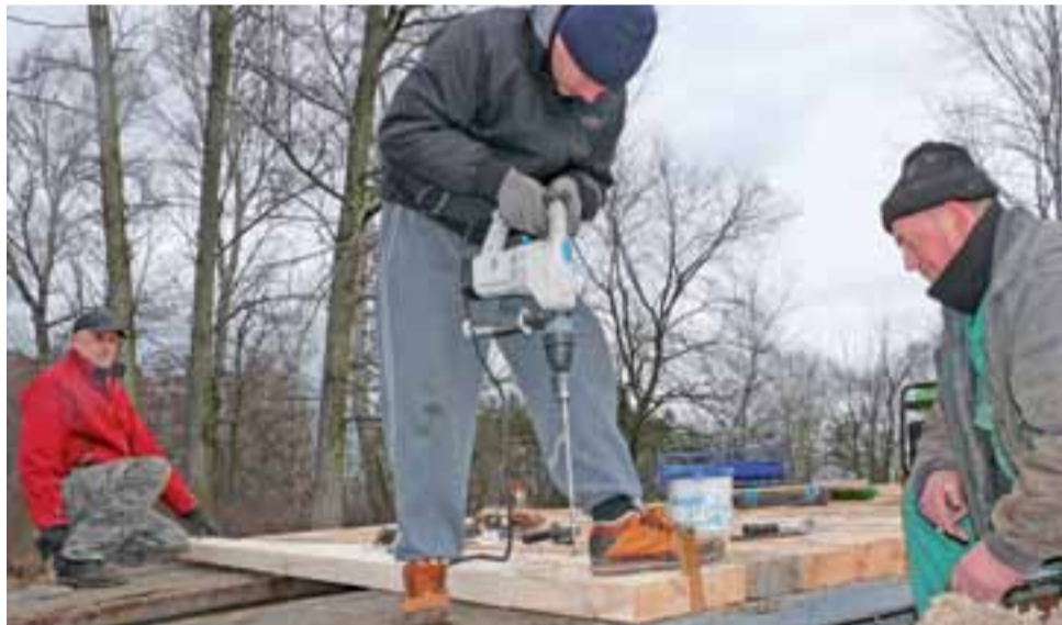
Pracownicy Przedsiębiorstwa Rybackiego w Łyszkowicach musieli we wtorek, 16 lutego, w miejsce skradzionych podkładów przykręcić nowe.

Stary most został rozebrany w ubiegłym roku, gdy w czasie umacniania skarp rzeki okazało się, że nie nadaje się on już do użyt-