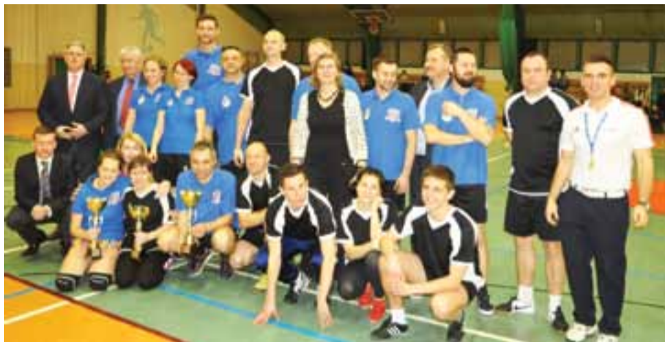
W piątkowym meczu wszyscy byli wygranymi.