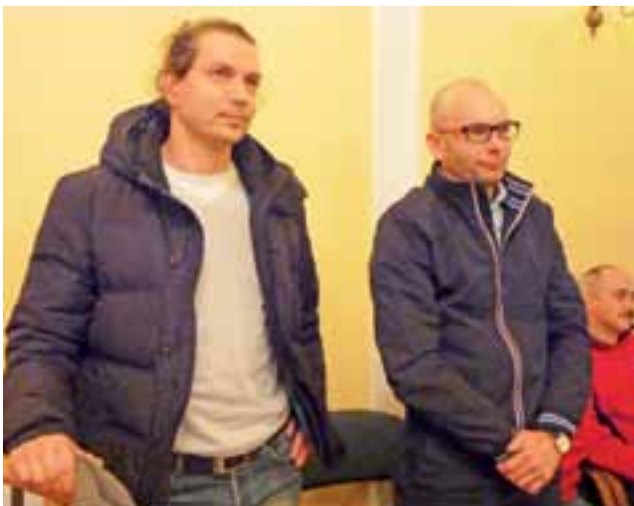
Łowicka Akademia Sportu... – i inni.