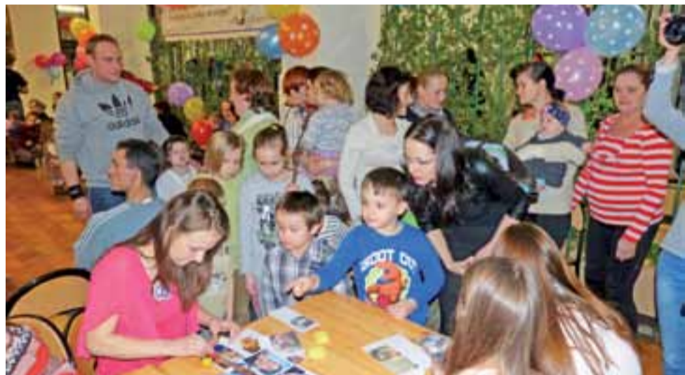
Młodzież malowała dzieciom bawiącym się na choince buzie. Wzór można było sobie wybrać spośród zdjęć wydrukowanych na kartkach papieru.

Jak nas zapewniali uczniowie, z którymi mieliśmy okazję zamienić kilka zdań, po takich zajęciach na pewno można dać sobie radę z samodzielnym wykonaniem pięknego tortu w domu.