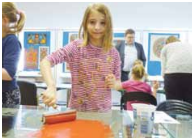
Trochę siły i dynamicznych ruchów potrzeba, by rozprowadzić farbę na wałku.

Łowicz | Warsztaty walentynkowe w muzeum