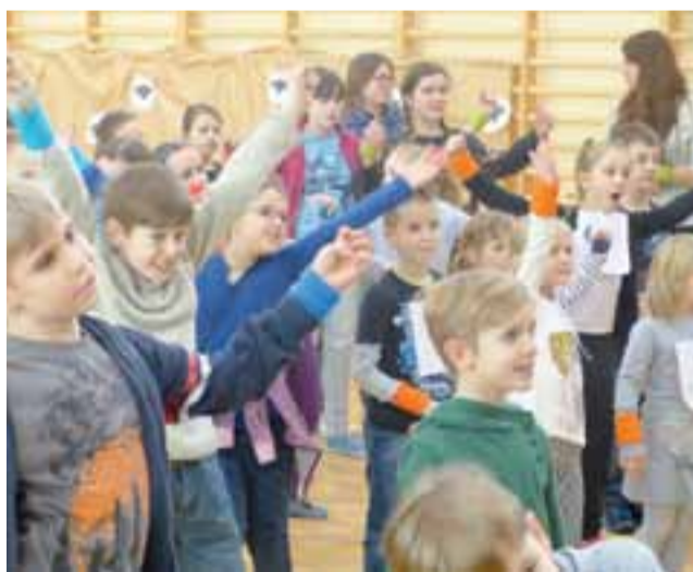
Zabawa integracyjna pierwszego dnia półkolonii w szkołach pijarskich.

– Jest dobrze, fajnie, w planie dużo zajęć i wycieczek, a najważniejsze – jest dobra atmosfera!