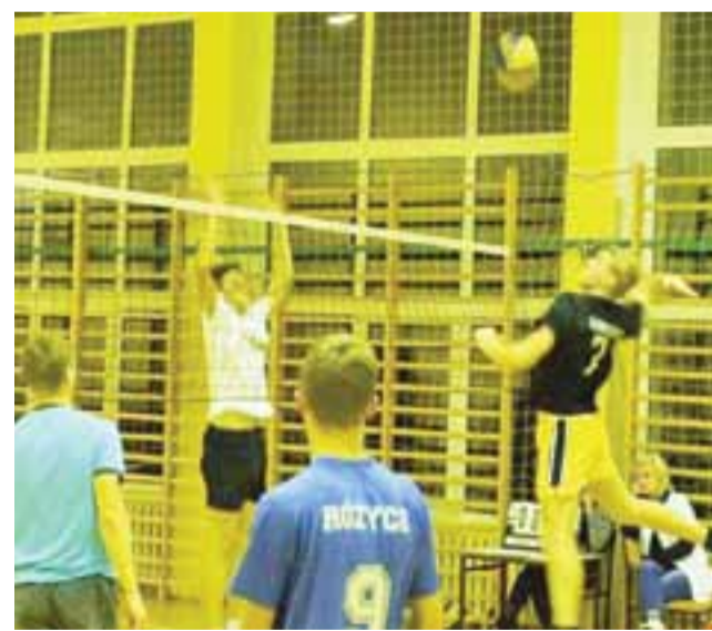
Siatkarze w Kocierzewie zakończyli już rozgrywki.

Korona Wejście – Mocno Rozgrzani 0:2 (14:25, 8:25)