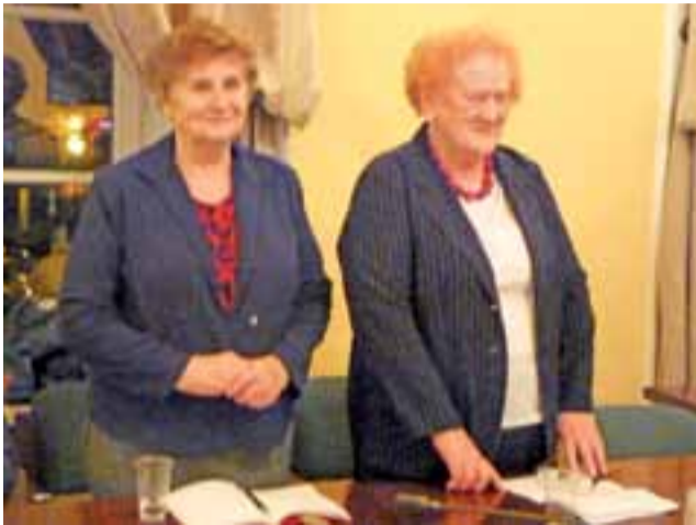
Na spotkanie przyszli: seniorzy...