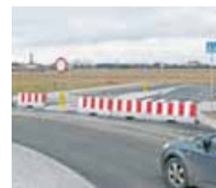
Rondo Niepodległości w Łowiczu, gotowy już zjazd w ul. Dmowskiego, w stronę wiaduktu.

bo do 30 maja 2017 roku pełną dokumentację budowy pozostałych dróg, zlecenie to podzielono na dwa oddzielne etapy. Pierwszy z nich dotyczy zaprojektowania nowego przebiegu ul. Bolimowskiej, która ma łączyć się z ul. Warszawską pomiędzy skrzyżowaniem z ul. Gdańską a dawnym budynkiem Mazowieckiej Wyższej Szkoły Humanistyczno-Pedagogicznej. W miejscu tego skrzyżowania powstanie rondo. Realizacja tej inwestycji jest brana pod uwagę w roku 2018. Miasto nie wyklu-