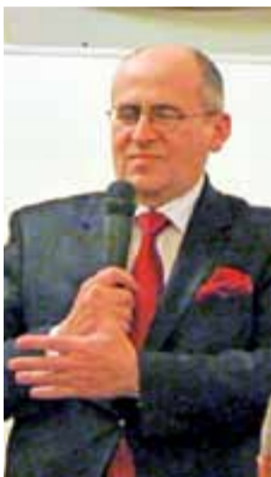
Wojewoda Zbigniew Rau...

i mieszkańców, w porozumieniu z władzą. Ta współpraca jest bardzo widoczna – mówiła.