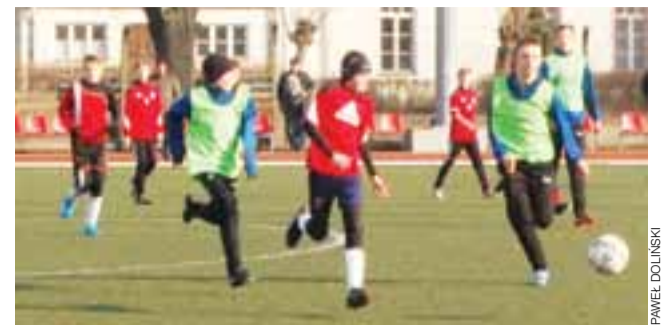
Pelikan 2002 zremisował z Unią 2001 3:3