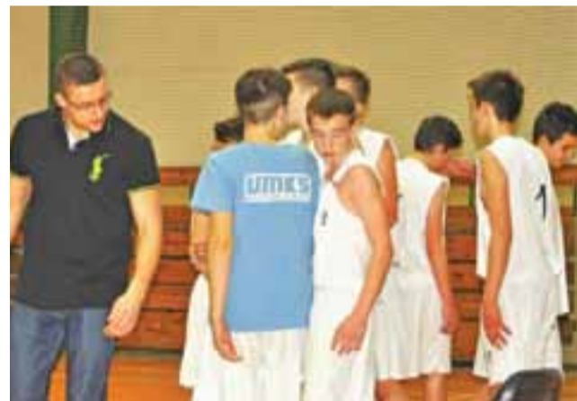
Kadeci Księżaka zaczęli finały od porażki

Pierwsza kwarta spotkania była w miarę wyrównana, ale wygrali ją miejscowi 14:12. Księżacy dobrze spisali się w drugiej odsłonie i po 20 minutach prowadzili 40:34. Dobry wynik udało się utrzymać po trzeciej kwarcie, ale w ostatniej części meczu zespół ze