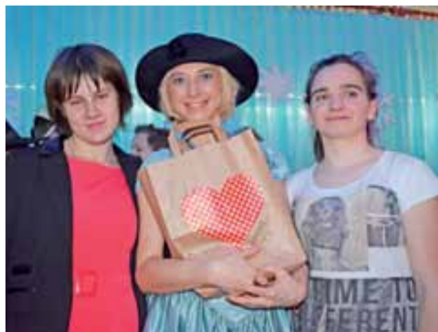
Przekazanie słodyczy z Zakładu Karnego w Łowiczu dla uczestników jasełek bożonarodzeniowych.