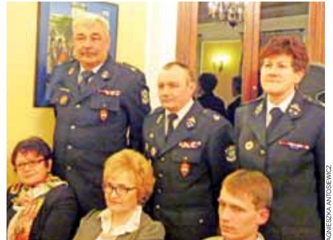
strażacy – ochotnicy...

Łowicz | Wojewoda łódzki spotkał się ze stowarzyszeniami z Łowicza