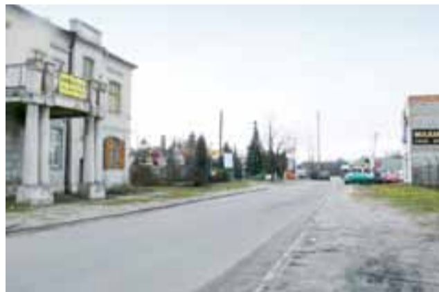
Ulica Napoleońska, przy wjeździe z ul. Klickiego. W przyszłości będzie prowadzić pod wiaduktem, a wzdłuż torów, do ul. 3 Maja.

Pełna dokumentacja, obejmująca budowę ulicy Dmowskiego z rondem w ul. 1 Maja, zgodnie ze specyfikacją przetargową ma być gotowa we wrześniu tego roku, a kosztorys dwa miesiące później. Dokumentacja z pozwoleniem na budowę ma umożliwić miastu wystąpienie o środki zewnętrzne na realizację inwestycji. Najbardziej prawdopodobnym źródłem finansowania jest Narodowy Program Przebudowy Dróg Lokalnych, z którego miasto mogłoby otrzymać pieniądze nie przekraczające 50% wartości inwestycji. Koszt wyniesie około 6 mln. zł. Zakres prac, które projektująca firma będzie musiała