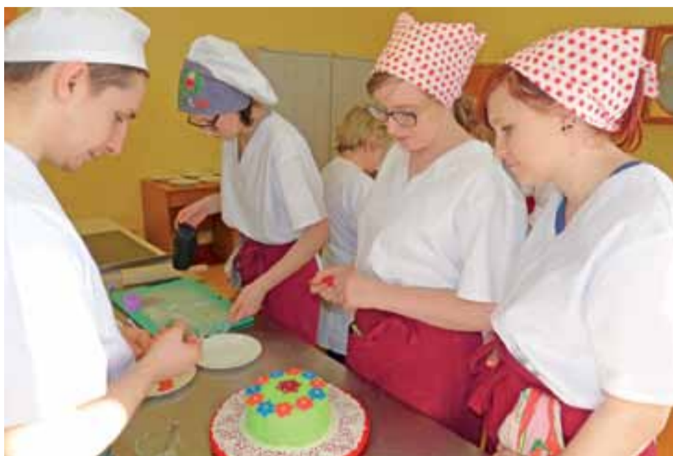
Na angielskich tortach, pokrytych masą cukrową, pojawiły się różne zdobienia walentynkowe, lub – jak te widoczne na zdjęciu – wiosenne.

W czasie kilkugodzinnych warsztatów w szkole przy ul. Powstańców postanowiła nauczyć młodszych kolegów tworzenia i zdobienia trzech rodzajów tortów. Biskopki do tortów zostały w szkole upieczone dzień wcześniej. Na ostatecznych zajęciach