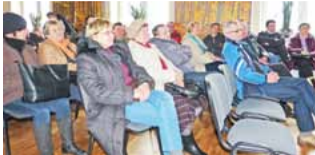
Pierwsze ze spotkań, które rozpoczęło się o godz. 10.00, zgromadziło liczną grupę mieszkańców, z których część była żywo zainteresowana tematem paneli fotowoltaicznych i solarów.

Panele fotowoltaiczne też montuje się po stronie południowej. Poza panelami instalacja składa się z inwertora, który z prądu stałego wytwarza prąd przemienny. Wymaga to licznika dwukierunkowego, który mierzy prąd wpływający