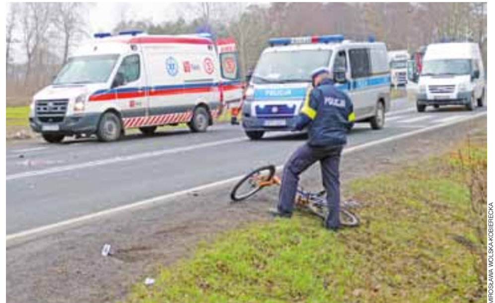
Na miejsce wypadku przyjechała policja, straż i tradycyjna karetka pogotowia. Ranny 13-latek przetransportowany został jednak do Łodzi śmigłowcem LPR.

Wątek ten przewija się też w komentarzach internetowych, choć nie wszyscy internauci uważają, że przyczyną wypadków jest w tym miejscu nadmierna prędkość. Niektórzy wyłączną winą obarczają nieostrożnych rowerzystów. mwk