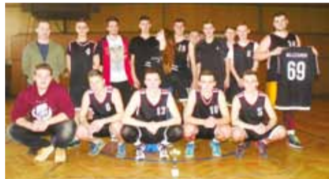
Koszykarze Ekonomika wygrali mistrzostwa powiatu łowickiego.

W meczu finałowym koszykarze Zespołu Szkół Ponadgimnazjalnych nr 4 pokonali ekipę „Medyka” 36:14. Zespół z II LO ostatnio rządził w szkolnych rozgrywkach i zdobywał mistrzowskie tytuły, ale w tym rok „maj-