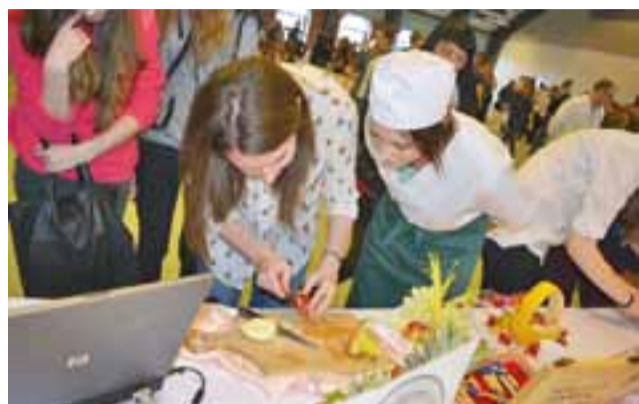
Carving staje się jedną ze specjalności uczniów ZSP nr 3.