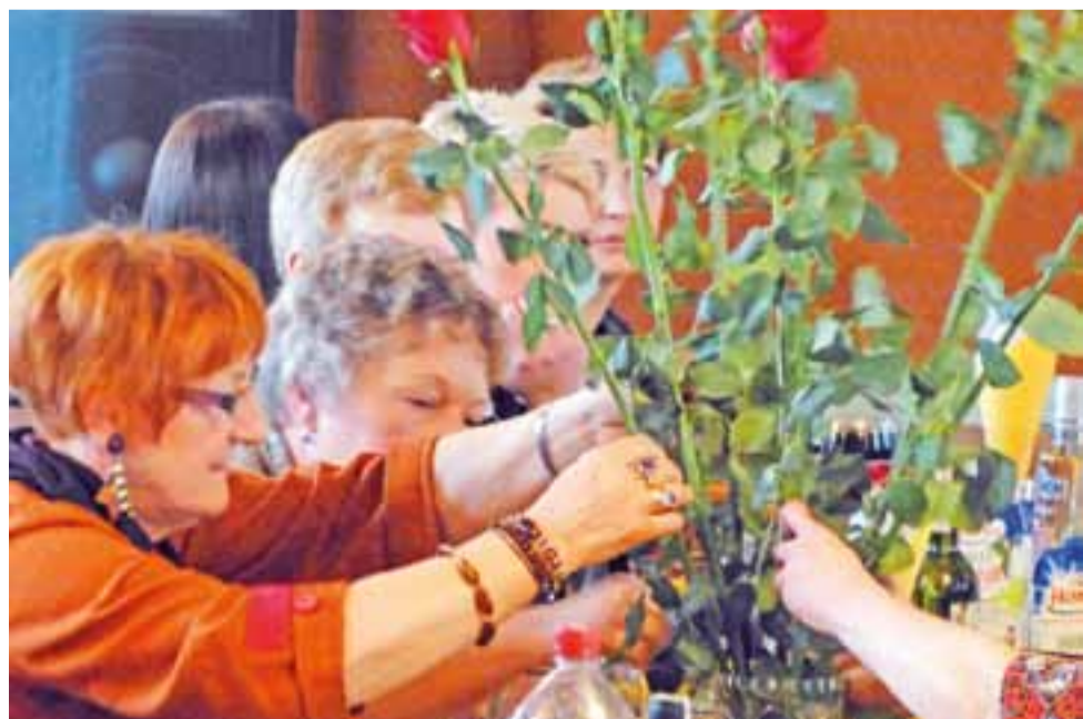
Za nami Dzień Kobiet. Mamy nadzieję, że żadna pani nie została w tym roku pominięta i otrzymała życzenia oraz kwiatek. Na zdjęciu – róże, które otrzymały kobiety na obchodach ich święta w Chaśnie Drugim. Więcej o tej i o podobnych uroczystościach w innych gminach przeczytasz na stronach 24 i 25. tm

RZUT OKIEM | MOC ŻYCZEŃ, KWIATÓW I DOBREJ ZABAWY