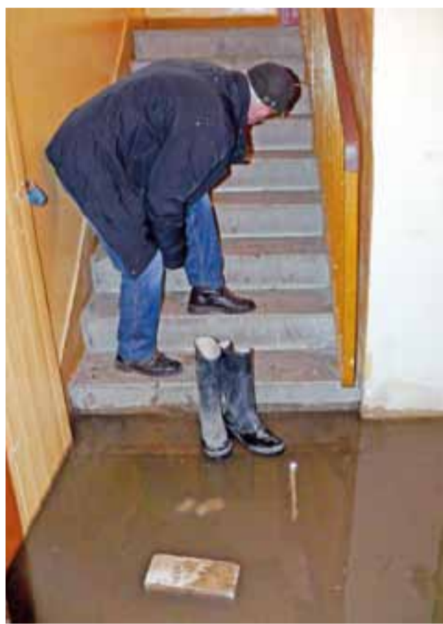
Zalana piwnica w bloku nr 5 na osiedlu Starzyńskiego. Ostatnio wejść do niej można było jedynie w gumowcach i z zatkanym nosem.

– Co parę tygodni ponawiamy pisma w tej sprawie, nawet kilka dni temu pisaliśmy, niestety nie przynosi to rezultatu – mówi i dodaje, że wie, iż rozwiązanie