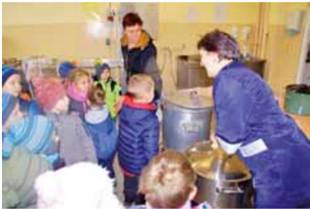
PRZEDSZKOLE W KIERNOZI

w poniedziałek, 7 marca, szkolną kuchnię i stołówkę. Panie kucharki oprowadziły dzieci po kuchni. Omówiły przeznaczenie sprzętów, których używa się podczas gotowania i przyrządzania posiłków. Gdy dzieci wróciły do przedszkola, chwaliły się, że jako pierwsze wiedziały, co będzie na obiad. mak