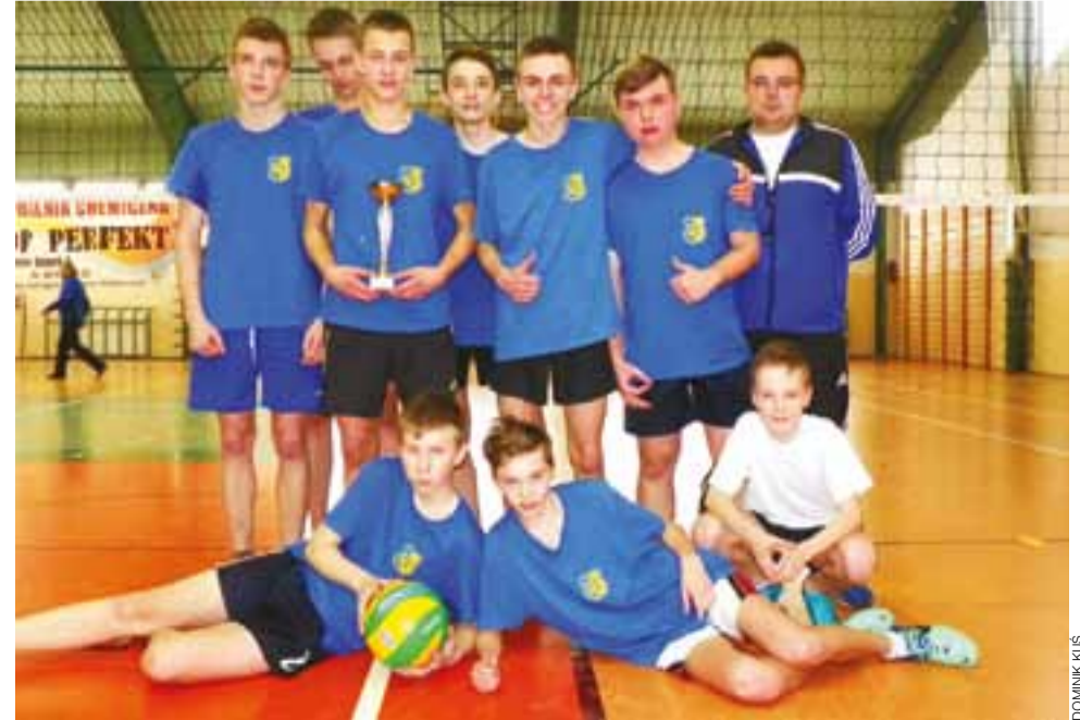
Mistrzowie powiatu łowickiego z Gimnazjum w Łaguszewie.