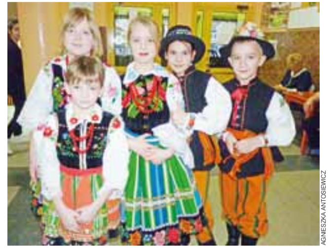
Gości witali członkowie zespołu folklorystycznego „Tęcza”.

W trakcie zwiedzania była możliwość obejrzenia pracowni ekologicznej i zabawy w świetlicy. Dzień Otwarty został połączony z zapisami do klasy pierwszej. Około połowa rodziców dzieci uczestniczą-