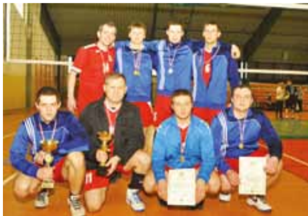
LKS Retki poza tytułem Mistrza Siatkarskich Amatorskich Mistrzostw Łowicza, zdobyły też Puchar Ligi.