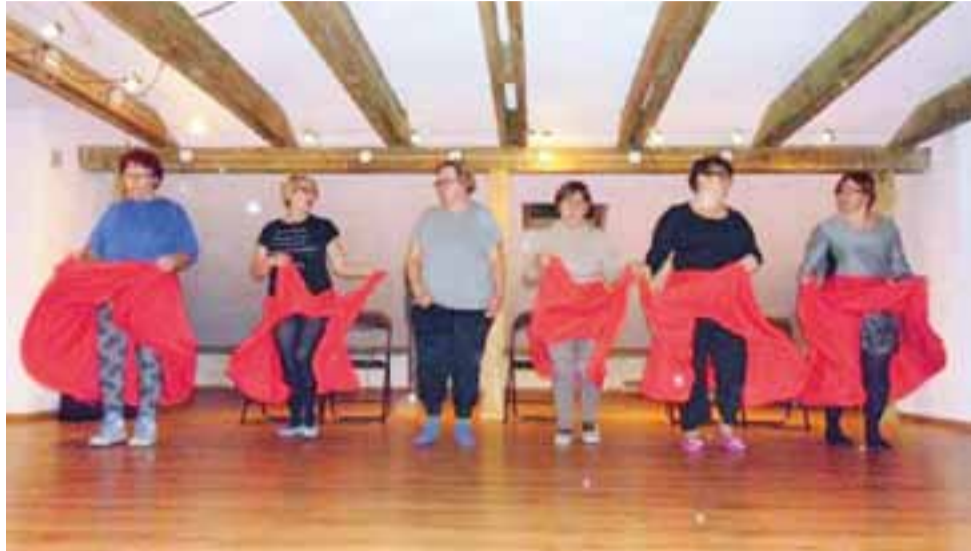
Tak wyglądały próby do spektaklu „Wirujący Senior” Grupy Teatralnej Ale Babki.

Ze swoim projektem zatytułowanym „Małe guziki – wielka historia” wystartuje również Muzeum Guzików. Projekt zakłada zmianę i rozszerzenie stałej ekspozycji zbiorów oraz prezentację m.in. guzików należących do