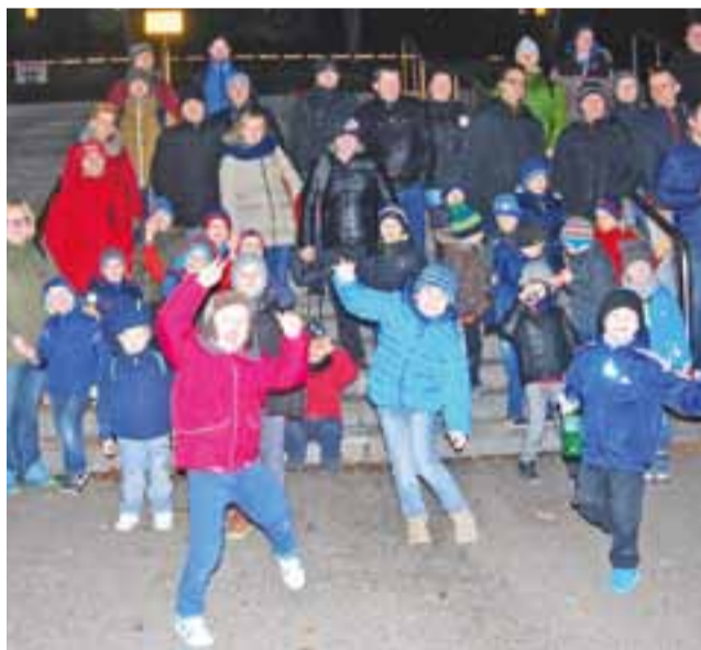
Przedшкоlaki z Łowicza po turnieju zwiedzili Stadion Narodowy.

Orzeł: Jędrzejewski (60 Przybylski) – Domińczak, Pomianowski, Perzyna (60 Kołaczyński), Plichota – Kruk (60 Kosiorek), Świdrowski (60 Zagawa), Sut (46 Nasalski), Riabczuk, Trakul (50 Kuciński) – Siatkowski.