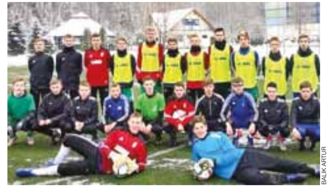
Zespół Pelikana 2000 już prawie gotowy do wiosny.