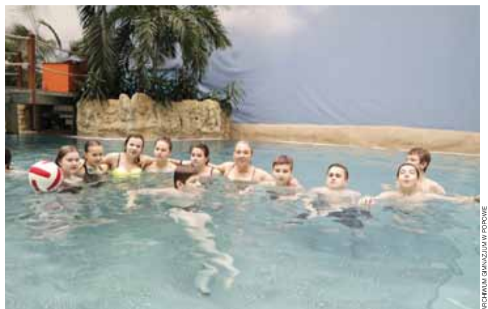
Tak wypoczywali uczniowie Gimnazjum w Popowie i Gimnazjum nr 3 w Łowiczu podczas pobytu na „Tropical Island”.

Na początku miesiąca, przez dwa dni, a dokładniej 2 i 3 marca, 46-osobowa grupa uczniów z zaprzyjaźnionych gimnazjów wypoczywała w parku „Tropical Island”. Nocowali w tipi rozstawionych na polu namiotowym na terenie parku. Dzień rozpoczęli od pełnowartościowego śniadania w jednej z restauracji, która oferowała klasyczne dania kuchni niemieckiej. W trakcie pobytu korzystali z różnych atrakcji wodnych, a przede wszystkim ze zjeżdżalni. Podziwiali piękne drzewa palmowe, tropikalną roślinność, ptaki, ale też zabytki i oryginalną zabudowę nawiązującą do klimatów rejonu Bali, Borneo i Tajlandii. W 32 stopniowej Lagunie Bali ko-