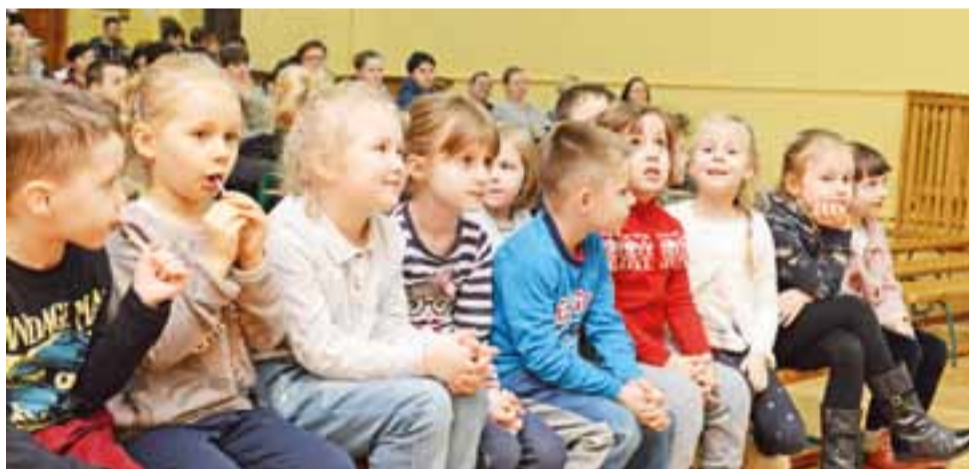
Przyszli uczniowie „Jedyńki”. Jak widać, nie będzie ich wielu.