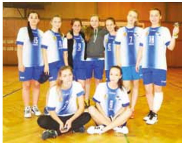
Dziewczyny z II LO Łowicz były najlepsze w powiecie łowickim w zawodach w koszykówkę.