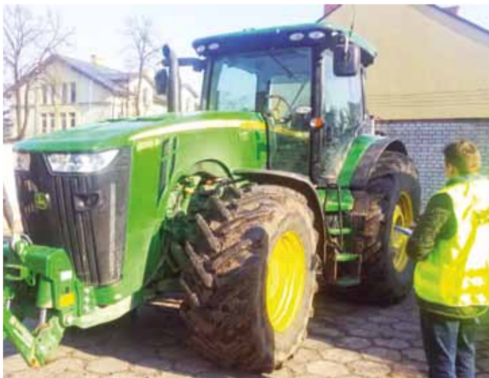
Na naszym terenie nie spotkamy ciągnika takich gabarytów jak ten skradziony na Dolnym Śląsku John Deere o mocy 360 KM.

Tego samego dnia, około godz. 21.30, po uzyskaniu informacji, że ciągnik może znajdować się na terenie powiatu łowickiego, dyżurny z Łowicza skierował dostępne patrole z wydziału kryminalnego, prewencji oraz drogówki – najpierw w rejon gminy Bielawy, a następnie – gminy