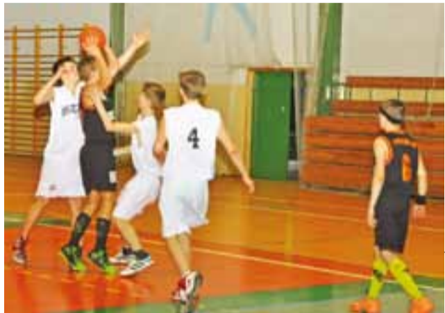
Młodzicy Księżaka nada pozostają bez porażki w lidze.

najlepiej radzi sobie zespół ŁKS Szkoła Gortata I Łódź, który nadal prowadzi z kompletem zwycięstw. zł