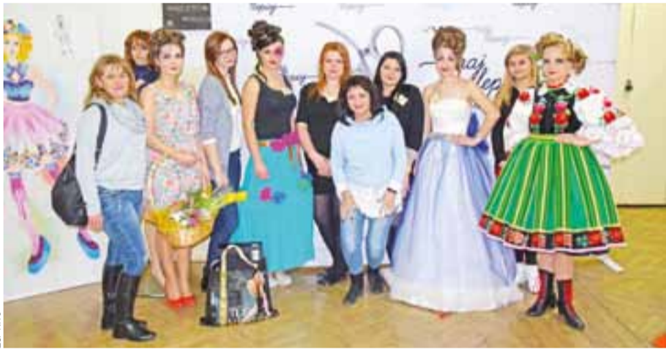
Uczennice ZSP nr 3 w finałowych kreacjach oraz twórcynie tych kreacji.

Wyniki konkursu zostaną ogłoszone podczas gali finałowej 9 kwietnia. tm