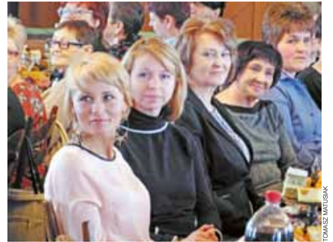
Na uroczystości w Chaśnie Drugim dotarły też m.in. reprezentantki KGW Gminy Łyszkowice.

Po okolicznościowych przemówieniach i życzeniach przyszedł czas na część artystyczną. Zrobiło się bardzo nowocześnie, kiedy na scenę wyszła grupa pań z gmin-