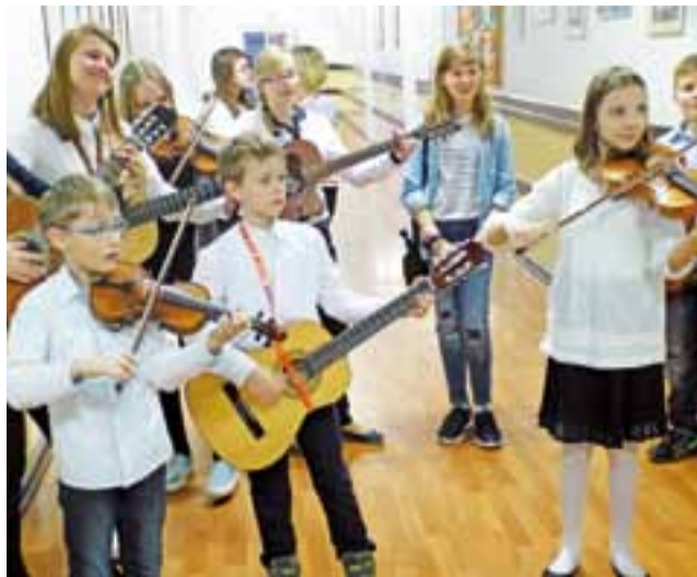
Młodzi muzycy z „Siódmki” umilali gościom „podróż pociągiem” po ich szkole.

Największe było zainteresowanie Szkołą Podstawową nr 7 oraz działającym od trzech lat Gimnazjalnym Ośrodkiem Szkolenia Sportowego. Zwiedzanie poszczególnych sal i pracowni zorganizowane było według scenariusza imitującego przejazd pociągiem, zatrzymującym się na kolejnych stacjach. Orowadzający gości uczniowie poprzębierani byli za obsługę pociągu. Dodajmy, że był to pociąg wyjątkowo rozpieszany i muzyczny, ponieważ uczniowie