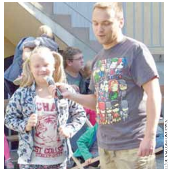
Na Muzycznym Placu Zabaw gościli artyści reprezentujący różne gatunki muzyczne. Na spotkanie z metalem zaprosił zespół Infernal Bizarre.

Jury zdecydowało też, że zgłoszony do Małych Grantów 2016 Ł Festival Adama Bombrycha ruszy z kolejną edycją, a zostanie on sfinansowany ze środków Łowickiego Ośrodka Kultury przeznaczonych na realizację koncertów.