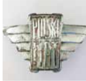
Tak prezentuje się logo Fiat Polski, które po odnowieniu znajdzie się na rekonstruowanym łożniku.

Stowarzyszenie Historyczne im. 10 Pułku Piechoty od dwóch lat realizuje projekt rekonstrukcji w oryginalnej formie wojskowej wersji Fiata 508 Łazik.