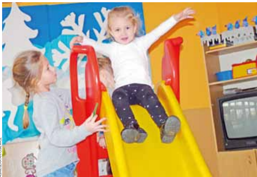
Największą atrakcją Dnia Otwartego okazała się zjeżdżalnia.

On sam podkreśla wielką pracę wykonaną przez nauczycieli w Pijarskim LO, ale nie zapomina też o tych z Zespołu Szkół przy ul. Grunwaldzkiej w Łowiczu, w którym kończył podstawówkę i gimnazjum, już wtedy odnosząc sukcesy.