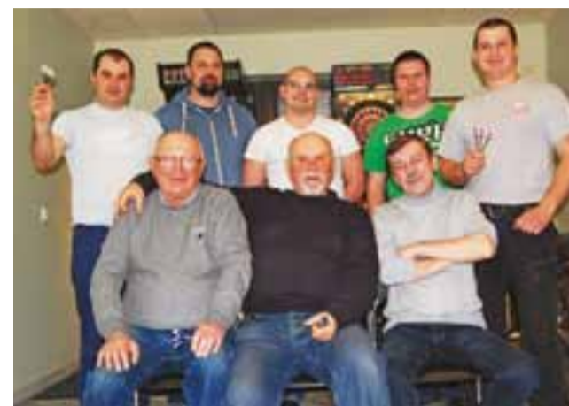
Uczestnicy piątkowego spotkania.