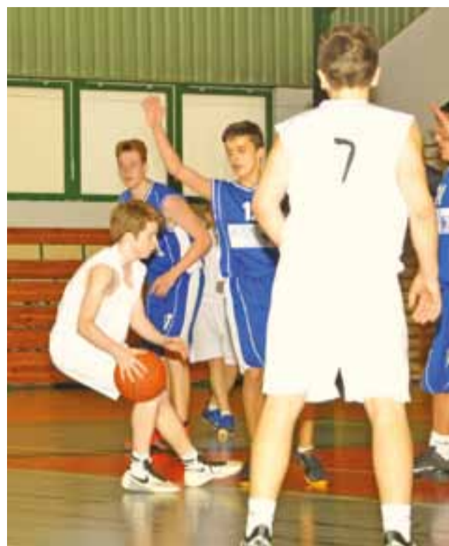
Kluczem do zwycięstwa Księżaka była dobra obrona.