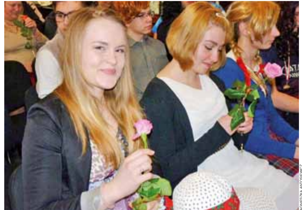
Kwiaty otrzymały też uczennice ZSP nr 1 w Łowiczu, a także... uczniowie, ale tylko ci przebrani za kobiety.