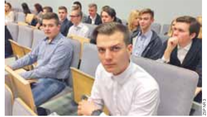
Uczniowie z Łowicza podczas ogólnopolskiego finału.