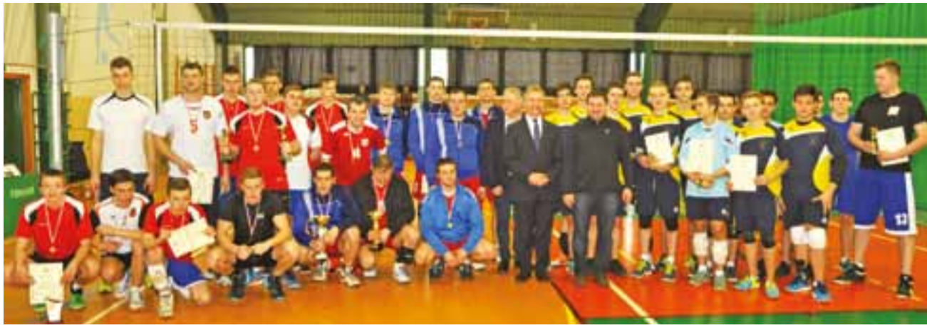
Uczestnicy zakończenia siatkarskich zmagani w Łowiczu.

Piłka siatkowa | Puchar Ligi Siatkarskich Amatorskich Mistrzostw Łowicza