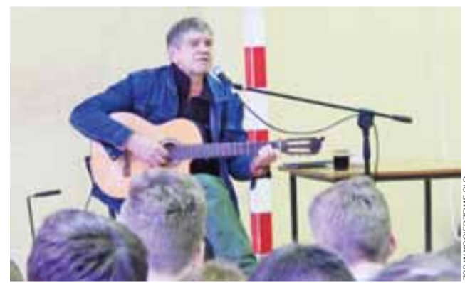
Aktor Lech Dyblik poruszył problematykę uzależnień.

Program pt. „Kuszenie Śmierci” poświęcony był przede wszystkim profilaktyce uzależnień. Opowiadał o człowieku, który wiele razy kuszony był przez środowiska pseudoartystyczne i mógł pójść ciemną drogą. Była to „spowiedź” artysty, który wiążąc życie ze sceną muzyczną i filmem wygrał trudną walkę z uzależnieniami. Zbudował życie prywatne i zawodowe oparte na silnych podstawach i wartościach. Uwolnił się