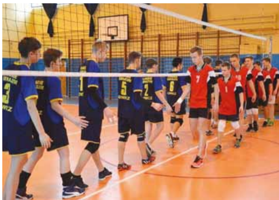
Kierownik Gimnazjum nr 3 (z prawej) wygrała zawody miejskie.