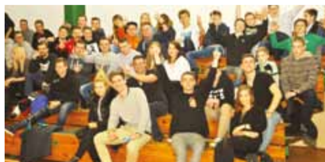
W kolejnych meczach Księżak liczy na niezawodnych kibiców.

AZS Lublin zagra w stolicy z Klubem Koszykarskim Warszawa i jeśli wygra to czeka na nich zwycięzca pary AZS Toruń – Domino Inowrocław. AZS UŁ Szkoła Gortata Łódź (3) jedzie na rewanż z Sokółem Ostrów Mazowiecka (6) i tu jest faworytem. Jeśli wygra to czeka ich mecz ze zwycięzcą