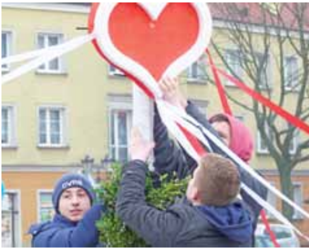
Gimnazjaliści z Popowa przymocowują serce do palmy Roku Miłosierdzia. To ona właśnie zdobyła pierwsze miejsce na tegorocznym konkursie.