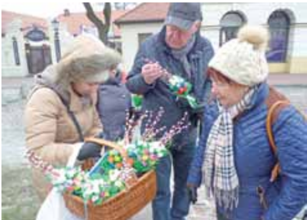
Wiosennie kolorowe , bo ozdobione małymi dziełami bibułkarskiej sztuki palemki, można było kupić nieopodal sceny na Starym Rynku.