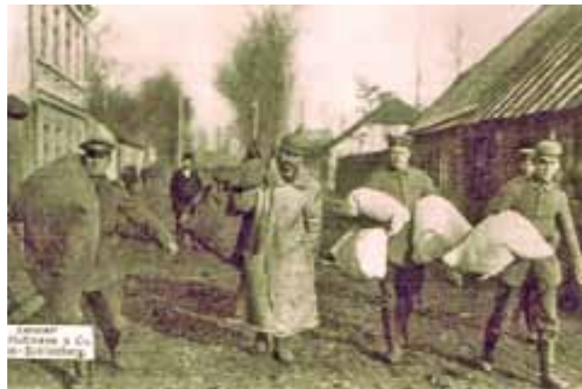
Żołnierze niemieccy ze zrabowanym mieniem w Łowiczu, 1915 r.

Prawdziwą jednak pasją Tarczyńskiego było kolekcjonerstwo. Gromadzone przez niego przedmioty i dokumenty, świadczące o bogatej przeszłości państwa i narodu polskiego, dały podstawę otwartemu oficjalnie w 1907 r. Muzeum Starożytności i Pamiątek Historycznych w Łowiczu.