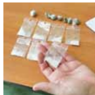
Narkotyki ujawnione w mieszkaniu na os. Konopnickiej były już poporcjowane.

Tego samego dnia, przed północą, na ul. Kurkowej w Łowiczu mundurowi z Wydziału Prewen-