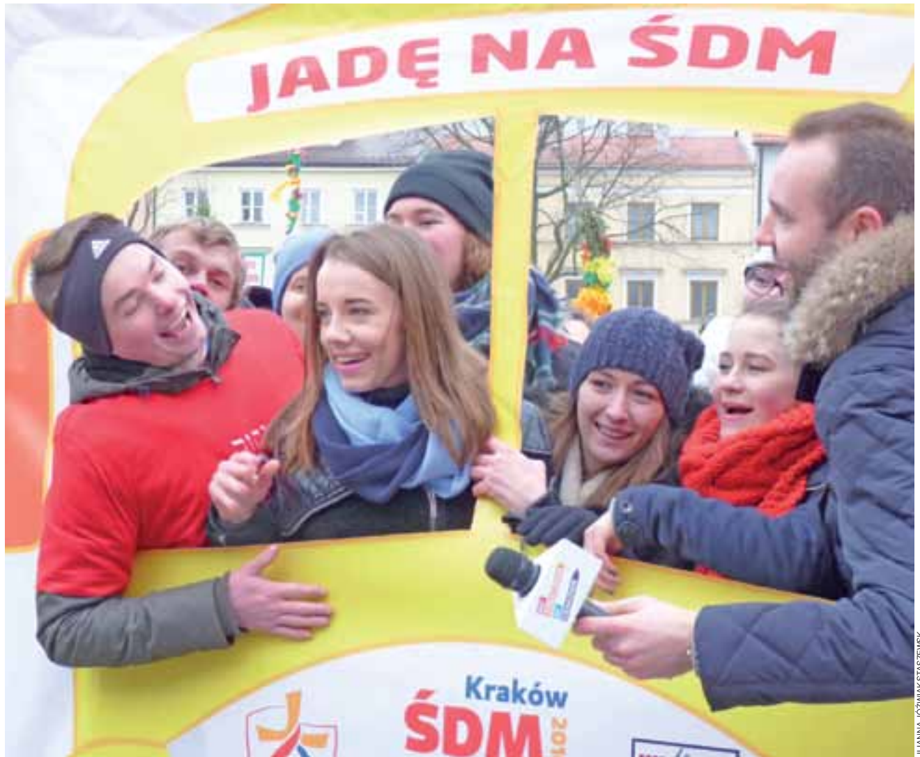
Niektórzy już oczyma wyobraźni są w Krakowie. Makieta autobusu Światowych Dni Młodzieży cieszyła się dużym wzięciem.