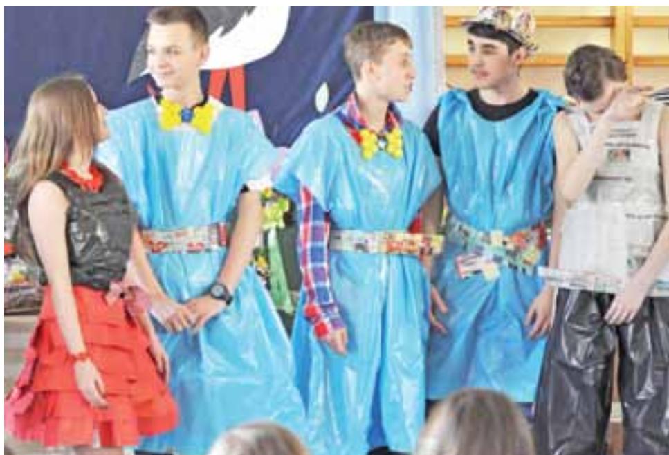
Pokaz mody ekologicznej wzbudził wiele radości i śmiechu, również wśród „modeli” i „modelek”.

Dzisiaj są wszyscy, nikt nie poszedł na wagar – dowiedzieliśmy się w szkole. Taki sposób zagospodarowania czasu gimnazjalistom w Kiernozi najwyraźniej sprawdza się.