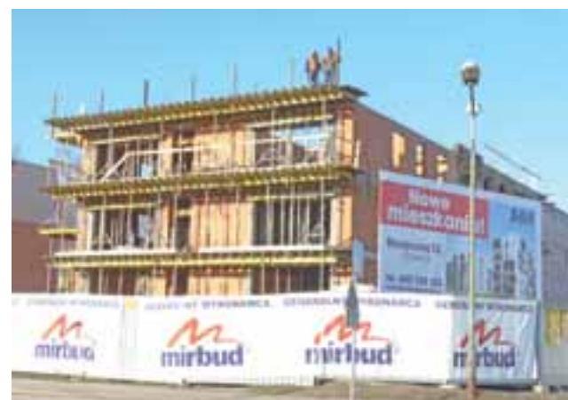
Największe zaawansowanie prac widać przy budowie bloku na ul. Medycznej 12 na Bratkowicach.

Projekt architektoniczny budynków przygotowała pracow-