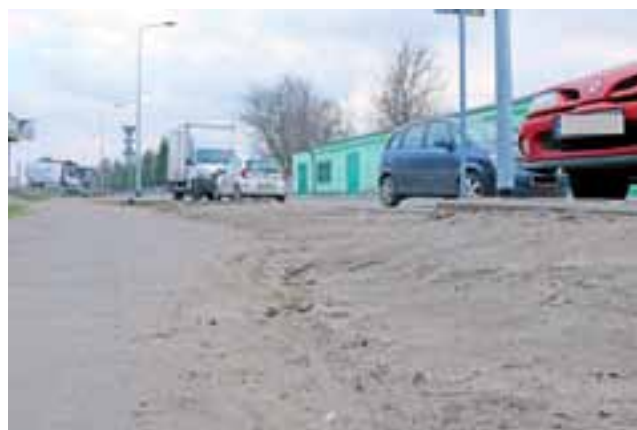
Nietrudno zauważyć dużą różnicę poziomów pomiędzy starym chodnikiem pod pawilonem a krawężnikiem, gdzie parkują samochody.