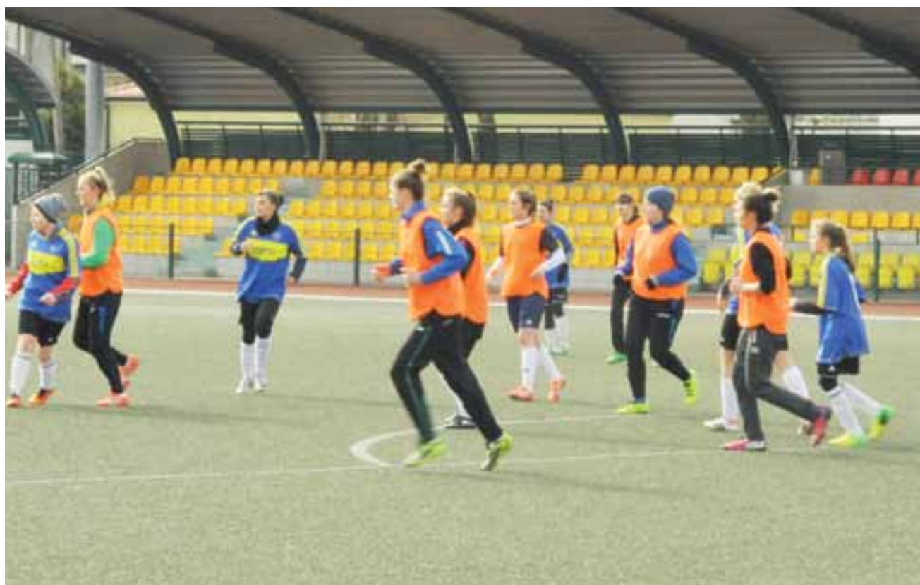
Kobiety Pelikana Łowicz zagrały mecz sparingowy w Łowiczu.

W 21 kolejce zagrają: Zawisza Rzgów – LKS Zawisza Pajęczno (pt, godz. 15.00), LKS Rosanów – Stal Głowno (pt, godz. 15.30), RTS Widzew Łódź – Włókniarz Żelów (s, godz. 13.00), Zjednoczeni Bełchatów – GKS II Bełchatów (s, godz. 13.00), MKP Boruta Zgierz – LKS Astoria Szczerców (s, godz. 14.00), RKS Mechanik Radomsko – Omega Kleszczów (s, godz. 15.00), MKS Zjednoczeni Stryków – KS Paradyż (s, godz. 15.00), Mazovia Rawa Mazowiecka – Pilica Przedbórz (s, godz. 15.00), GLKS Andrespolia Wiśniowa Góra – Polonia Piotrków Trybunalski (s, godz. 15.30).