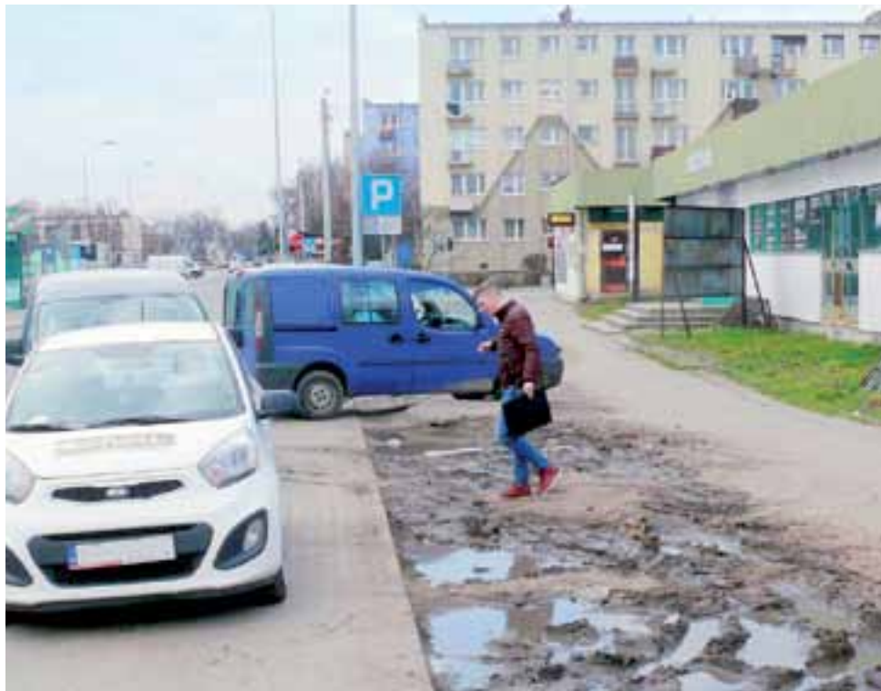
Widoczne na zdjęciu błoto to tylko namiastka tego, co dzieje się pod pawilonem w momencie, gdy pada deszcz.

Naczelnik Wydziału Inwestycji i Remontów w ratuszu Grzegorz Pełka powiedział nam, że w styczniu udało się ratuszowi porozumieć z właścicielem gruntu, którym jest łowicki GS. To pozwoliło na stworzenie dokumentacji technicznej i uzyskanie wszelkich pozwoleń na przeprowadzenie prac. Te zostały już zlecone Zakładowi Usług Komunalnych w Łowiczu i cały zakres prac ma być zrealizowany w kwietniu. ZUK ma wybudować przy ul. Piłsudskiego, przed sklepami, parking z betonowej kostki na 10 miejsc postojowych