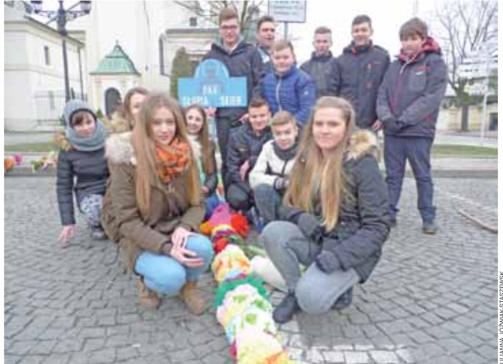
Młodzież gimnazjalna z parafii Słupia na łowickich spotkaniach młodzieży z biskupem jest co roku, palmy wielkanocne przywozi od 22 lat. Tegoroczna miała 15 metrów i składała się z 350 serwetkowych kwiatków.