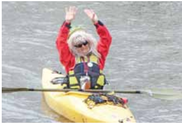
Wiosenne pozdrowienia od grupy kajakowej dla czekających na moście pozostałych grup rajdu.