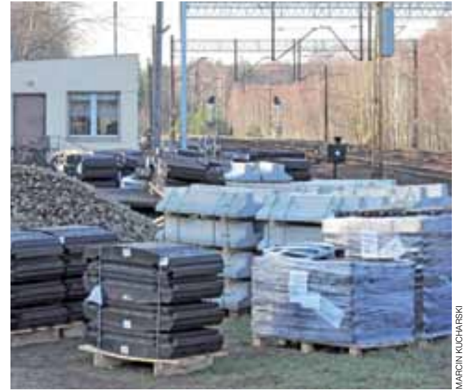
Materiały , które mają być wykorzystane podczas remontu przejazdu, zostały przywiezione do Arkadii w grudniu ubiegłego roku.