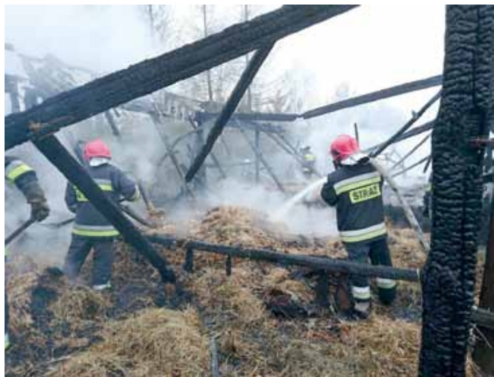
W płonącej stodołę znajdowało się siano i słoma, które były tam składowane.

Na miejscu działali m.in. strażacy z PSP Skierniewice oraz druhowie z OSP Bolimów, Sierżchów i Kęszycze. aa