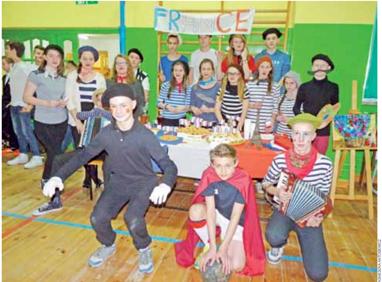
Cała klasa I a z Gimnazjum w Popowie zaangażowała się w przygotowanie stoiska poświęconego Francji.

Dzięki pomocy gimnazjalistów uczniowie podstawówek mogli podjąć nawet pierwsze próby sterowania robotami.