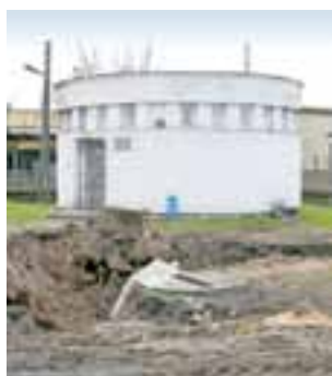
Przepompownia przy ul. Piłsudskiego – przed nią widać ślady prowadzonych aktualnie prac.

Kolektor ten od kilku lat okresowo przepelnia się. Rosnący w nim poziom zanieczyszczenia sprawia, że wybijają one w piwnicach bloków na os. Starzyńskiego. Ostatnio, w marcu, sytuację taką opisaliśmy w bloku nr 5, gdzie ścieki zalały część piwnicy. Nadmieniliśmy wówczas, że rozwiązaniem byłoby uruchomienie nowego kolektora w ul. Piłsudskiego, który dotąd nie został podłączony do przepompowni przy tej ulicy. ZUK chciał bowiem wcześniej przeprowadzić jej gruntow-