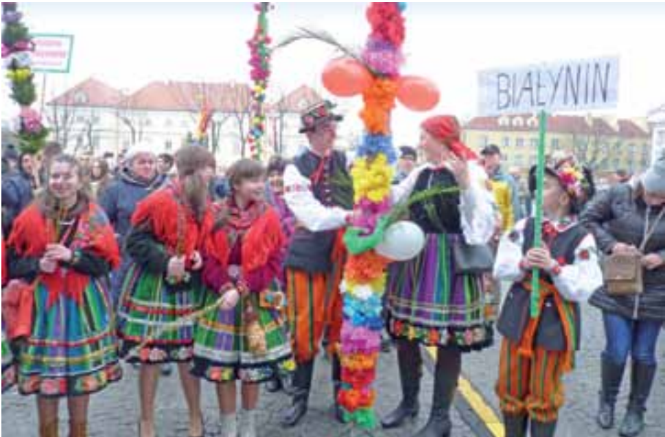
Przedstawiciele parafii z Białynina to już stali bywalcy diecezjalnych spotkań młodzieży i konkursu palm wielkanocnych.