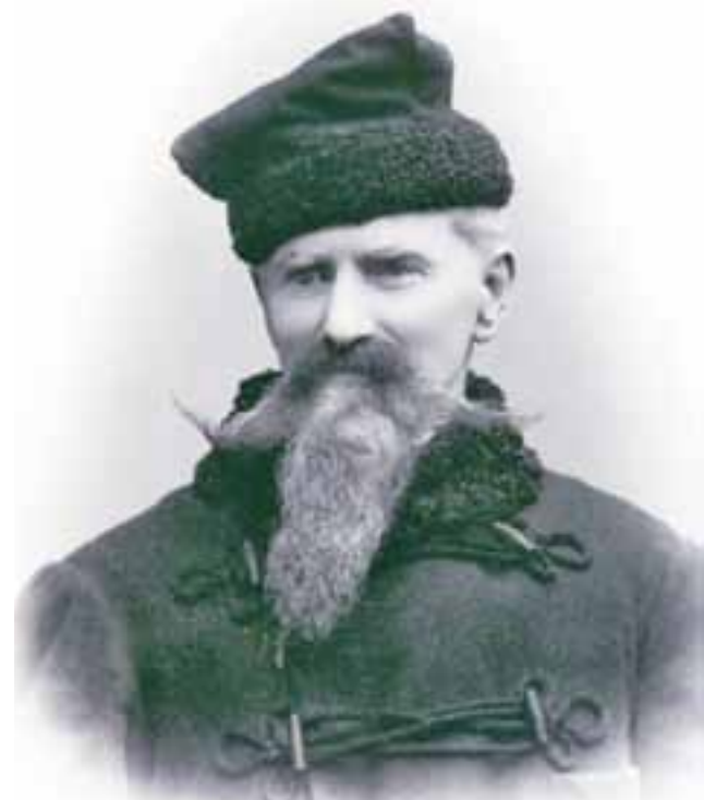
Władysław Tarczyński na fotografii z roku 1902.

Kronika, a ściślej dziennik na bieżąco prowadzony po ogłoszeniu mobilizacji w Królestwie Polskim od 30 lipca 1914 aż do 14