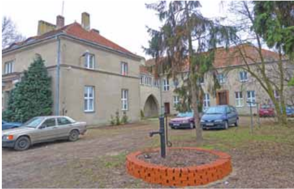
Jednym z budynków, co do których szkoła ma plany inwestycyjne, jest internat. Ma on zostać ocieplony i jeśli będzie to możliwe – rozbudowany.

Oprócz tego widzi potrzebę przeniesienia tam stołówki, która znajduje się w budynku szkoły.