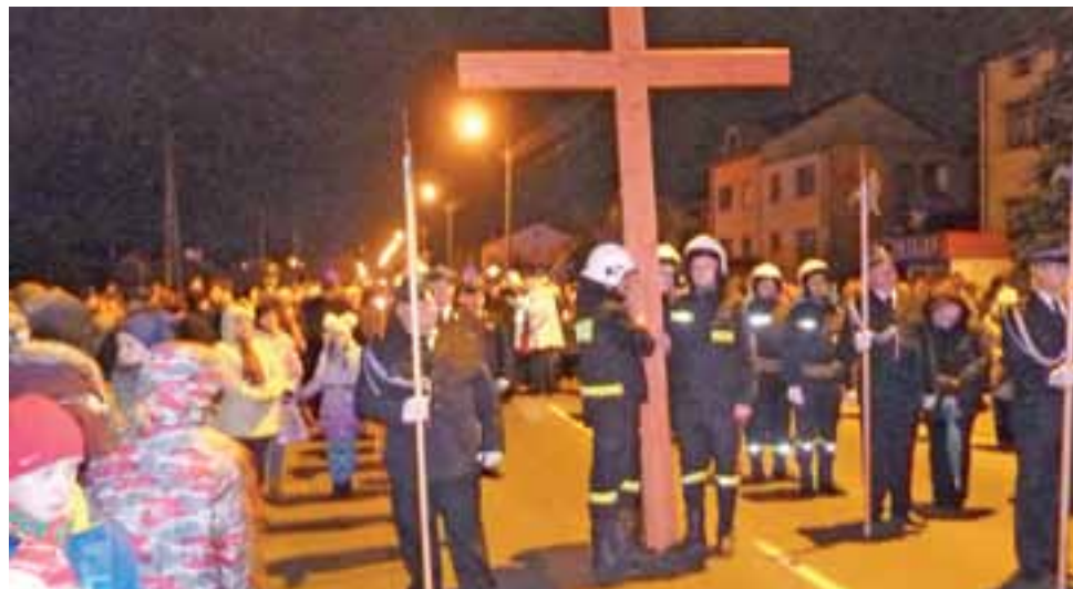
Jedna z końcowych stacji, na ul. Jana Pawła II.