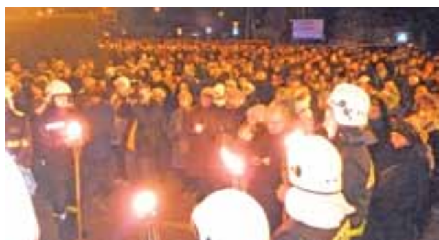
Tłum wiernych przed frontem kościoła na Bratkowicach.