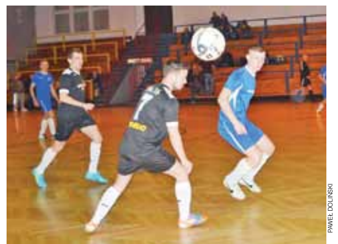
Gładiatorzy zajęli drugie miejsce i awansowali do II ligi!