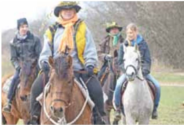
Grupa konna zmierza na główny przystanek rajdu, zlokalizowany w Klewkowie.