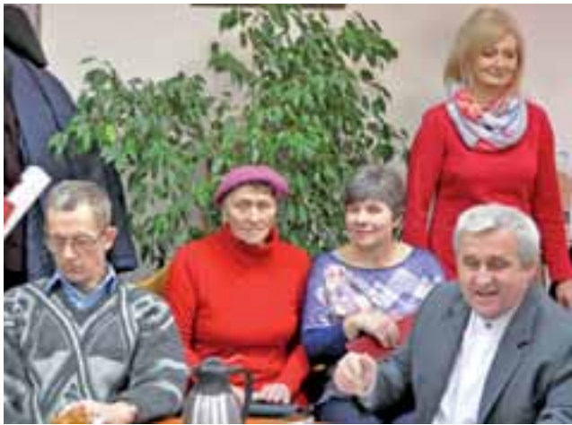
W obradach sesji Rady Gminy w Sannikach wzięli udział również mieszkańcy Szkarady i okolic.

Temat ścieżki wzdłuż przechodzącej również przez Sanniki drogi wojewódzkiej nr 577 (od Łącka w kierunku Sochaczewa) został wywołany podczas obrad połączonych komisji rady. Wójt przekazywał na tejsze komisji radnym informację, że sąsiadująca z gminą Sanniki gmina Gąbin „przymierza się” do zaprojektowania budowy ścieżki wzdłuż drogi wojewódzkiej 577 w kierunku granicy z gminą Sanniki i sugeruje, że zasadne byłoby przedłużenie tej ścieżki do istniejącego już odcinka ścieżki dla pieszych w okolicach Czyżewa. Ostateczne decyzje w tym temacie jednak jeszcze nie zapadły.