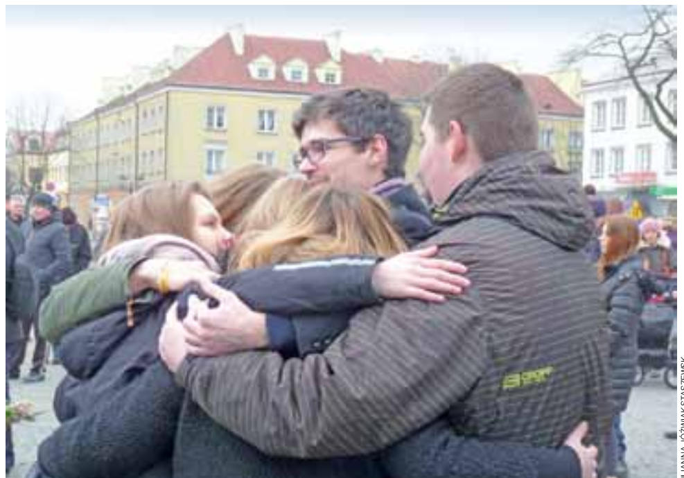
Braterstwo i poczucie wspólnoty są tym, co wyróżnia wszystkie ewangelizacyjne spotkania młodych w Łowiczu.