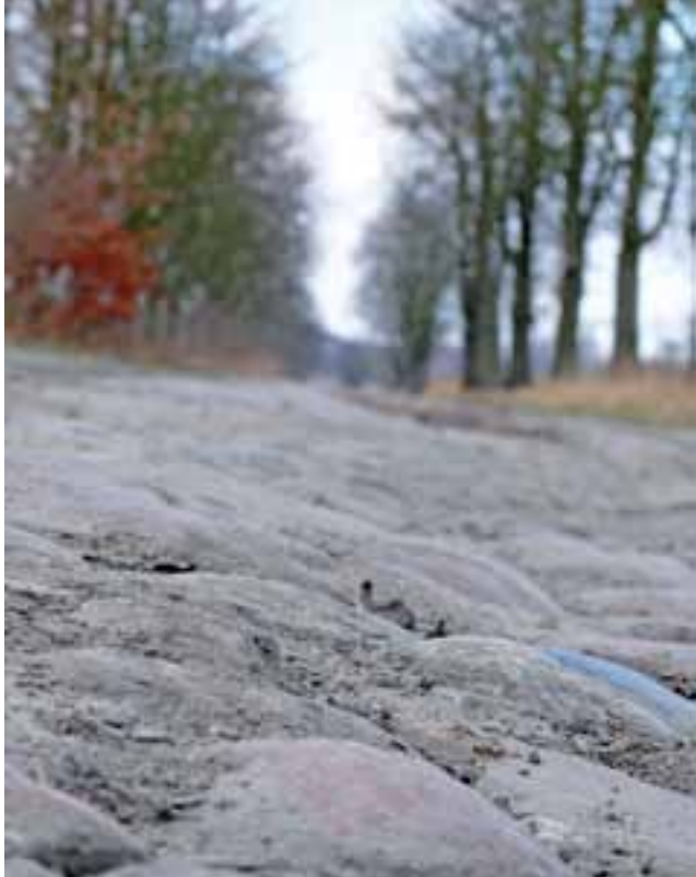
Ulica Strzelcewska, czyli inaczej „brukowanka”, prawdopodobnie będzie musiała poczekać na nawierzchnię. Szanse, aby w tym roku pojawił się na niej asfalt, nie są duże.

Ponad miesiąc temu pisaliśmy, że miasto nie będzie czekać na decyzje związane z dofinansowaniem z Urzędu Marszałkowskiego w Łodzi budowy fragmentów obu ulic. Miało ono wynosić połowę kosztów inwestycji, ocenianych na 5 mln. zł. Wniosek ratusza znalazł się jednak poza grupą wniosków, które zakwalifikowały się do finansowania, ale z szansą na to, że po oszczędnościach wynikających z rozstrzygnięciu przetar-