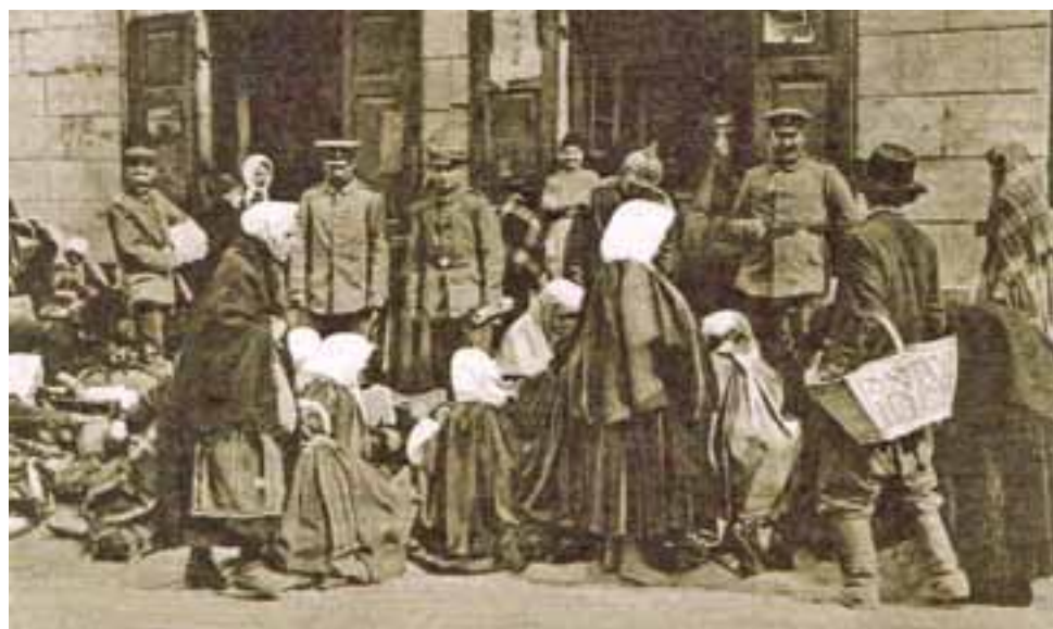
Widoki wojny 1914/15 – handel uliczny w Łowiczu, 1915 r.