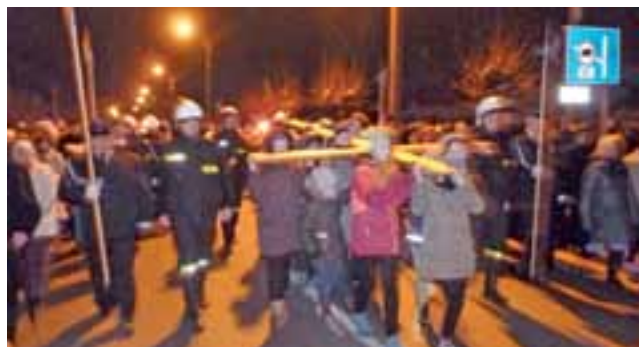
Niosący krzyż zmieniali się co stację. Tutaj, na ul. Jana Pawła II, niosły go dzieci z gimnazjów.