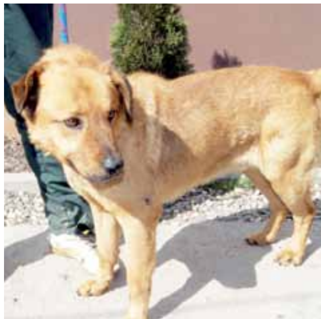
Na stronie www.gminazduny.pl znajduje się zakładka ze zdjęciami psów do adopcji oraz numerami każdego z nich. Zainteresowanie przygarnięciem psów jest jednak znikome.

Zadania gminy to zapobieganie bezdomności zwierząt oraz zapewnienie opieki m.in. przez odławianie bezdomnych psów i zapewnienie im miejsc w schronisku, obowiązkową sterylizację i kastrację zwierząt przebywających w schronisku, usypianie ślepych miotów, wskazanie gospodarstwa rolniczego, do którego mogą trafić wyłapane zwierzęta gospodarskie, zapewnienie całodobowej opieki weterynaryjnej dla zwierząt poszkodowanych w zdarzeniach drogowych.