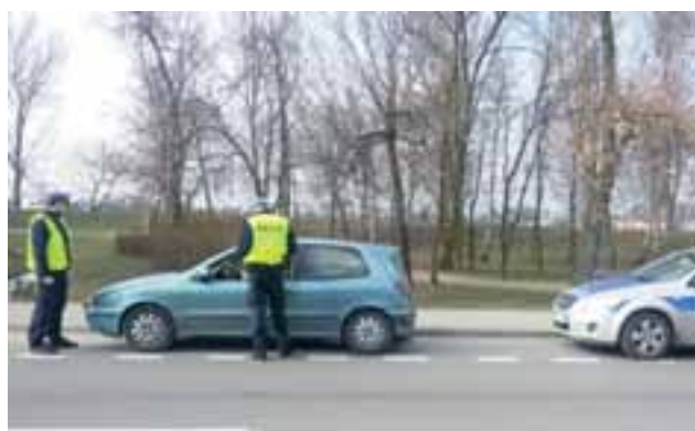
Policyjna akcja „Pasy” ujawniła aż 35 wykroczeń.

Akcja „Pasy” wpisuje się działania ogólnopolskie. Ich efektem było ujawnienie 35 różnych wykroczeń. W powiecie łowickim