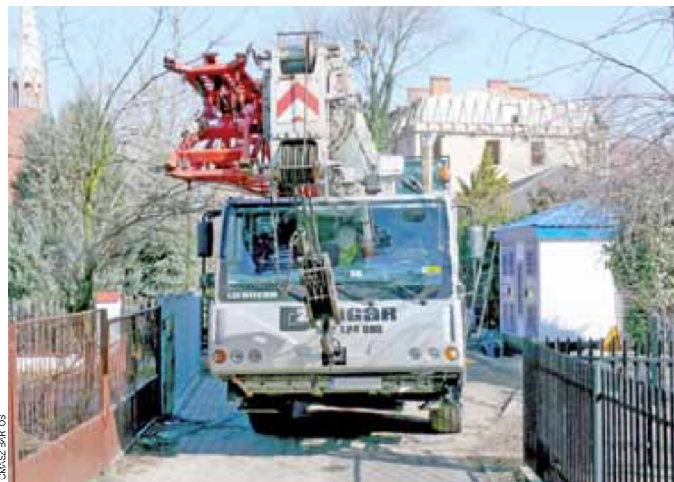
Nowa stacja transformatorowa przy ul. Akademickiej jest mniejsza od poprzedniczki i łatwiej się do niej dostać z ulicy.

Stacja odpowiedzialna jest za zasilanie w energię budynków mieszkalnych przy ul. Kaliskiej, dawnej siedziby Mazowieckiej Wyższej Szkoły Humanistyczno-