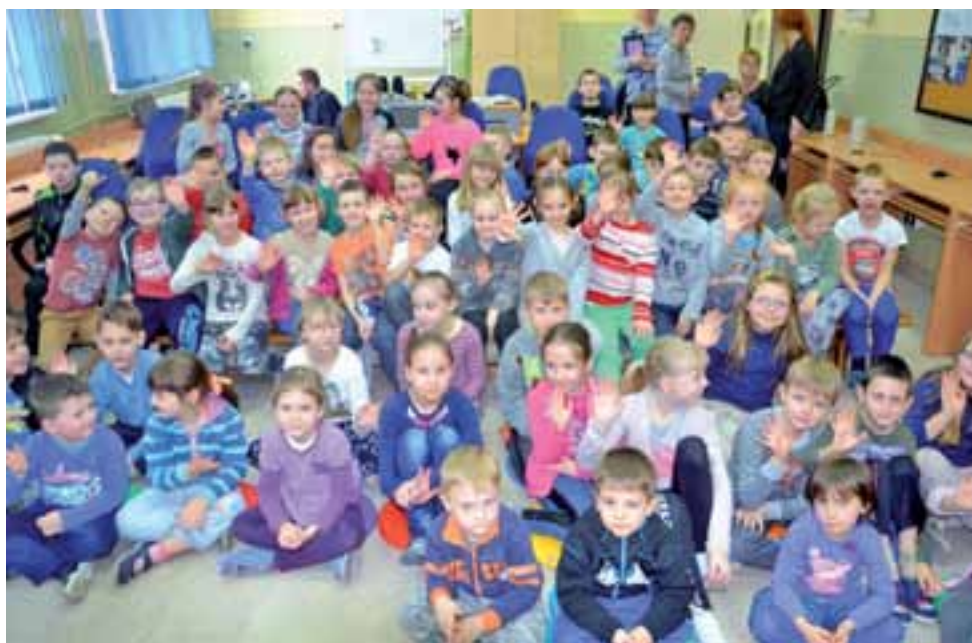
Dzieci z zainteresowaniem śledzą spektakl Teatru Grotesk.

Nagrodami w konkursie były m.in. zestawy głośników komputerowych, kalkulatory matematyczne, powerbanki, pamięci flash. Wszyscy uczestnicy konkursu otrzymali natomiast książki z zadaniami i ciekawostkami matematycznymi. mak