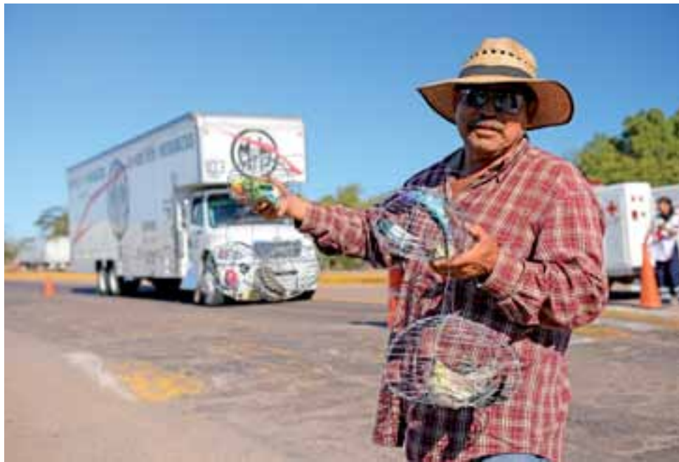
Przy drogach i na drogach rządzi chaos. Ma to swój urok, ale...

Na szczęście to stół suto zastawiony. Centrum kraju dla lubiących poznawać kulturę, architekturę i regionalne ciekawostki jest szalenie atrakcyjne. Na horyzoncie pojawiają się bogato zdobione kościoły, szesnastowieczne zakony, kolonialna zabudowa i kolorowe centra historycznych miast. Generalnie wszystko to, co turystycznie do Meksyku przyciąga i o chciałoby się oglądać. Cukierki ze złotka odwijam jednak już na południu.