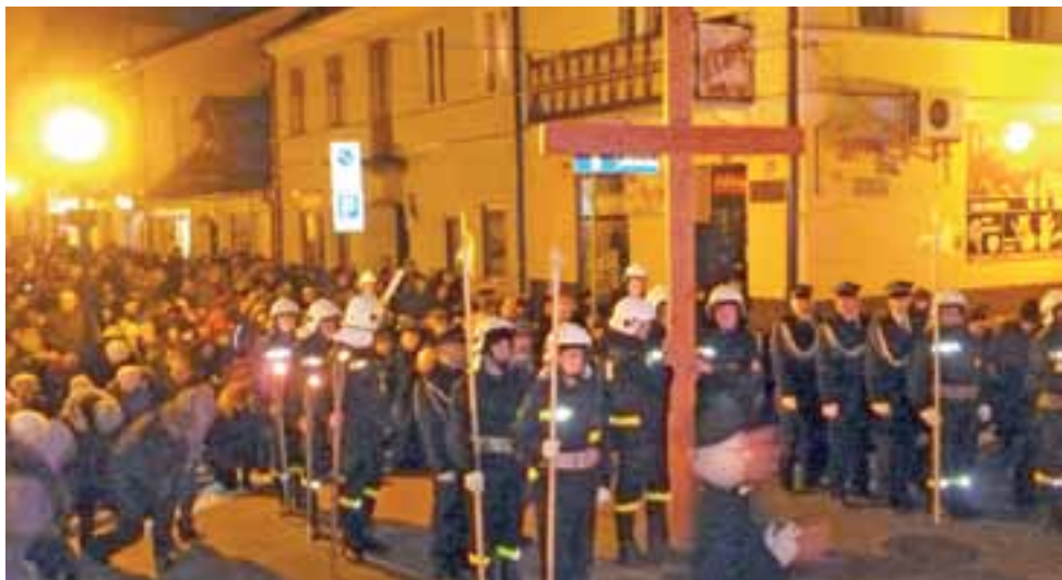
Pokłon pod krzyżem na jednej z początkowych stacji, na skrzyżowaniu Zduńskiej z Browarną.