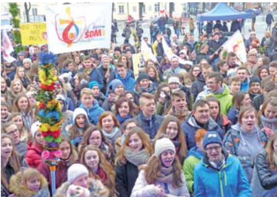
Flagi z nadrukiem ŚDM , transparenty z nazwami miejscowości, z których przybyła młodzież oraz wielkanocne palmy były tym, czym wyróżniali się tegoroczni uczestnicy Niedzieli Palmowej na Starym Rynku.