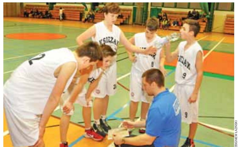
Ekipa Księżaka z rocznika 2002 nadal niepokonana w lidze

Piłka nożna | Mecz sparingowy rocznika 2001