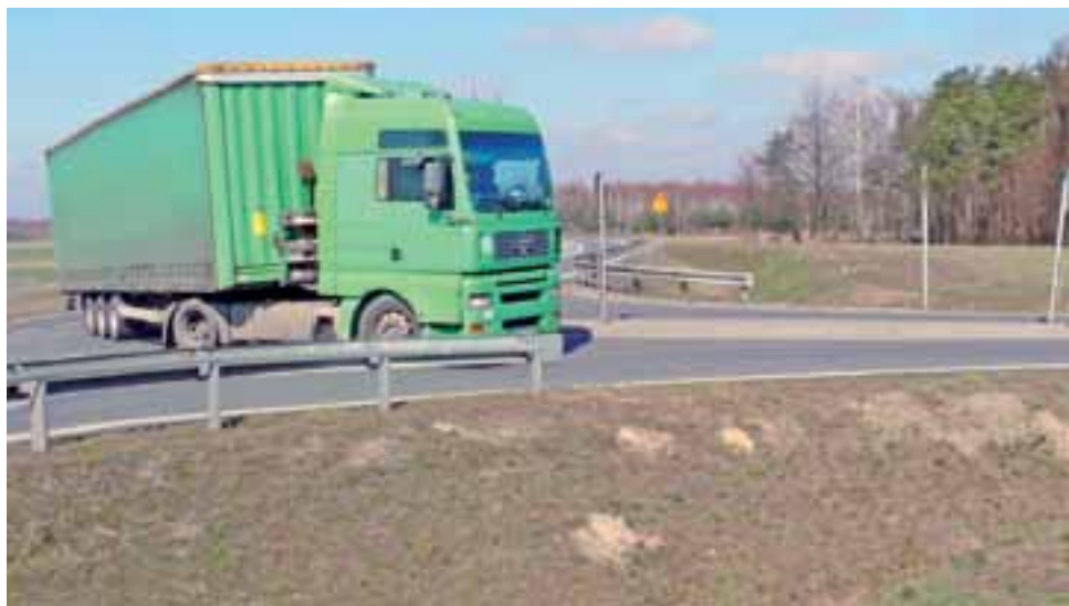
Po lewej stronie widać bariery oddzielające rów od pasa jezdni. Kierowcy uważają, że są one zbyt krótkie. Dłuższe lepiej chroniłyby w niektórych sytuacjach od wjechania do głębokiego rowu.

Miało tam też dochodzić do sytuacji groźnych, gdy wyprzedzający w ten sposób samochód ledwo unikał zderzenia z samochodem, który wyjeżdżał z drogi podporządkowanej od strony Nieborowa. Kierowca w tym przypadku miał prawo sądzić, że uda mu się