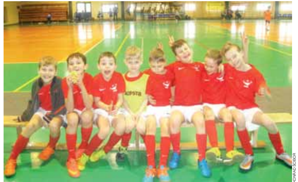
Sport daje najmłodszym wiele radości

ków 2006/2007. Rozegrano w sumie 28 meczów. Piłkarze z AP Łowicz rozegrali 7 spotkań, plasując się w końcowej klasyfikacji na 5. miejscu. W tej kategorii poziom sportowy był niezwykle wyrównany o czym świadczy aż 14 spotkań zakończonych remisem, a także to, że nasz zespół zremisował ze zwycięzcą turnieju Akademią Piłkarską Champions Biała Rawska 0:0, ale także zespołem IKS Inowódź, który zajął przedostatnie miejsce. O końcowej klasyfikacji, podobnie jak w poprzednim dniu zdecydował ostatni mecz z Akademią Piłkarską Champions z Piotrkowa. Chłopcom z rocznika 2008/2009 zwycięstwo dawało drugie miejsce, natomiast drużynie z roczników 2006/2007 3. miejsce w turnieju. W obu przypadkach to jednak koledzy z Piotrkowa wyszli zwycięsko. zł