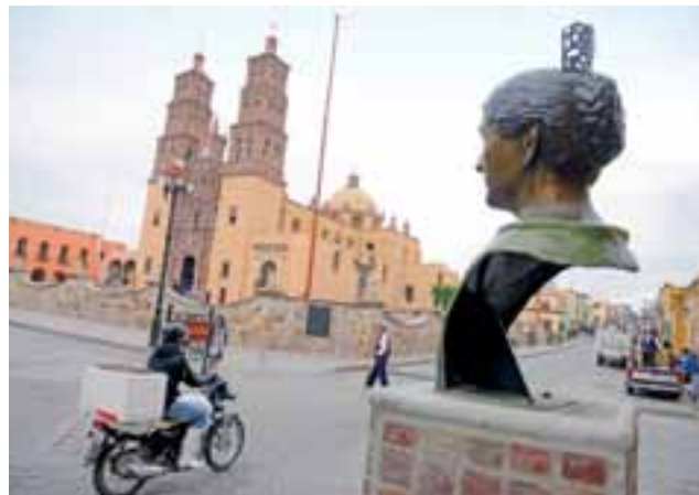
Miasto, pueblo czy rancho - mniejsza z tym. Ważne, że piękne.

Później na szczęście też bieddy nie ma. Podążając przed siebie zaliczam co trzeba. Ciudad Hidalgo, San Miguel de Allende, Aguascalientes, Zacatecas, Durango... Wymieniać można by długo, bo lista miast i puebli usytuowanych w centrum kraju, a wartych odwiedzenia, jest nad wyraz bogata.