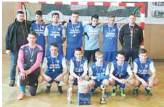
Zwycięska drużyna Vagatu w turnieju LZS do lat 16

W turnieju finałowym wystąpiło pięć zespołów, które reprezentowały dany powiat. Wcześniej drużyny rywalizowały w eliminacjach do turnieju finałowego, który w tym roku odbył się w Łowiczu. Vagat rozpoczął turniej od remisowego meczu z Ostrowią Ostrowy. W meczu z graczami Ostrowii padł remis 3:3. W drugim meczu domaniewicka drużyna również straciła trzy gole, ale tym razem zagrała bardzo skutecznie ponieważ gracze Vagatu aż pięciokrotnie pokonywali bramkarza Zawiszy Pajęczno i mecz zakończył się ostatecznie wygraną