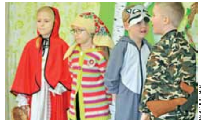
Bajkę o Czerwonym Kapturku wystawili dzieci z kółka teatralnego „Słoneczne Promyki” z grupy Zajęczki.

Wszystkie prace plastyczne, a było ich łącznie 25, które wpłynęły na międzyprzedszkolny konkurs plastyczny „Moja ulubiona bajka” organizowany przez Przedszkole nr 4 Słoneczko w Łowiczu, zostały nagrodzone. Podczas wręczenia nagród, 16 marca, dzieci, które wzięły w nim udział, miały okazję obejrzeć krótkie przedstawienie o Czerwonym Kapturku w wykonaniu przedszkolaków z grupy Zajęczki ze Słoneczka. Był też owocowo-słodki poczęstunek. Prace można oglądać w przedszkolnym holu. mak