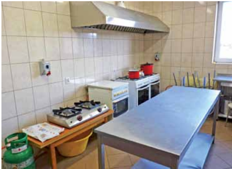
Kuchnia po remoncie. Dzięki wsparciu gminy oraz zbiórkom przeprowadzonym wśród strażaków oraz mieszkańców Mąkolic i Woli Mąkolskiej udało się naprawić szkody wyrządzone przez płomienie.

Dzięki cennej inicjatywie i zaangażowaniu wielu osób, kuchnię odremontowano już pod koniec listopada, a po jej wyposażeniu możliwe okazało się zorganizowanie w remizie zabawy sylwestrowej, na której bawiło się 66 osób.