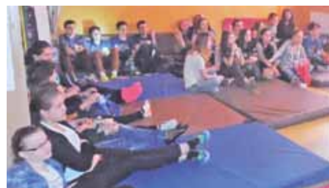
Materace zamiast kinowych foteli. Oglądaniem filmów gimnazjaliści z ZS Nr 2 Bratoszewice rozpoczęli zimową przerwę w nauce.

– Mieliliśmy kilka lat przerwy w tej inicjatywie, ale postanowiliśmy do niej powrócić, by – tak jak uczniowie szkoły podstawowej mają przed feriami noc bajek,