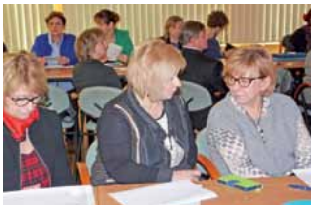
Podczas rundy warsztatowej była okazja do poznania specyfiki poradnictwa zawodowego w UE i wypracowania wspólnych wniosków.

Twórcy projektu mają nadzieję, że korzystając z doświadczeń