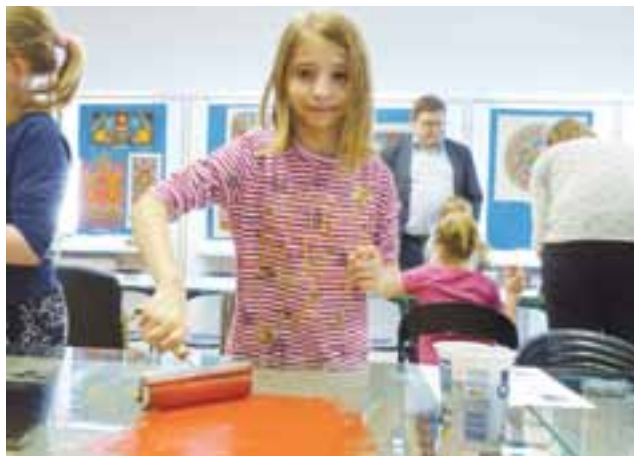
Trochę siły i dynamicznych ruchów potrzeba, by rozprowadzić farbę na wałku.

Łowicz | Warsztaty walentynkowe w muzeum