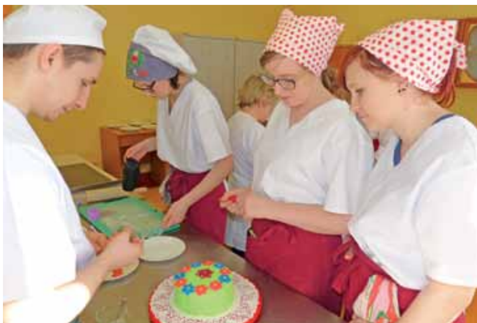
Na angielskich tortach, pokrytych masą cukrową, pojawiły się różne zdobienia walentynkowe, lub – jak te widoczne na zdjęciu – wiosenne.

W czasie kilkugodzinnych warsztatów w szkole przy ul. Powstańców postanowiła nauczyć młodszych kolegów tworzenia i zdobienia trzech rodzajów tortów. Biskopki do tortów zostały w szkole upieczone dzień wcześniej. Na ostatkowych zajęciach