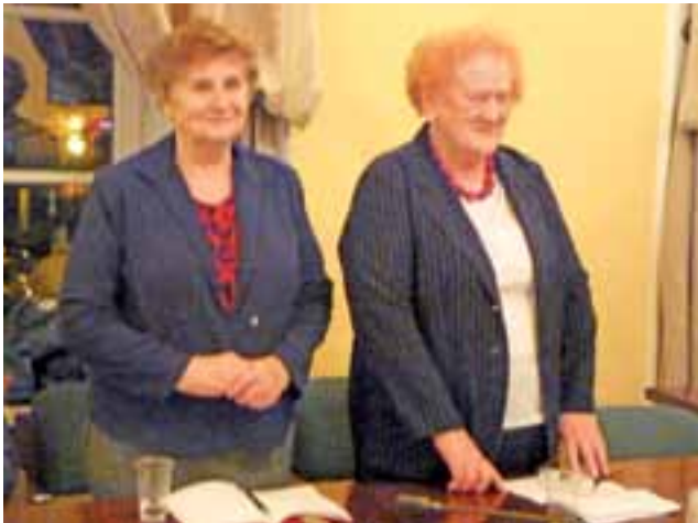
Na spotkanie przyszli: seniorzy...