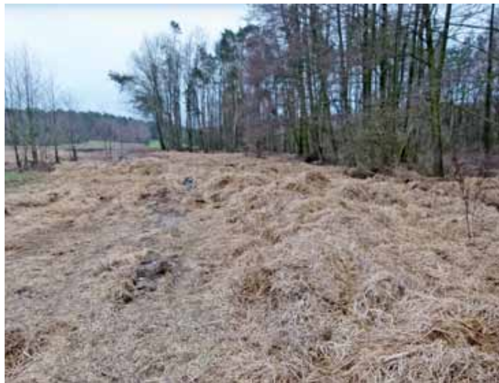
Pole zostało już zabezpieczone, jego powierzchnię m.in. pokryto słomą.

Rolnik, na którego polu składowany był osad mówi, że materiał pochodził ze strykowskiej oczyszczalni ścieków. Otrzymuje