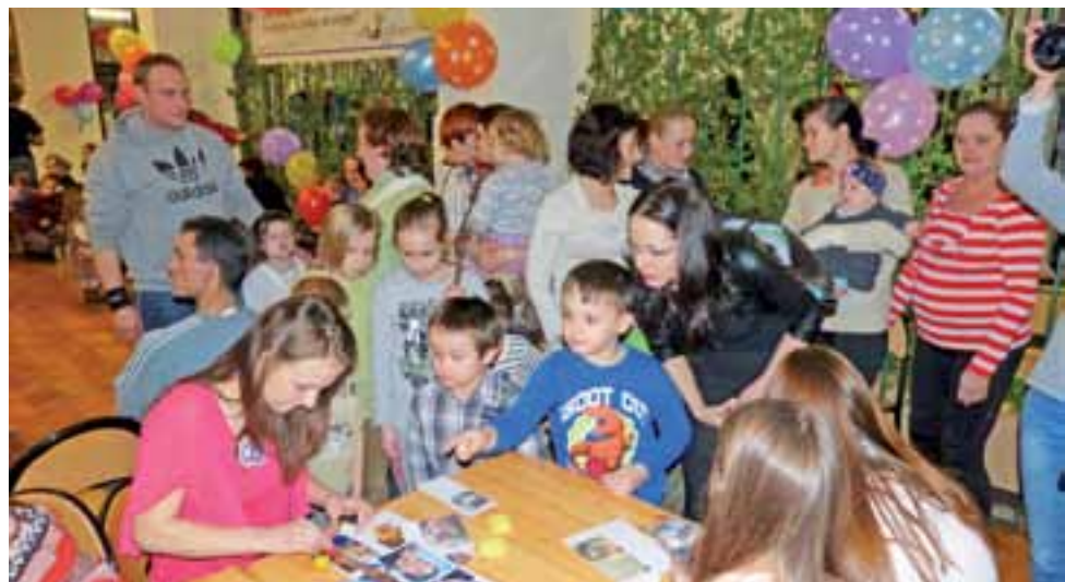
Młodzież malowała dzieciom bawiącym się na choince buzie. Wzór można było sobie wybrać spośród zdjęć wydrukowanych na kartkach papieru.

Jak nas zapewniali uczniowie, z którymi mieliśmy okazję zamienić kilka zdań, po takich zajęciach na pewno można dać sobie radę z samodzielnym wykonaniem pięknego tortu w domu.