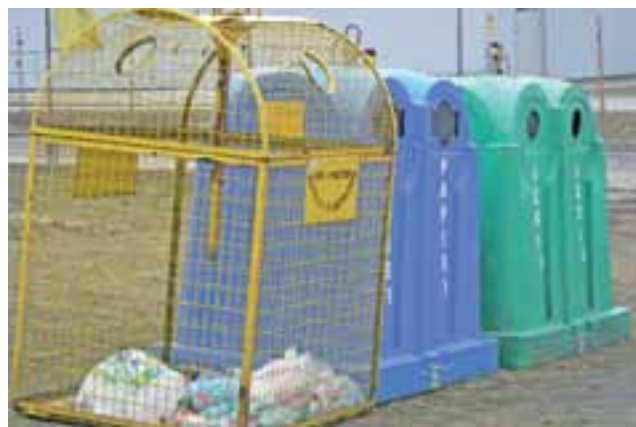
Ustawienie pojemników w tym miejscu wywołało kontrowersje.

Poza tym obawiała się, że wkrótce w tym miejscu zacznie się robić bałagan. Czytelniczka zwracała uwagę, że pojemniki