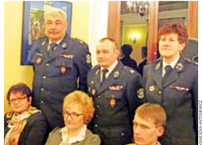
strażacy – ochotnicy...

Łowicz | Wojewoda łódzki spotkał się ze stowarzyszeniami z Łowicza