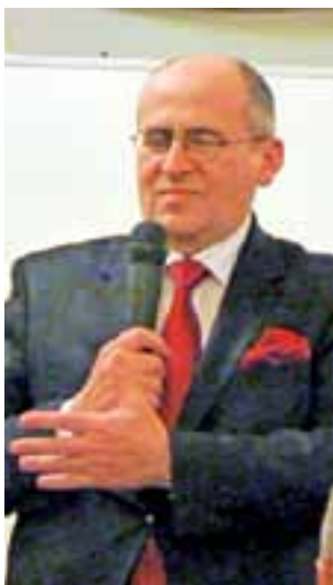
Wojewoda Zbigniew Rau...

i mieszkańców, w porozumieniu z władzą. Ta współpraca jest bardzo widoczna – mówiła.