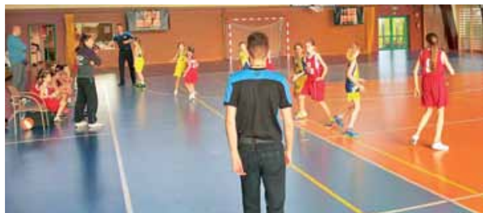
Drużyna TK Basket (żółto-niebieskie stroje) od dłuższego czasu czeka na kolejne zwycięstwo w lidze. Drużyna Strykowska ma jednak znacznie mniej doświadczonych zawodniczek i musi uzbroić się w cierpliwość.

■ Następna, 3. kolejka odbędzie się w dniach 28 lutego – 1 marca: Alles Basket Głowno – Grot I Pabianice, Trójka Sieradz – Grot II.