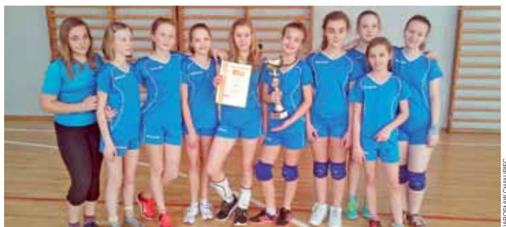
Uczennice Szkoły Podstawowej nr 3 w Głownie mogą być zadowolone z Mistrzostw Powiatu Zgierskiego w siatkówce, gdzie zajęły 2. miejsce.

W Zgierzu pokazały się również dziewczęta ze głowieńskiej Szkoły Podstawowej nr 3. Siatkarki Głowna miały trudniejsze zadanie i musiały zmierzyć się z czterema drużynami. Po bardzo emocjonujących spotkaniach uczennice SP 3 pokonały po tie-breakach rywalki z Leśmierza