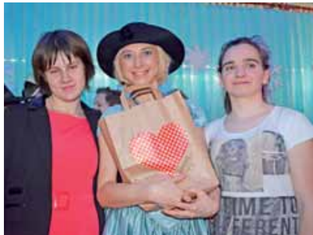
Przekazanie słodyczy z Zakładu Karnego w Łowiczu dla uczestników jasełek bożonarodzeniowych.