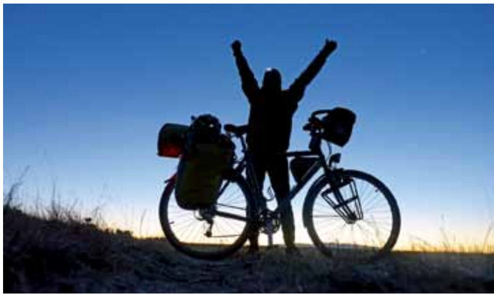
Rower daje poczucie wolności...

Jak zapewnijają organizatorzy, lista tegorocznych rowerowych gawędziarzy jest już gotowa, ale