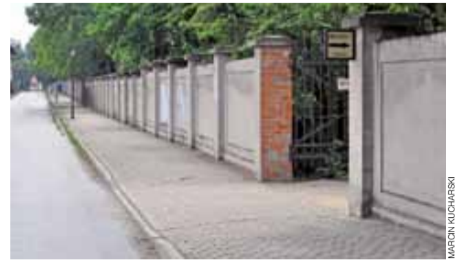
Dzięki lustrom, kierowcy wyjeżdżający z parku będą widzieli czy ktoś idzie bądź jedzie rowerem po chodniku wzdłuż pałacowego plotu.

trowych. W 2011 roku ówczesne władze gminy zgodziły się na budowę farm elektrowni wiatrowych, po czym – już po upływie wyznaczonego przez gminę terminu konsultacji – powstał komitet protestacyjny, utworzony przez mieszkańców, którzy deklarowali, że „nie są przeciwnikami OZE, ale mają zastrzeżenia co do lokalizacji inwestycji”. Pod listem podpisało się 96 mieszkańców (uprawnionych do głosowania jest w tej miejscowości 131!), którzy twierdzą, że nikt z nimi na temat lokalizacji wiatraków nie rozmawiał. tm