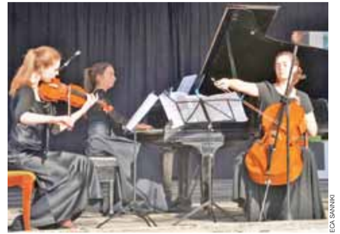
Trio wystąpiło w muszli koncertowej na świeżym powietrzu.

– Mamy nadzieję, że cykl darmowych letnich koncertów plenerowych spowoduje, że będą na koncerty chopinowskie przychodzić ludzie, którzy dotąd nie odwiedzali pałacu i nie delectowa-