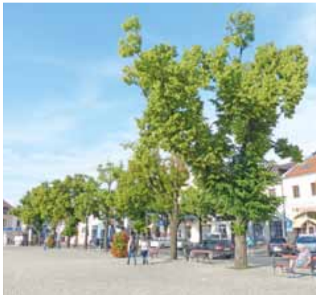
Na Nowym Rynku, podczas prowadzonej przed 10 laty renowacji, wycięto znaczną część drzew. Te, które pozostały, nie są może najpiękniejsze, dla dodają uroku i dają cień.

Zamiast tego ustawiono w cieniu rosnących tam już drzew kwietne wieże, wydając na ich zakup, ukwiecenie i utrzymanie w tym roku przeszło 50 tys. zł. Wnioskowała więc ponownie, aby na Nowym Rynku pojawiły się drzewa. Wniosek ten poparł