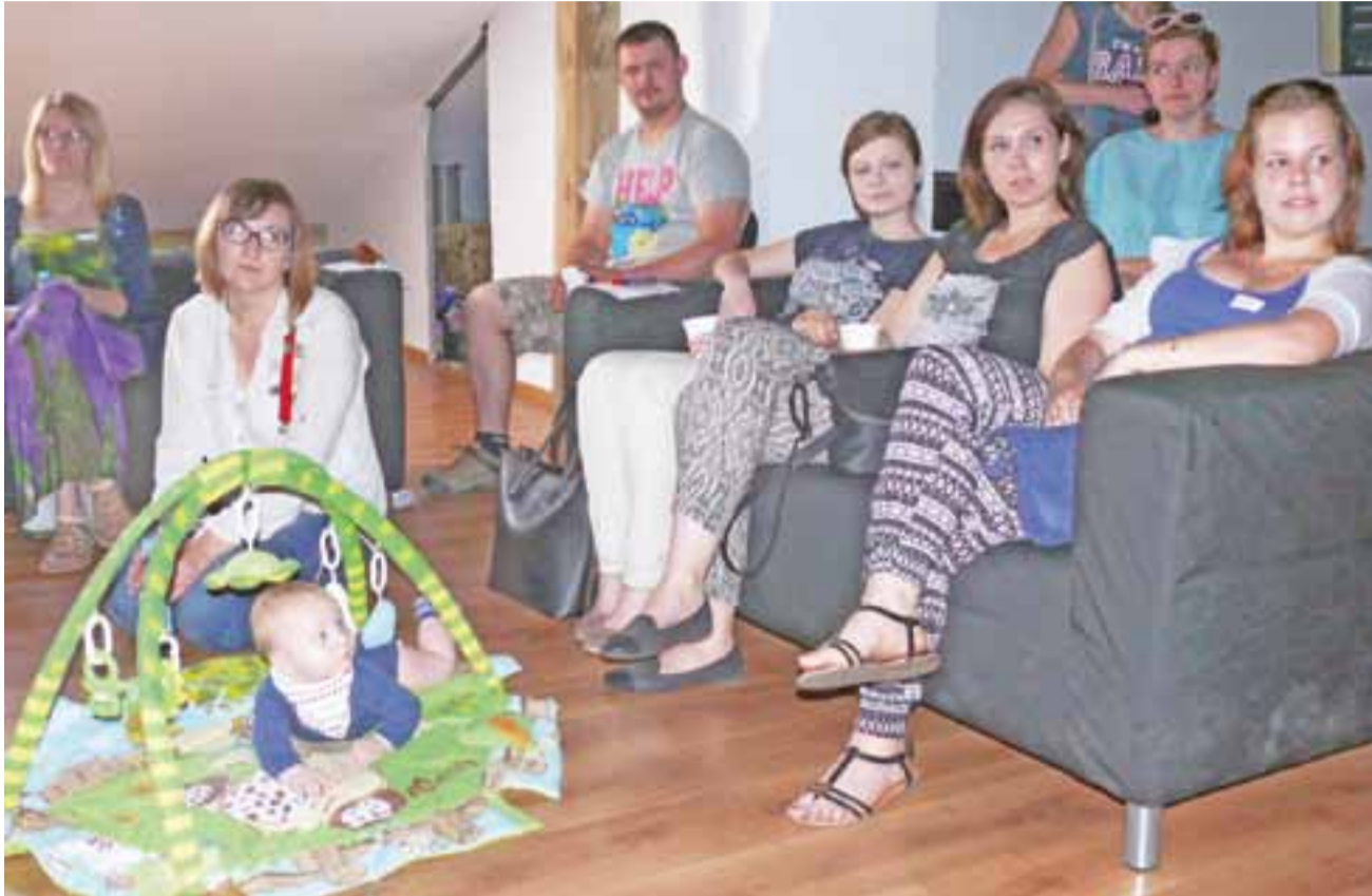
W trakcie spotkania panowała luźna atmosfera. Oprócz mam, przybyło na nie kilku tatusiów, a warunki były idealne nawet do sprawowania opieki nad małymi dziećmi.

Dlaczego więc prowadząca postanowiła zająć się tematem? Jak nam powiedziała, uważa go za istotny, a niestety często marginalizowany. Przyczyną tego jest m.in. fakt, że kobiety spodziewające się dziecka bardziej koncentrują się na samym porodzie niż na tym, co będzie później. Oprócz tego o karmieniu piersią zwyczajnie się zapomina. Ona sama dobrze wie, że warto karmić piersią dziecko, bo jest to korzyścią tak dla niego, jak i dla matki.