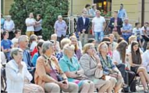
Koncertu wysłuchało kilkadziesiąt osób. Nie dla wszystkich wystarczyło miejsc siedzących.