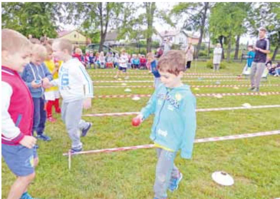
W tej konkurencji liczyła się nie tyle szybkość, co ostrożność. Piłeczka miała pozostać na łyżce podczas pokonywania całej trasy.