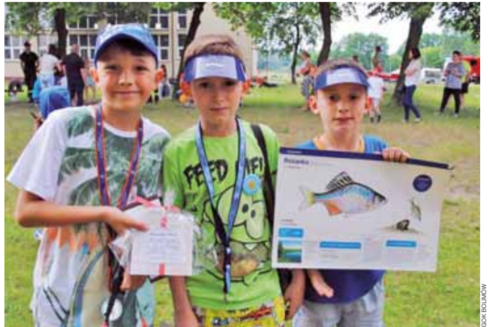
Ci chłopcy zdobyli nagrody w konkursach organizowanych podczas pikniku, m.in. przez Polski Związek Wędkarski z Bolimowa.