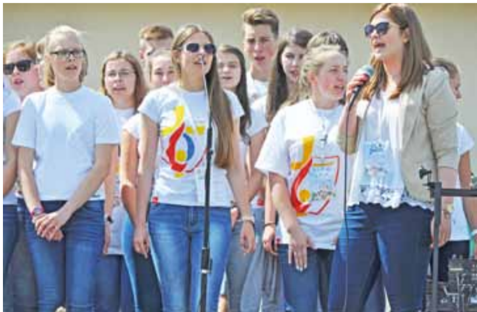
Wolontariusze Świątowych Dni Młodzieży śpiewali nie tylko piosenki religijne, ale też i hity dico polo.

Łowicka potańcówka w Bednarach strzałem w dziesiątkę. str. 26