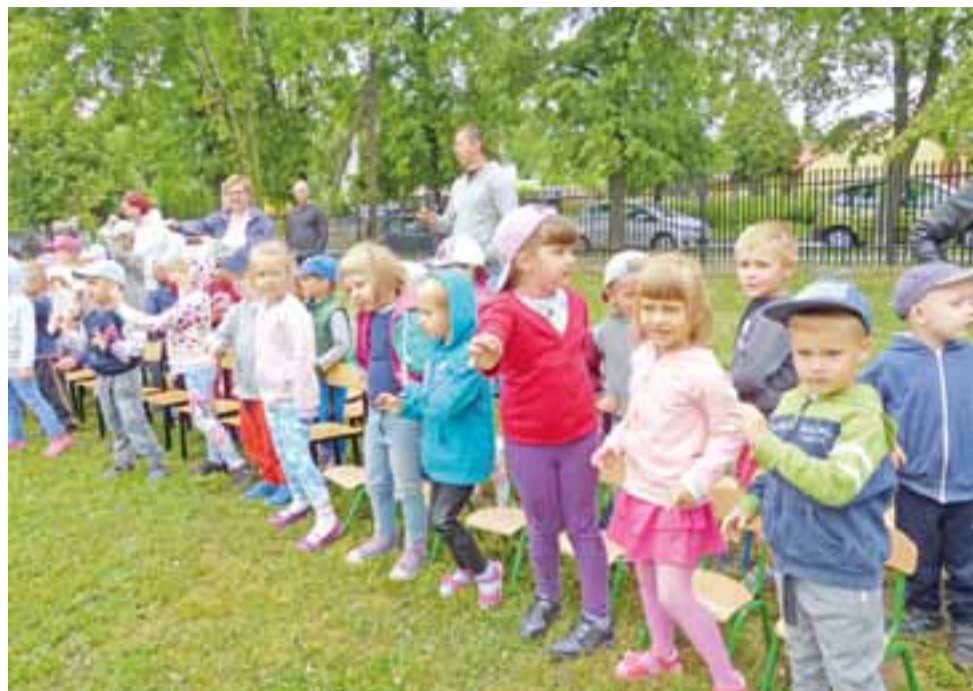
Dzieci z widowni po każdej konkurencji miały okazję poruszać się do takich utworów jak np. „Kaczuszki” czy „Ruda tańczy jak szalona”.