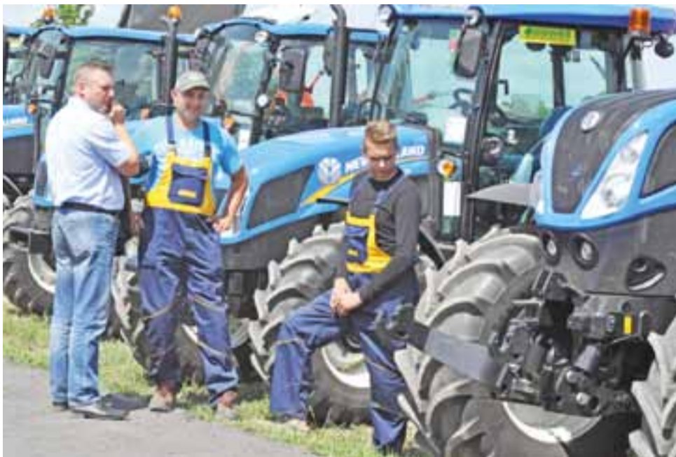
Ciągniki New Holland o różnych wielkościach i mocach zaprezentował m.in. Agroskład z Popowa.