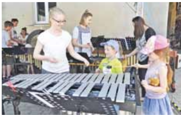
Muzycy z zespołu Żyrardowskie Uderzenie przywieźli ze sobą profesjonalne instrumenty – niektóre przypominały olbrzymie cymbalki.

Nie zabraknie też kiełbasek z grilla czy innych przysmaków na stoiskach gastronomicznych. tm