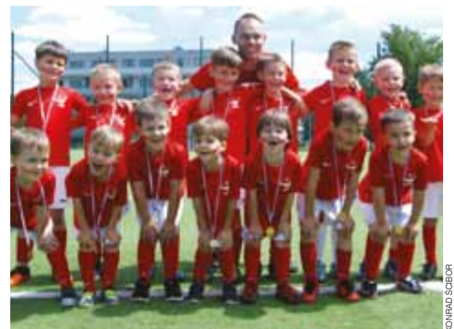
Najmłodszy z uśmiechem na twarzy marzą o piłkarskiej karierze.

– Tego dnia najważniejszy był jednak mecz Polska – Irlandia Płn., dlatego nasi mali piłkarze grali z biało-czerwonymi barwami na twarzach, a na koniec wszyscy wykrzyknęli „Kto wygra mecz?”