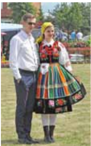
Wiele osób chętnie fotografowało się z dziewczętami w strojach ludowych z zespołu „Blichowiacy”.

Piknik już od godziny 11.00 cieszył się sporym powodzeniem. – Mamy już na parkingach ponad 70 samochodów, a wiele osób przyszło pieszo – raportowali uczniowie szkoły na Blichu, którzy tego dnia pełnili funkcję parkingowych i kierowali ruchem na – bądź co bądź – sporym terenie z licznymi budynkami na Blichu. Dodajmy, że tego dnia każdy z budynków i każdą ze szkolnych pracowni czy też budynków warsztatowych można było zwiedzić. Można było też obejrzeć park maszynowy jakim dysponuje szkoła, która prze-