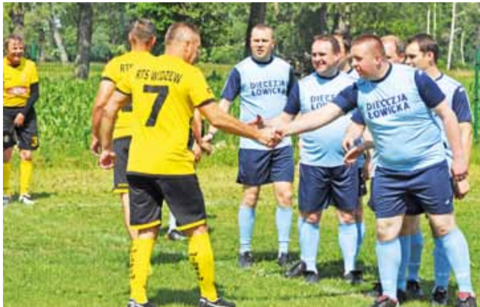
Drużyna piłkarska diecezji łowickiej regularnie trenuje na Orliku przy ul. Grunwaldzkiej w Łowiczu. Pierwsze dwie bramki dla Widzewa padły jednak już w pierwszych minutach meczu.

Można było też usłyszeć bravurowe wykonanie (tak, nie bójmy się powiedzieć, że właśnie