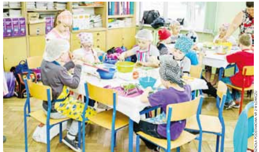
Przed przystąpieniem do zajęć kulinarnych dzieci – jak prawdziwi kucharze – ubrały się w fartuski, na głowy założyły chusteczki lub czepek.