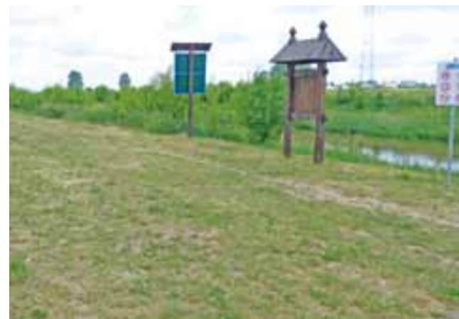
Bar powstanie pomiędzy wałem a korytem rzeki, w bezpośrednim sąsiedztwie przystani kajakowej.

Jak wyjaśnia rzecznik, póki co nad rzeką udało się zorganizować plażę i przystań kajakową, ale nie ma zezwoleń na to, by było tam kąpielisko. Zgodnie z jego zapowiedzią, Urząd Miejski w Sochaczewie będzie się jednak starał o to, by kąpiele były tam możliwe w przyszłym sezonie letnim. ■