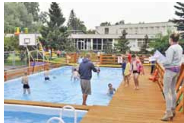
Tak prezentuje się basen w Sandomierzu. Podobnie ma to wyglądać na Kaliskiej w Łowiczu.