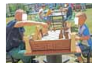
Może partyjka szachów? Do wyboru były różne gry.

Dzień Dziecka został przygotowany w ramach programu „Tato,