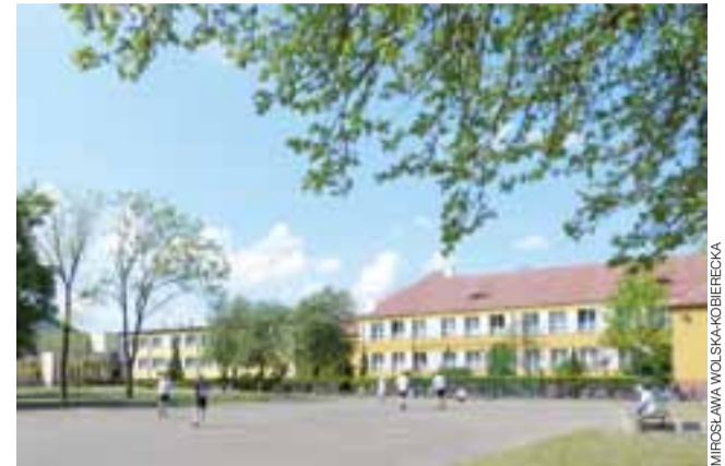
Obecnie uczniowie „Dwójki” korzystają z boiska asfaltowego, którego stan pozostawia wiele do życzenia.