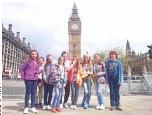
Uczniowie ZSP w Łyszkowicach pod Big Benem.