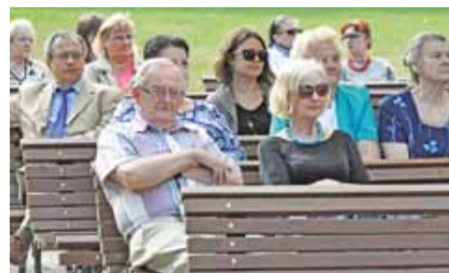
Mimo że zbliżała się godzina meczu piłki nożnej pomiędzy reprezentacją Polski a Irlandii Północnej, przed sceną muszli koncertowej zgromadziło się około 50 melomanów.