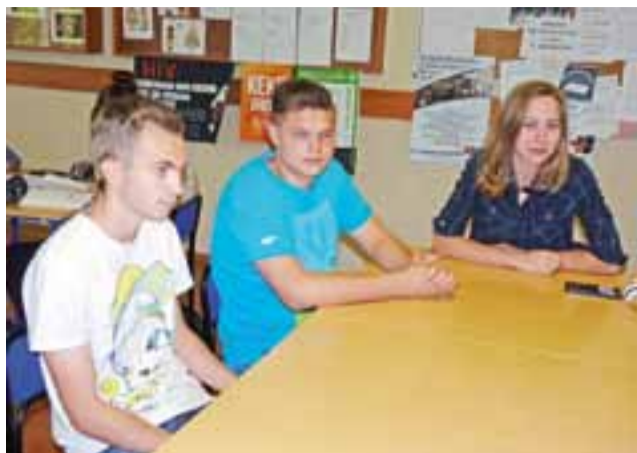
Uczniowie „Ekonomika” spotkali się z radnymi miejskimi na szkolnym korytarzu.