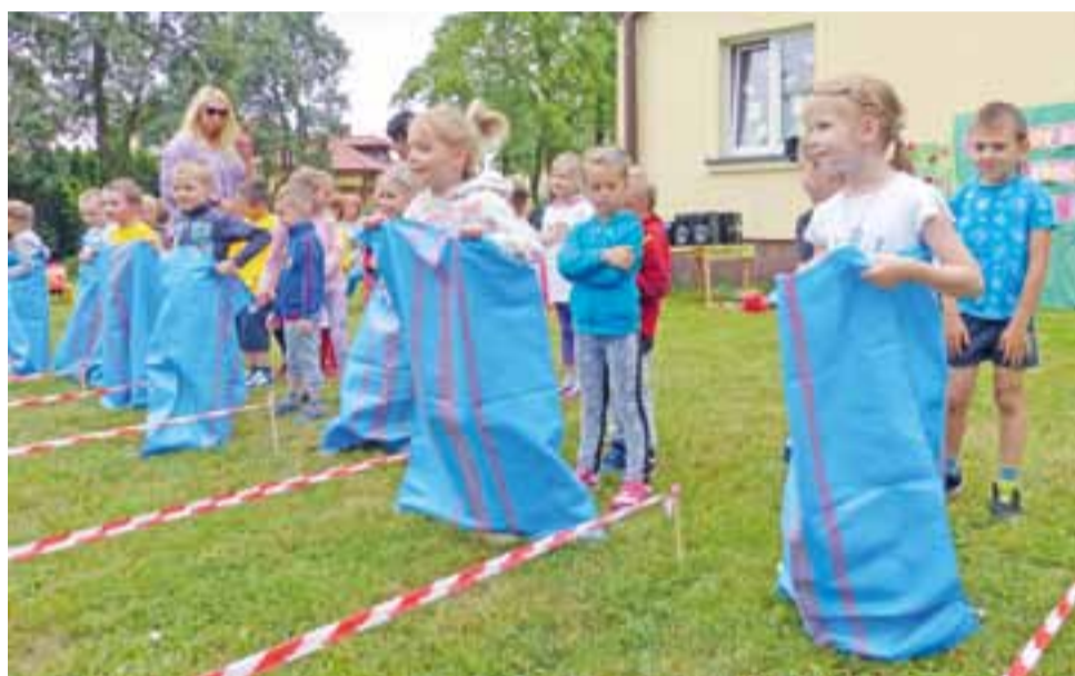
Jedną z konkurencji międzyprzedszkolnej olimpiady, wcale nie łatwą, był bieg w workach.