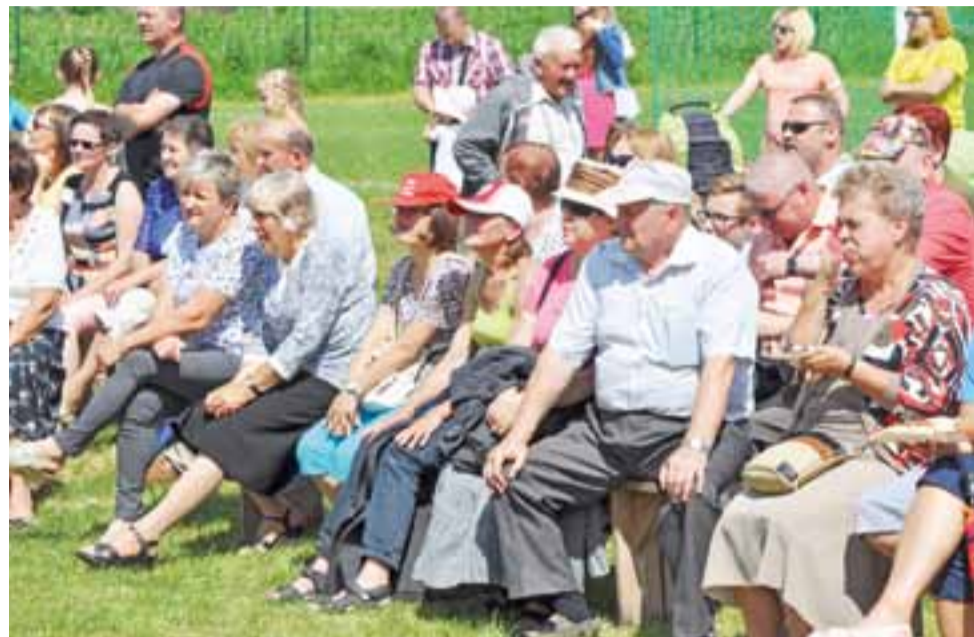
Na piknik przychodzą całe rodziny: dzieci, rodzice oraz babcie i dziadkowie.

Jamno | Parafia Chrystusa Dobrego Pasterza i wolontariusze ŚDM