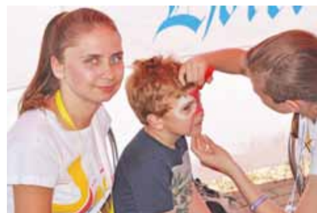
Dużym powodzeniem cieszyło się malowanie twarzy – szczególnie w barwy narodowe.

wsparcia finansowego młodzieży przed Świątowymi Dniami Młodzieży. – Bardzo mi się podobało, nie tylko ilość atrakcji i wydarzeń, ludzi zaangażowanych, ale przede wszystkim wy-