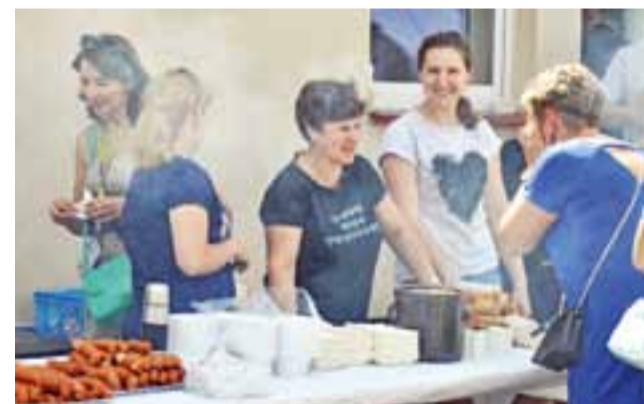
Parafianki przygotowały poczęstunek. Serwowały m.in. chleb ze smalcem ze skwarkami.