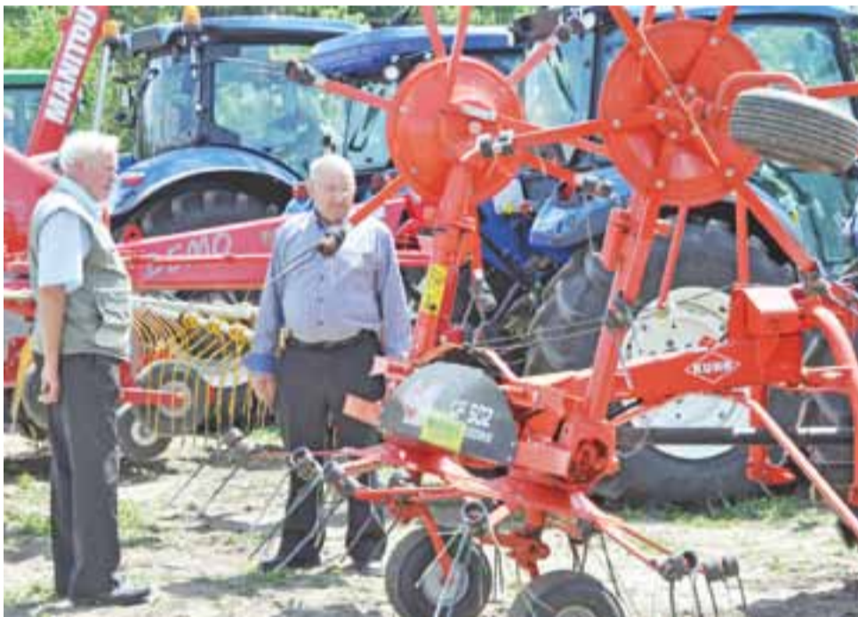
Przetrasarka karuzelowa do siana i zielonki. Rolnicy wiedzą, o co chodzi i wiedzą też, że takie urządzenie może kosztować nawet kilkadziesiąt tysięcy złotych.

cież ma też blisko 100-hektarowe gospodarstwo.