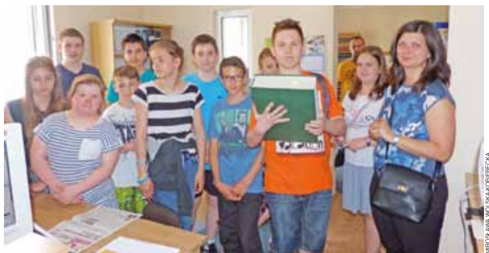
Uczniowie „Siódemki” brali do rąk oprawiony rocznik „Nowego Łowiczanieca”, aby przekonać się, że waży on kilka kilogramów.

Nie zaprzeczaliśmy, wyjaśniając jedynie, że warsztat dziennikarski znacznie odbiega od stylu szkolnych wypracowań, rozprawek itp. prac. mwk