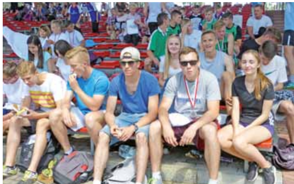
Po biegu młodzież mogła usiąść na widowni przed muszą koncertową, posilić się i uzupełnić płyny w organizmie.

Łowicz | Pamiętając o rocznicy chrztu Polski