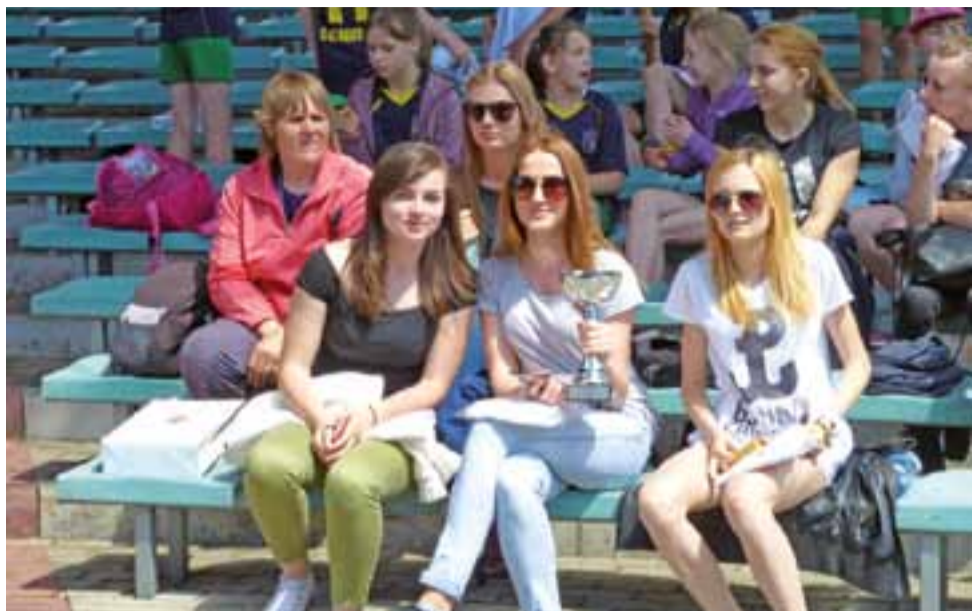
Ekipa z II LO w Łowiczu w biegach z okazji rocznicy chrztu Polski zajęła II miejsce wśród szkół podnagimnazjalnych.