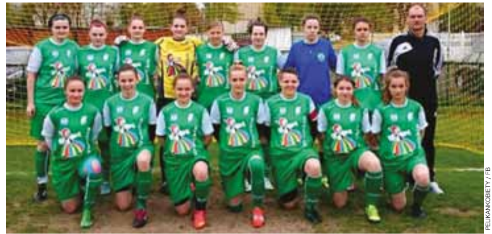
Zespół dziewczyn Pelikana Łowicz zakończył rozgrywki na 2. miejscu.

Łowiczanki były bardzo blisko wygranej ligi. Zabrakło tylko 4 punktów. Jednak nie ma się co martwić, bo ten awans oznaczałby sporo kłopotów. Już w trakcie sezonu trener Wilk mówił o kłopotach kadrowych na treningach. Większość dziewczyn jest spoza Łowicza i brakuje im czasu na dojazdy na treningi. Gra w I lidze wiązałaby się z wieloma zmianami – kadrowymi i organizacyjnymi. Trzeba się cieszyć, że Pelikan-