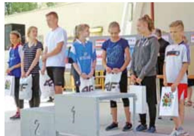
Na scenie przy muszli koncertowej ustawiała się młodzież, która nie tylko pobiegła na 1.050 m, ale też udzieliła bezbłędnych odpowiedzi w teście historycznym.

Wśród gimnazjów najlepsza była ekipa ze szkoły pijarskiej