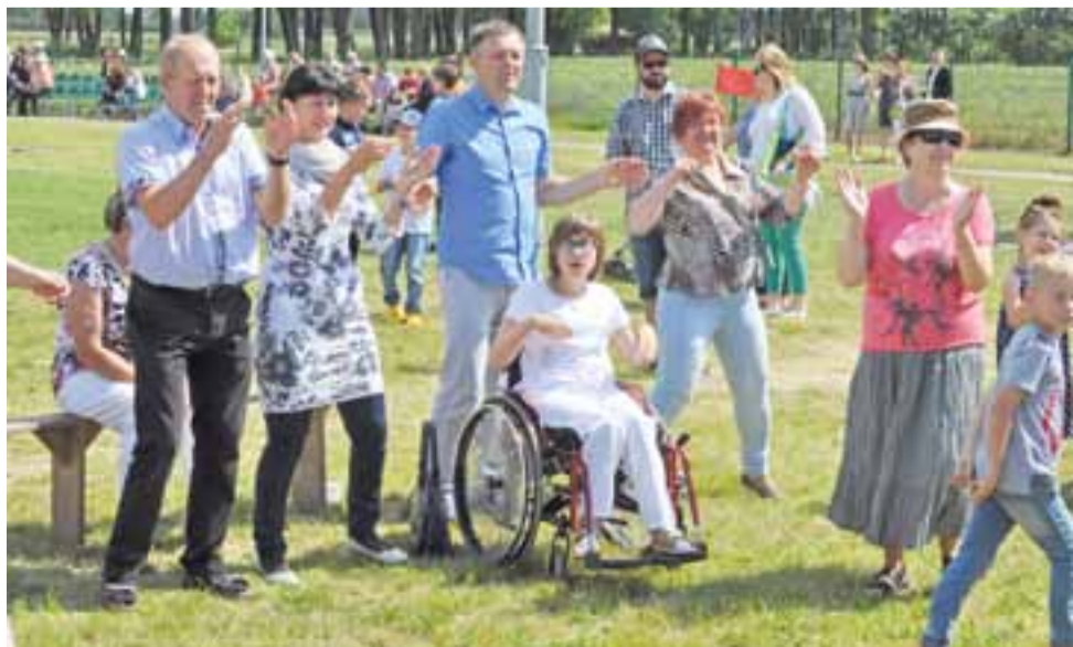
Publiczności nie trzeba było długo zachęcać do śpiewania i klaskania w dłonie w rytm muzyki.

Wolontariusze zapowiedzieli też, że będą chcieli zorganizować podobny piknik również w przyszłym roku. Warto. ■