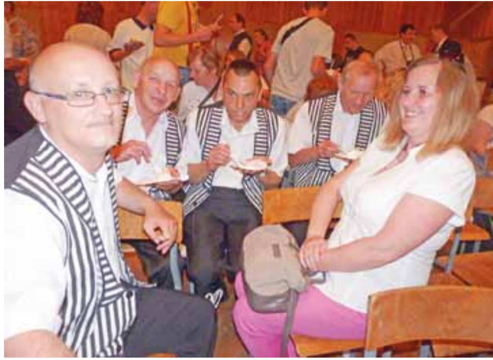
Zespół z DPS Wojszyce najpierw prezentował się na scenie, a później wszyscy jedli jubileuszowy tort.