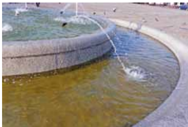
Kolor wody w fontannie zamiast lazurowego bardziej przypomina zielono-brązowy.

Przed rozpoczęciem każdego sezonu, również tegoroczne-