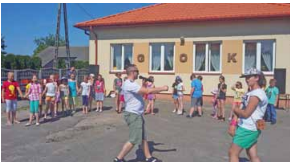
Zabawa taneczna na placu w Bobrownikach, przy filii Gminnego Ośrodka Kultury.

Drenaż zostanie wykonany również wokół nowo budowanej części, żeby zapobiec wilgotnieniu ścian w przyszłości. Roboty mają zostać przeprowadzone podczas wakacji. mak