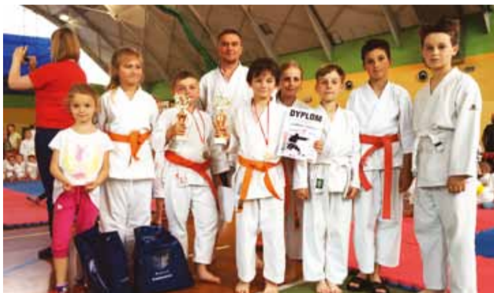
Młodzi karatecy z sekcji w Bielawach i Głownie