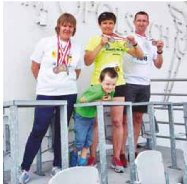
Łowicki medaliści z dżurkami i medalami.

– Start w mistrzostwach uważam za udany. Cieszy brązowy