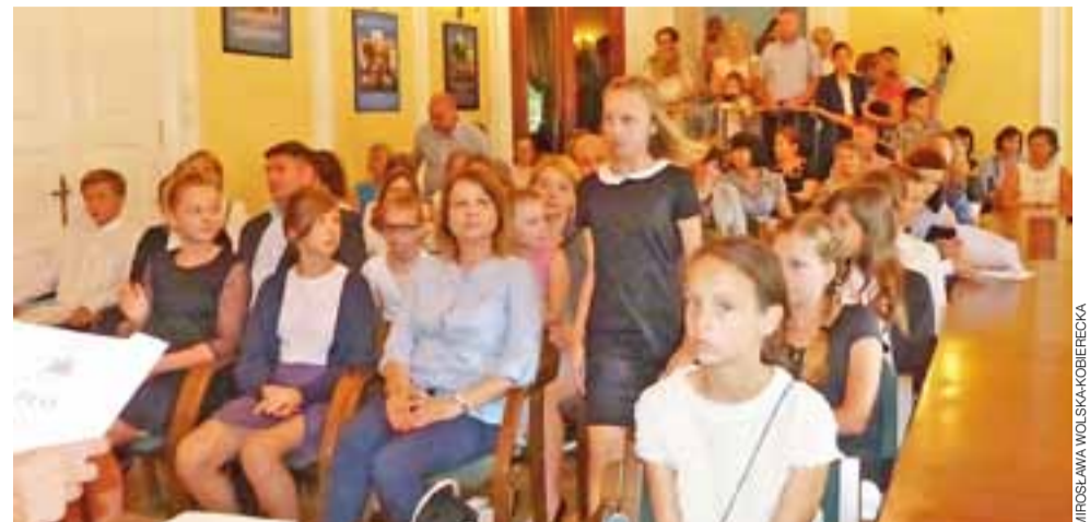
Stypendyści i ich rodziny wypełnili salę radziecką ratusza.

Łowicz | Burmistrz wręczył stypendia 127 uczniom