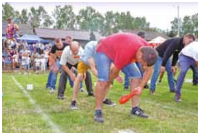
Na zdjęciu drużyna z Bąkowa Dolnego w konkurencji na „Najrzęczniejszą wieś”, polegała ona na przekazaniu sobie jak największej ilości ziaren fasoli.

Turniej Wsi okazał się strzałem w dziesiątkę, gdyż świetnie bawili się w czasie jego trwania zarówno uczestnicy, jak i widzowie.