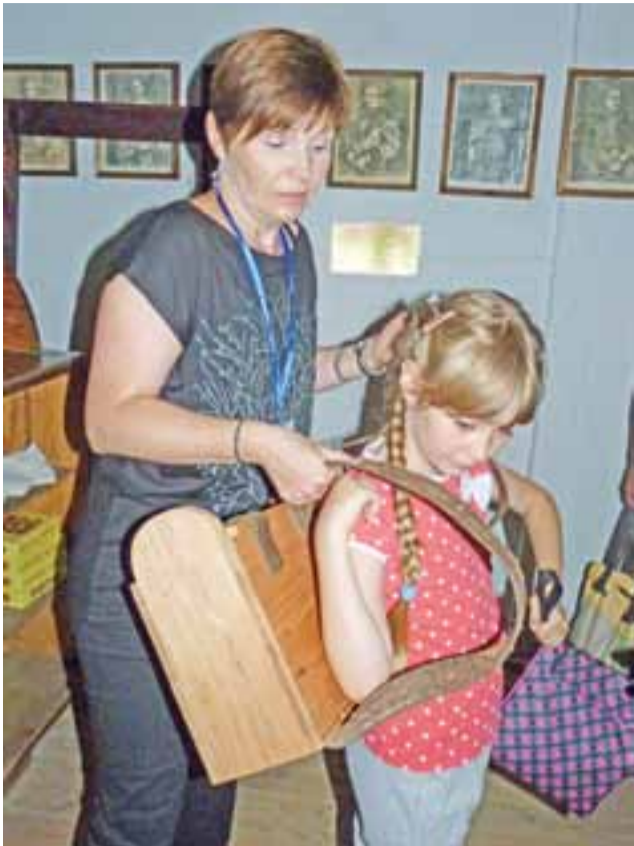
Ochotnicy i ochotniczki sprawdzali, jak ciężki i niewygodny był – wykonany z drewna – plecak ucznia dawnej szkoły wiejskiej.