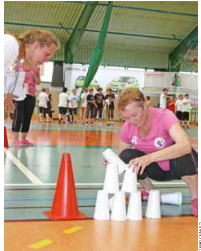
Uczestniczka zawodów z Tomaszowa Mazowieckiego układa piramidę z plastikowych kubków.