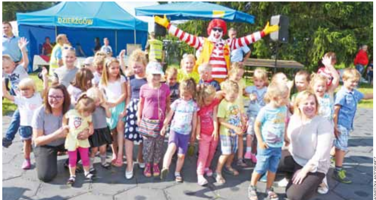
Jedną z atrakcji festynu w Bełchowie, była możliwość zrobienia sobie wspólnego zdjęcia z Ronaldem McDonaldem.