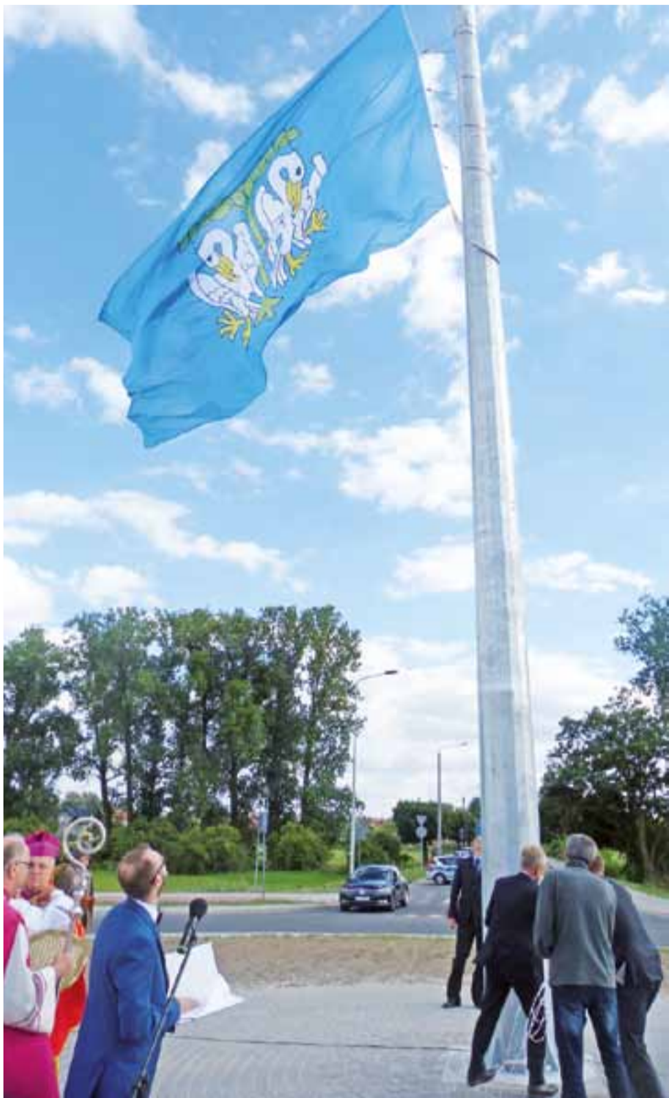
Flaga Łowicza powiewająca nad Rondem Niepodległości.