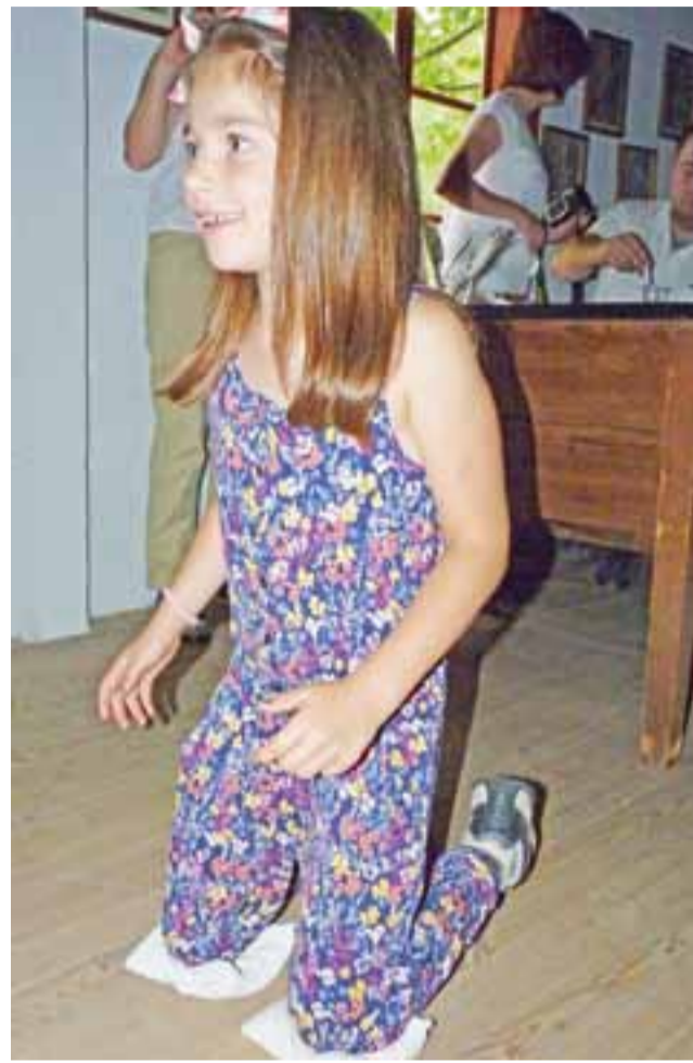
Jedną z kar w dawnej wiejskiej szkole, np. za stawianie kleksów podczas lekcji kaligrafii, było klęczenie na woreczkach wypełnionych grochem.