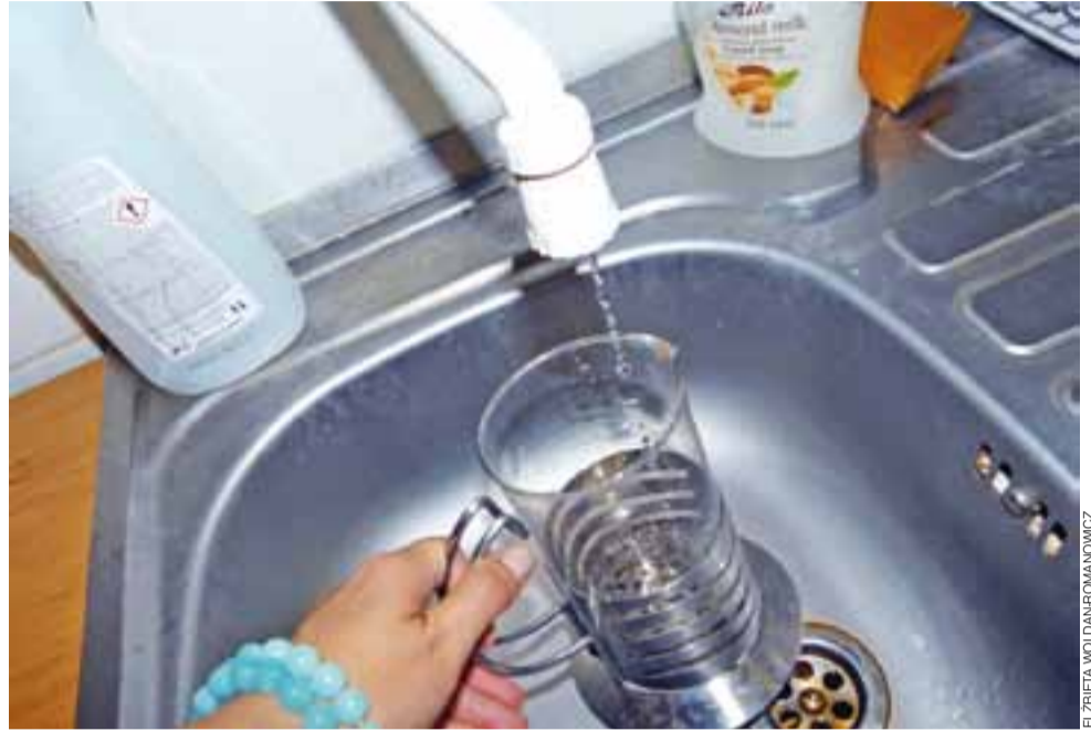
Niskie ciśnienie wody, a nawet zupełnie suche kran. Tak w najbardziej upalne dni bywa w domostwach położonych na końcowych odcinkach wodociągu w gminie Bielawy.

Dobrze rokuje natomiast nieużywana od 15 lat studnia przy