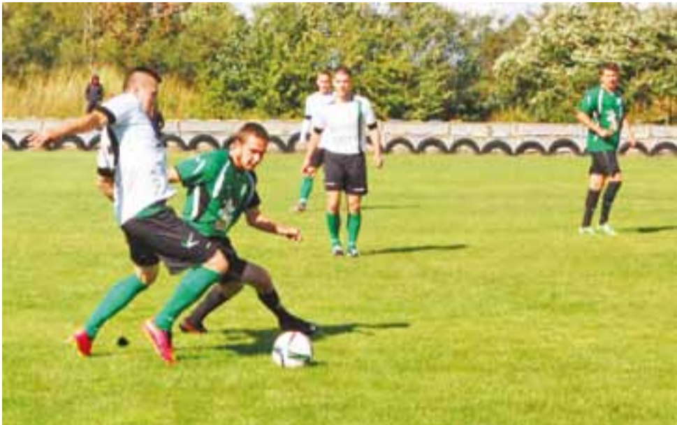
Z Wartą było to tylko spotkanie towarzyskie, ale piłkarze obu stron grali twardo i wzajemnie się nie oszczędzali.