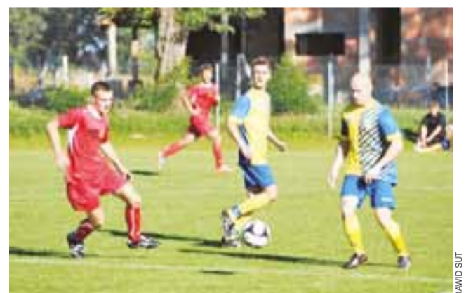
Gracze Olimpii Chaśno zagrają w Pucharze Polski z Victorią Zabostów.