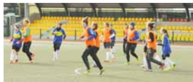
Sezon 2015/2016 Pelikanki zakończyły na pozycji wicelidera II ligi.