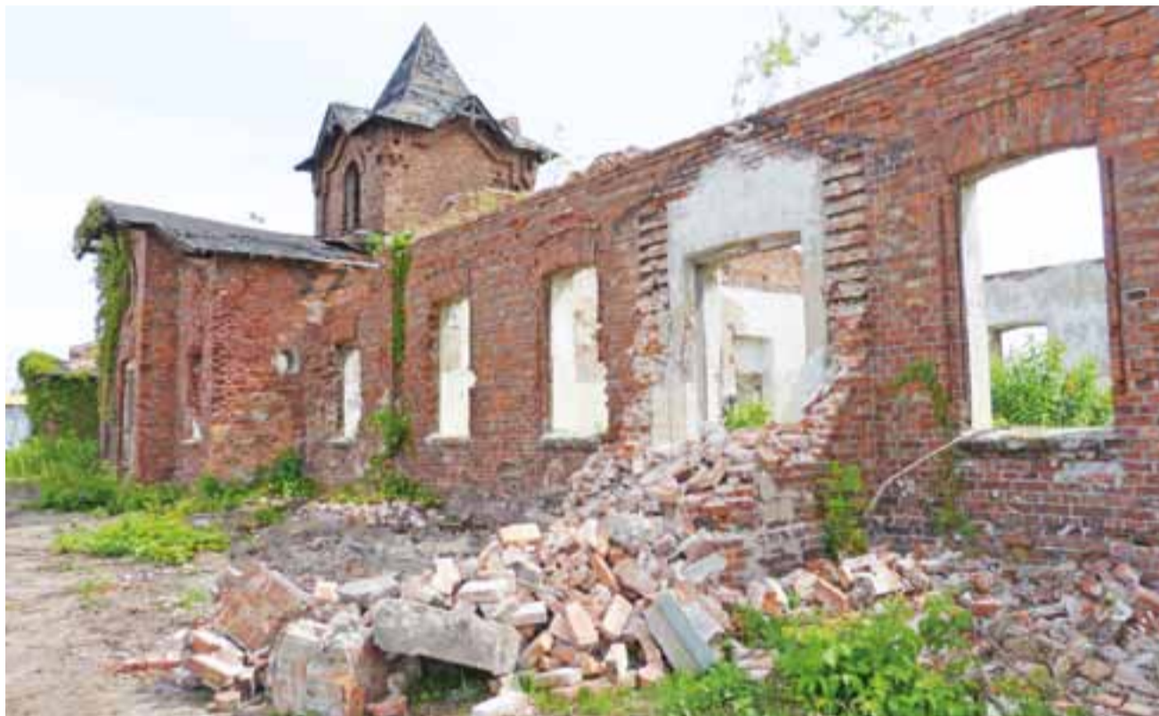
Tak wygląda obecnie budynek rzeźni przy ul. Nadburzańskiej: pozostały mury bez dachu, na których oplata się dzikie wino.