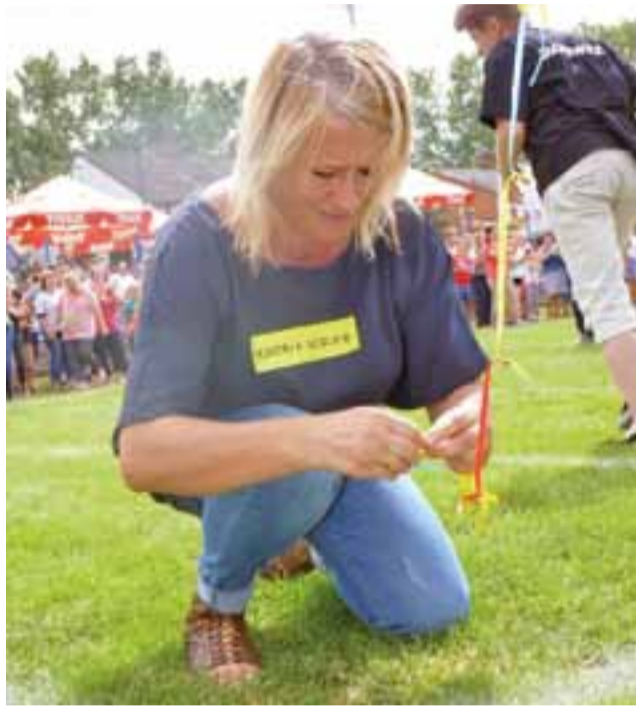
A tu już konkurencja „Najdłuższa wieś”. Zawodniczka z sołectwa Bogoria Górna dowiazuje kolejną tasiemkę do „liny” powstającej na czas.

Drużyny musiały poradzić sobie w konkurencjach na „Najbogatszą wieś” – zabawie dla dzieci, która polegała na uzbieraniu w skarbnice soltyśa jak największej „kwoty”, poprzez wrzucanie do niej kartonowych monet; „Najdłuższą wieś” – tu mogły wykazać się panie, które tworzyły „liny” z kolorowych tasiemek; „Najrzęczniejszą wieś” – w tej rywalizacji wzięli udział panowie, a zwyciężała ekipa, która przekazała sobie najwięcej ziaren fasoli, stojąc do siebie tyłem i podając je sobie dołem; oraz konkurencja dodatkowa na „Najzdolniejszą wieś” – czyli zespołowe prezentacje artystyczne. Grupa z KGW „Zdunianki” wystąpiła z parodią eurowizyjnego hitu Donata i Cleo „My Słowianie”, który w ich wykonaniu brzmiał „My