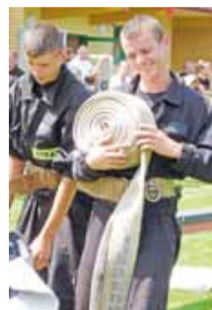
A po zawodach trzeba zwinąć węże i przygotować je do kolejnego startu.

Laureatki III miejsca w zawodach, ochotniczki z OSP Bobrowniki, podzieliły opinię o tym, że zawody sportowo-pożarnicze dostarczają wiele frajdy i dają możliwość wspólnego spędzenia czasu wolnego. – Swoją przygodę z OSP zaczęłyśmy, kiedy miałyśmy po 16 lat, o matko to już 7 lat temu – uświadomiły sobie nagle dziewczyny. W ciągu tych 7 lat