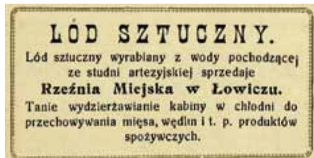
Prasowe ogłoszenie o sprzedaży lodu sztucznego.