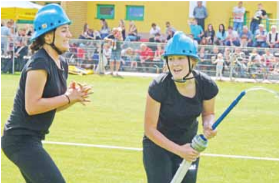
Radość zawodniczek z OSP Mysłaków, po bardzo dobrze wykonanym ćwiczeniu bojowym.

Po podliczeniu wszystkich punktów wyłoniono zwycięzców. W grupie mężczyzn mistrzostwo sprzed roku roku obronili drhowie z OSP Dzierzgów, którzy zdobyli 108 pkt. Na miejscu II, z minimalną stratą, uplasowali się ochotnicy z OSP Bednary (drużyna 2) – 108,7 pkt., a na III OSP Bednary Kolonia – 114,9 pkt.