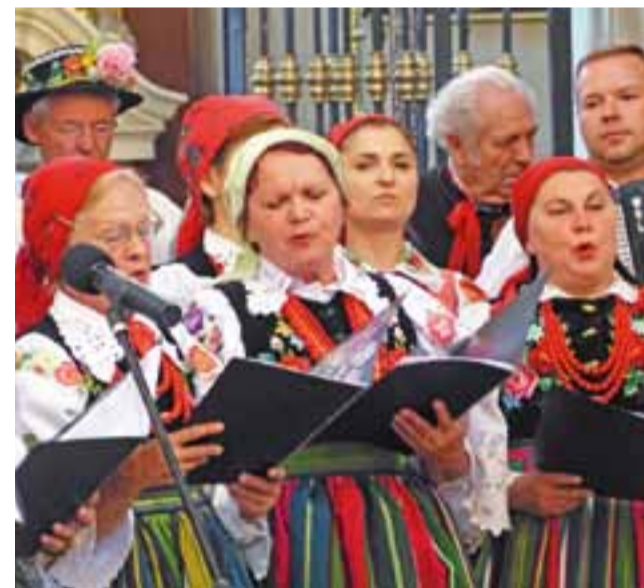
Zespół Śpiewaczy „Ksinzoki” śpiewa gwarą podczas mszy świętej w bazylice.