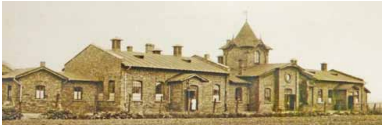
A tak wyglądała rzeźnia w latach swojej świetności. Zdjęcie pochodzi ze zbiorów Jacka Rutkowskiego i było opublikowane m.in. w albumie „Łowicz w XX wieku – kronika fotograficzna”.

Keszerzy zauważyli też prowadzone na terenie nieruchomości prace i byli zaniepokojeni czy budynek przetrwa, ponieważ jest unikatowy. Czy tak faktycznie będzie – przekonamy się za jakiś czas, gdy nowy właściciel podejmie decyzję czy będzie tam inwestował i w co. ■