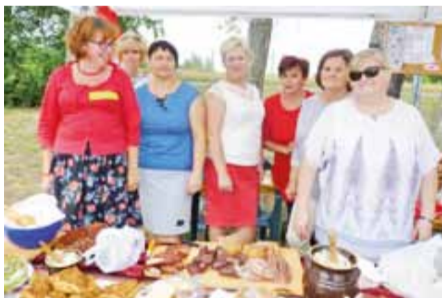
Panie z KGW Zdunianki przygotowały na swoim stoisku wiele przysmaków, które sprzedawały po symbolicznych cenach.