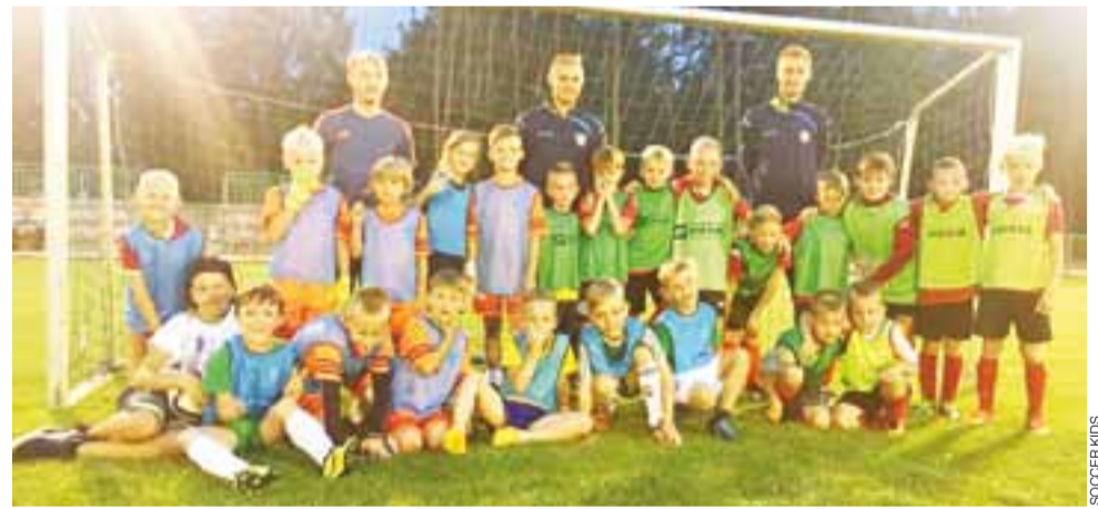
Drużyna Soccer Kids rywalizowała m.in. z SEMP-em Warszawa.

– Teraz wyjazd na urlop i czas wolny. Bardzo się z tego cieszę, bo muszę naładować akumulatory. Byłem od wszystkiego i był to pracowity rok, trzeba odpocząć. W sierpniu już trenujemy, zaś od września mamy kilka nowych pomysłów. Nie chcę ich zdradzać bo muszę mieć je dopięte na ostatni guzik. Na pewno będziemy chcieli jeszcze bardziej podnieść sobie poprzeczkę. Pierwszy rok był bardzo udany i to powód do satysfakcji, ale musimy stawiać kolejne kroki do przodu. ■