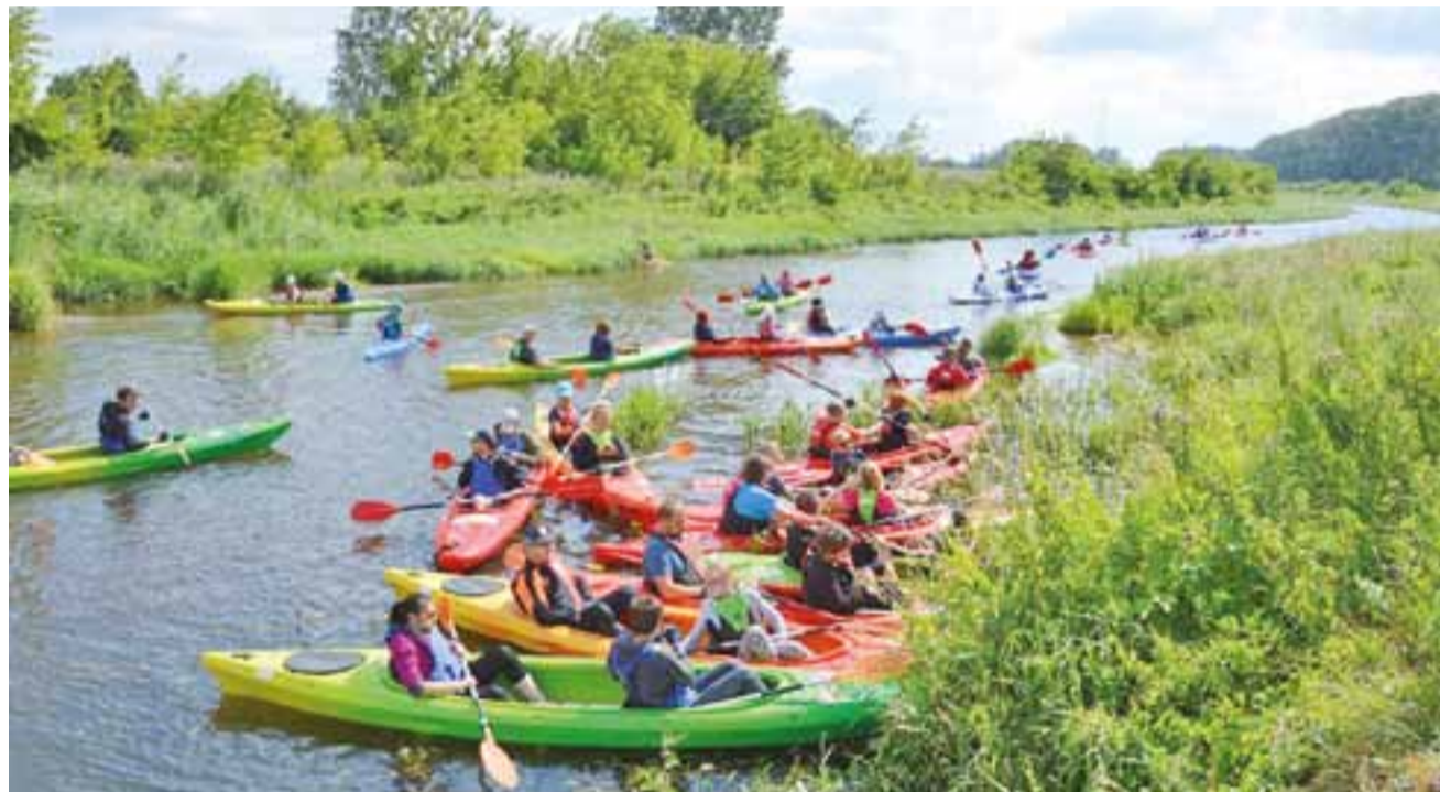
To był jeden z większych spływów w ostatnim czasie. Do Dachowej pod Sochaczewem popłynęło 56 uczestników, 28 kajakami.

Wydarzenie zostało zorganizowane przez PTTK przy współpracy z Urzędem Miejskim w Łowiczu. Wpisuje się ono w obchody 880-lecia naszego miasta. ■