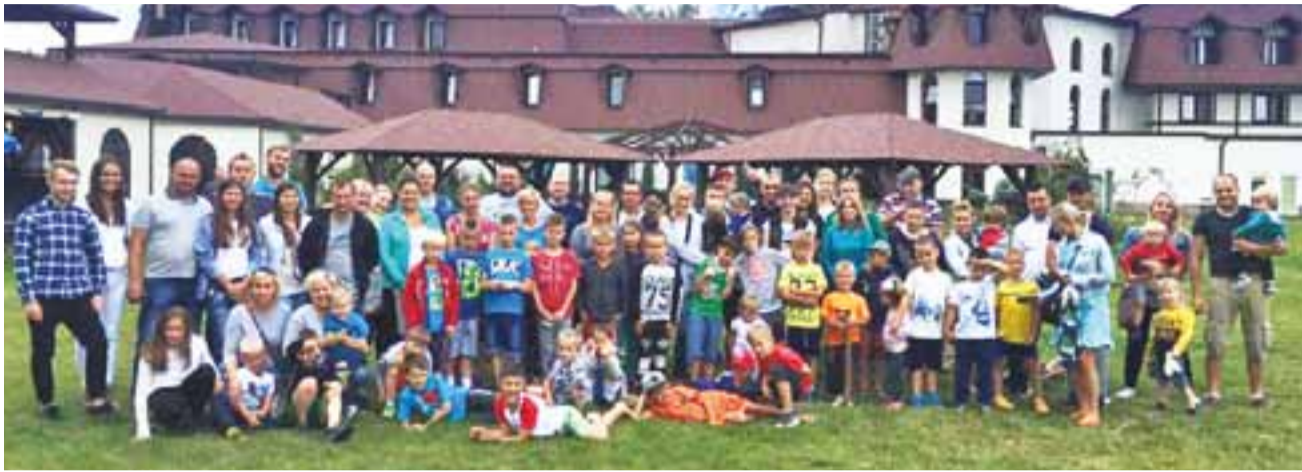
Dzieci wraz z rodzicami podczas obozu w Nieborowie.

– Jasne, że było szkoda. Chciałem jednak się utożsamić z trenerem, który nauczył mnie mnóstwo rzeczy. Byliśmy na drugim miejscu w grupie wschodniej, za Legią. To miejsce dawało awans do półfinałów Mistrzostw