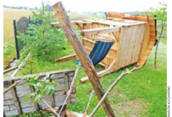
Zawalona ściana stodoły w Czyżewie, całkowicie zniszczona stodoła w Barciku Nowym i drewniany domek dziecięcy, który został uniesiony przez wiatr i rzucony kilka metrów dalej. To była silna nawałnica.

Gmina Sanniki | Po wichurze straż interweniowała kilkadziesiąt razy