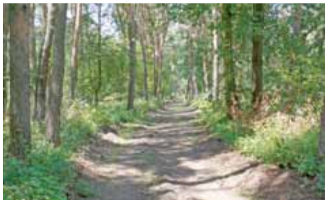
Tak wygląda nowa ścieżka, która powstała wzdłuż ul. Katarzynów w południowej części lasu miejskiego. Wcześniej w jej miejscu był pas przeciwpożarowy.

Ratusz zapowiada na koniec lipca zakończenie przebudowy ścieżki zdrowia i wykonanie ścieżki biegowej w Lesie Miejskim. Prace, których wartość wynosi 94 tys. zł, wykonują pracownicy Zakładu Usług Komunalnych.