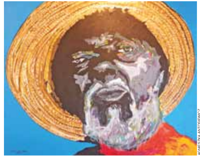
Obrazy Orlando Lazaro Ortegi przedstawiają autentycznych Kubańczyków, których młody malarz poznał w swoim życiu.

Bolimów | Wystawę można oglądać do 6 sierpnia, a obrazy są do kupienia