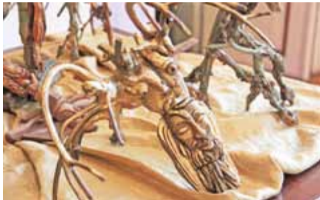
Niepokojące, pobudzające wyobraźnię, magiczne. Takie są rzeźby Zenony Klepaczki, prezentowane aktualnie na wystawie w pałacu w Walewicach.

Wystawę prac obydwu artystek można bezpłatnie oglądać w Walewicach do 20 sierpnia. ewr