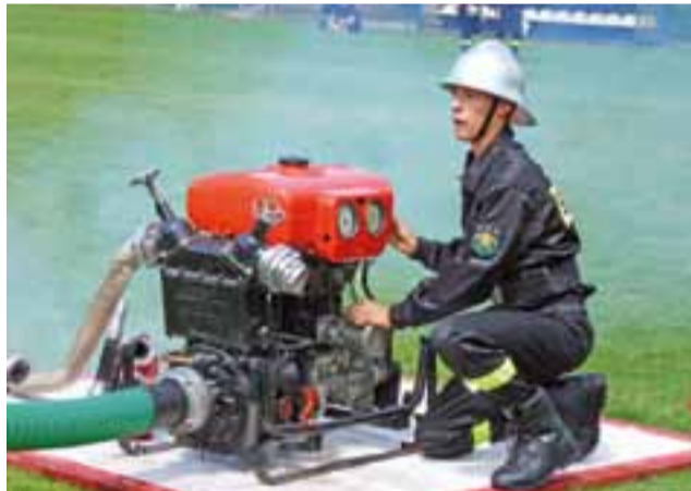
Mechanik-motopompista czekał na sygnał żeby puścić wodę do węży.