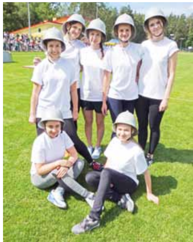
W grupie żeńskiej ponownie wygrały ochotniczki z OSP Sypień.

Ochotniczki z OSP Sypień jeszcze przed startem w ćwiczeniu bojowym powiedziały nam, że angażowanie się w działania