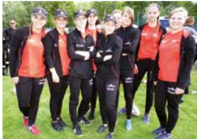
Laureatki III miejsca z OSP Bobrowniki.