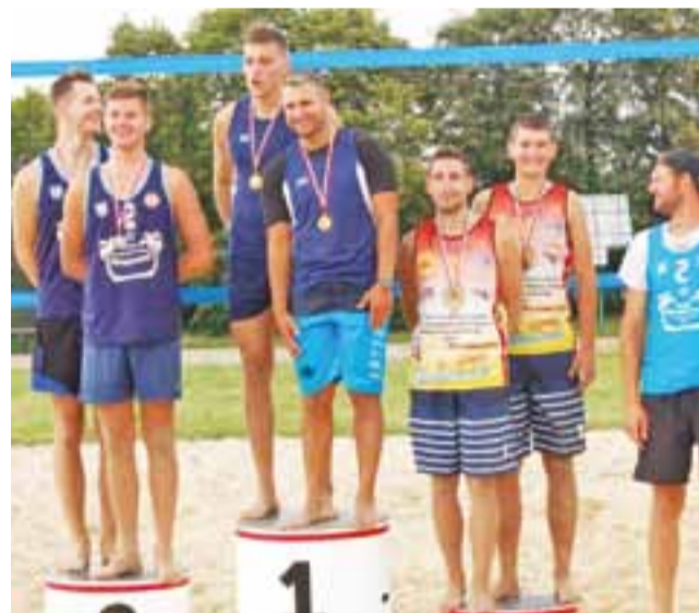
Najlepsze pary 1. turnieju eliminacyjnego OMŁ.