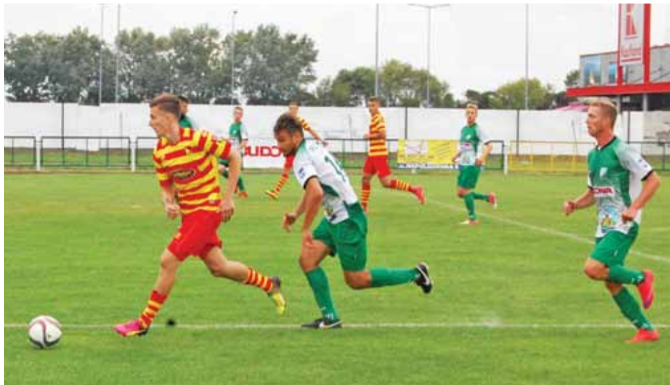
Defensywa Ptaków nie jest w tym sezonie monolitem. Łowiczanie w dwóch meczach stracili trzy bramki, a więc już 1/3 tego, co w rundzie wiosennej poprzedniego sezonu.