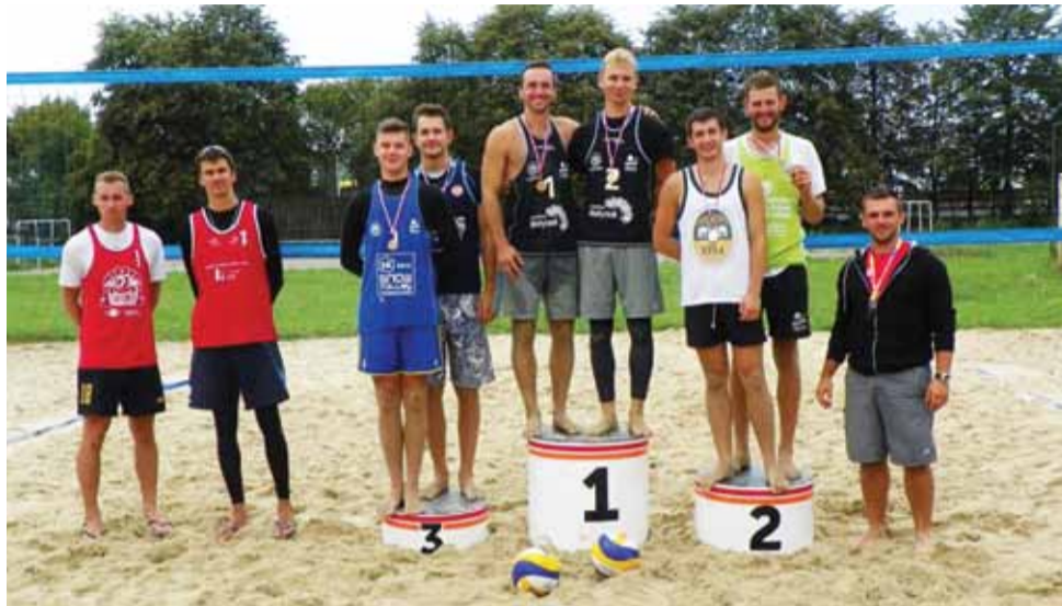
Najlepsze pary 3. turnieju eliminacyjnego OMŁ.