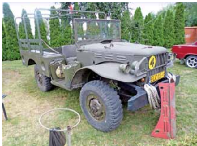
Ten wojskowy samochód był jedną z wielu atrakcji wystawy zabytkowej motoryzacji.