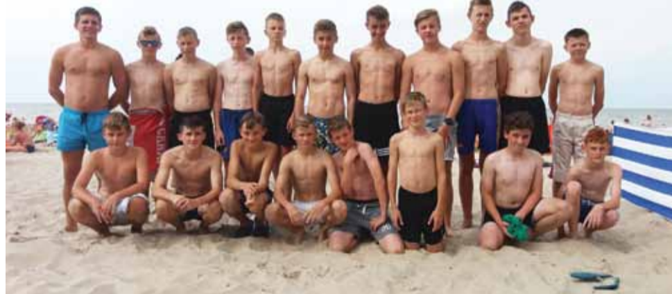
Zespół Pelikana 2002 nie przegrał meczu sparingowego podczas obozu

– Mielismy bardzo dobre warunki zakwaterowania, boisko treningowe było położone blisko naszego ośrodka i to był również duży atut. Zawodnicy w Pobierowie wykonali dużo ciężkiej pracy. Od pewnego czasu zaczynamy wprowadzać elementy taktyczne i chłopcy coraz lepiej realizują założenia taktyczne. Oprócz tego widać duży kolektyw w zespole i z tej maki może być fajny chleb. Jestem zadowolony z pracy treningowej i dużym kopem dla nas był mecz z Unią Warszawa, a w szczególności pierwsza połowa, która była zagrana perfekcyjnie. Jeśli chłopcy będą się tak dalej rozwijać, będą robić krok do przodu. Obóz ma przygotować zespół