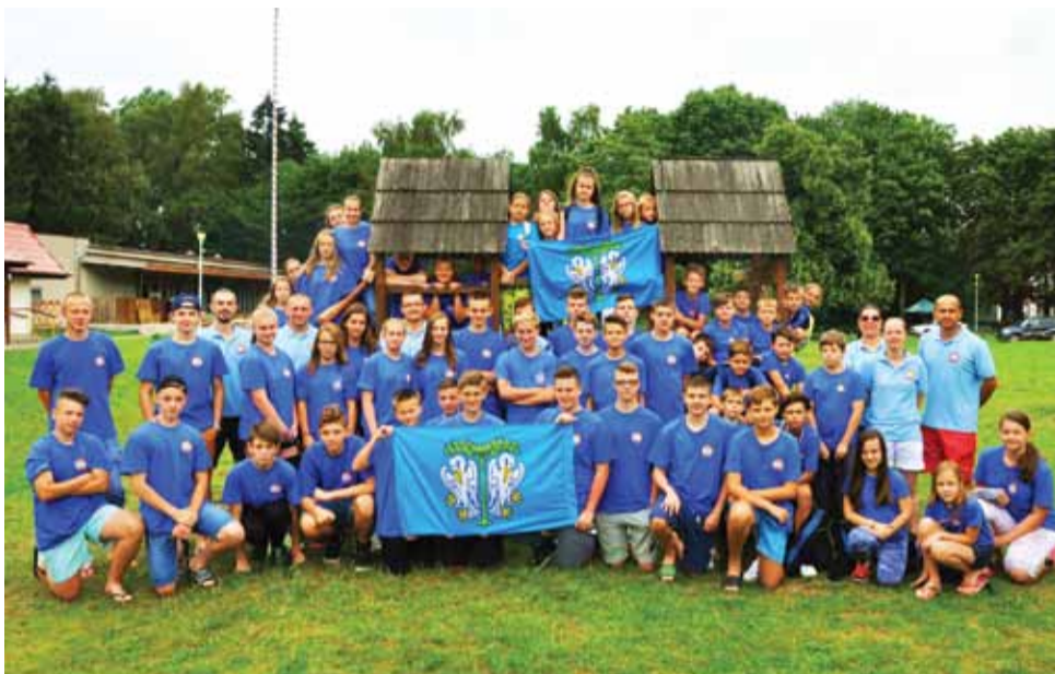
Koszykarki i koszykarze UMKS Książak na obozie w Jastrzębiej Górze

Pogoda nad Bałtykiem nie rozpieszczała, ale program treningów był bardzo napięty, zatem nie było czasu na nudę. Każda grupa miała jeden trening na dużej sali sportowej w pobliskiej Krokowej. Oprócz tego odbywały się treningi przygotowania fizycznego w terenie, w pobliskim lesie i na plaży. Łowiczanie zakwaterowani byli w ośrodku Meduza, który położony był na skraju pięknego klifu w pobliżu urokliwego Lisiego Jaru. Codziennie mieli zatem zapewnioną dużą dawkę jodu. Pobliski Lisi Jar to piękne miejsce w Jastrzębiej Górze, gdzie młodzi