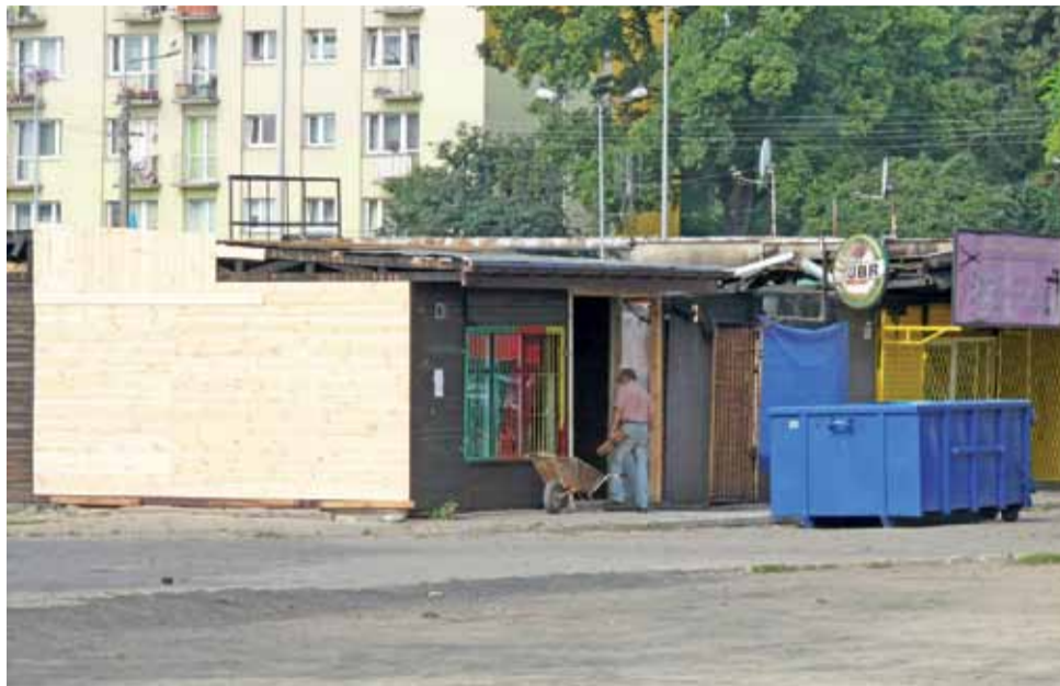
Właściciele punktów handlowych na miejskim targowisku już naprawiają swoje lokale zniszczone w wyniku pożaru, naprawiany jest dach i wymieniane są drewniane elementy konstrukcyjne.

Będzie to nowe zadanie, więc musi zostać wprowadzone przez radnych do budżetu miasta, musi