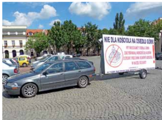
Baner na Starym Rynku w Łowiczu 15 sierpnia.

Przeciwnicy budowy kościoła wypowiadają się na facebookowym fanpage'u „Nie dla kościoła na Górkach”. To w ich środowisku powstał pomysł wystawienia baneru. Strona istnieje od końca czerwca, a ma już 685 „polubień” – zarówno od mieszkańców osiedla, jak i innych internautów, zaś post ze zdjęciem baneru po niespełna 2 dniach od zamieszczenia miał przeszło 9000 wyświetleń.