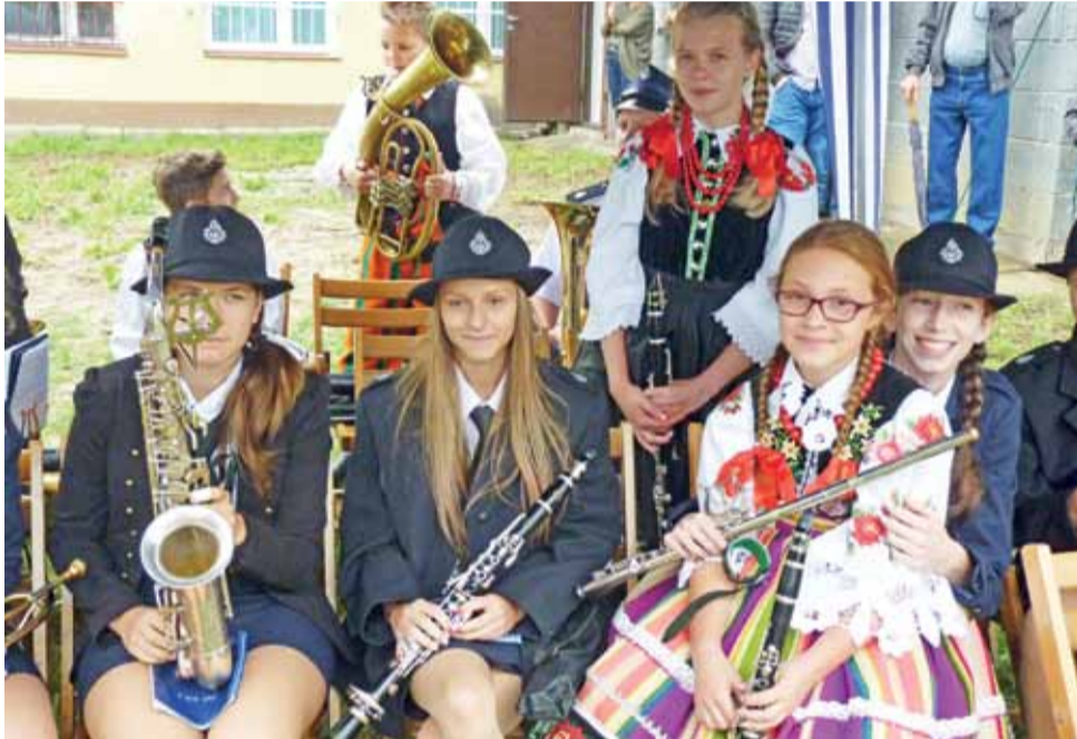
Jak widać na zdjęciu, między członkami zespołów działających na terenie gminy Kocierzew Płd. nie ma rywalizacji, a jest sympatia.

Około godziny 16 rozpoczął się koncert pod nazwą „Biesiada Polska”, zaś nieco później rozpoczął