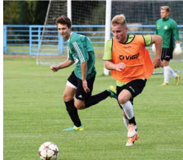
Laktoza nie zebrała się na Puchar Polski tydzień temu, a teraz pokonała w sparingu Widok!