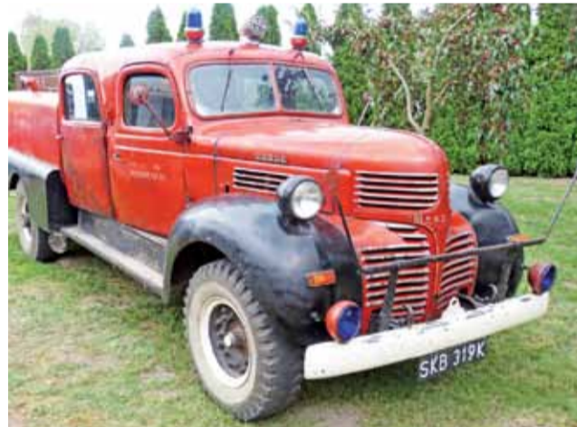
Ten Dodge z 1944 roku powstał jako samochód wojskowy. W Łodzi przerobiono go na samochód strażacki.