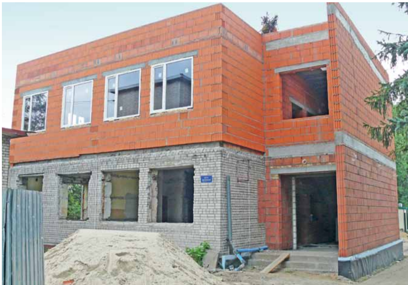
Nowy budynek administracyjny oczyszczalni miejskiej w Łowiczu będzie o piętro wyższy niż wcześniej. Znajdą się w nim m.in. laboratoria.