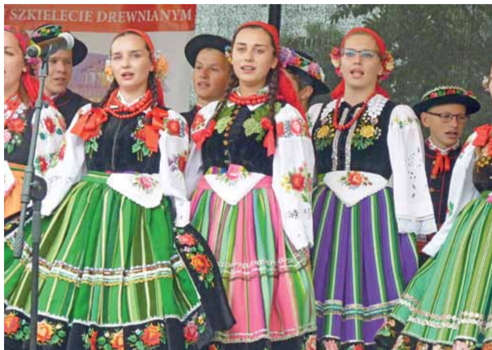
Na scenie prezentowały się m.in. zespoły folklorystyczne z terenu gminy Kocierzew Płd. Na zdjęciu dziewczęta z Regionalnego Zespołu Pieśni i Tańca „Boczki Chełmońskie”.