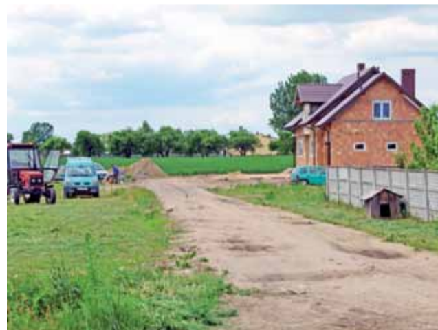
Przy ul. Przytargowej w Kiernozi powstają nowe domy, bez kanalizacji.

Kiernozia | Gmina czeka na ogłoszenie o naborze wniosków