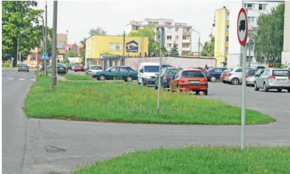
Jeden z parkingów przy ul. Starzyńskiego. Pas zieleni między nim a ulicą zostanie zmniejszony tak, aby samochody mogły parkować prostopadłe.

Pierwsze z przejść dla pieszych powstanie na wysokości biurowca Łowickiej Spółdzielni Mieszkaniowej. Dzięki niemu piesi idący z os. Starzyńskiego na miejski targ będą mogli przejść na drugą stronę ulicy Starzyńskiego nie narażając się na mandat za przechodzenie