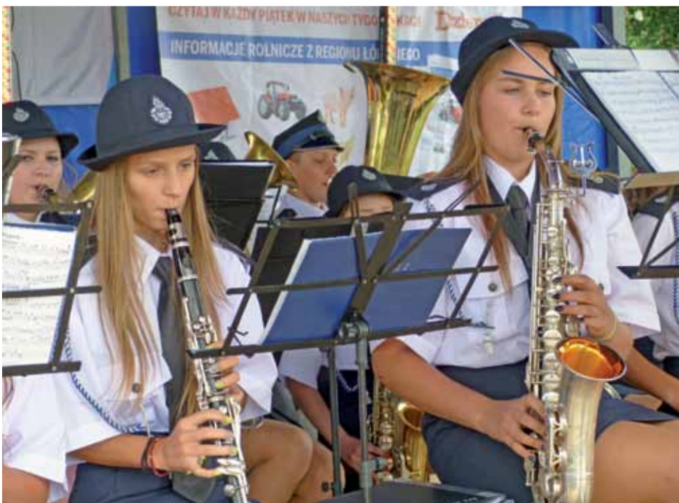
Na scenie zaprezentowała się orkiestra OSP z Wicia, tworzona w większości przez bardzo młodych ludzi.

Dochód z imprezy ma zostać poświęcony na cele charytatywne i inwestycje parafialne. tm