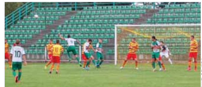
Dwie z trzech bramek w tym sezonie Pelikan strzelił po stałych fragmentach gry. Czy sprowadzenie Kamila Kuczaka poprawi statystyki?

Największym problemem w przypadku tego zawodnika może wydawać się brak w pełni przepracowanego okresu przygotowawczego. Latem był na testach w Rakowie Częstochowa, Stali Mielec, GKS Bełchatów, Gryfie Wejherowo czy ŁKS Łódź. Na tę chwilę nie jest w stanie rozegrać pełnych 90 minut.