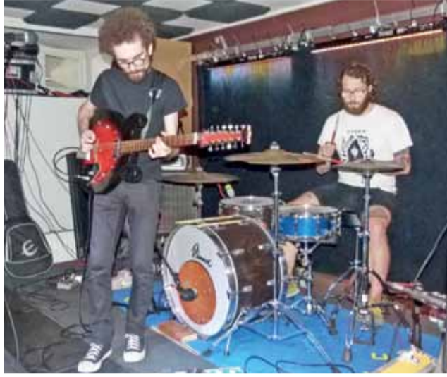
Wild Books na scenie w Pracowni.