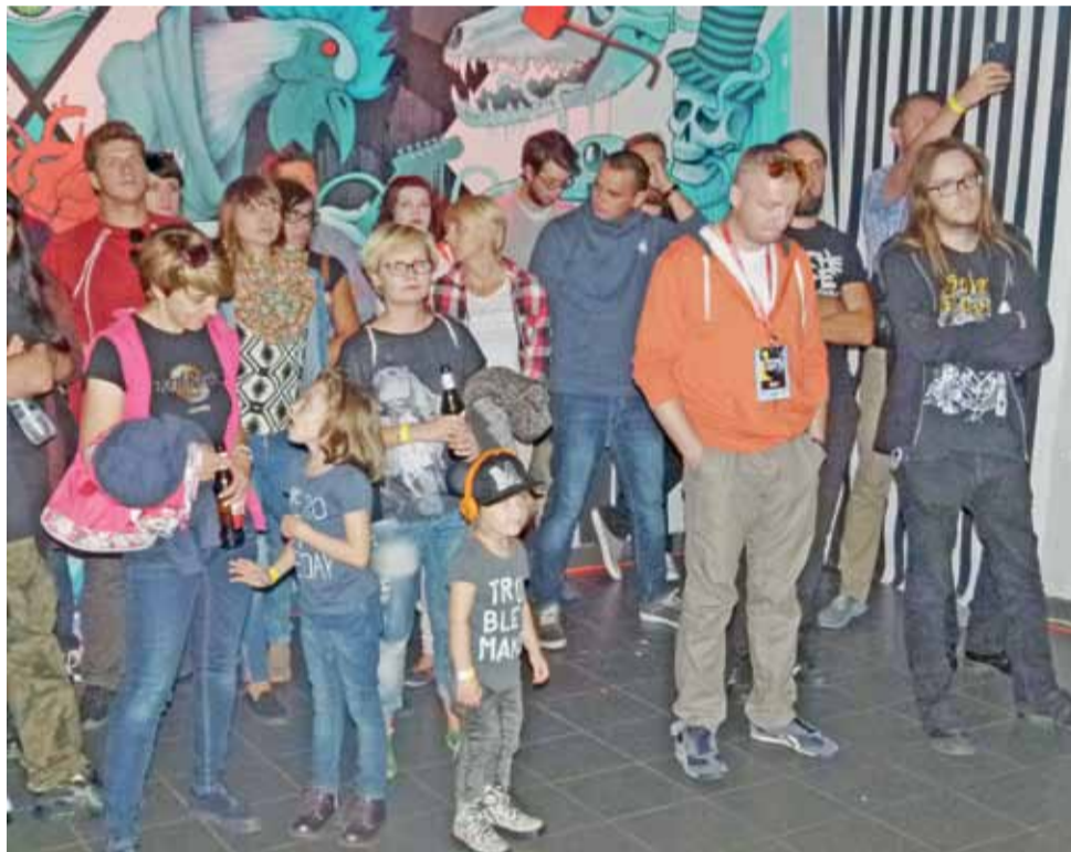
Publiczność festiwalowa w Pracowni w czasie występu The Pau.