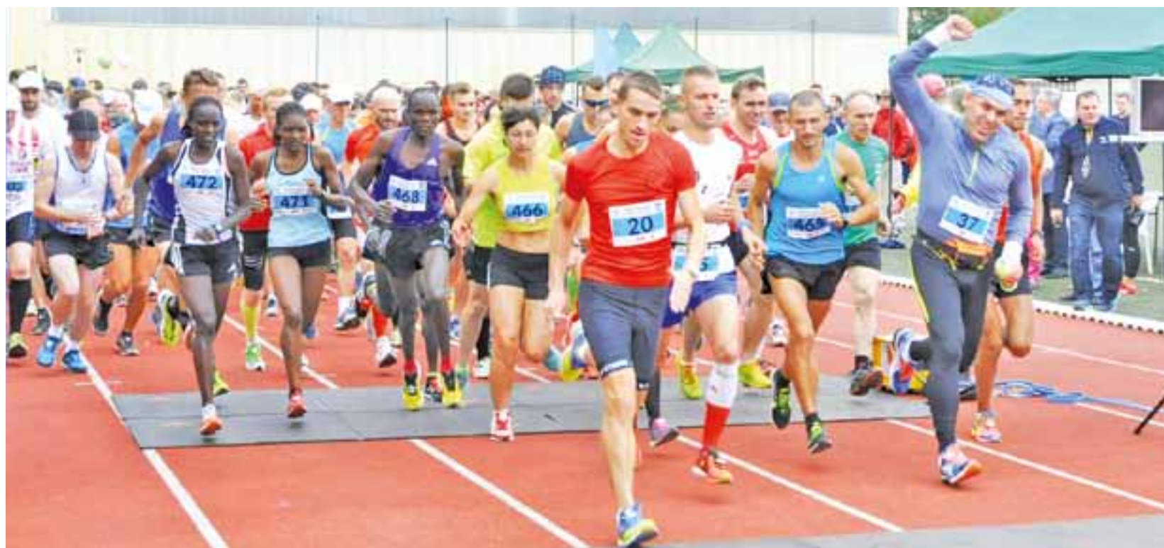
Biegacze o 11:15 ruszyli na ulice Łowicza - uśmiechnięci, pełni sił i zapału do rywalizacji.

Lekka atletyka | XXXV Łowicki Półmaraton Jesieni o Puchar Burmistrza Miasta Łowicza