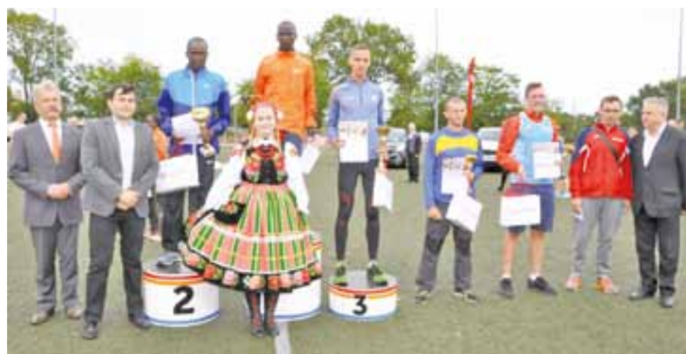
Najszczybsi biegacze 35. Półmaratonu Łowickiego

– Cieszę się z tego wyniku, ale po cichu liczyłem na nieco lepszy