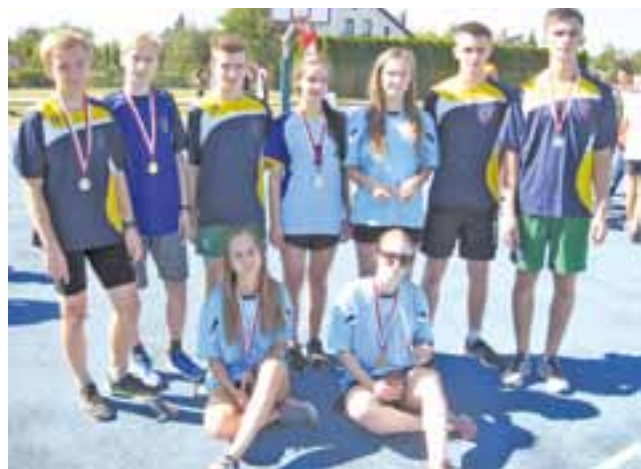
Reprezentanci Pijarskiej po biegu z medalami

Wśród młodych biegaczy można było zobaczyć przedszkolaków z Bolimowa, uczniów szkół podstawowych z Bolimowa, Humina i Kęszyc oraz z Kocierzewa, Łaguszewa, z gimnazjów z Bolimowa, Kocierzewa, Łaguszewa, Domaniewic, z Pijarskiego Gimnazjum Królowej Pokoju w Łowiczu oraz uczniowie Pijarskiego Liceum Ogólnokształcącego Kró-