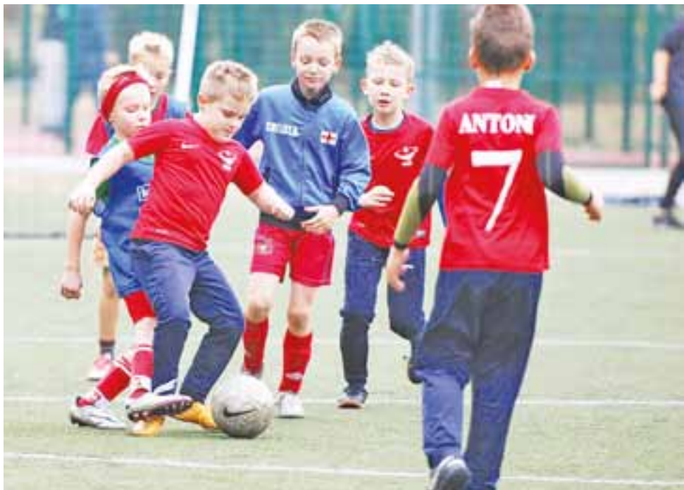
Była walka, emocje i wiele bramek