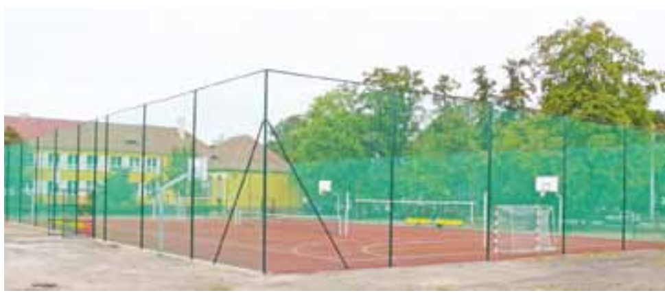
Boisko przy Szkole Podstawowej nr 2 i Gimnazjum nr 2 już jest gotowe, pierwsze zajęcia wychowania fizycznego odbyły się w tym tygodniu.

Oba boiska są już po odbiorach technicznych i są dopuszczone do użytkowania. Jedynie w przy-