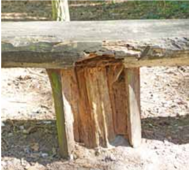
W złym stanie jest wiele ławeczek. Jak długo jeszcze wytrzymają?

Ścieżka zdrowia ma ok. 1 km długości. Znajduje się przy niej 20 stacji z urządzeniami do różnego rodzaju ćwiczeń na powietrzu. Drugą częścią przedsięwzięcia jest czterokilometrowa ścieżka do biegania wzdłuż lasu (od ul. Podleśnej do kanału na drugim końcu lasu, dalej wzdłuż kanału do ulicy Katarzynów i wzdłuż drogi do Podleśnej). Ścieżki te mają nawierzchnię gruntową, która została przez wykonawcę zleceń – Zakład Usług Komunalnych – wyrównana, oczyszczona z wchodzących na nią korzeni, zakrzaczek i gałęzi. Urządzenia do ćwiczeń zostały wbetonowane przy ścieżce zdrowia – część jest nowa, część była już wcześniej. Przy urządzeniach ustawiono tablice z graficzną instrukcją użytkowania. Przy ul. Podleśnej, gdzie zaczynają się obie pętle,