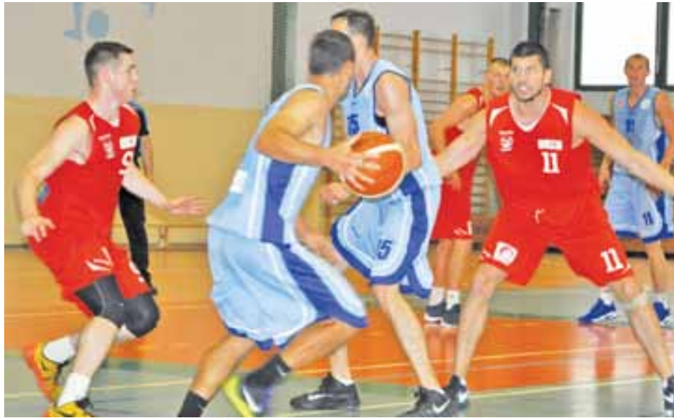
Najbardziej zacięty był przegrany mecz z łódzkim ŁKS-em