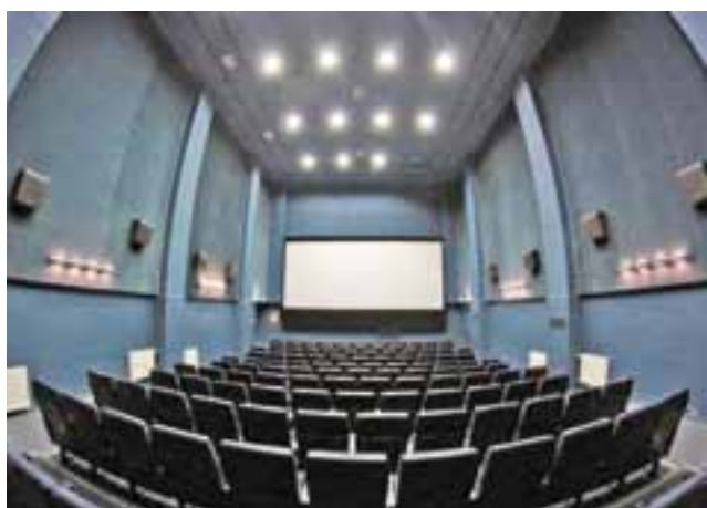
Sala kina Fenix.

Pokazy premierowe i koncerty są biletowane, zaś na pozostałe wydarzenia (film niemy, projekt „W starym kinie” i warsztaty „X muza”) – wstęp jest wolny. aa