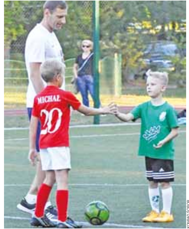
Przed meczem musi być powitanie