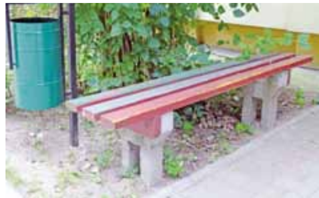
Ławki bez oparcia mają być zastępowane ławkami z oparciami - w pierwszej kolejności tam, gdzie będą o wymianę wnioskować mieszkańcy.