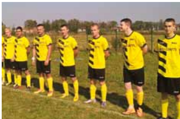
Naprzód wygrał skromnie z Fenixem 1:0