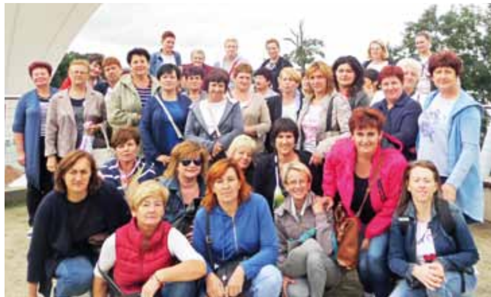
W wyjeździe na Mazury wzięły udział 42 kobiety. Pogoda gospodyniom raczej dopisywała.

Łowicz | Wolontariusze Szlachetnej Paczki poszukiwani