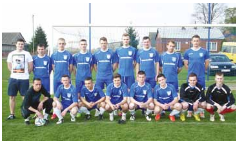
Korona uratowała jeden punkt w Jeżowie!

Piłka nożna | 5. kolejka skierniewickiej klasy okręgowej