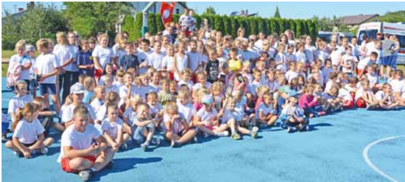
Uczestnicy jesienno-biegania na pamiątkowym zdjęciu wykonanym na boisku sportowym w Bolimowie.

Bolimów | Jesienne biegi i trzeźwości i przełajowy