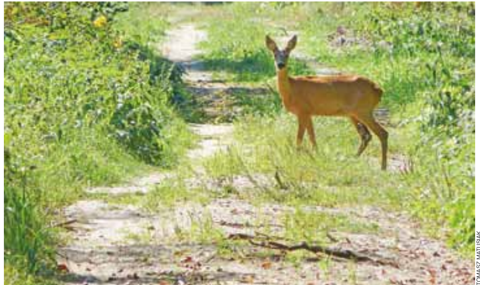
Nie zapominajmy, że jest to ścieżka leśna – przechadzać się nią mogą nie tylko ludzie.

Byliśmy na ścieżce zdrowia i biegowej jeszcze przed złożeniem pisma w Ratuszu, nasze obserwacje częściowo pokrywają się z tymi wyszczególnionymi w piśmie. Niektóre ławki i urządzenia do ćwiczeń są już teraz, kilka dni po oddaniu, podniszczone. Z kolei na odcinku wzdłuż ka-