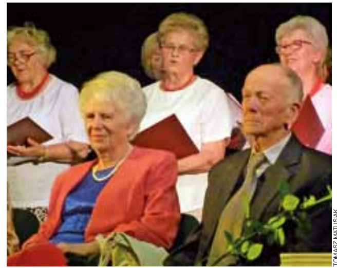
Jubilaci przyjmują życzenia, a śpiewa dla nich chór Klubu Seniora „Radość”.

Podczas części artystycznej, goście mogli usłyszeć próbki