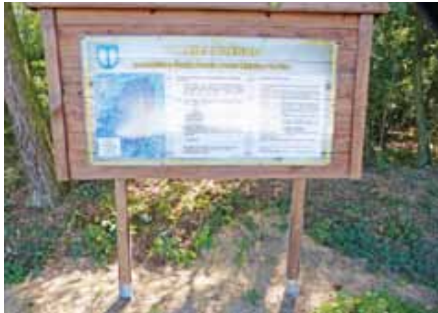
Tablica informująca o ścieżce od strony ul. Podleśnej. Nawet jeśli nie wszystko jest tak, jak było w marzeniach, zachęcamy do korzystania z odnowionych ścieżek – warto!

nału miejscami zalegały warstwy sypkiego piachu (przy suchej pogodzie), które mogą utrudniać bieganie czy jazdę rowerem. Nie są to jednak utrudnienia, które całkowicie uniemożliwiłyby przejazd. Co do urządzeń, zgadzamy się z tym, że zniszczenia niektórych z nich wyglądają nieestetycznie, natomiast nie zauważyliśmy usterek, które mogłyby wzbudzać troskę o bezpieczeństwo i zdrowie użytkowników.