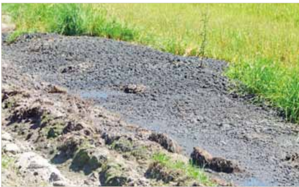
Problem cuchnącego osadu na polach czytelnicy zgłaszali nam wielokrotnie. Na zdjęciu podobny osad w gminie Łowicz kilka lat temu.