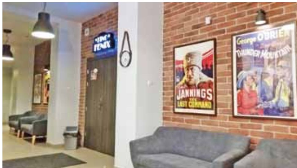
Jednym z prezentów, jaki pracownicy kina Fenix przygotowali z okazji jubileuszu 10-lecia dla swoich widzów, był remont holu.

Ponadto, jubileuszowi towarzyszyć będzie realizacja projektu „ W starym kinie ”, dedykowanego Eugeniuszowi Bodo. Z tej okazji 8 października o godz. 14.00