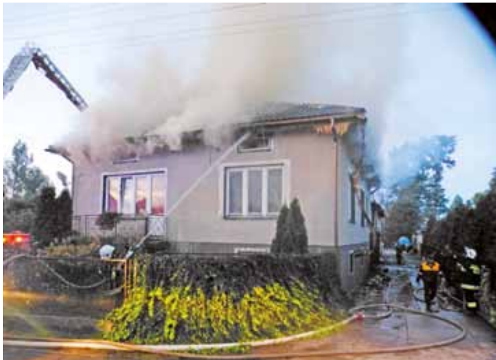
Najtrudniejsze było ugaszenie wypełnionego słomą i sianem poddasza domu mieszkalnego.

Bezpośrednio w wyniku pożaru nikt z domowników nie ucierpiał fizycznie. Później jednak,