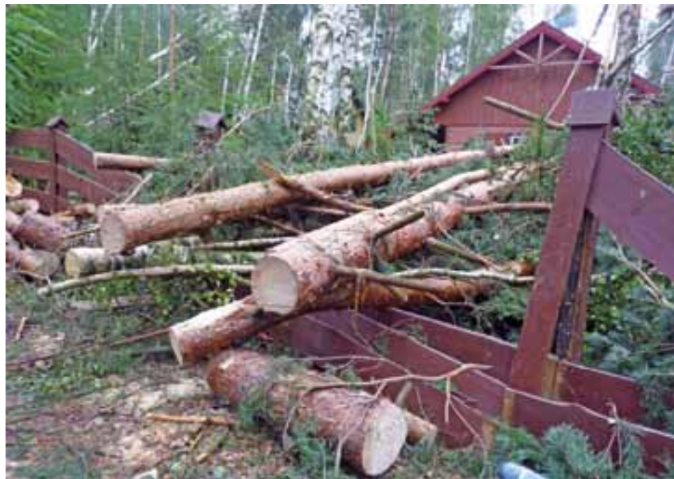
Powalone przez wiatr drzewa na terenie działek rekreacyjnych w Joachimowie Mogiłach.