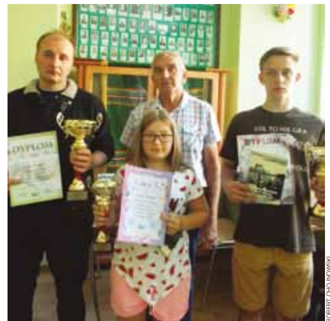
Całe podium należało do zawodników UKS Pałac Nieborów