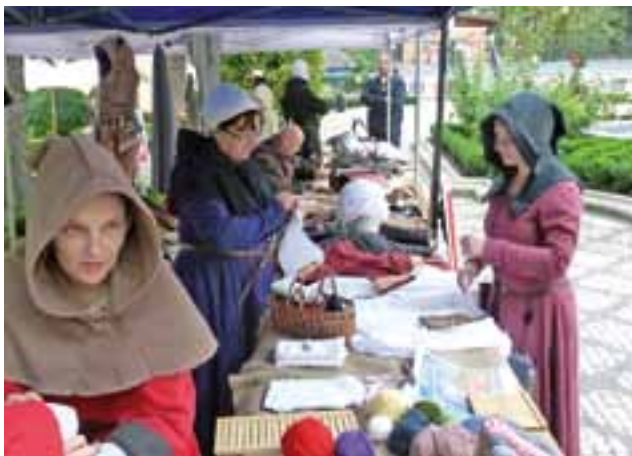
Bractwo rycerskie z Łowicza zrzessa także piękne damy. Często kojarzymy ze średniowieczem żywe kolory strojów.

Muzeum | Europejskie Dni Dziedzictwa 2016