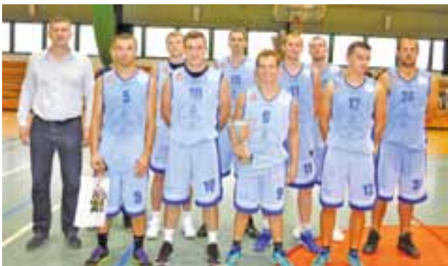
Syntex Książek czeka na mecz inauguracyjny II ligi