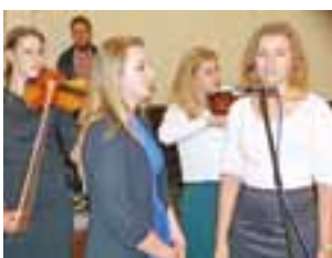
Oprawę muzyczną mszy świętej pełnili członkowie Oazy.

Jubileusz 30-lecia istnienia obchodzi oaza Ruchu Światło-Życie „Exodus” w parafii św. Bartłomieja w Domaniewicach. Z tej okazji, 18 września, został tam zorganizowany Diecezjalny Dzień Wspólnoty.