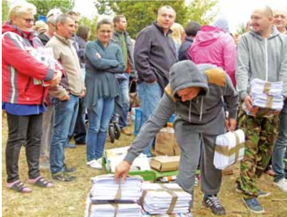
Akcja cieszyła się dużym powodzeniem, kolejna planowana jest w przyszłym roku.

– naprzeciwko budynku Starostwa Powiatowego w Łowiczu. Za 5 kg makulatury można było odebrać jeden talon o wartości 20 zł, za 5-7 kg – dwa talony, 7-9 kg – trzy talony, 9-11 kg – cztery talony i 11-13 kg pięć talonów. Akcja rozpoczęła się o godzinie 9.00 i już w jej pierwszych 30-40 minutach rozdanych zostało około 90 talonów. Ich liczba była ograniczona do 350 sztuk ze względów finansowych. Starostwo przeznaczyło na jej sfinansowanie kwotę 7 tys. złotych z pieniędzy przeznaczonych na edukację ekologiczną. – Wysyłaliśmy zapytania ofertowe do podmiotów, które działają w branży szkółkarskiej i oferta firmy z ul. Powstańców była najlepsza – wyjaśnia Adriana Drzewiecka.