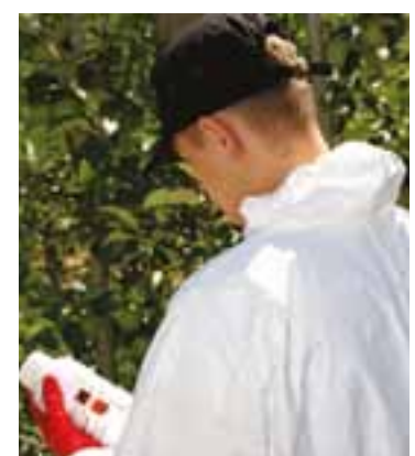
Sprawdzając piktogramy na etykiecie dowiesz się, które opakowania należy zwrócić

Należy pamiętać, że rolnik ma ustawowy obowiązek zwrotu opako-