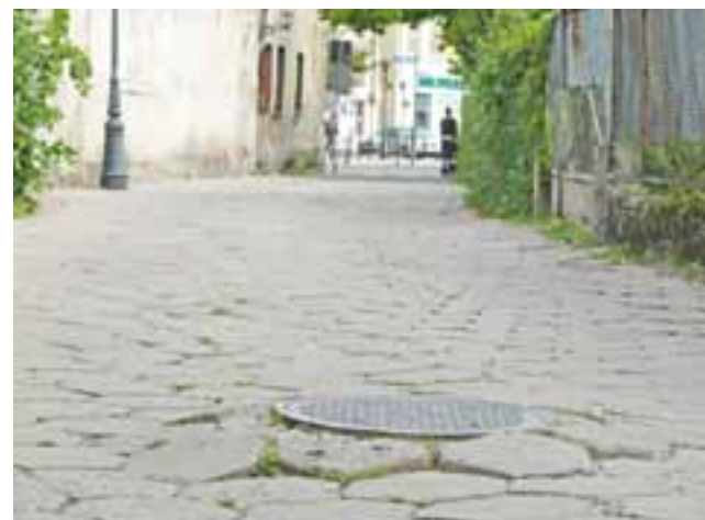
Ulica Wąska znajduje się w centrum miasta, jej nawierzchnia wykonana jest z trylinki i nie należy do najrówniejszych, dlatego zostanie zmieniona.