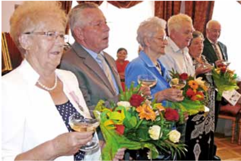
Pary biorące udział w tegorocznej uroczystości w USC w Nieborowie z okazji 50 lat pożycia małżeńskiego.

Po odpiewaniu „100 lat”, przy dźwiękach kapeli łowickiej uczestnicy spotkania przeszli do GOK, gdzie czekał na nich słodki poczęstunek, w tym tort.