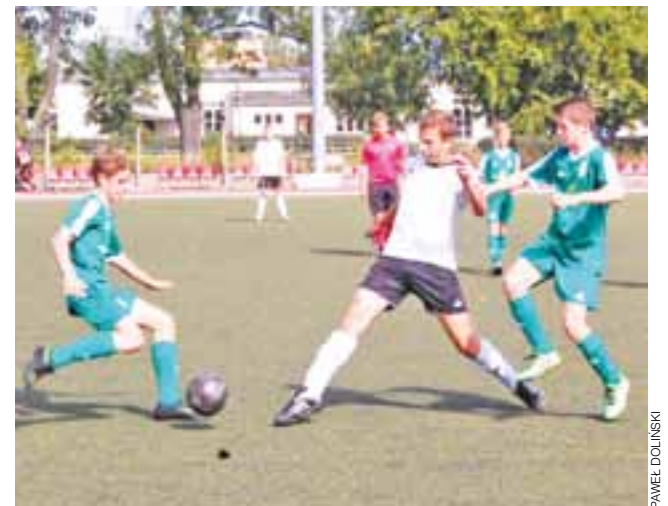
Pelikan II uległ GKS-owi aż 0:9