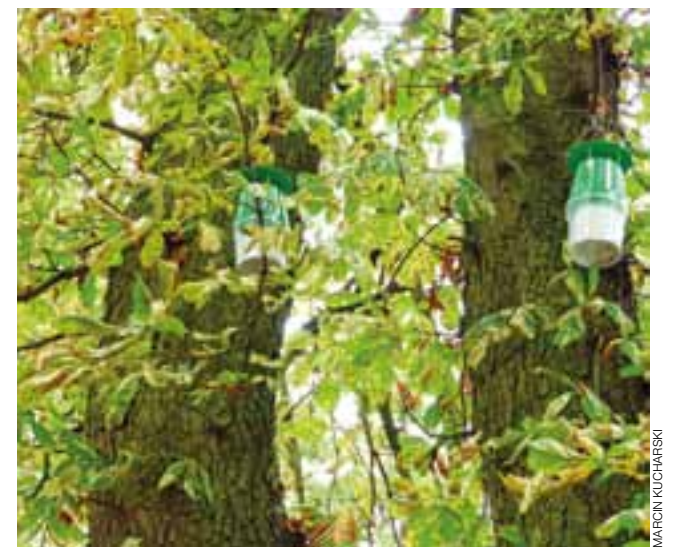
Pułapki zostały powieszono na większości kasztanowców w parku.

Zarłoczne larwy szrotówki kasztanowiczkę powodują brązowienie liści kasztanowców i ich przedwczesne opadanie. Taką sytuację można było zaobserwować na części kasztanowców w Sannikach już w ubiegłym roku w czerwcu i lipcu, powtórzyła się też w tym roku. Decyzje dotyczące zawieszenia pułapek feromonowych oraz przeprowadzenia prac pielęgnacyjnych zostały poprzedzone ekspertyzą dendrologiczną, która wykazała słabą kondycję wielu drzew zaatakowanych przez tego szkodnika.