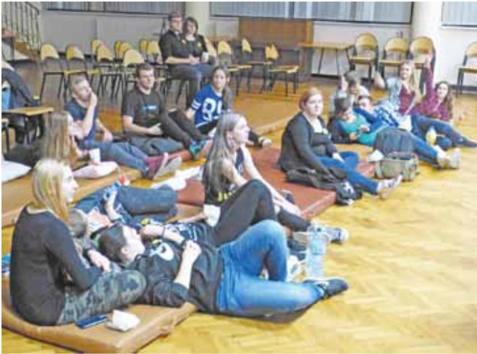
Pierwszy otwarty seans zorganizowany przez Klub Kinomana w II LO. Jak widać – panowała luźna atmosfera.