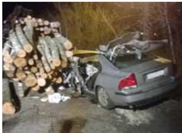
Samochód wbił się w tył stojącej na poboczu przyczepy ciągnikowej załadowanej drewnem.