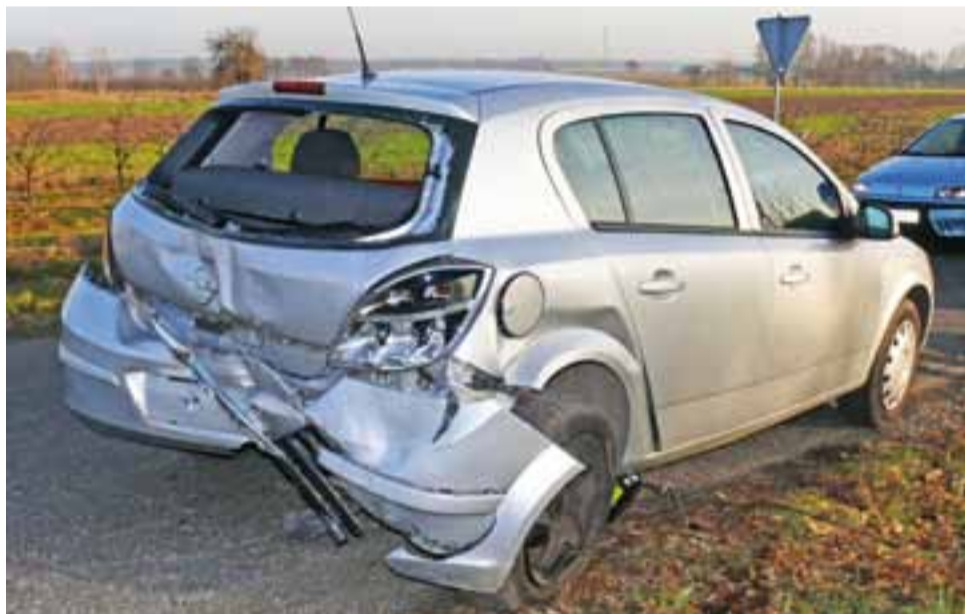
Tył Opla został mocno uszkodzony, na szczęście kierującej nic się nie stało.

Tuż przed północą, gdy prace jeszcze trwały doszło do kolejnej kolizji, w której uczestniczyły trzy samochody osobowe jadące w kierunku Główna, w kolejności: Opel Corsa prowadzony przez 57-letniego mieszkańca powiatu brzezińskiego, Nissan