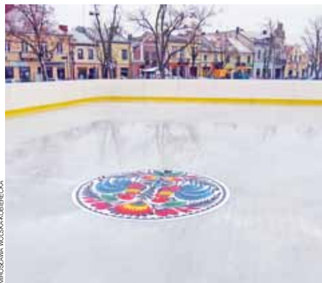
Po środku lodowiska, zamontowanego już na Nowym Rynku, pojawiła się barwna łowicka wycinanka.