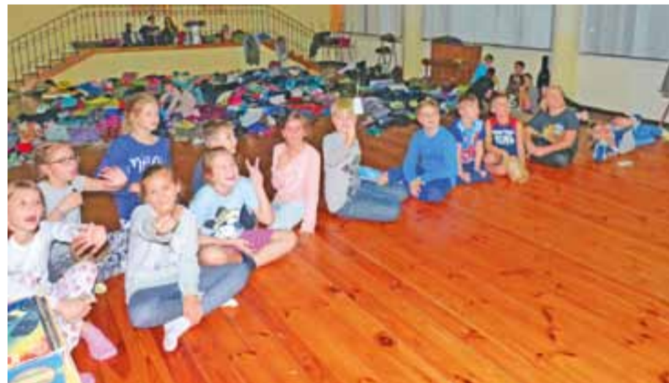
Harcerze oglądali filmy w dawnej stołówce „Medyka”. W sumie wyświetlono tej nocy 6 tytułów.

Jak nam powiedział drużynowy „Białych Orłów” i główny or-