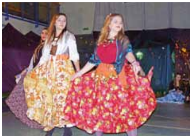
Uczennice zachwycaly barwnymi spódnicami, które rozpościerały się w tańcu. Wiele z nich zostało uszytych z zasłon i kolorowych materiałów.