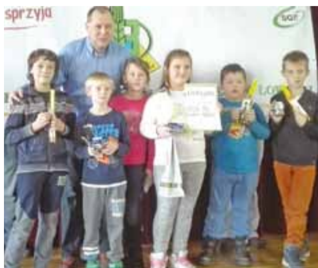
Ekipa Pałacowców zwyciężyła w IV turnieju początkujących.