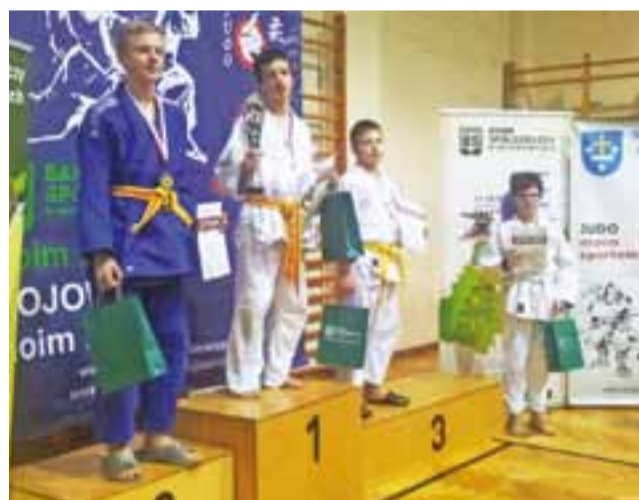
W Skierniewicach łowiczanie zdobyli 4 medale.

W grupie dzieci z roczników 2006-2007 brązowy medal wy-