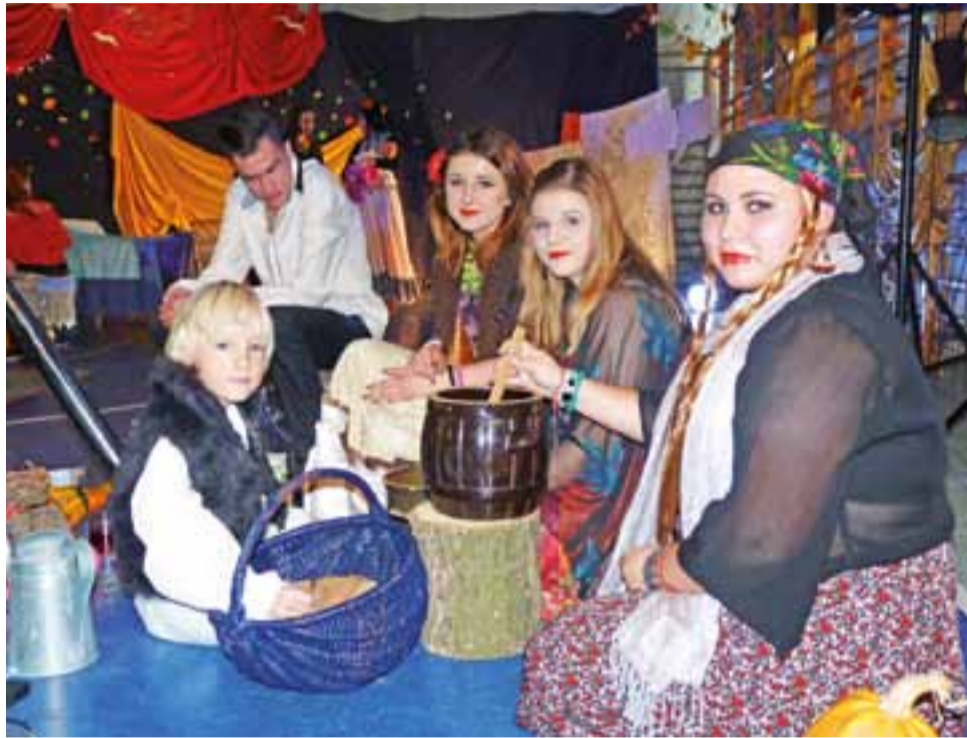
Po prawej stronie sceny uczniowie zaaranżowali cygański obóz, gdzie m.in. przygotowywali posiłki przy ognisku.

Grupa „Roma” powstała 3 lata temu, jej nazwa nie była bynajmniej celowym nawiązaniem do kultury cygańskiej. Zespół zadebiutował zorganizowanym z dużym rozmachem spektaklem muzycznym „W jesiennej zadumie”. Od tej pory regularnie przygotowuje programy artystyczne o różnej tematyce.