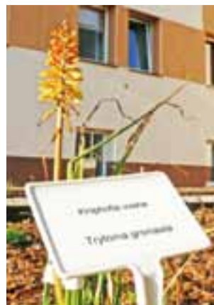
Trytoma groniasta – jedna z roślin, która już w przyszłym roku stanie się ozdobą ogrodu dydaktycznego.

aż 40 różnych gatunków – powiedziała w czasie otarcia Irena Chorążka. Są to np. cyprysik grodzki, sosna górska, tryto-