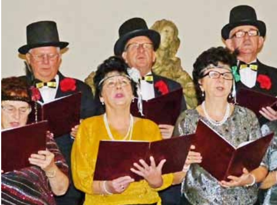
Chór „Młodzi Duchem” z Krośniewic wystąpił w eleganckich strojach wieczorowych, stylizowanych na lata 20 i 30. XX wieku.