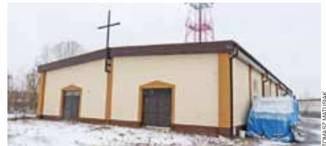
Od frontu budynek wygląda już jak obiekt sakralny, ale zanim stanie się kaplicą, wymaga jeszcze dużego nakładu pracy i finansów.

– Przykładamy wagę do staranności wykonania każdego elementu – zapewnia ks. Kwa-