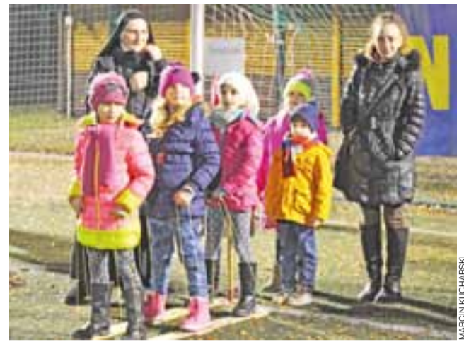
Chodzenie na nartach – jedna z konkurencji tegorocznego Maratonu.

Zapraszamy do obejrzenia galerii zdjęć na naszej stronie www.lowiczanie.info .