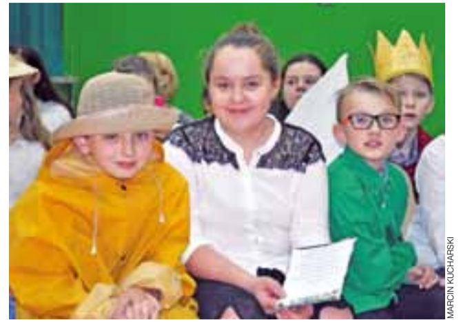
Uczniowie wszystkich klas z Popowa przebiegali się, recytowali wiersze o ziemniakach, bądź też przytaczali fakty na tematy związane z uprawą i przyrządzaniem ziemniaków.

Wzorem lat poprzednich rodzice przygotowali potrawy z ziemniaków. Można było spróbować m.in. wielu odmian sałatek z ziemniakami, klusek, chipsów, placków itp. Rodzice stanęli na wysokości zadania – stoły aż ugięły się od potraw. Co roku każda z klas przygotowuje odrębne stoisko, na których można kupić kulinarne rarytasy za kilka złotych. Pieniądze zebrane podczas spotkania integracyjnego zasila fundusz klasowy, z którego opłacane