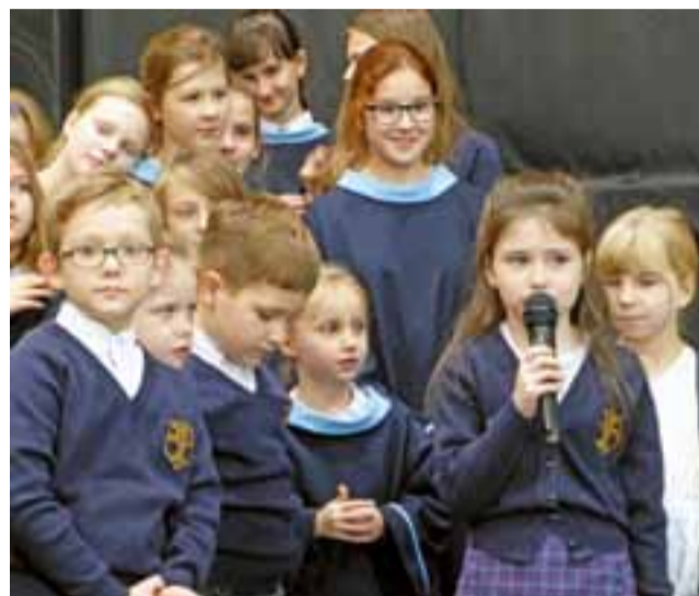
Program artystyczny towarzyszący pasowaniu pierwszoklasistów.

wyjaśnionych przyczyn, zakon został zredukowany ponownie do rangi kongregacji bez ślubów. Na nowo zakon został przywrócony w 1656 roku decyzją Aleksandra VII, już po śmierci jego twórcy i pierwszego generała. Józef Kalasanty został beatyfikowany w 1748 roku, a kanonizowany w 1767 roku. W 1948 roku papież Pius XII ogłosił go patronem wszystkich katolickich szkół podstawowych. Kalasantyński Rok Jubileuszowy, rozpoczęty 27 listopada, ma uczcić jednocześnie 400. rocznicę powstania zgromadzenia i 250. kanonizacji św. Józefa Kalasantego. tm