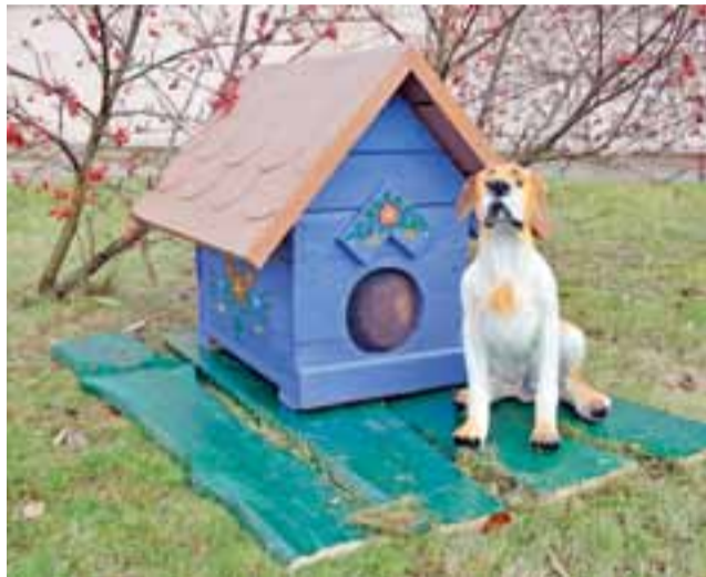
Łowicka buda z psem zostanie ustawiona na ul. Zduńskiej.

Od początku zamysłem ŁSPZ było to, aby buda – skarbonka mo-