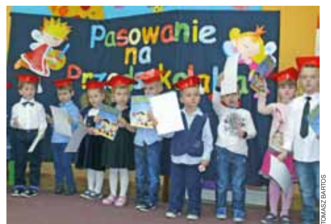
Przedszkolaki ze starszych grup Przedszkola nr 1 Stokrotka w Łowiczu, tuż po ślubowaniu.

Ostatnim elementem uroczystości było ślubowanie. Tu