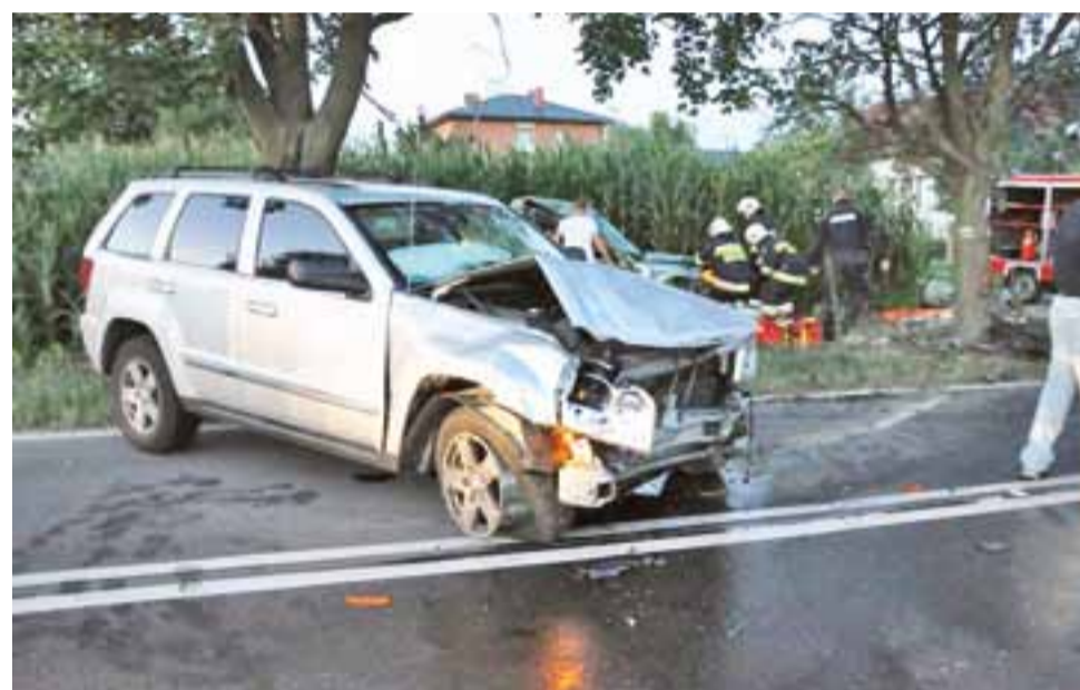
Widoczny na zdjęciu Jeep biorący udział w wypadku pozostał na jezdni, Honda wpadła na pole kukurydzy.

Kierująca Skodą Octavią mieszkanka Koluszek została zatrzymana w związku z tym, że jechała w terenie zabudowanym z prędkością przekraczającą dozwoloną w tym miejscu aż o 52 km/h. Zgodnie z obowiązującym prawem za tak nadmierną prędkość kobietę pozbawiono na trzy miesiące prawa jazdy. Dodatkowo została ukarana mandatem w kwocie 400 zł. kl