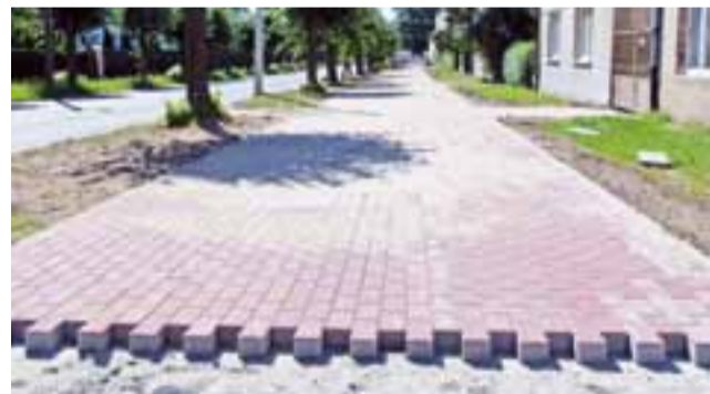
Chodnik po lewej stronie ul. Bielawskiej będzie niedługo gotowy.

Inwestycja przy Bielawskiej wykonywana jest przez firmę WIG-KOST z Kocierzewa. Finansują ją wspólnie, po połowie, Starostwo Powiatowe w Zgierzu i Urząd Miejski w Głownie. Całość kosztować ma 217.204,63 zł i zakończyć się w sierpniu. ki