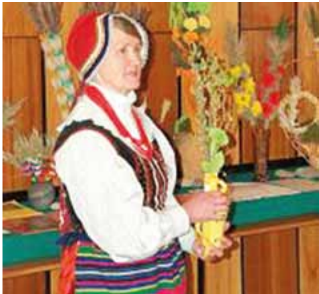
Jadwiga Solińska – artystka ludowa i pisarka.