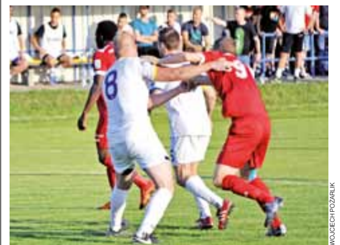
Zjednoczeni (białe stroje) od 1. kolejki zostali czerwoną latarnią IV ligi.