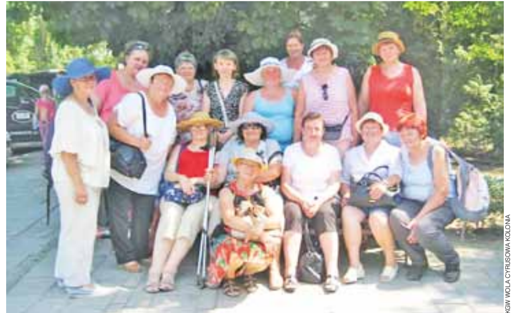
Gospodyniom nie tylko gotowanie w głowie. Panie lubią również wycieczki i wspólne fotografie.

i ma na swoim koncie również pierwsze miejsce w tym konkursie, ponadto należy do grona gospodyń docenionych w Łódzkim Tygłku Smaków.