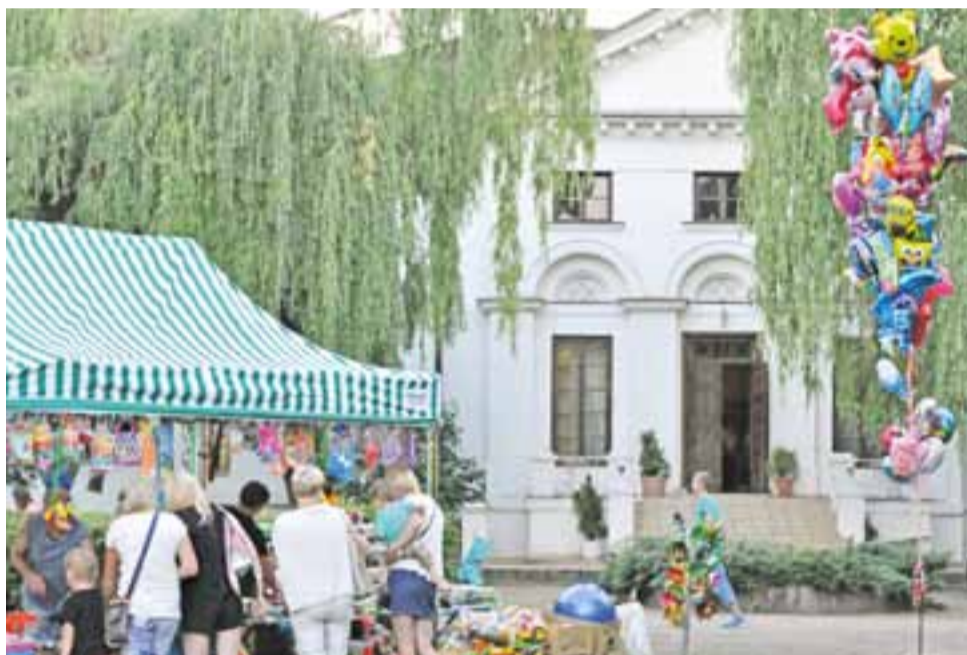
Na razie jednak w pałacu i parku w Kiernozi organizowane są nadal gminne imprezy, m.in. Noc Świętojańska i Dzień Kiernozkiego Dzika (fotografia z tej drugiej imprezy).

go po utworzeniu jednostek samorządu terytorialnego i nadania gminom osobowości prawnej w wyniku reformy państwa w 1990 roku. Wtedy bowiem – po rozpatrywaniu sprawy w sądach administracyjnych różnych instancji, odwołaniach spadkobierców oraz gminy kierowanych do tychże sądów, decyzjach o tym czy pałac i park mogły podlegać dekretowi PKWN czy nie, wydawanych przez wojewodę łódzkiego, które później były uchylane przez Ministerstwo Rolnictwa i Rozwoju