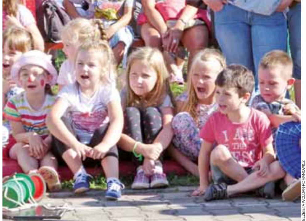
Czary mary, hokus pokus! – wołają dzieci, by pokaz iluzji zakończył się sukcesem.

Głowno | Wystartowało Kreatywne Lato Rodzinne 2016