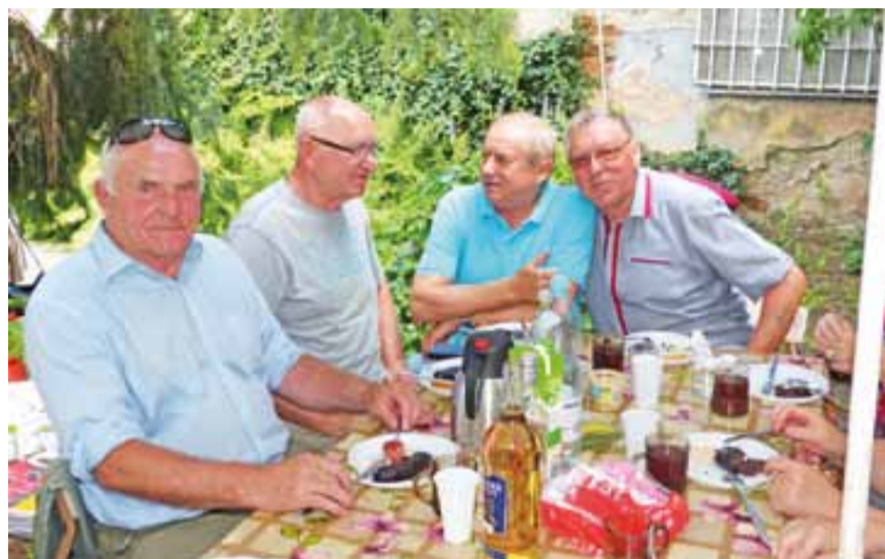
Początek spotkania grillowego. Panowie w dobrych humorach zbierają siły do dalszej zabawy.

Ceny są symboliczne i sięgają zaledwie kilku złotych. Dlatego jest to nie lada gratka dla kupujących, jak i dla samych handlarzy, między którymi czasami dochodzi do wymiany.