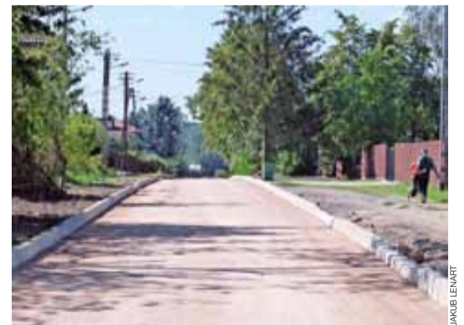
Ulica Dworska jeszcze w tym miesiącu będzie miała nową nawierzchnię

Wartą 599.334,08 zł inwestycję wykonuje na zlecenie Urzędu Miejskiego firma Erbedim z Piotrkowa Trybunalskiego. Prace teoretycznie powinny się skończyć najpóźniej 25 sierpnia. Wszystko wskazuje jednak na to, że ich finisz nastąpi dużo szybciej, może