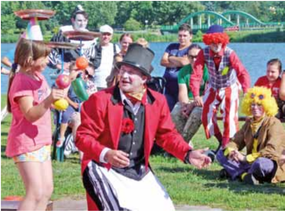
Wirujące talerzyki. Cyrkowy numer z udziałem ochotniczki z publiczności.