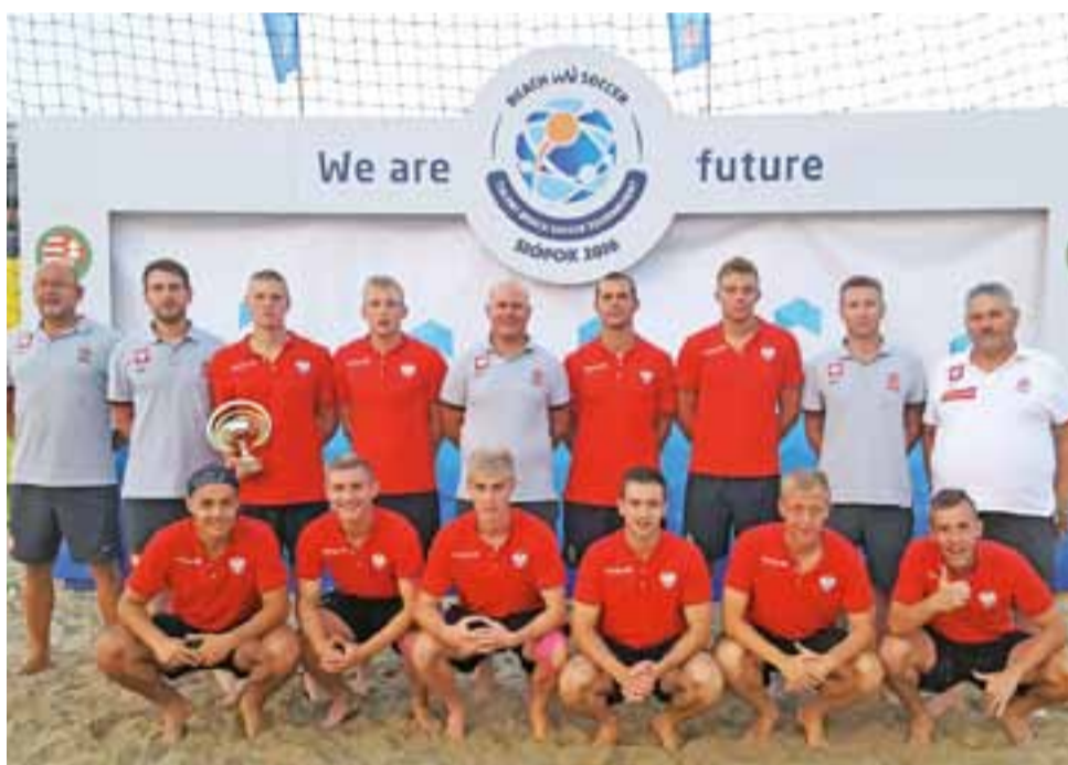
Polska Reprezentacja U-21 w piłce plażowej szlifowała formę na boiskach Ubojni Drobiu „Piórkowscy”.