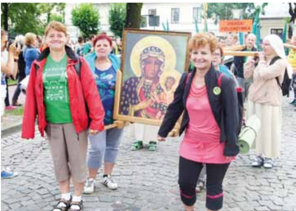
Czoło XXI ŁPPM. Z ikoną Matki Bożej i pielgrzymkowym krzyżem pątniczki czekają na hasło „Ruszamy!”.

Zachęcamy do obejrzenia obszernej galerii zdjęć i filmu z wyjazdu pielgrzymki na www.lowczanin.info w zakładce Kościół.