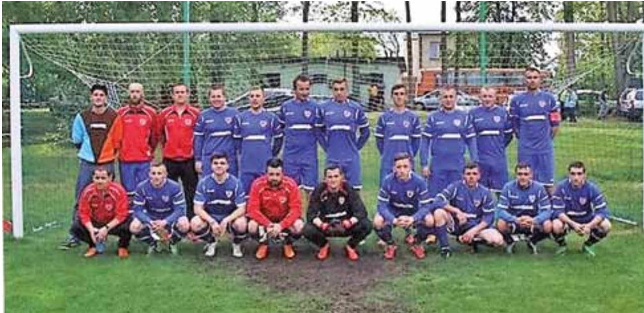
GŁKS Dąbrowianka Dąbrowice wywalczyła prawo gry w barażach dzięki zajęciu 2. miejsca w swojej grupie B-klasy.

Pierwsze spotkanie turnieju barażowego odbyło się w sobotę, 6 sierpnia na boisku w Dobieszkowie. Dąbrowianka postawiła gospodarzom trudne