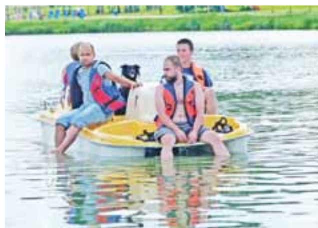
Kto nie lubi pływać, może korzystać z uroków wypoczynku nad wodą w inny sposób. Strykowska przystań oferuje rowery wodne, łódki i kajaki.