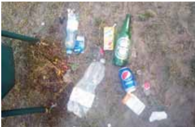
Taki widok na placu zabaw w centrum osiedla Górki to codzienność: butelki i puszki, pudełka po papierosach, niedopałki i wiele innych śmieci.

Przypominamy, że chodzi o plac zabaw położony w sercu Górek, na placu przy ulicy Miodowej. Jak informowali nas mieszkańcy osiedla, problemem są tam schadzki grupy osób spożywającej alkohol i okupującej ławki do późnych godzin nocnych. Osoby te to głównie mężczyźni w różnym wieku, którzy pozostawiają po sobie bałagan w postaci porzucanych śmieci, a głównie niedopałków po