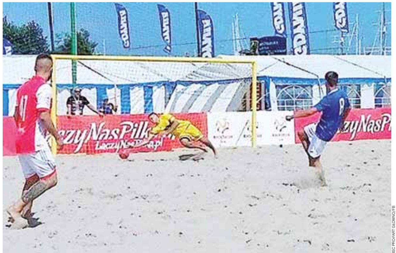
Piłkarze plażowi BSC Pro-Fart Głowno (niebieskie stroje) nie będą miło wspominać swojego pobytu w Gdyni. Głownianie muszą odłożyć marzenia o awansie do Ekstraklasy Beach Soccera na przyszły rok.