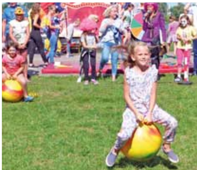
Wyścig na piłkach. Trwa walka rodzinnych drużyn o bilet wstępu do Wioski Indiańskiej w Parzęczewie. W finale wejściówki trafiły do obydwu rodzin.