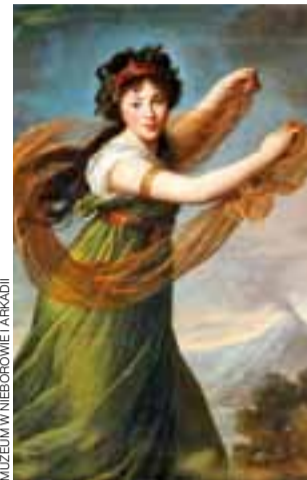
W Muzeum w Nieborowie i Arkadii trwa wystawa „Élisabeth Vigée Le Brun i Polacy”.

W ostatnich dniach lipca wystawę opuścił portret Adama Kazimierza Czartoryskiego w czerwonym płaszczu. Obraz wrócił do Muzeum Zamku Królewskiego w Warszawie, jego miejsce na ekspozycji w Nieborowie zajął portret Pelagii z Potockich Sapieżyny, wypożyczony z tego samego muzeum. Ze względu na dużą wartość dzieła, został on przewieziony w asyście uzbrojonych konwojentów. Wystawa zakończy się 23 października, prezentowanych jest na niej 8 obrazów autorstwa Élisabeth Vigée Le Brun. tb