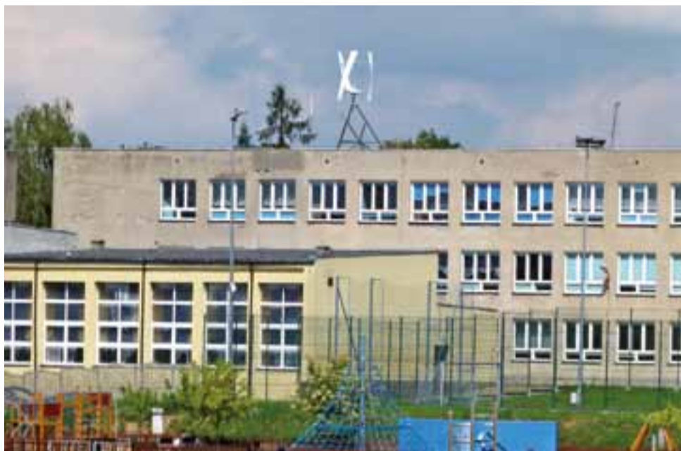
Ciekawa dla oka turbina wiatrowa ustawiona na dachu Zespołu Szkół nr 1 w Strykowie to tylko część układu, który ma pozyskiwać energię z powietrza, słońca i wody.

Stryków liczy teraz na oszczędności w placeniu rachunków za energię oraz wymierne efekty edukacyjne. Połączone ze sobą instalacje do pozyskiwania „białej energii” mają wytwarzać moc, którą gmina w całości wykorzysta na własne potrzeby. Remont małej elektrowni wodnej polegał głównie na wymianie zepsutej turbiny na nową o mocy 11 kW, wymianie starego silnika oraz remoncie pomieszczeń turbinowni. Instalacja fotowoltaiczna zainstalowana na ścianie szkoły ma wytwarzać moc nie mniejszą niż 2 kW. Piono-