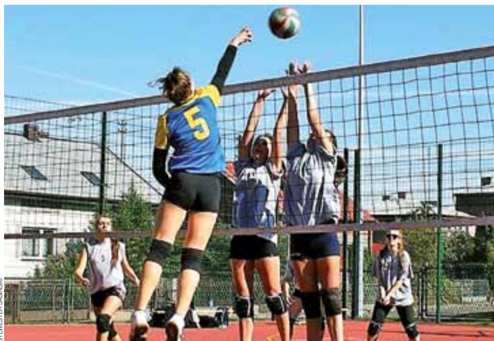
Siatkarskie emocje w Głownie gwarantowane są niemal przy każdym rozgrywkach. 21 sierpnia też tak będzie.

W sobotę, 13 sierpnia o godz. 17:00 w wyjazdowym pojedynku rywalem Zjednoczonych będzie Ner Poddebice. Liczymy na zwycięstwo strykowian. wp