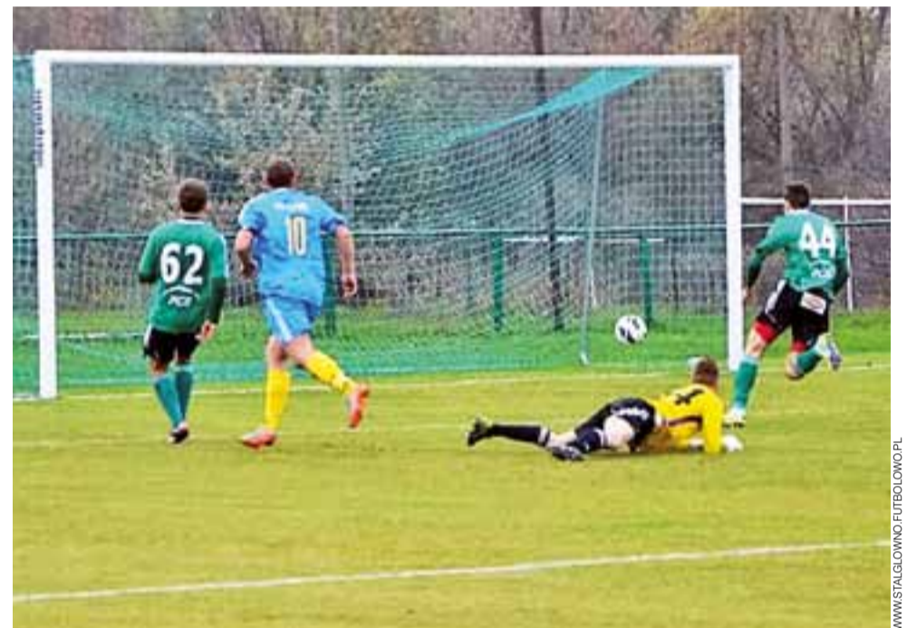
Piłkarze Stali Głowno (niebieskie stroje) w meczach sparingowych dość łatwo dochodzą do sytuacji strzeleckich i potrafią je wykorzystać.

Potencjalnie nowi zawodnicy spisali się jednak bardzo dobrze. Choć w pierwszej połowie gospodarze nie potrafili znaleźć sposobu na przyjezdnych to jednak w drugiej odsłonie jeden z testowanych zawodników wziął sprawy w swoje ręce i dwukrotnie pokonał bramkarza rywali. Wkrótce okaże się, kto w Stali zagości na dłużej. Kolejny sparing głownianie rozegrają w sobotę, 13 sierpnia o godz. 17:00, kiedy spotkają się z rezerwami Pelikana Łowicz. wp