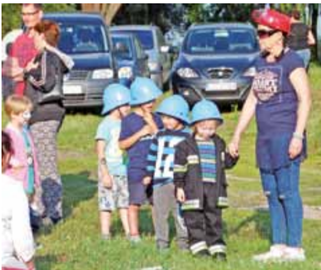
Na linii startu. Kandydaci do pokonania strażackiego toru przeszkód już czekają na hasło do startu.

Dmosińskie dożynki, które odbędą się na kompleksie boisk w Borkach, uświetni występ uczniów Zespołu Szkół Samorządowych w Dmosinie, a później zabawa taneczna. Imprezie towarzyszyć będzie mała gastronomia, z której skorzystać będą mogli wszyscy uczestnicy dożynek, stoiska sołectw z poczęstunkiem dla ich mieszkańców. Zarówno we Wrzasku, jak i w Dmosinie. Szczegółowe programy na tydzień. ijs