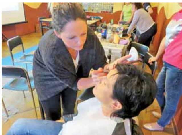
Farmerki zamieniają się w missterki. Uczestniczki projektu w ubiegłym tygodniu poddawały się m.in. zabiegom wizażystki, która pokazywała im, jak umiejętnie podkreślać swoją urodę.

W ubiegłym tygodniu, 18 sierpnia, w małej świetlicy wiejskiej