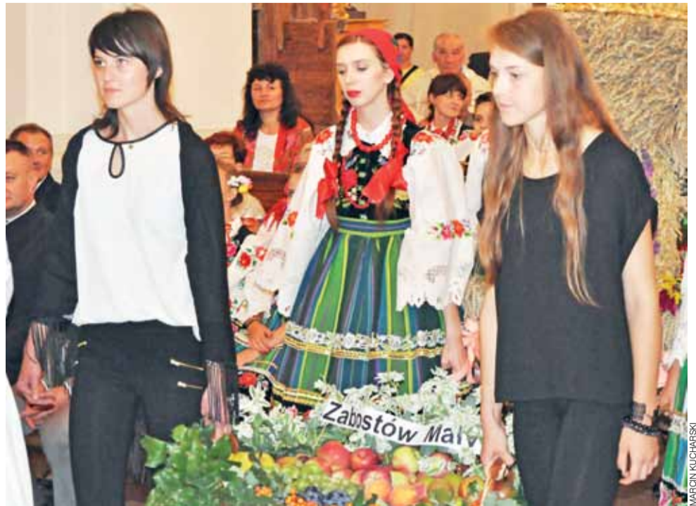
Mieszkańcy Zabostowa Małego przynieśli do katedry wieniec z owocami, wskazże to powiatowe zagłębie jabłek.