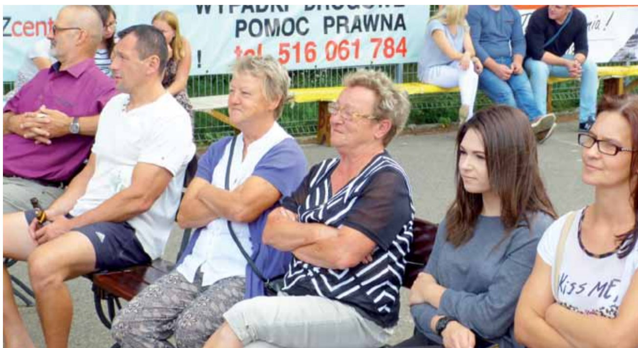
Jubileusz klubu przyciągnął na stadion wielu mieszkańców Bełchowa, którzy chętnie oglądali zarówno mecze, jak i występy na scenie.