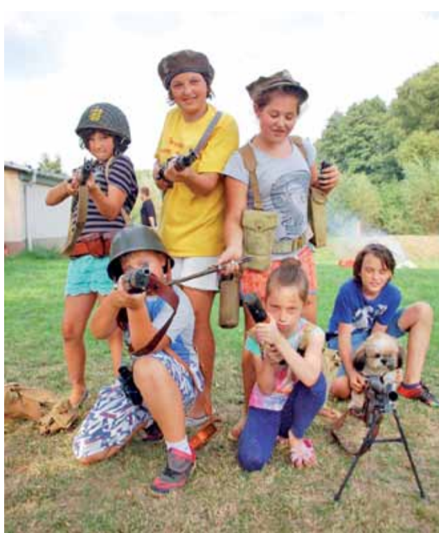
Uwaga, uzbrojone dzieciaki! Mini odyseja historyczna w DK w Niesułkowie była okazją do zapoznania się z wyposażeniem polskich żołnierzy z okresu II wojny światowej.