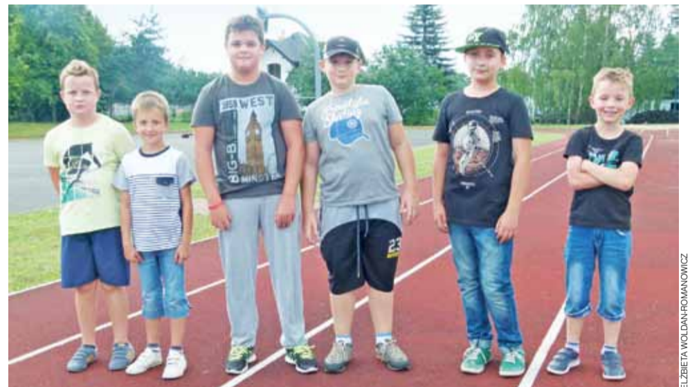
Na szkolnym stadionie. Chłopcy najbardziej lubią grać w piłkę.

RZUT OKIEM | WYSKOKI NA WYCIEZCZCE W SANDOMIERZU