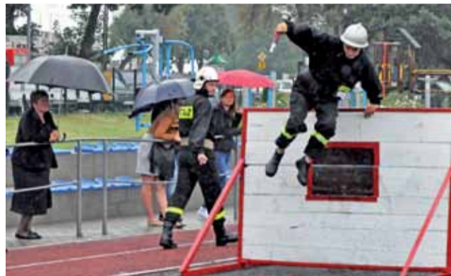
Jedną z trudniejszych przeszkód na torze sztafety strażackiej była ścianka, którą strażacy musieli pokonać z prądownicą w ręku.

Wcześniej strażacy wpadli na pomysł, żeby wokół równoważni ułożyć gumowane materace z pobliskiej szkoły, które miałyby amortyzować ewentualne upadki.