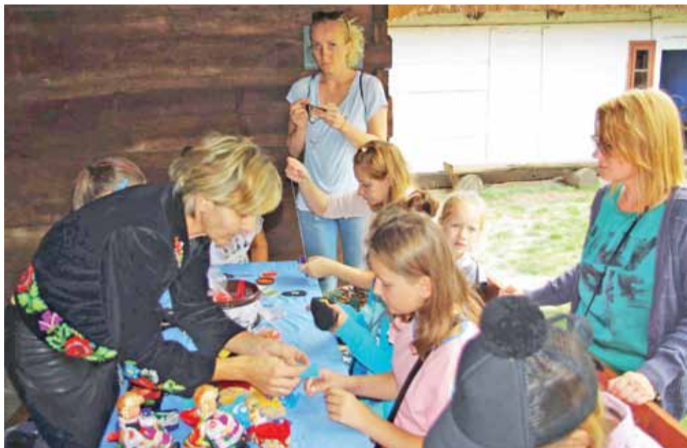
Warsztaty zorganizowane podczas minionej Niedzieli w Skansenie w Maurzycach cieszyły się popularnością wśród dzieci i dorosłych. Ich uczestnicy uczyli się m.in. haftu koralikowego.

W pierwszym spacerze uczestniczyło około 40 osób, a w kolej-