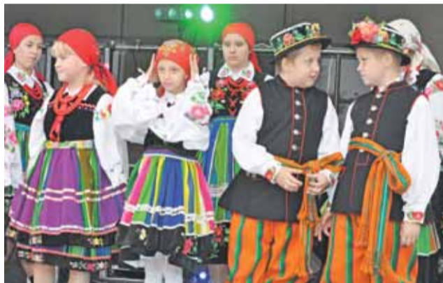
Dziecięcy Zespół Ludowy „Krzewina” wystąpił na dużej scenie rozstawionej przed filią ośrodka kultury.

Na scenie rozstawionej przed filią Gminnego Ośrodka Kultury od godziny 15.30 odbywały się przeróżne występy. Można było m.in. posłuchać Strażackiej Orkiestry Dętej z Belchowa, obejrzeć występ zespołu ludowego „Belchowskie Nutki”, Dziecięcego Zespołu Ludowego „Krzewina”, Zespołu Wokalnego „Nieborowianki” i innych. Publiczność chętnie je oglądała spod namiotów rozstawionych po obydwóch stronach sceny