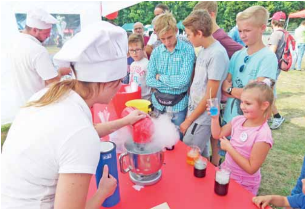
Robią się lody. Wielkim zainteresowaniem uczestników pikniku naukowego cieszyło się stanowisko kuchni molekularnej. Para powstała z ciekłego azotu, którego szefowie kuchni używali do produkcji lodów.

Spotkanie po latach absolwentów strykowskiej SP 2. str. 10