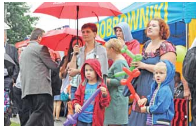
Atrakcji dla dzieci nie brakowało , najmłodszy uczyli się np. „modelowania balonów”, czyli takiego ich wiązania, żeby przypominały np. figurki zwierząt.