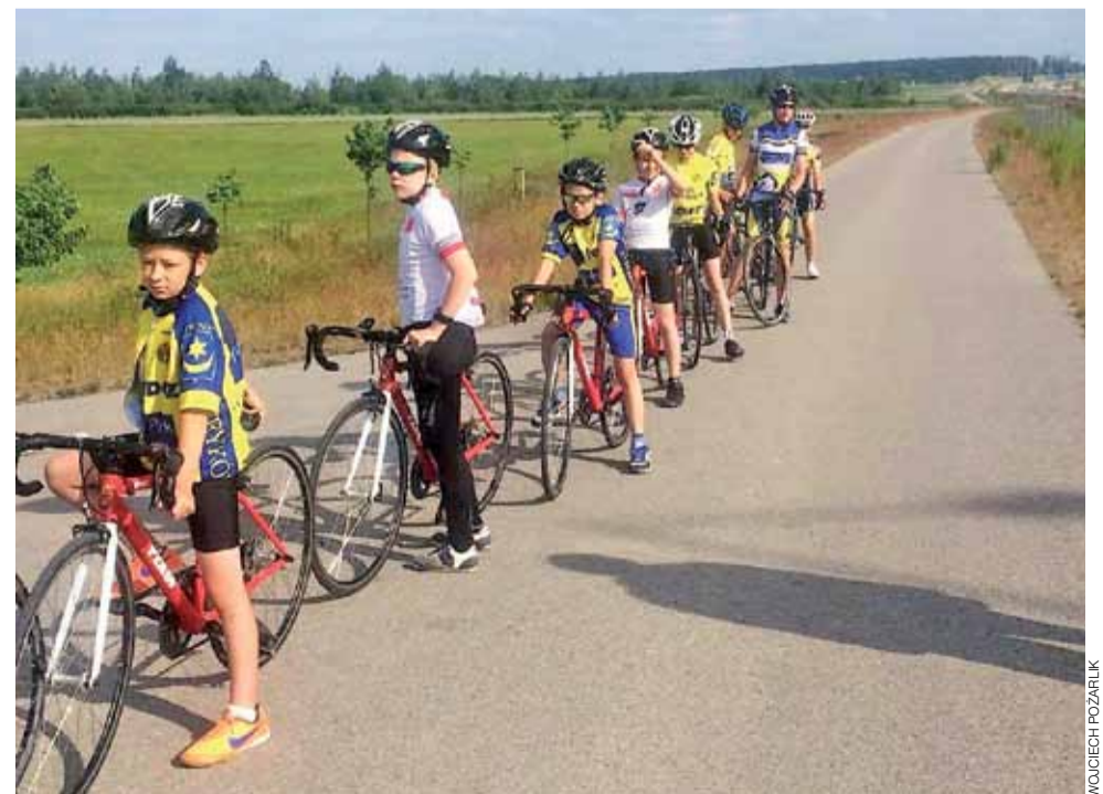
Młodzi adepci Szkółki Kolarskiej w Strykowie trenują na rowerach szosowych.

Polski Szkółek Kolarskich właśnie na nowoczesnym, jedynym w Polsce drewnianym wielodromie w Pruszkowie. Ci, którzy dopiero zaczynają swoją przygodę z rowerem będą mieli dostosowany plan do indywidualnych potrzeb. Obecnie do Szkółki zapisanych jest 15 zawodników i zawodniczek, który po przerwie wakacyjnej wznawiają zajęcia i już we wrześniu będą uczestniczyć w pierwszych wyścigach. Szkółka Kolarska oprócz sprzętu rowerowego zapewnia również stroje kolarskie i kask. Udział w treningach jest bezpłatny. Więcej informacji pod numerem telefonu 512-250-468. wp