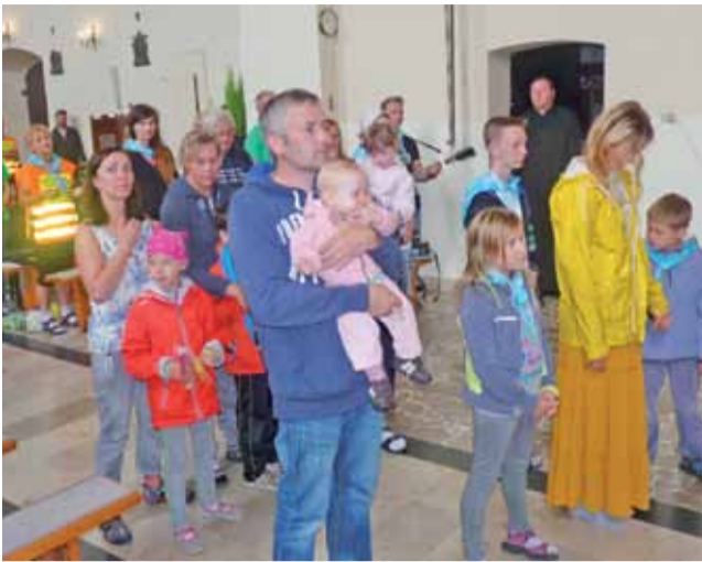
Blogostawieństwo dla dzieci na mszy św. w tym kościele.