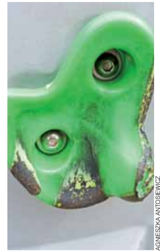
Tak teraz wygląda ścianka wspinaczkowa na placu zabaw przy ul. Miodowej na Górkach – „skałki” są przypalone, a całość obłana cieczą nieznanego pochodzenia.