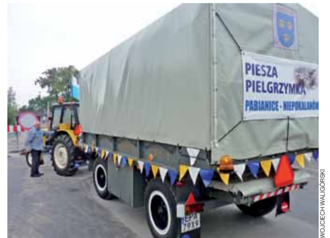
Tak zadbane traktor i przyczepa to niecodzienny widok

Ale zachwyceni byli także pątnicy. – Doświadczamy tyle dobroci, ludzie dają nam jabłka,