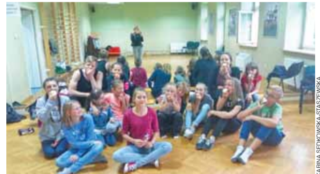
Krátká przerwa podczas warsztatów - można w jej trakcie zjeść jabłko i zrobić sobie wspólne zdjęcie.