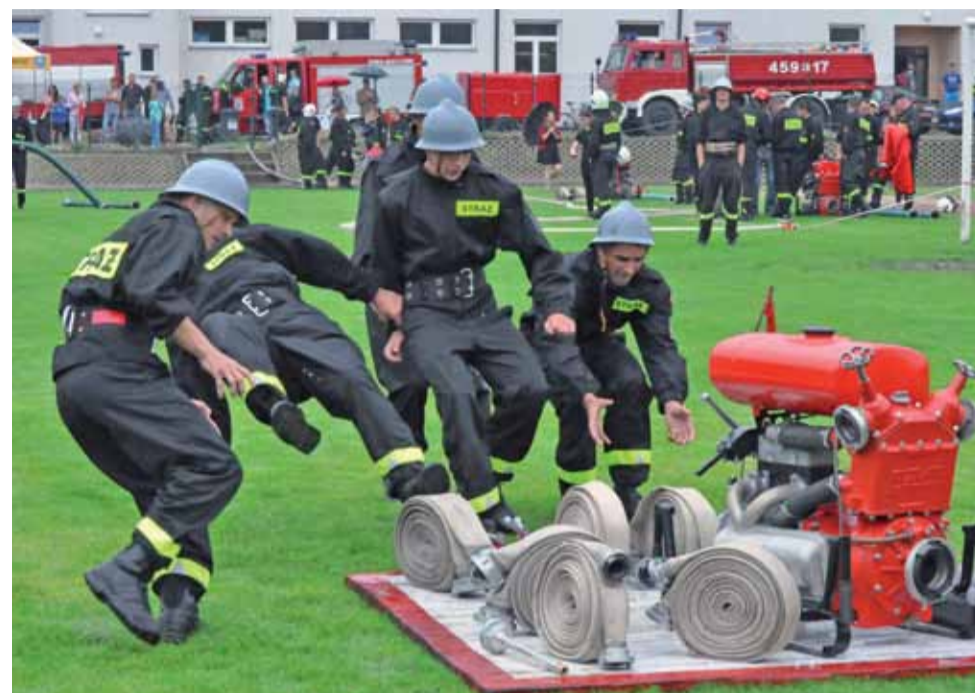
Drużyna z Reczyc ponownie wygrała gminne zawody sportowo-pożarnicze. W tym roku zostały one rozegrane w strugach deszczu na śliskiej murawie, co zresztą widać na zdjęciu.

Wśród pań strażaczek, czyli w grupie „C”, najlepsze okazały się drużyny z OSP Reczyce I z czasem 121,8 sekund, drugie miejsce zajęły drużyny z OSP Domaniewice (134,7 sekund), trzecie – OSP Reczyce II (140,9 sekund), czwarte – OSP Krępa II i piąte – OSP Krępa I. W kategorii młodzieżowych drużyn pożarniczych wystartowała tylko jednak drużyna z OSP w Domaniewicach. mak