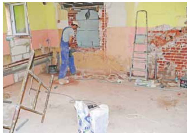
Prace w kuchni w Szkole Podstawowej nr 1, jej modernizacja jest prowadzona od podstaw.

■ W Gimnazjum nr 2 w czasie wakacji wykonano szereg drobniejszych prac remontowych. Malowanie ścian przeprowadzone zostało w trzech salach lekcyjnych, w czwartej sali lekcyjnej i w pokoju nauczycielskim wykonano także cyklonowanie parkietu. Ściany pomalowane zostały także w dyżurce woznych, gdzie oprócz tego położono na podłodze wykładzinę. Prace zostały wykonane własnymi siłami szkoły, przy wsparciu finansowym Rady Rodziców.