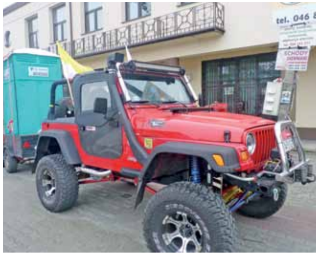
Ten sprzęt towarzyszył pątnikom na całej trasie.