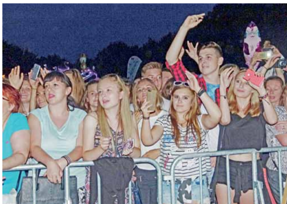
Publiczność na koncercie Kamila Bednarka. To dla niego na Święto Miasta ściągnęły tłumy.

Na każdym z kilkunastu stanowisk naukowych można było doświadczyć czegoś wyjątkowego.