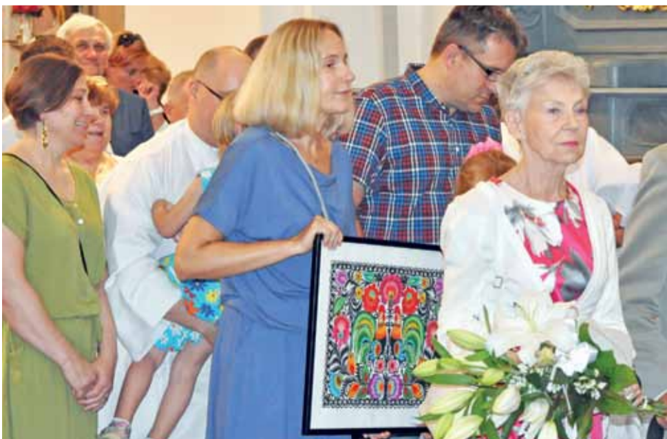
Wiele osób dziękowało proboszczowi za 16 lat pracy w parafii katedralnej, wśród nich m.in. przedstawiciele Kościoła Domowego – Matrzeńsko-Rodzinnego Ruchu Świeckich w Kościele.

Msza miała podwójnie uroczysty charakter, gdyż była również dziękczynieniem za 16 lat posługi kapłańskiej w Łowiczu ks. pro-