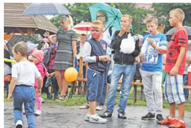
Mimo deszczu wata cukrowa smakowała tak samo dobrze. Dla dzieci była za darmo.

go i kilkanaście minut po godzinie 23.00 organizatorzy oraz zespół Progres postanowili zakończyć zabawę, z uwagi między innymi na sprzęt nagłaśniający, który tego dnia i tak dużo przeżył. Patronem festynu były dwie restauracje McDonald's – ta mieszcząca