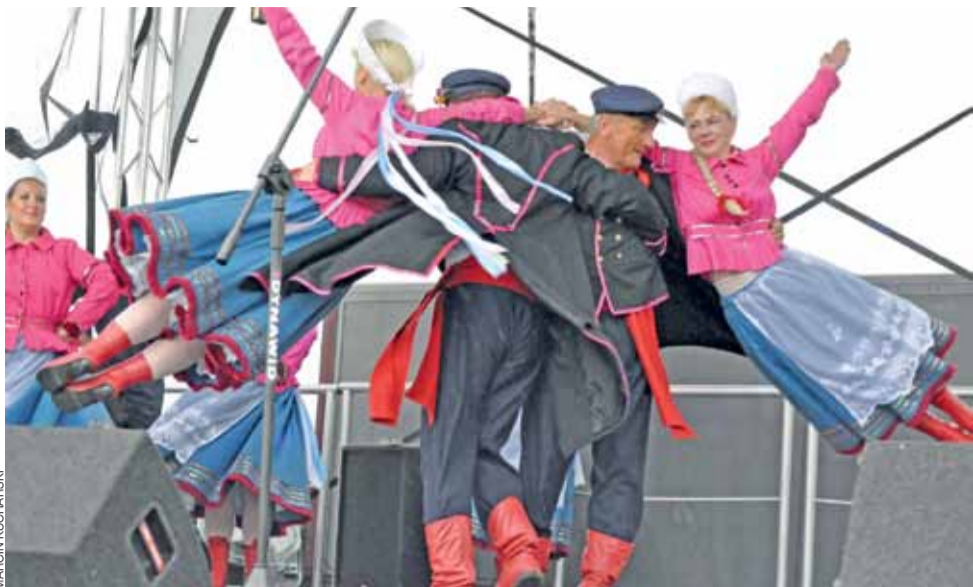
Występ Zespołu Ludowego Ziemi Kutnowskiej mógł się podobać. Niestety z powodu deszczu obejrzało go mniej osób niż zakładali organizatorzy.