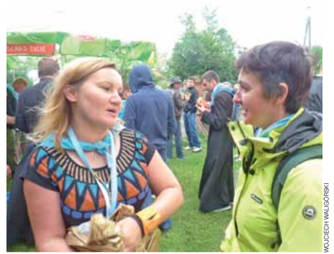
Pielgrzymi na postoju przy kościele św. Anny w Bolimowie.

Bolimów | W drodze do Niepokalanowa pielgrzymi mieli tu postój