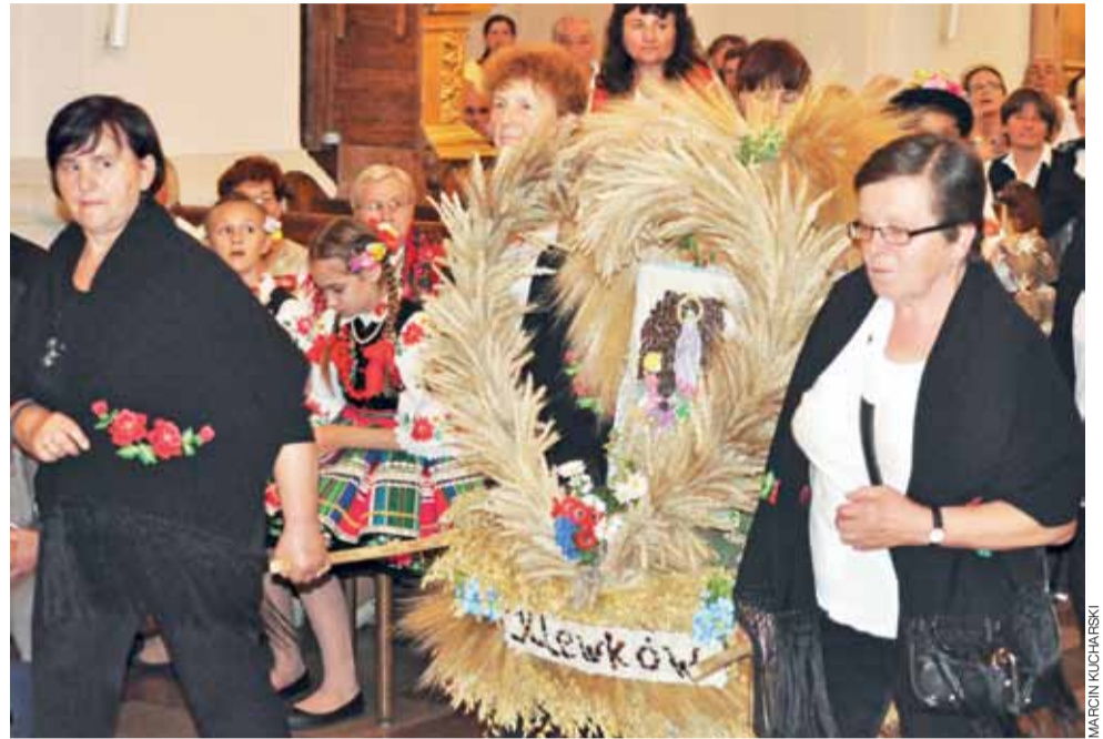
Wieniec dożynkowy przygotowany przez mieszkańców Klewkowa.