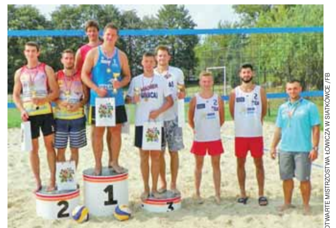
Zwycięcy Turnieju Miast w Łowiczu. Na podium brak głównian.