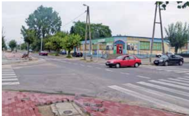
Na skrzyżowaniu Bielawskiej z Kilińskiego i Szkolną jeszcze w tym roku pojawi się sygnalizacja świetlna.

Starostwu Powiatowemu w Zgierzu udało się za drugim razem wybrać firmę, która wykona sygnalizację świetlną na skrzyżowaniu ul. Bielawskiej z ulicami Szkolną i Kilińskiego w Głownie. Została nim firma F.H.U. Macuga z Łodzi.