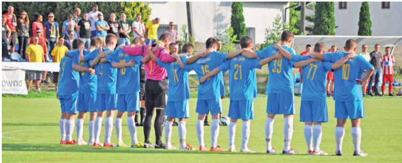
Piłkarze Stali Głowno musieli mieć mocno spuszczone głowy po pierwszym spotkaniu w V lidze. Głownianie z kretesem ulegli beniaminkowi Górnikowi Łęczycyca 1:4.