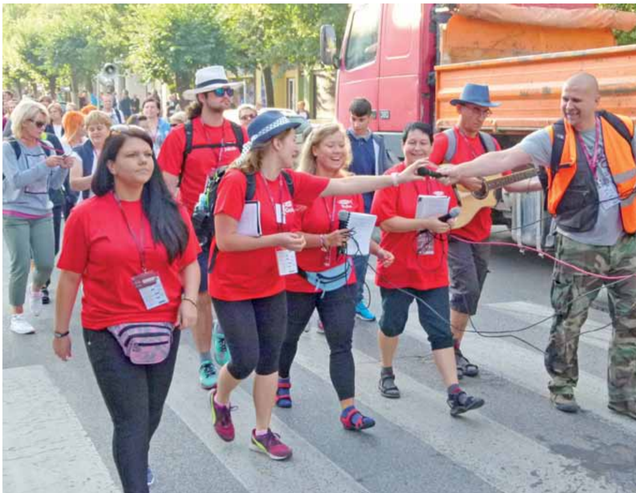
Nadawali rytm pielgrzymce. Grupa muzyczna w czerwonych koszulkach.