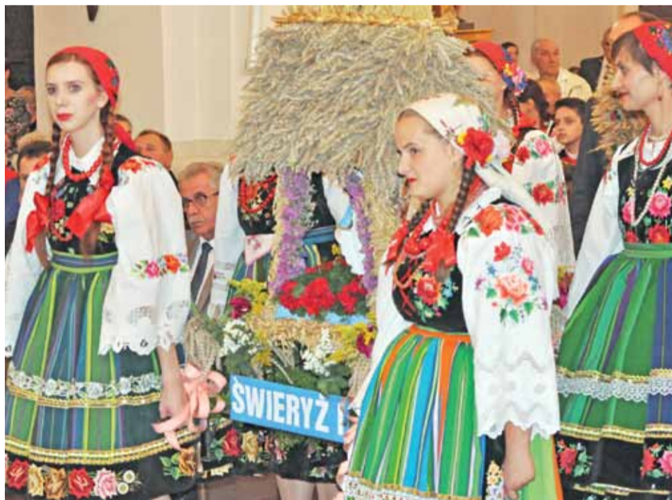
Dziewczyna ze Świerzy I przygotowuje tradycyjny wieniec ze zbóż. Niosły go w strojach ludowych.

Zanim wieniec zostały wprowadzone do katedry, zostały poświęcone przez biskupa Wojcie-