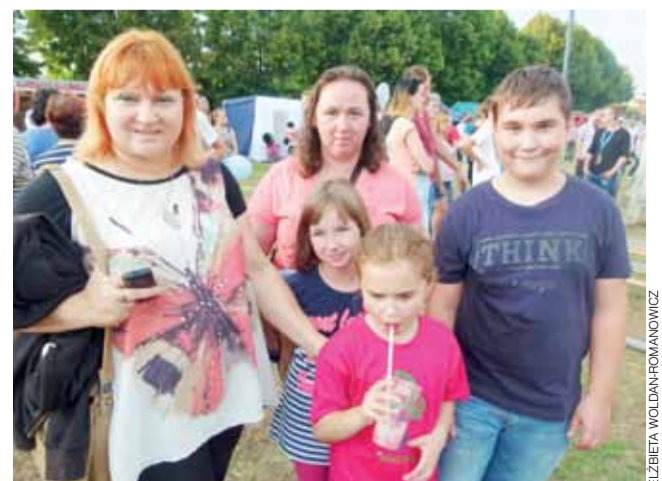
Ta rodzina z Kuluszek co roku przyjeżdża na Święto Głowna. Tym razem najbardziej wyczekiwali koncertu Kamila Bednarka.