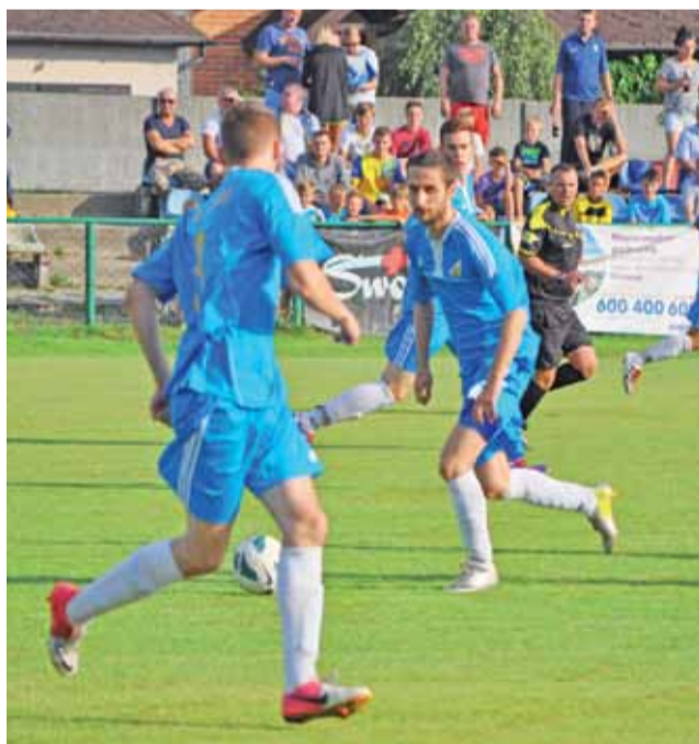
Stal Głowno od początku sezonu widzi plecy rywali. Wkrótce ma się to jednak zmienić.

Choć wynik nie odzwierciedla przebiegu spotkania to jednak dotkliwa porażka zaprowadziła Stal na koniec tabeli. Oprócz Górnika tak samo wysokie zwycięstwo odniosły rezerwy Sokoła Aleksandrów Łódzki po pokonaniu Polonii Andrzejów. W ośmiu spotkaniach 1. kolejki V ligi zanotowano tylko jeden remis. Punktami podzielili się spadkowicz z IV ligi Boruta Zgierz i jeden z kandydatów do czołówki w tym sezonie Orzeł Parzęczew.