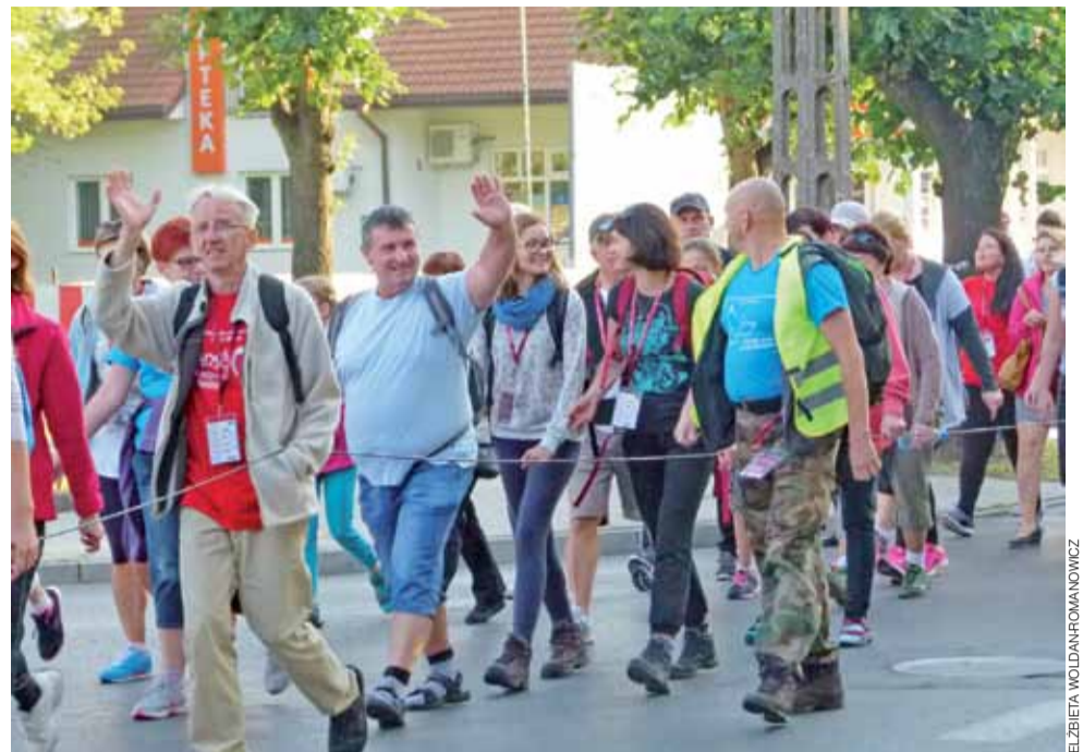
Na początku drogi. Uczestnicy pielgrzymki na ul. Zgierskiej. Jak widać, patrząc na nogi: pojęcie „wygodne buty” może być różnie rozumiane.