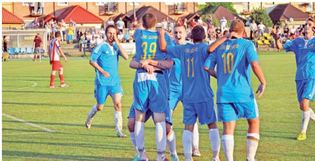
Piłkarze Stali Głowno liczą, że uda im się awansować do kolejnej rundy mimo nienajlepszego losowania.

Strykowscy kolarze szykują się już do wrześniowych startów, ale zanim to nastąpi czekają nas jeszcze emocje podczas Górskich Szosowych Mistrzostw Polski, które zaplanowane są już w najbliższą sobotę, 27 sierpnia w Wysowej. Prawo startu mają w nich zawodnicy kategorii junior młodszy (15-16 lat). Młodzicy z kolei będą trenować do wrześniowych Mistrzostw Makroregionu Centralnego na torze w Łodzi. wp