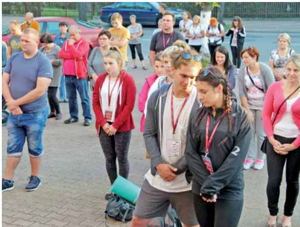
Przed startem pielgrzymki. Zbliża się ku końcowi msza św. w kościele św. Jakuba Apostoła w Głownie.