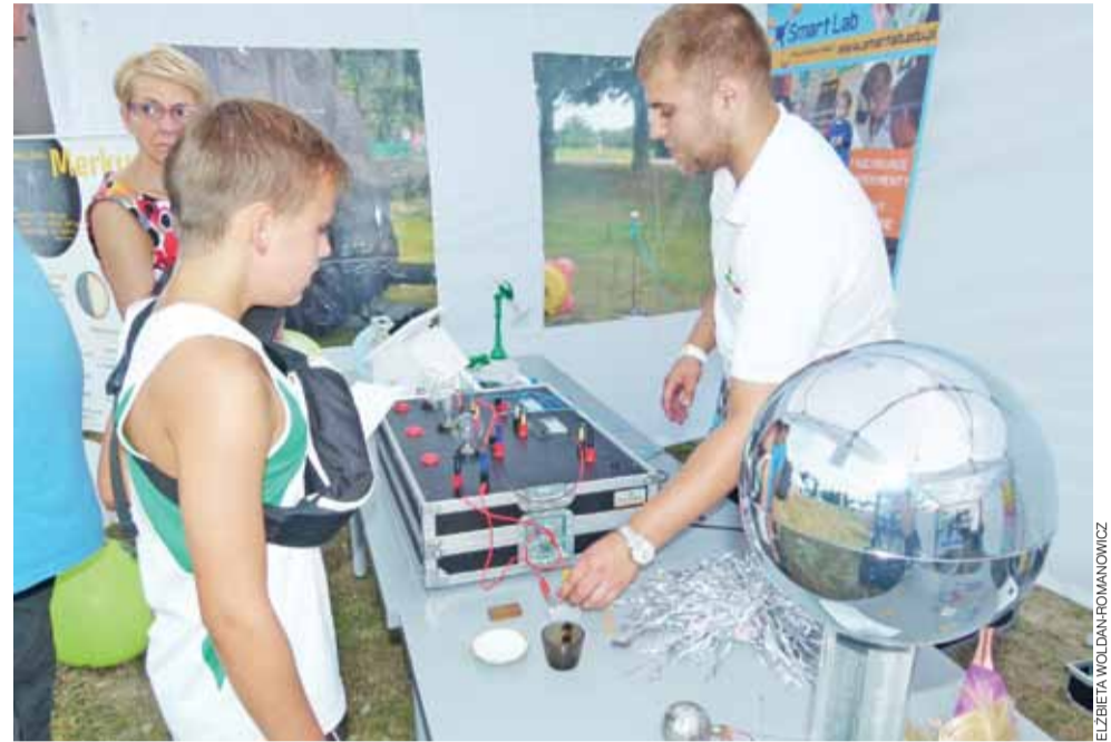
Smart Lab. W tej części laboratorium można było dowiedzieć się, w drodze doświadczenia, jakie metale przewodzą prąd elektryczny.