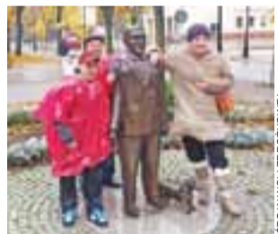
Uczestnicy ŚDS w Woli Zbrożkowej przy pomniku Jerzego Waldorfa.

Wycieczka do Cieclocinka i Torunia odbyła się w dniach 24-26 października. Jej uczestnicy mieli okazję doświadczyć na sobie dobrodziejstw wyjątkowego ciechocińskiego mikroklimatu, spacerując po terenach tężni solankowych. Zakwaterowani zostali w sanatorium „Chemik”. Podczas spaceru z przewodnikiem podziwiali najbardziej urokliwe miejsca