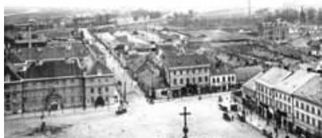
Panorama Łowicza z wieży obecnej katedry, wykonana w 1929 roku pokazuje m.in. gmach obecnego muzeum, ulicę – dziś 3 Maja – prowadzącą do torów, teren obecnego osiedla Tkaczew, okazały budynek dworca Łowicz Główny.