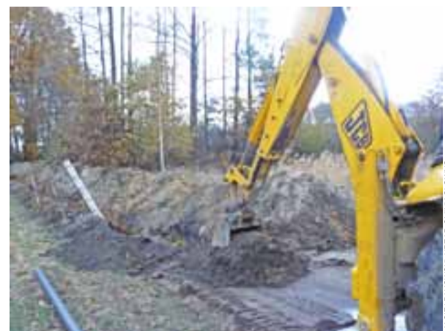
Budowa wodociągu. Stan na 3 listopada, widok od strony drogi Lubianków – Borki.

Przypominamy, że wykonawcę budowy wyłoniono w trybie zapytania ofertowego, do którego przystąpiło 5 firm. Wybrana oferta Zakładu Usługowo-Produkcyjno-Handlowego Dariusza Śliwkiewicza z Bratoszewic opiewała na około 114 tys. zł brutto. Umowę z wykonawcą podpisano w czwartek 6 października. Firma udzieli na swoje prace długiej gwarancji – aż 120-miesięcznej, czyli 10-letniej. Termin odbioru inwestycji upływa 18 listopada. ewr