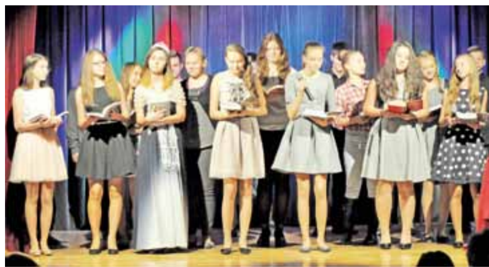
Z programem „Ballada o sienkiewiczowskich bohaterach” wystąpili podczas Święta Jesieni w Zdunach miejscowi gimnazjaliści.

Większość utworów kwartet zagrał w wersji instrumentalnej, ale nie wszystkie. Utwór skomponowany w 1969 roku przez Wojciecha Kilara „W stepie szerokim” znanym także pod tytu-