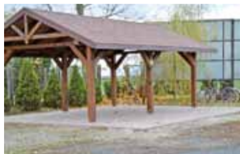
Zadaszona wiatra. Tę inwestycję udało się zrealizować dzięki pomocy finansowej z Urzędu Marszałkowskiego i gminy Głowno.

W Woli Lubiankowskiej zrealizowano projekt pod nazwą „Niech połączy nas tradycja w wiejskiej świetlicy”, dotowany przez Urząd Marszałkowski kwotą 5 000 zł i z udziałem własnym gminy Głowno na poziomie 5.575,02 zł, a dodatkowo 300 zł przekazali mieszkańcy wsi.