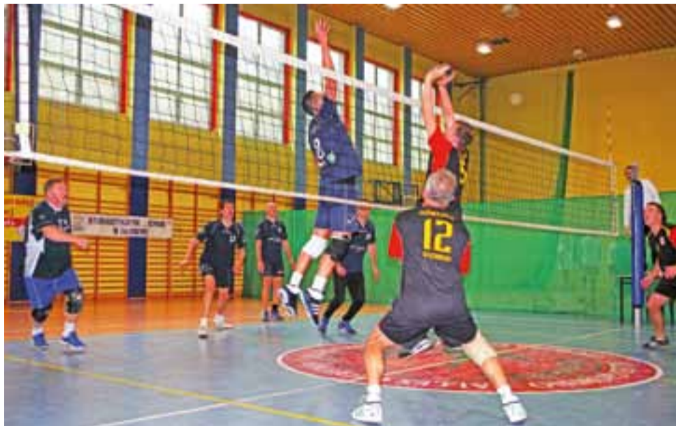
Siatkarze Oświaty Głowno (czarno-czerwone stroje) zajęli 2. miejsce w Ogólnopolskim Turnieju.

Wielkie emocje towarzyszyły zwłaszcza finałowi turnieju męskich, w którym siatkarze Ozorkowa