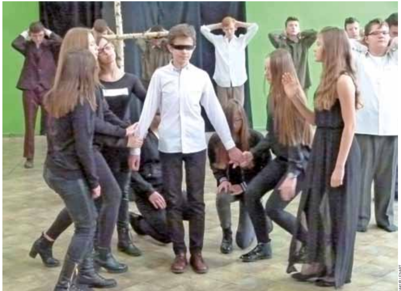
Uczniowie z gimnazjum wystawili wzruszający spektakl.