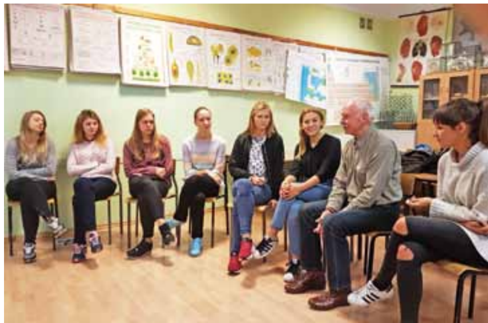
To była zupełnie inna lekcja, prowadził ją człowiek, dla którego język niemiecki jest mową ojczystą.

Poprowadził tam lekcję dla młodzieży uczącej się niemieckiego na poziomie rozszerzonym. Chętnie włączył się do wspólnych gier i zabaw językowych, następnie odpowiedział na pytania uczniów. Podziękował i przyznał, że miło było znów poprowadzić zajęcia, obecnie jest bowiem emerytem. Przyznał, że żadnego z wielu miejsc w Polsce, w których przyszło mu pracować, nie wspomina z aż tak wielkim sentymentem jak Łowicza. tm