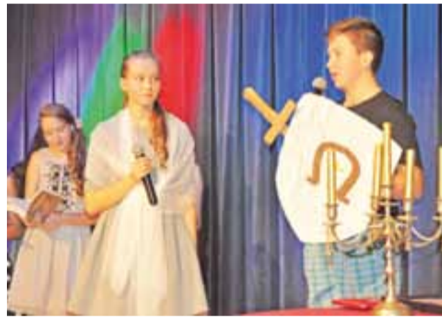
Choć Harry Potter dobrze czaruje, Jurand potęgą mu nie ustępuje! – przekonywali ze sceny gimnazjaliści.