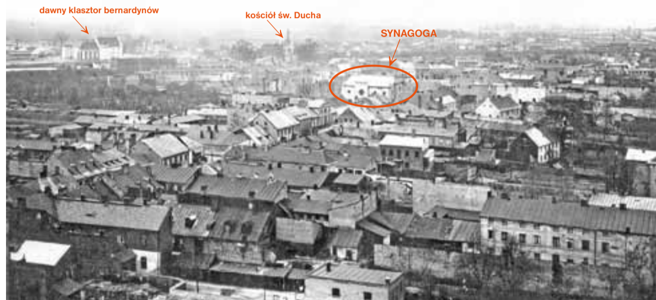
Tak wyglądało centrum Łowicza w 1929 roku: zabudowania pomiędzy obecnymi ulicami Podrzeczną i Zduńską – z okazałym, niestety niezachowanym do naszych czasów, budynkiem synagogi.

W dalszej wypowiedzi Rutkowski zwraca uwagę na to, że właśnie ten okres w dziejach Ło-