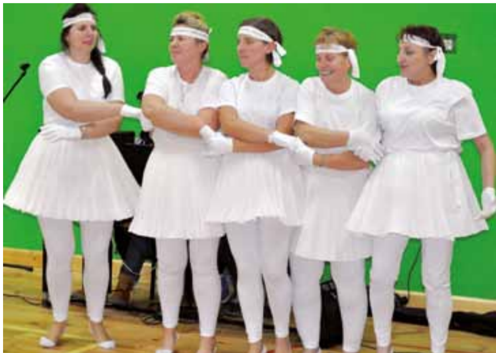
"Jezioro łabędzie" w wykonaniu gospodyń z KGW w Zielkowicach było gorąco oklaskiwane przez publiczność.

Kwesta na remont nagrobków: sukces mimo deszczu. str. 27