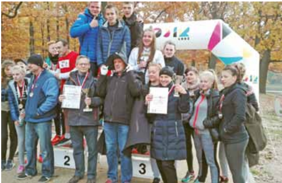
Po rywalizacji biegowej przyszedł czas na pamiątkowe zdjęcie z Hrabią Drakulą.

Drugą przeszkodą był bieg plażą po trzech długościach 60 m. Odcinek plażą dał wycisk nawet najmocniejszym biegaczom, z kolei na trzeciej bramce uczest-