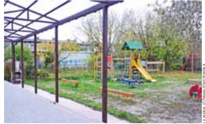
Plac zabaw dla najmłodszych to jeden z elementów zagospodarowania działki za świetlicą w Bratoszewicach.

na boisko) – 25 tys. zł. W przyszłym roku Bratoszewice planują wydać swój fundusz sołectki, wynoszący ponad 47 tys. zł, na: remont i budowę ogrodzenia świetlicy, wyposażenie świetlicy, zakup i serwis toalety ToiToi przy placu zabaw, zakup kosiarzki i paliwa do koszenia terenów przy świetlicy, zakup nagłośnienia