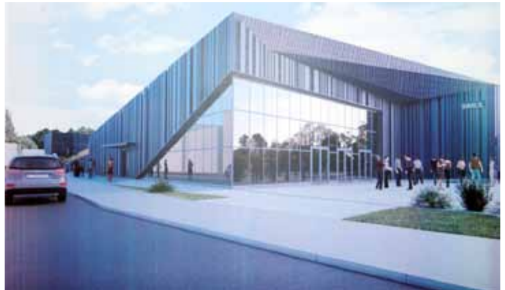
Koncepcja Centrum Kultury wg Kontrapunkt V-projekt. Widok od strony głównego wejścia, czyli z rogu ulic: Kościuszkowej i Warszawskiej.

Dla gminy Stryków konserwatorskie decyzje są jednymi z ważniejszych, bo nowy obiekt ma stanąć w pobliżu liczącego sobie 102 lata kościoła św. Marcina. Tymczasem to już trzecia osoba na stanowisku wojewódzkiego konserwatora, z którą uzgadnianie