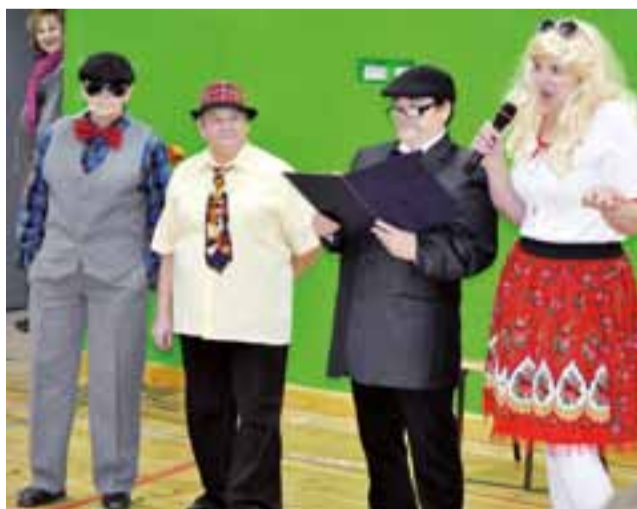
Gospodynie z Zielkowic zaprezentowały m.in. skecz o poszukiwaniu męża przez agencję matrymonialną.

Gmina Łowicz | Przegląd Kabaretowy Gropa 2016