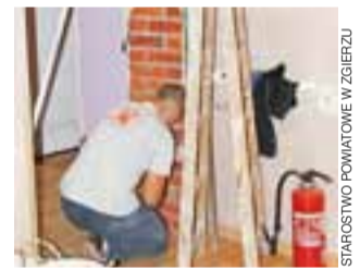
Montowanie drzwi przeciwpożarowych.

– W razie wykrycia jakiegokolwiek zagrożenia, system sygnalizuje niebezpieczeństwo w centralce, która znajduje się w dyżurce pielęgniarek, a w razie pożaru automatycznie łączy się z Powiatową Komendą Państwowej Straży