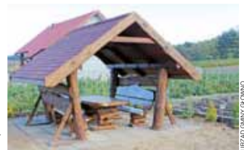
Wola Lubiankowska. Nowa altana stanęła przy wiejskiej świetlicy.

Całkowity koszt zadania wyniósł więc 10 875,02 zł, a objęło ono: doposażenie świetlicy (priorytetem był zakup kuchni węglowej do ogrzania budynku, aby móc korzystać ze świetlicy cały rok, jak również zakup kuchni gazowej i zlewozmywaka, aby ułatwić przygotowywanie posiłków i utrzymanie czystości), jak również posprzątanie placu wokół budynku (teren został wyrównany i obsadzony krzewami ozdobnymi, zamontowano drewnianą altanę, zakupiono stół i ławki ogrodowe).