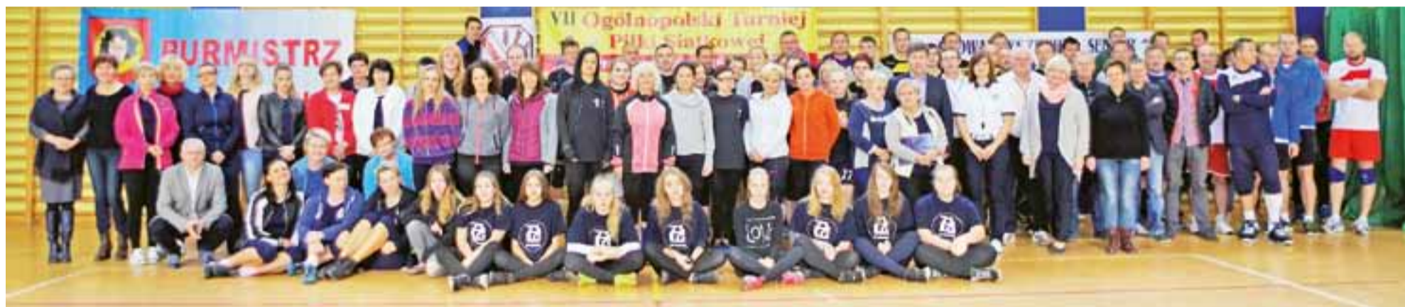
Uczestnicy VII Ogólnopolskiego Turnieju Piłki Siatkowej Pracowników Oświaty w Głownie 2016 zgodnie przyznali, że już nie mogą doczekać się kolejnych zawodów.

■ 11. kolejka B-klasy, gr. I: GKS Byszew - Olimpia Oporów 3:2, Iskra Głowno - Sokół Popów 0:1, KS Żychlin - Sand Bus II Kutno 0:3, LKS II Gałkówek - Start Szczawin 3:1. str. 38