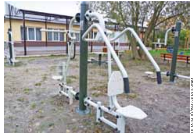
Bratoszewicki fitpark wyposażony jest m.in. w: stepper i surfer, orbitrek, twister i biegacz, które dają możliwość wykonywania ćwiczeń rekreacyjnych wszystkich partii ciała: nóg, ramion, brzucha i pleców.

nia przenośnego, a poza tym: projekt oświetlenia ul. Polnej, remont i wyposażenie siłowni przy