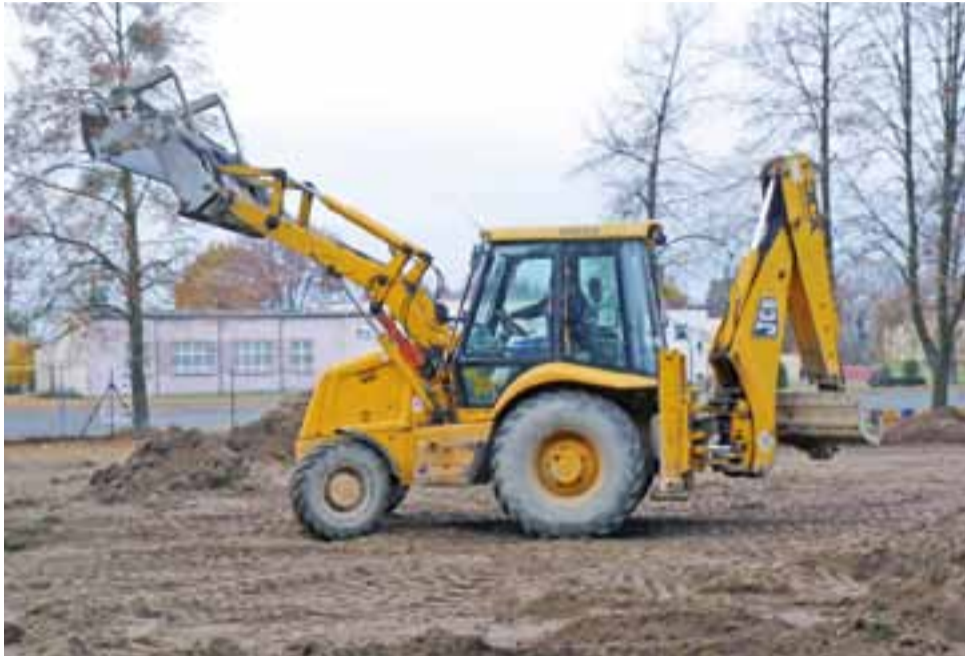
Modernizacja boiska przy ZS Nr 2 w Bratoszewicach. Roboty wykonuje łowicka firma Malbud.

Urządzenia takie jak: stepper i surfer, orbitrek, twister czy biegacz zapewnią możliwość wykonywania ćwiczeń rekreacyjnych wszystkich partii ciała: nóg, ramion, brzucha i pleców. Mogą z nich korzystać osoby dorosłe