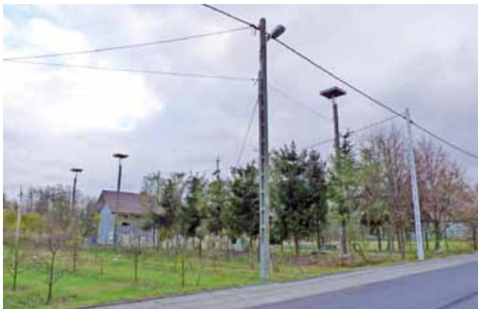
Właściciel działki w Nowostawach Górnych szuka pomocy u wojewody w sprawie zawieszenia przez gminę Stryków lampy na nowym słupie energetycznym.

Z tego względu zakład energetyczny zdecydował się na ustawienie nowego słupa w pasie drogowym tuż przy działce mieszkańca Głowna. Prąd został doprowadzony do budynku. 10 sierpnia tego roku właściciel działki zwrócił się z pisemnym wnioskiem do Urzędu Miejskiego w Strykowie o to, żeby na nowym słupie energetycznym zamontowano lampę oświetle-