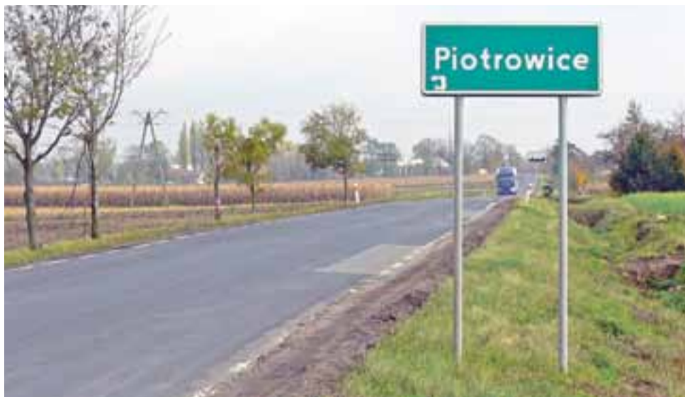
W oczekiwaniu na przyszłoroczny remont. Droga wojewódzka nr 703 na wysokości Piotrowic w gm. Bielawy.

W celu poprawy bezpieczeństwa ruchu drogowego zaprojektowano rozbudowę skrzyżowań (z wytyczeniem na wybranych skrzyżowaniach pasów do lewo-skrajów), budowę oświetlenia oraz budowę zatok autobusowych. Przewidziano również rozbiorę wszystkich mostów i przepustów zlokalizowanych pod drogą i zastąpienie ich nowymi obiektami, dostosowanymi do projektowanych parametrów drogi. Przebudowie ulegną również istniejące zjazdy, a także kolidujące z drogą sieci uzbrojenia terenu – tylko w takim zakresie, w jakim konieczność ich przebudowy wynika z projektowanych parametrów drogi.