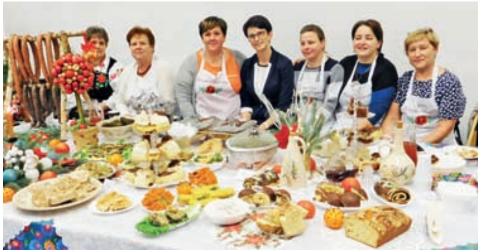
Jednym z elementów stoiska przygotowanego przez delegację z Kocierzewa Płd. było nakrycie świątecznego stołu. Ponoć najsmaczniejszym kąskiem na nim były pierogi.

Centralne Targi Rolnicze odbywały się przez 3 dni, od 25 do 27 listopada. Z naszego terenu oprócz gminy Kocierzew Płd. uczestni-