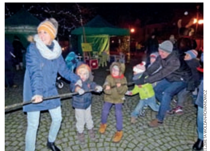
Przeciąganie liny. Jedną z wielu atrakcji mikołajkowego pikniku. Chętnych do udziału w zabawie z animatorami nie brakowało.