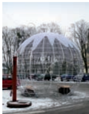
Najbardziej okazała nowa iluminacja stanęła na placu Łukasińskiego.

Iluminacje wykorzystane w parku kosztowały gminę