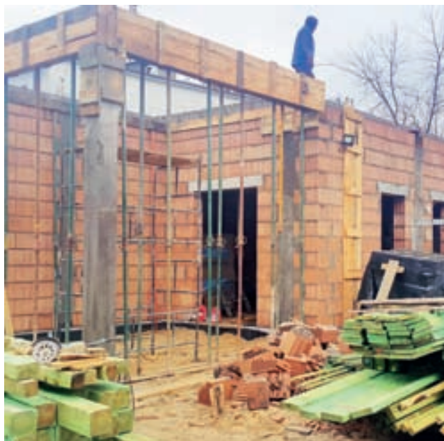
Prace przy rozbudowie Środowiskowego Domu Pomocy w Woli Zbrożkowej. Stan na 2 grudnia.

Kierownictwo placówki, a także władze gminy, kibicujące inwestycjom, są przekonane, że przyczynią się one do zapewnienia standardów, które pozwalają na realizację długofalowego programu pomocy osobom z zaburze-