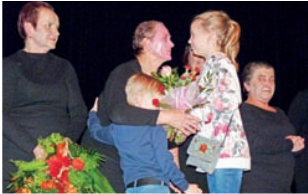
Po spektaklu do aktorek od razu podbiegli najbliżsi.

Wejście na niedzielny spektakl było zupełnie darmowe, lecz AleBabki! włączyły się w akcję Szlachetnej Paczki, dlatego poprosiły o przyniesienie artykułów spożywczych i chemicznych, na co licznie odpowiedzieli ich goście. Trafia one do jednej z potrzebujących rodzin. aa