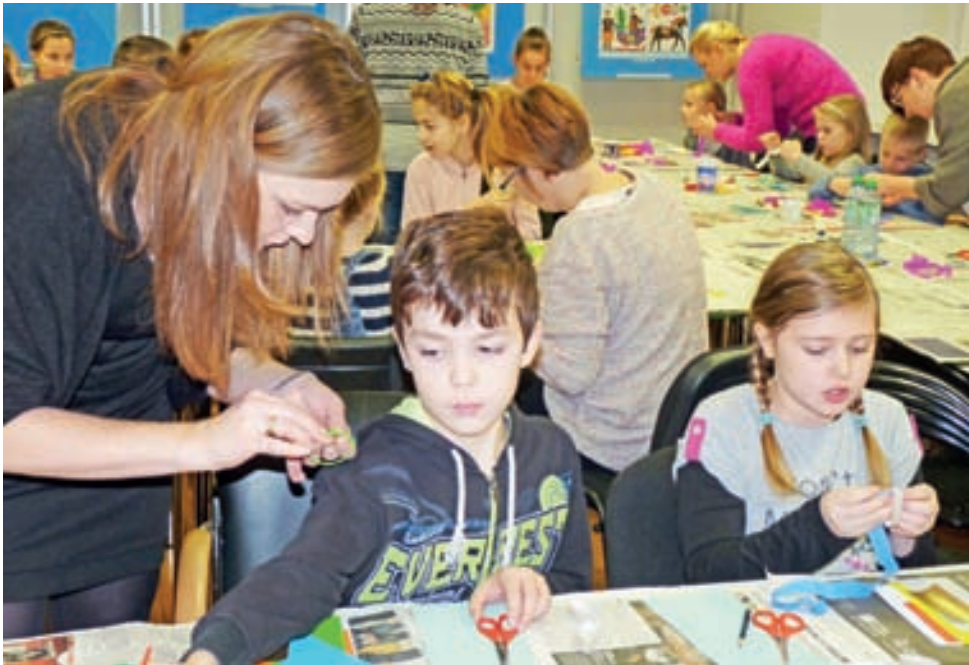
Świąteczne warsztaty w muzeum w Łowiczu. Podczas wykonywania ozdób pomoc dorosłych okazywała się nieodzowna.