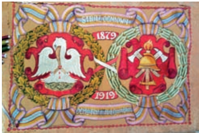
Jeden z odnowionych dzięki projektowi eksponatów – sztandar łowickiej straży ogniowej z 1919 r. Wszystkie odnowione eksponaty można też oglądać na internetowej stronie muzeum.

Odnowione w ten sposób zostały: obraz haftowany „Święta Rodzina w ogrodzie” (XVII wiek), dekoracyjna tkanina broszowana (XVIII wiek), dwa jedwabne pasy kontuszowe (XVIII wiek), tkanina – collage z wizerunkiem Matki Boskiej (XIX wiek), tkanina cechowa z 1802 r., sztandar – chorągiew patriotyczna z 1905 r., sztandar Cechu Rzeźników w Łowiczu z 1909 r., i sztandar Łowickiej Straży Ogniowej z 1919 r. tm