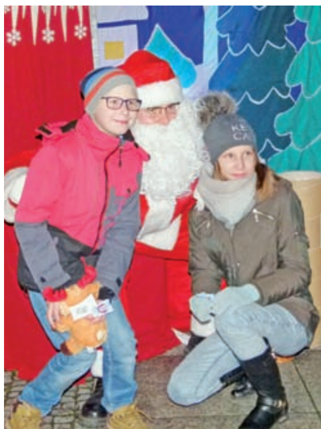
Ciekawie spędzić czas z dziećmi można było na Mikołajkowym Pikniku Rodzinnym, 4 grudnia w Głownie. Nasza relacja - str. 3