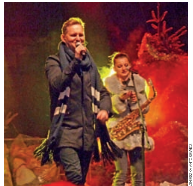
Zespół M.I.G sprawił, że mimo mrozu nikomu pod sceną nie było zimno. Publiczność bujała się do tanecznych dźwięków w wykonaniu formacji.