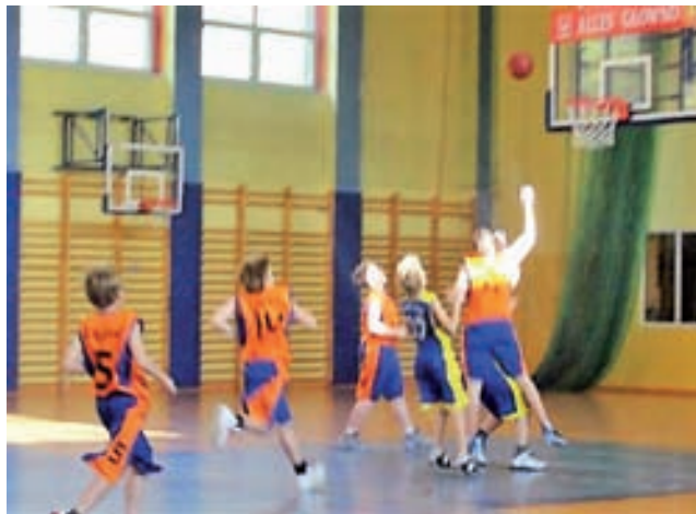
Koszykarze GTK Głowno (pomarańczowo-niebieskie stroje) w akcji.

Po 8. kolejkach podopieczni trenera Rafała Szulca zajmują