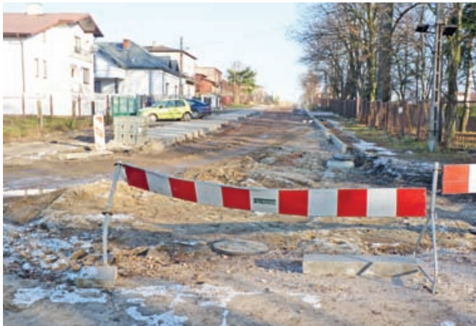
W tym roku inwestycji przy ul. Żwirki nie uda się doprowadzić do końca.

Dodał jednak, że najpewniej prace zakończą się wcześniej. Do czasu finału inwestycji ul. Żwirki ma być przejezdna i utwardzona chociażby tuczniami. kl