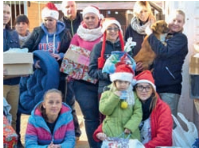
Tak było w Wigilię rok temu. Paczka dla Zwierzaczka. Edycja 2015.

Na prezenty dla zwierząt TPZ czeka do 21 grudnia.