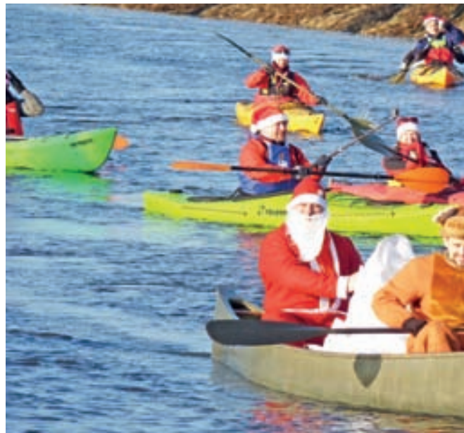
Mikołaj z reniferem i swoimi pomocnikami przyплыли do dzieci kajakami.

Byli nimi uczniowie Pijarskich Szkół Królowej Pokoju, członko-