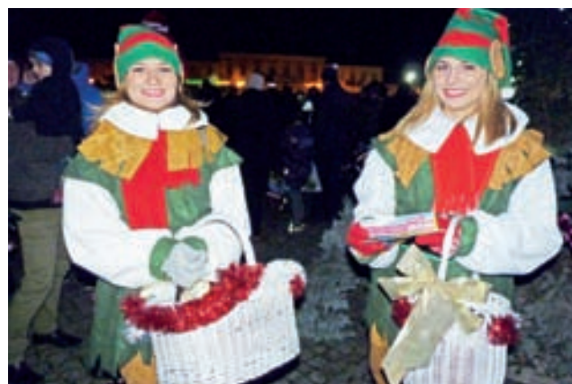
Przez całą choinkę na Nowym Rynku można było spotkać takie oto uroczce elfy z Bajkalandu, które rozdawały drobne upominki.