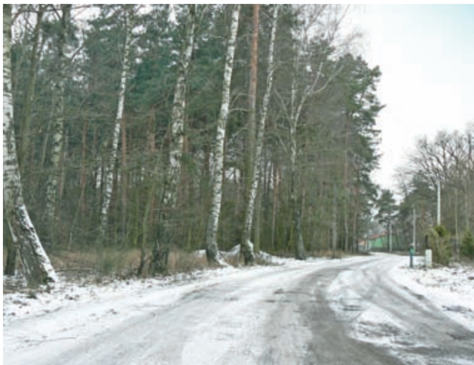
Droga w Piaskach Rudnickich. To w sprawie jej pozyskania od Lasów Państwowych gmina wdrożyła procedurę specustawy. Stan na 30 listopada.

Już w 2005 r., gdy asfaltowano drogę przez wieś, okazało się, że jeden z odcinków formalnie nie istnieje.