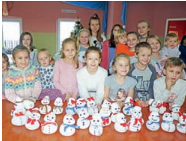
Po warsztatach do grona uczestników dołączyły wykonane przez nich bałwanki. Wszyscy pozowali do wspólnego zdjęcia.

W sobotnim spotkaniu wzięło udział kilkadziesiąt osób, dzieci i ich rodziców. Byli nimi mieszkańcy Starych Grud, ale także innych gminnych miejscowości i sąsiedniego Jamna. Podczas warsztatów powstawały bałwany, które były wykonywane z białych skarpetek, wypełnianych ryżem, przewiązanych pośrodku gumką.