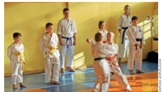
Techniki karate demonstrowali także najmłodszy z strykowskiej grupy.