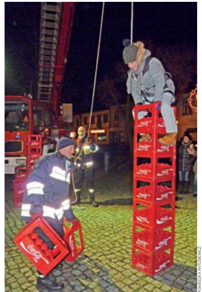
Strażacy z PSP w Łowiczu przygotowali wiele atrakcji, a jedną z nich była taka wspinaczka po skrzynkach z asekuracją.

Przez całą choinkę na Nowym Rynku spotkać można było Mikołajów i elfy.