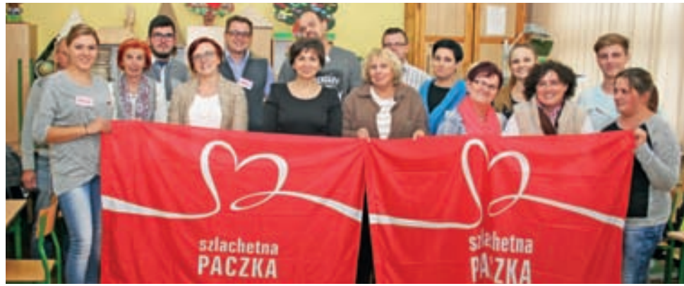
Łowiccy wolontariusze Szlachetnej Paczki, uwiecznieni podczas szkolenia tzw. wdrożeniowego, które odbyło się w SP nr 4 Łowiczu w listopadzie.