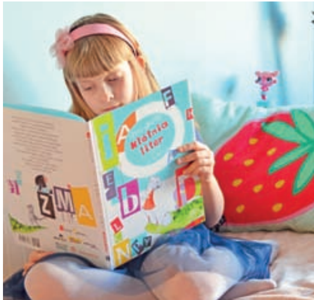
„Kłótnia liter”. Książkę zilustrowaną przez Agnieszka Myszkowską czyta siostrzenica artystki Pola Wybrzak.

Na pewno książka ta przełamuje stereotypy w nauczaniu najmłodszych alfabetu. Poszczególne litery swoim wyglądem nie starają się odwzorowywać postaci czy przedmiotów rozpoczynających się na nie, tylko pozostają tym, czym są – literami. Zastosowanie na jednej stronie różnych czcionek i wielkości przyzwyczajają oko dziecka do zapisu czy wydrukowania na kilka sposobów.