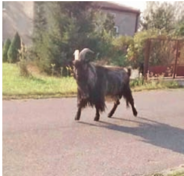
Koziół na ulicy.