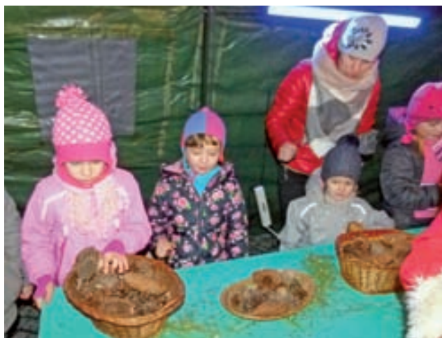
Warsztaty plastyczne. W ogrzewanym namiocie udostępnionym przez PSP dzieci robiły ekologiczne ozdoby choinkowe z szyszek.

wych nabytków, o które udało się wzbogacić świetlicę dzięki zdobytemu jesienią przez wieś marszałkowskiemu grantowi. Jest to zestaw nagłaśniający oraz namiot piknikowy. W jaki sposób ten drugi można wykorzystać na zimowej imprezie, przekonają się wszyscy, którzy w sobotę przyjdą do świetlicy. tjs