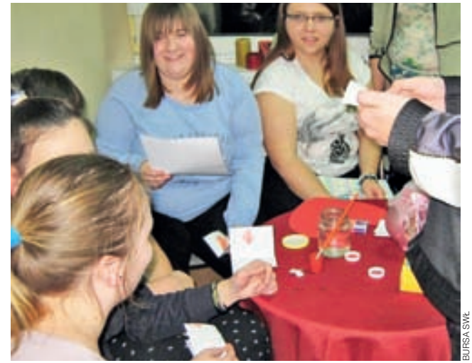
Uczestnicy poznają stare sposoby na odgadnięcie przyszłych losów.

– Młodzi podeszli do nas bardzo życzliwie. Myślę, że nasza działalność nie będzie im się kojarzyła tylko z dokarmianiem kotów, ale też rozwiązywaniem poważnych problemów i zwierząt, i ich właścicieli – mówi pani prezes. Jej zdaniem świadomość ludzi dotycząca tego, że zwierząt nie można krzywdzić, pomimo zdarzających się przykrych wyjątków, wzrasta. A świadczyć może o tym chociażby coraz większa liczba interwencji, jaką ŁSPZ podejmuje. mwk