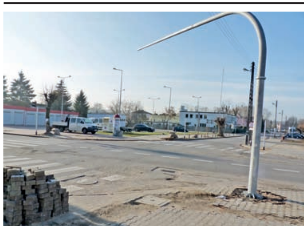
W najbliższych dniach w tym miejscu pojawi się pełna sygnalizacja świetlna.