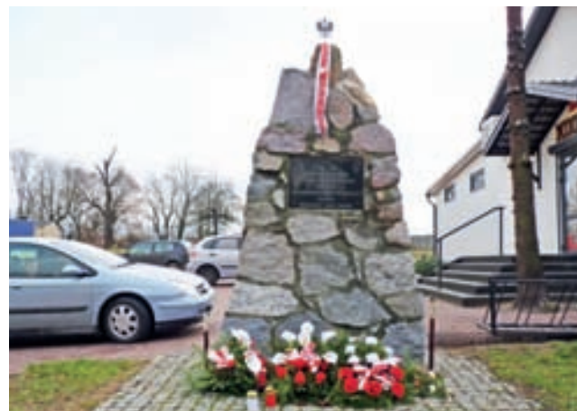
Obelisk odzyskał orła w koronie przed tegorocznym listopadowym Świętem Niepodległości.

Dzięki dużemu zaangażowaniu mieszkańców odsłonięcie pomnika nastąpiło 11 listopada, a uroczystość przybrała formę manifestacji patriotycznej, w której oprócz mieszkańców udział wzięli również starosta i wójtowie sąsiednich gmin. Wówczas to umieszczono na obelisku tablicę z napisem: 11 XI 1918-1928. W dziesiątą Rocznicę Odzyskania Niepodległości w Hołdzie Najjaśniejszej