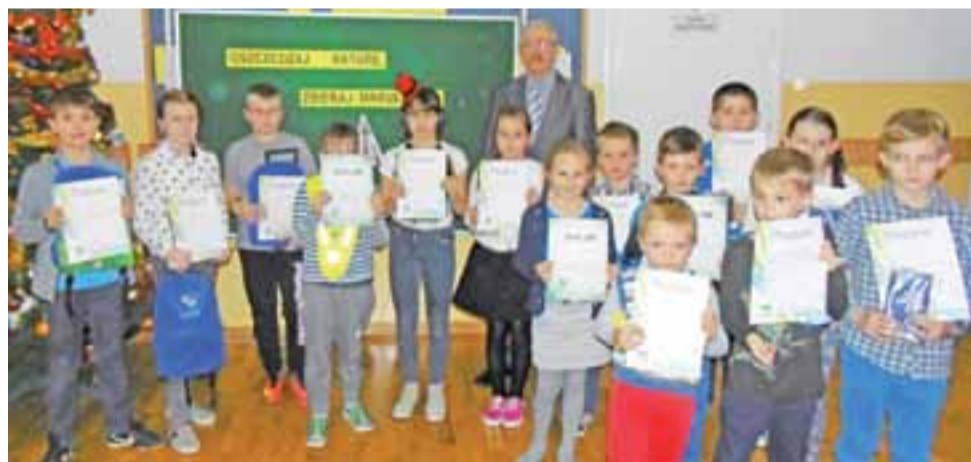
Wszyscy uczestnicy konkursu prezentują otrzymane dyplomy i nagrody.

Zwraca on przy tym uwagę, że akcji towarzyszył konkurs, w któ-