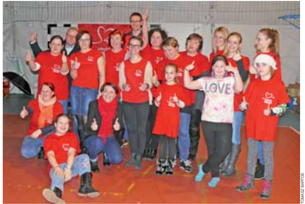
Łowicka Szlachetna Paczka prawie w komplecie, niestety w niedzielę wielu wolontariuszy skończyło pracę, zanim przysiężli do sztabu w „siódemce”.