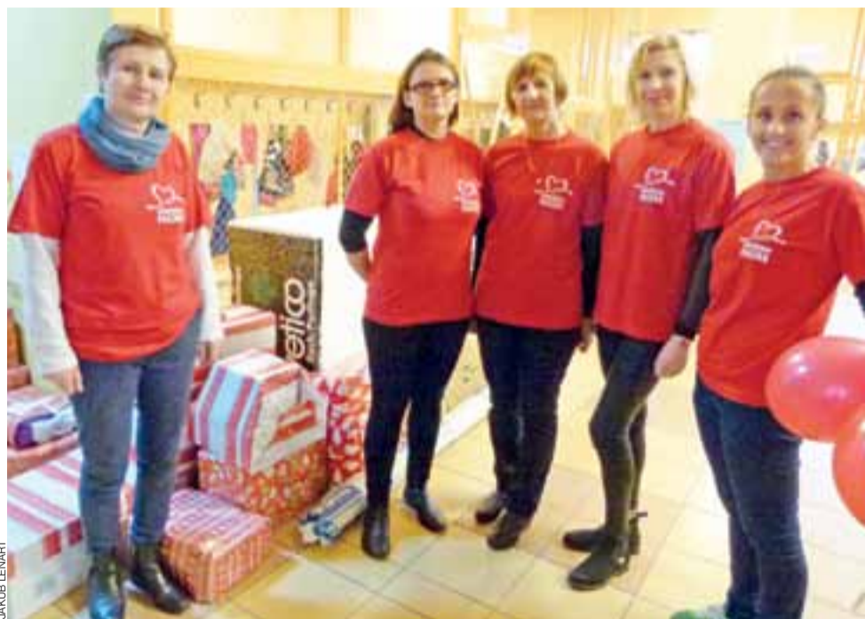
Półowa głowieńskiego składu wolontariuszy przy przygotowanych paczkach.