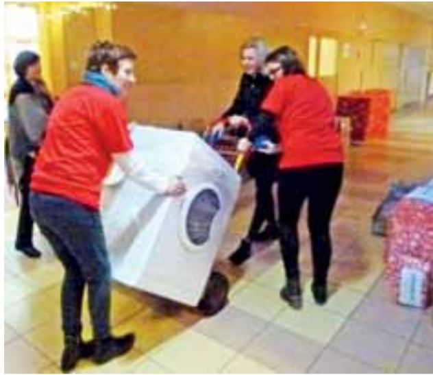
Niektórym rodzinom potrzebny był sprzęt AGD.

Magazyn Szlachetnej Paczki w Głownie mieścił się w Szkole