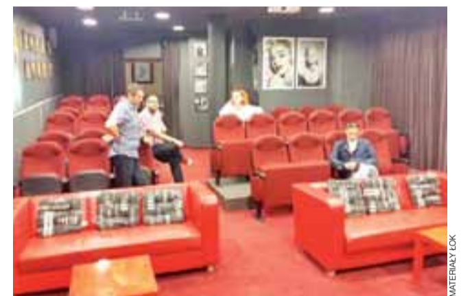
Art House Awangarda w Olsztynie, czyli jeden z wielu przykładów aranżacji kameralnej sali kinowej.

Do PISF trafił już wniosek o pozyskanie środków na zamontowanie klimatyzacji w sali kina Fenix. Ośrodek spodziewa się otrzymać decyzję o przy-