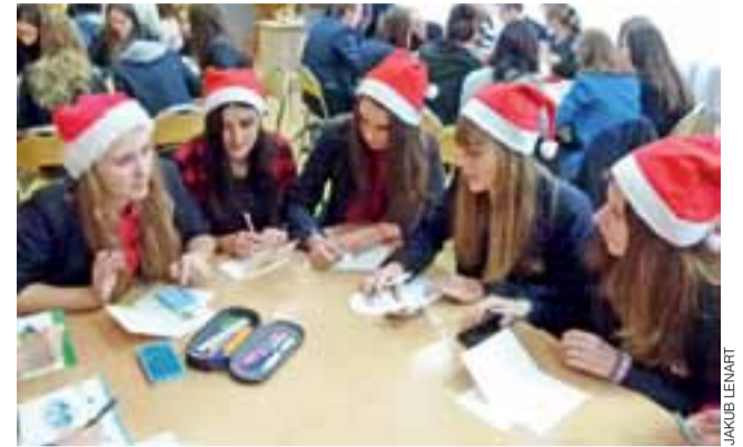
Uczennice z klasy I MB przy pisaniu kartek dla dzieci.