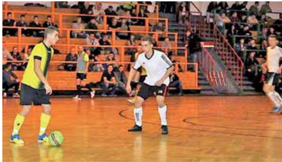
Zawodnicy Fantazji Głowno (białe koszulki) nie popełniają już głupich błędów, co daje im zwycięstwa.

W drugiej części przewaga głownian nie podlegała dyskusji. Świetnie współpracował