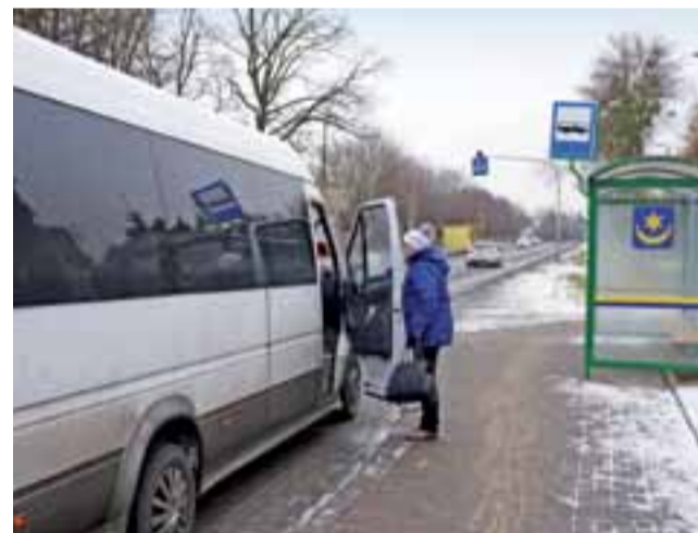
Przystanek w Bratoszowicach. Pasażerowie jadący w stronę Łodzi mogą oczekiwać na transport w nowej wiacie. Niestety jej wyposażenie już zostało nadszarpnięte.

Wiaty wyposażone są w drewniane ławki oraz gablotki na rozkłady jazdy. Dodatkowo każda z nich oznaczona jest godłem Strykowa i znakiem przystanku.