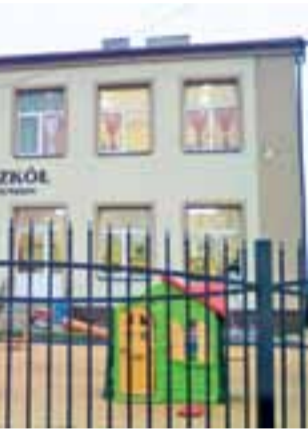
Zespół Szkół w Popowie Głowieńskim. Widok o poranku 14 grudnia.