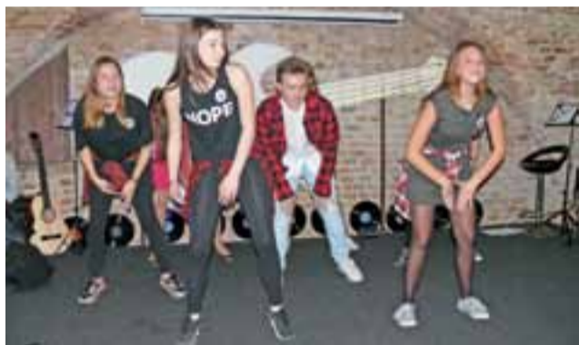
Urozmaiceniem występów wokalnych był występ działającej w szkole grupy tanecznej Stokrotki.

Przy wejściu do restauracji przez cały czas koncertu stali gimnazjaliści, zbierający pieniądze do puszek. Publiczność okazała się ofiarna, wejście na wydarzenie wiązało się z wydatkiem 5 zł, ale ofiarowano dużo więcej: z puszek wyjęto łącznie 5.244 zł. tb