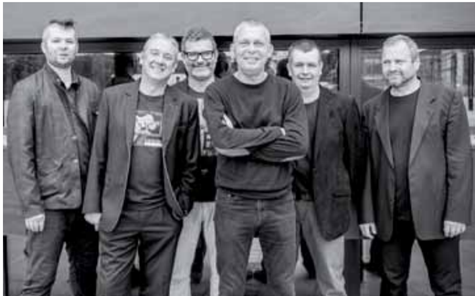
Zespół Raz Dwa Trzy zagra koncert inauguracyjny 18. edycji Och! Film Festiwalu.

– Będzie to 18. edycja Och!, co oznacza, że festiwal osiąga w tym roku pełnoletność. W części filmowej kino polskie i światowe – 13 tytułów na 26 seansach, zaś jeśli chodzi o muzykę, kierowali się kluczem, którym