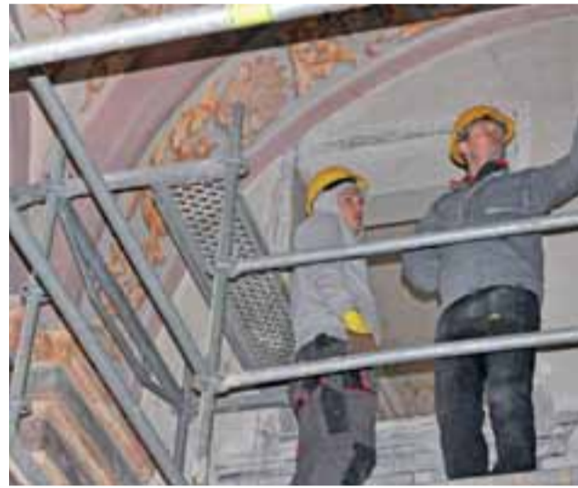
Pracownicy krakowskiej firmy AC Konserwacja zakończyli roboty konserwacyjne polichromii w nawie wschodniej kościoła pijarskiego.