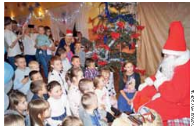
Magiczne chwile. Dzieci słuchają tego, co ma im do powiedzenia Mikołaj, który zasiadł na specjalnie przygotowanym miejscu.

W niedzielę, 18 grudnia, w Zakładzie Opiekuńczo-Lecznicznym Medical w Głownie odbędzie się organizowana przez Regionalne Centrum Krwiodawstwa i Krwiolęcznictwa w Łodzi zbiórka krwi. Oddawać krew będzie można w godzinach 9.00-12.00. Przypominamy, że krew oddawać mogą osoby pełnoletnie, legitymujące się dowodem tożsamości z numerem pesel. Krwiodawca powinien być osobą w pełni zdrową. Przez oddaniem krwi należy zjeść lekki posiłek. Nie powinno się palić papierosów. kl