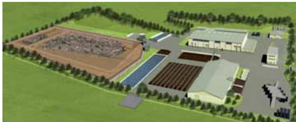
Wizualizacja zakładu zagospodarowania odpadów w Piaskach Bankowych – ma on być wybudowany do listopada 2017 roku, a w 2018 roku mają do niego trafić pierwsze odpady.

Spośród ofert najdroższa należy do konsorcjum Instal Warszawa w partnerstwie z Pribo-ebp z Elku, które swoje prace wyceniło na ponad 71 mln zł. Najtańsza jest oferta konsorcjum wykonawców Limba sp. z o.o. i Ekonova S.A. z Warszawy, które zgodzi-