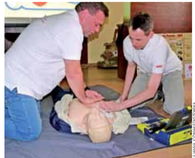
Instruktorzy Centrum Bezpieczeństwa Ruchu Drogowego w Łodzi prezentują schemat udzielania pierwszej pomocy z użyciem defibrylatora.