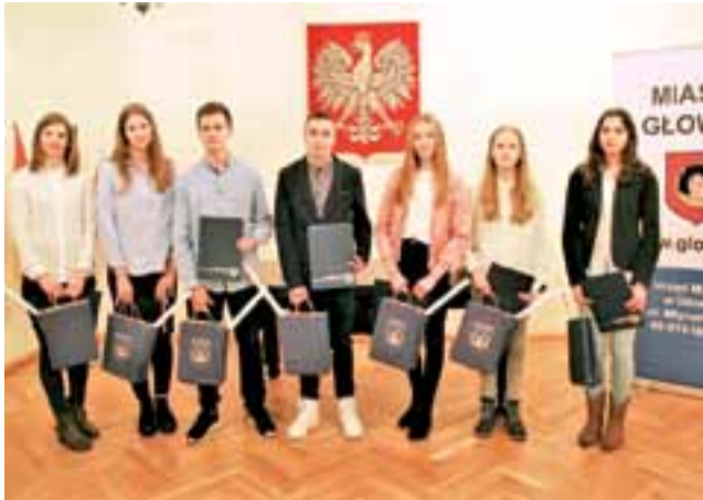
Nagrodzona ósemka sportowców Głowna otrzymała stypendia.