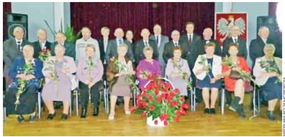
Na zakończenie uroczystości wszystkie pary wraz z przedstawicielami gminy stanęły do wspólnego zdjęcia.

Do życzeń dołączyli się członkowie Zespołu Wokalnego „Wrzos”, który wykonali m.in.