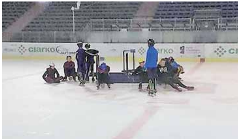
Łyżwiarze UKS Błyskawicy Domaniewice podczas treningu na obozie w Sanoku.