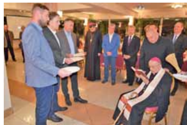
Na spotkaniu opłatkowym Fundacji Czyń Dobro nie zabrakło biskupa seniora Alojzego Orszulika.