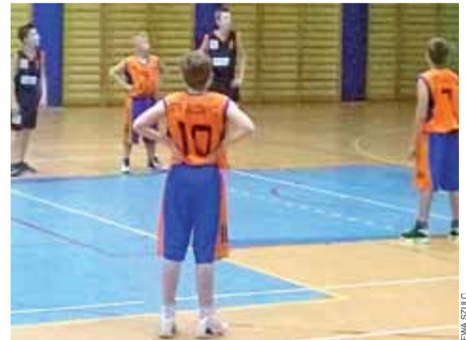
Koszykarze Głowieńskiego Towarzystwa Koszykówki do lat 14 nadal są blisko podium Ligi Wojewódzkiej, ale będzie im ciężko dogonić poprzedzające zespoły.