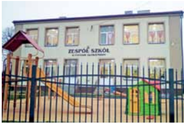
Zespół Szkół w Popowie Głowieńskim. Widok o poranku 14 grudnia.

12 grudnia pod listem widniało 50 podpisów (w zespole szkół uczy się ogółem 145 dzieci), w większości złożonych podczas spotkania zwołanego przez przewodniczącą Rady Rodziców 8 grudnia w sali OSP.