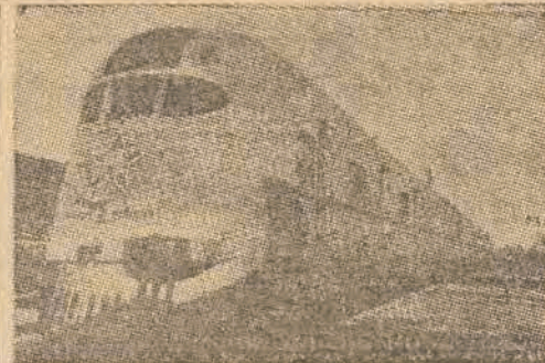
Jeana z wybudowanych ostatnio lokomotyw. Na przodzie napis - „Zwyciężyliśmy w walce, zwyciężymy w pracy”.

Budynki wyższe już wspomnianej erywańskiej elektrycznej stacji wodnej jest stała zamknięta i tylko raz na tydzień odwiedza go monter, aby sprawdzić instalację. Praca automaty-