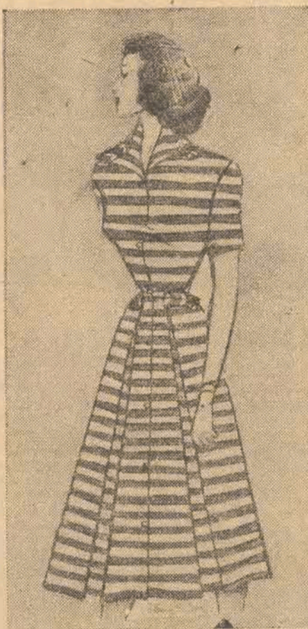
Na załączonych dzisiaj rysunkach przedstawiamy naszym Czytelnikom modele sukienek i bluzek.