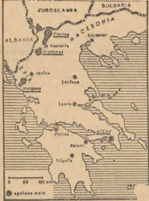
Tereny walk w Grecji.

Memorandum podkreśla z siłą: „Powtarzamy jeszcze raz, że nie należy mieć żadnych złudzeń co do możliwości zdławienia naszego ruchu środkami przymusu. Przeciw wszelkiej próbie zniszczenia nas, walczycy będziemy do upadłego i w końcu zwyciężymy. Dobrze będzie, jeśli delegaci na sesję Zgromadzenia ONZ zdadzą sobie sprawę z naszej niezłomnej woli walki aż do ostatecznego zwycięstwa...”