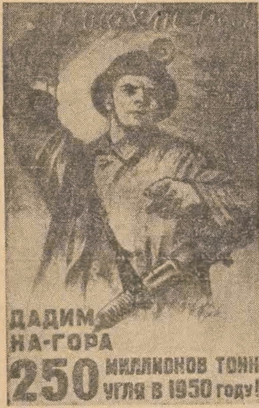
ДАДИМ НА-ГОРА 250 МИЛЛИОНОВ ТОНН УГЛЯ В 1950 ГОДУ!

W przygotowaniu jest zorganizowanie internatu, aby w kursie mogli brać udział junacy z województwa. (m)