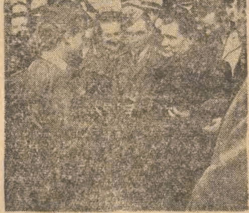
Delegatka hufca „S.P.” wręcza kierownikowi ekspedycji sportowców radzieckich wiązankę kwiatów.

Po udaniu się gości radzieckich do przeznaczonych dla nich pokoi pozostajemy w hali z