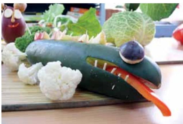
Smok wykonany przez grupę Motylki.