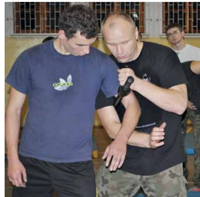
Uczniowie klasy obronnej w czasie zajęć z instruktorem sztuk walki.

– Dzięki tym dniom biwakowym dowiedziałem się, co to jest prawdziwe zmęczenie fizyczne i psychiczne.