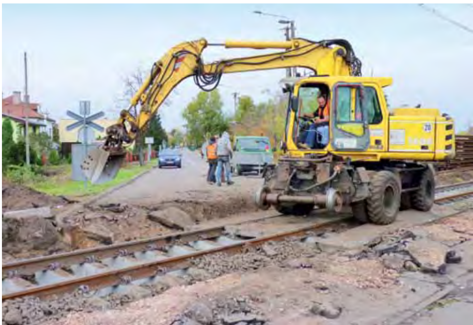
W środę na przejeździe pracowała koparka. Dziś ruszą kolejne roboty.

Łowicz | Trwa remont przejazdu na Klickiego