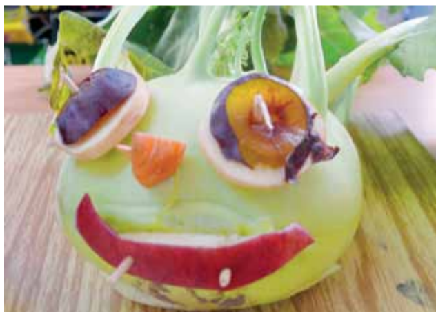
Potworek z kalarepy wykonany przez grupę Motylki.