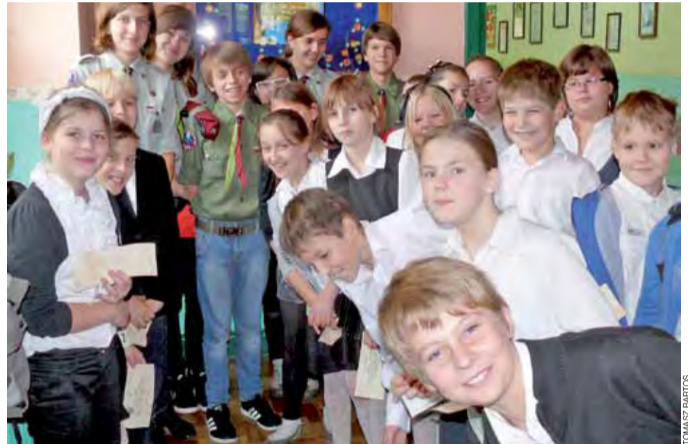
Uczniowie klas czwartych ze Szkoły Podstawowej nr 1 spotkali się z harcerzami z łowickiego Hufca ZHP.