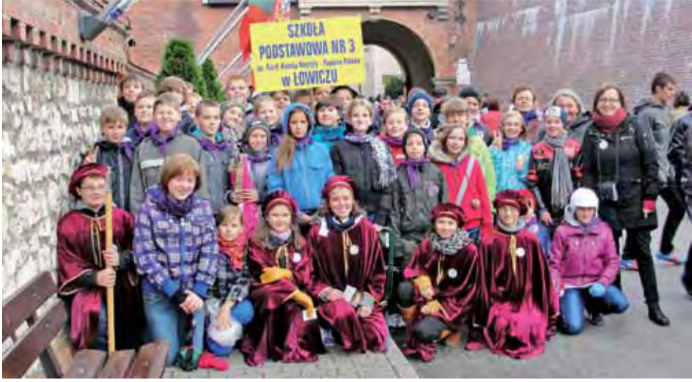
Delegacja Szkoły Podstawowej nr 3 na Jasnej Górze.