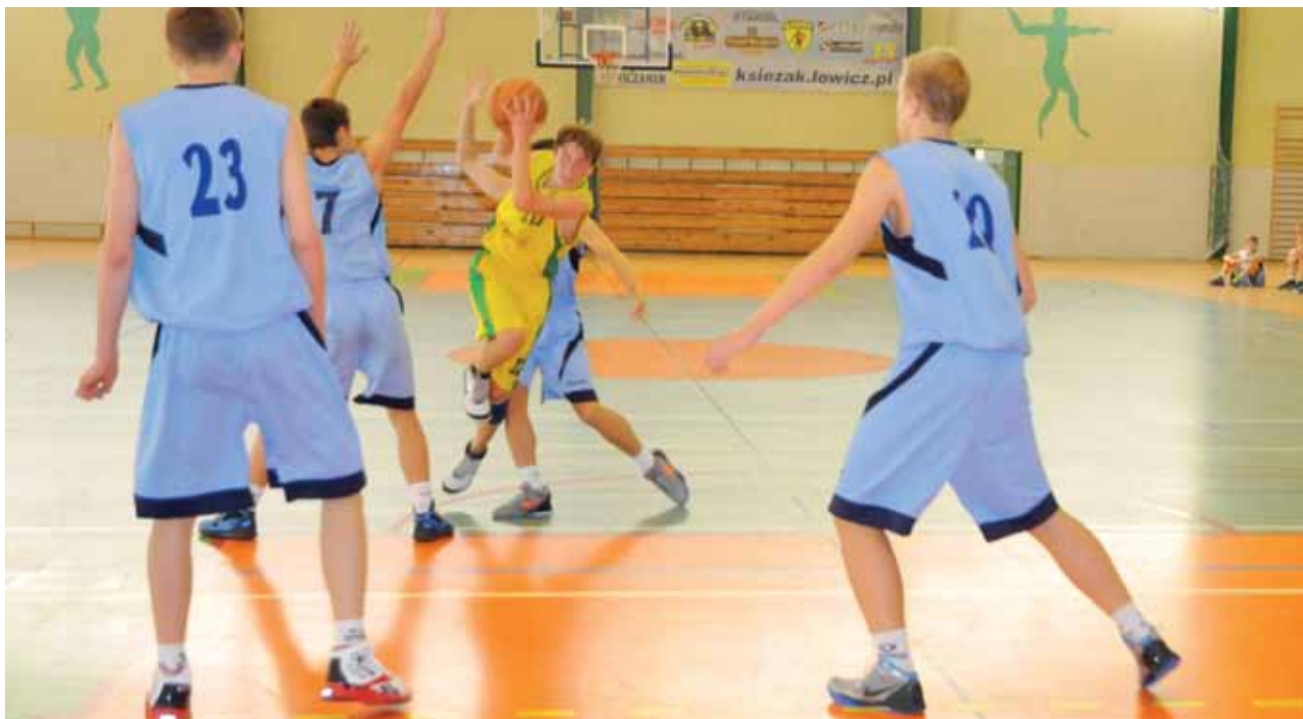
Młodzi koszykarze Księżaka nie poradzili sobie z obroną strefową wysokich rywali z Żychlina.

Koszykówka | 3. kolejka wojewódzkiej ligi kadetów U-16