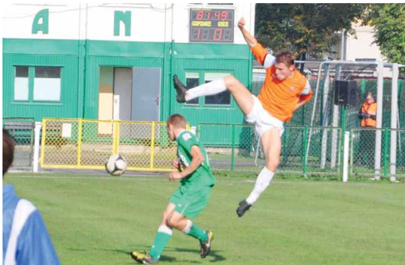
Czy to jeszcze piłka nożna, czy może jakieś sporty walki?

Piłka nożna | Echa meczu Pelikan – Concordia