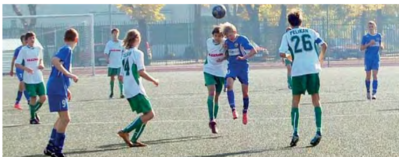
Mecz Pelikana-98 i Lechii był wyrównany, ale to goście wygrali 2:0.

Piłka nożna | 8. kolejka wojewódzkiej ligi Michałowicza