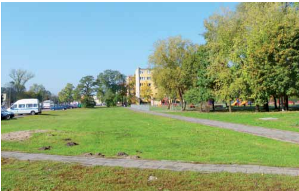
Zarząd os. Starzyńskiego chciałby zagospodarować pas zieleni na teren rekreacyjno-sportowy.