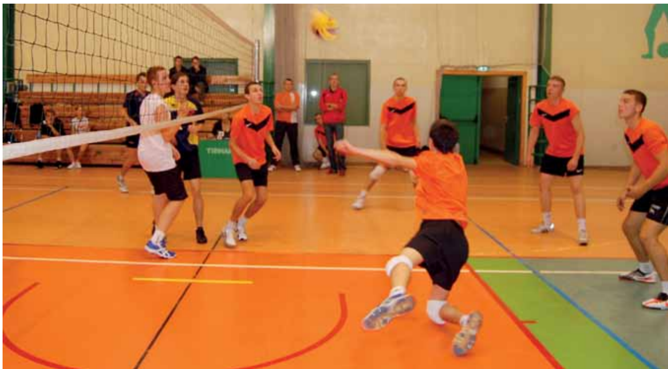
Siatkarze z Belchowa na razie bez zwycięstwa, ale na pewno ambicji graczom tej ekipy na pewno nie brakowało...

Piłka siatkowa | 2. kolejka SAM, czyli Siatkarskich Amatorskich Mistrzostw Łowicza