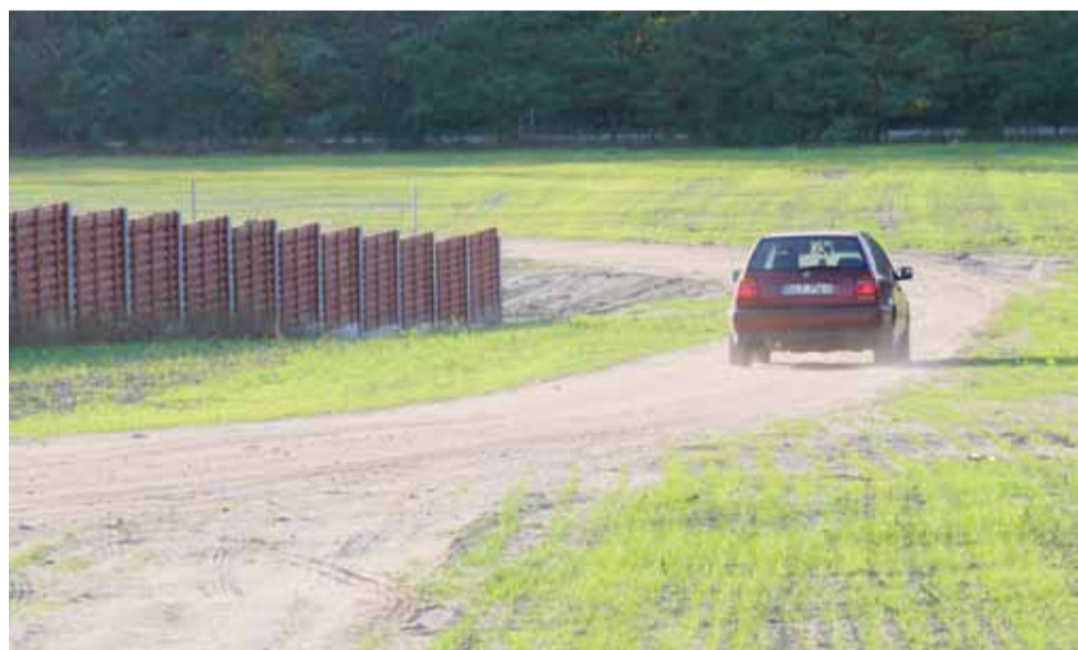
Zamiast przejścia dla zwierząt pod Michałowkiem jest droga, którą wiele osób sobie skracają jadąc z Nieborowa do Skierniewic czy Michałówka.

Na ulicach Kwiatowej i Armii Krajowej w Bednarach ułożono nakładkę asfaltową na długości 508 m oraz wykonano pobocza z kruszywa. Prace objęły także wykonanie pod drogą przepustu o długości 8 m i średnicy 40 cm. Prace były dofinansowane przez gminę Nieborów kwotą 50 tys. zł. tb