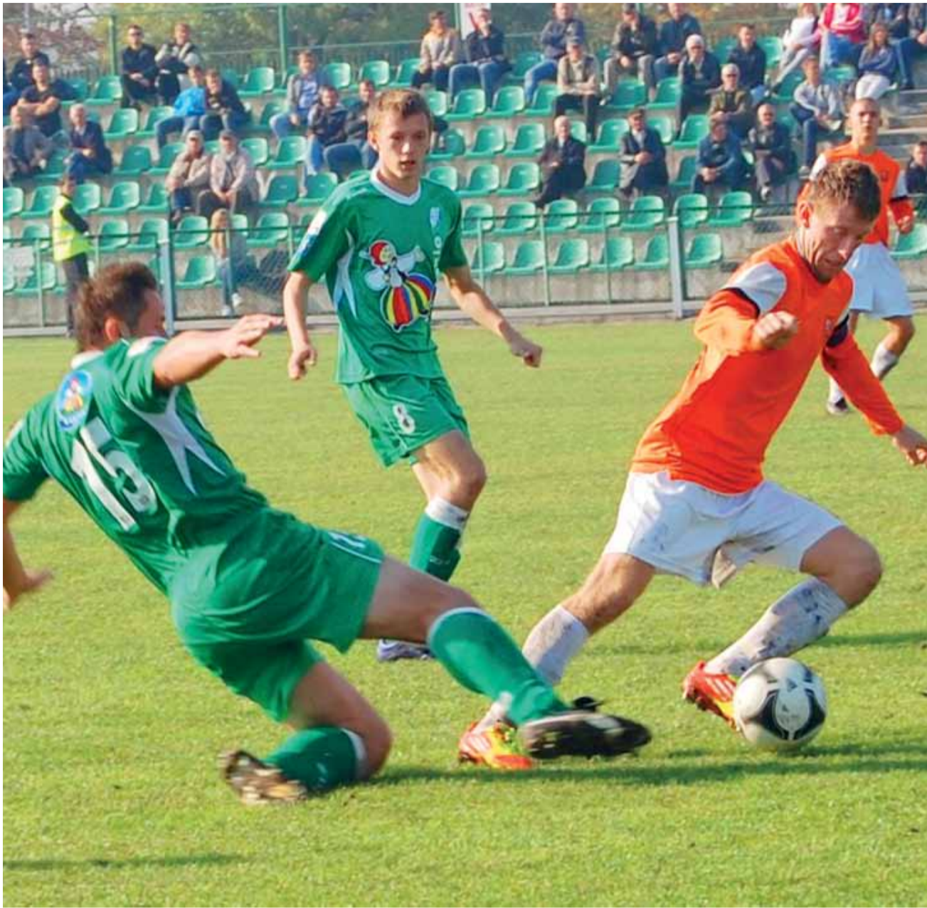
Łowiczanie nie zagrali zbyt efektywnie, ale ostatecznie zainkasowali trzy punkty.