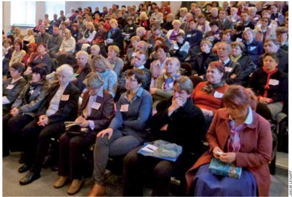
Sala Wyższego Seminarium Duchownego w trakcie drugiego dnia kongresu.

O charyzmatyku świadczy też sposób przeżywania przez niego jego własnej grzeszności. Jak mówił prowadzący konferencję, dążenie za wszelką cenę do Bożej akceptacji prowadzi do szkodliwego perfekcjonizmu. Człowiek powinien po prostu zdawać sobie sprawę ze swojej grzeszności, z tego, że jest kruchy jak gliniane na-