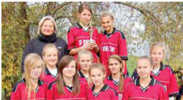
Biegaczki z GP Nowe Zduny nie miały sobie równych...

■ Chłopcy – 10x1000 m: 1. ZS CEZIU Rawa Mazowiecka 32:00,98 min, 2. I LO Łowicz 32:31,76 min, 3. ZS nr 1 Kutno 32:43,81 min, 4. ZSP 4 Łowicz 33:21,06 min, 5. LO Skierniewice 33:24,66 min, 6. ZSP Bolimów 34:05,50 min, 7. ZSP Rawa Mazowiecka 34:24,60 min, 8. I LOPUL Kutno 35:07,70 min, 9. ZSZ 3 Skierniewice 38:10,61 min.