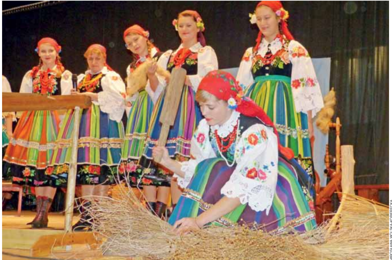
Mazovia podczas występu miała na scenie prawdziwy len i narzędzia do jego obróbki.