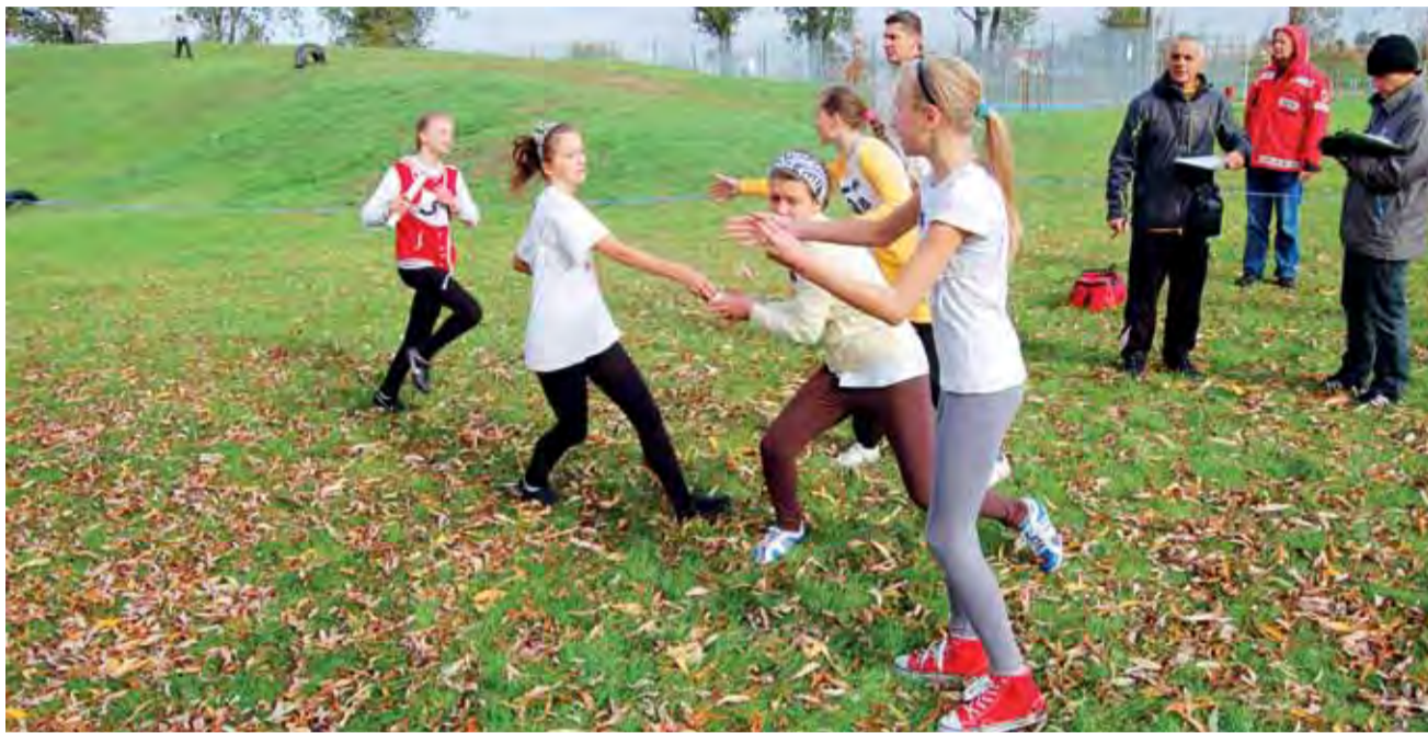
Blisko 450. zawodniczek i zawodników rywalizowało na Błoniach w sztafetach przełajowych.

Sport szkolny | Mistrzostwa Ziemi Łowickiej w sztafetowych biegach przełajowych