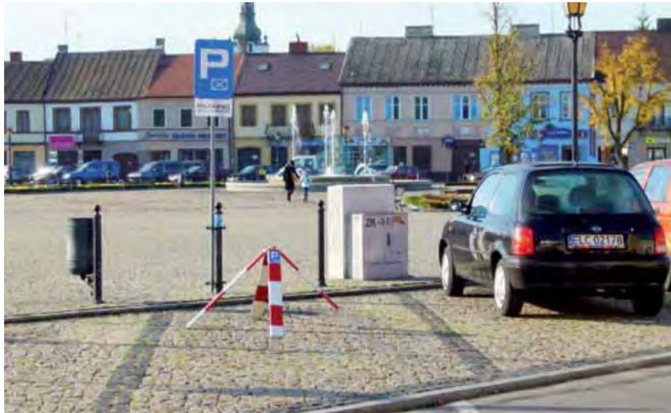
Zarezerwowane miejsce parkingowe na Nowym Rynku w Łowiczu.

wany kierowca. Jak dowiedzieliśmy się w Urzędzie Miejskim, możliwość rezerwowania miejsca parkingowego jest już od 2005 r., kiedy to Rada Miejska przegłosowała uchwałę w sprawie ustalenia stawek opłat za zajęcie pasa drogowego dróg gminnych. W treści uchwały pojawił się punkt, który pozwala na zajęcie pasa drogowego na zasadach wyłączności, na cele inne niż prowadzenie robót w pasie drogowym – na przykład miejsce parkingowe. Warunek jest jeden – zajęcie pasa nie może zagrażać bezpieczeństwu ruchu i nie może stwarzać trudności dla pozostałych uczestników ruchu. Uchwała sprzed 7 lat przewidywała, że zajęcie pasa drogowego na wyłączność wiąże się z uiszczeniem na rzecz miasta opłaty w wysokości 80 gr za 1 m 2 powierzchni w czasie 1 doby. Jedno miejsce parkingowe zajmuje mniej więcej 12 m 2 , dlatego byłoby to koszt około 10 zł za dobę. W przypadku rezerwacji na 20 dni roboczych danego miesiąca zainteresowany kierowca musiałby wydać 200 zł. Co ciekawe, miejsca nie trzeba rezerwować na cały miesiąc, mimo że rozliczenie odbywa się właśnie