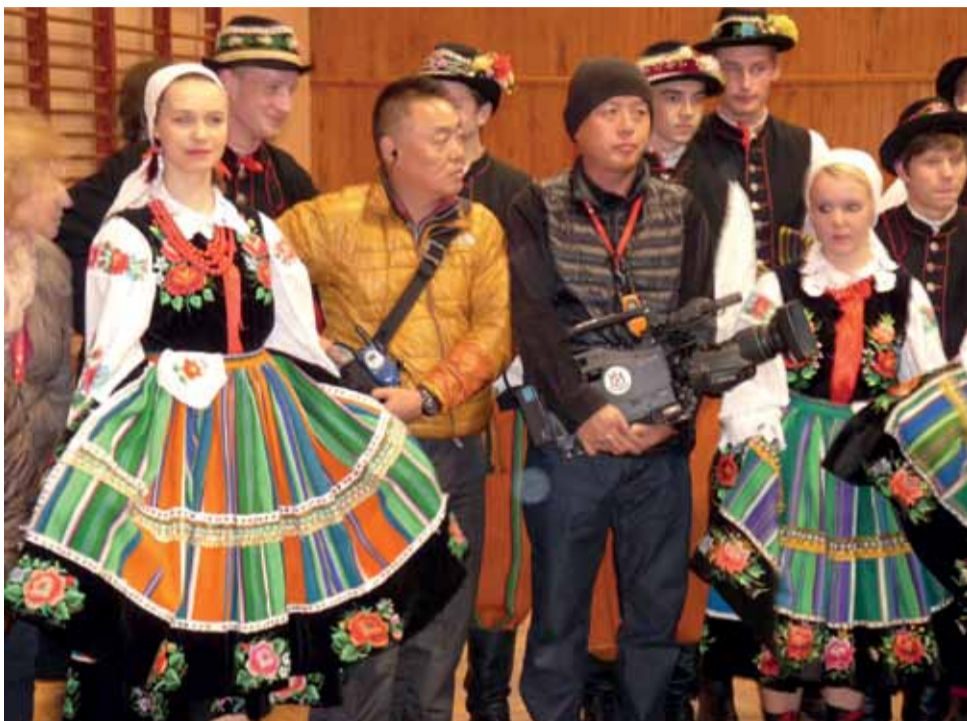
Filmowcy z Japonii w towarzystwie członków zespołu Blichowiaczy.

– Docieramy do miejsc, które można zwiedzić koleją, ale ze względów logistycznych podróżujemy busem – powiedziała nam przedstawicielka BS Fuji. Program „Podróże pociągiem po Europie”, w którym pokazywane są miejsca w Europie mogące zaciekać Japończyków, emitowany jest raz w tygodniu, począwszy od 2002 r. Film z Polski jest przygotowywany w porozumieniu z Polską Organizacją Turystyczną. Zmontowany odcinek telewizyjny z Japonii obejrzą prawdopodobnie już w grudniu. Nagranie trafi także do Polski i do ZSP nr 2. – Zobowiązaliśmy się, że goto-