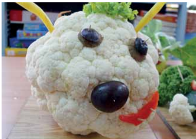
Owieczka wykonana przez dzieci z grupy Motylki z bajki Szewczyk Dratewka.