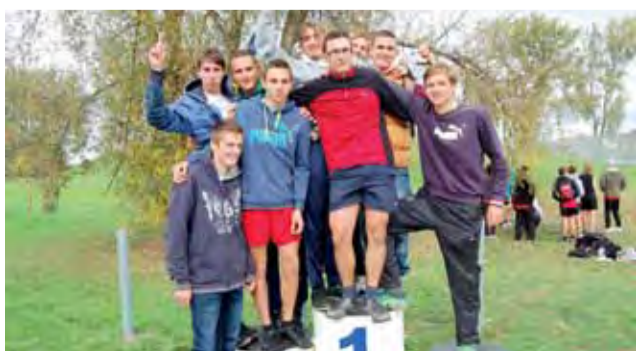
Uczniowie I LO Łowicz wywalczyli w Rawie Maz. drugie miejsce.