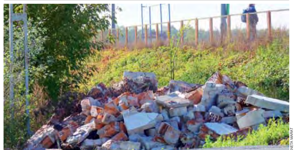
W najbliższych dniach sprzed przystanku PKP w Jasionnej ma zostać wywieziony gruz, który był tam składowany po rozbiórce kolejowych toalet, od kilku lat w ogóle nieużywanych. Składowany jest on po prawej stronie drogi prowadzącej do Sierzchowa, tuż przed przejazdem. Pustostan pełnił ostatnio jedynie funkcję dzikiego składowiska śmieci. Rozebanie toalet ma uporządkować teren. am