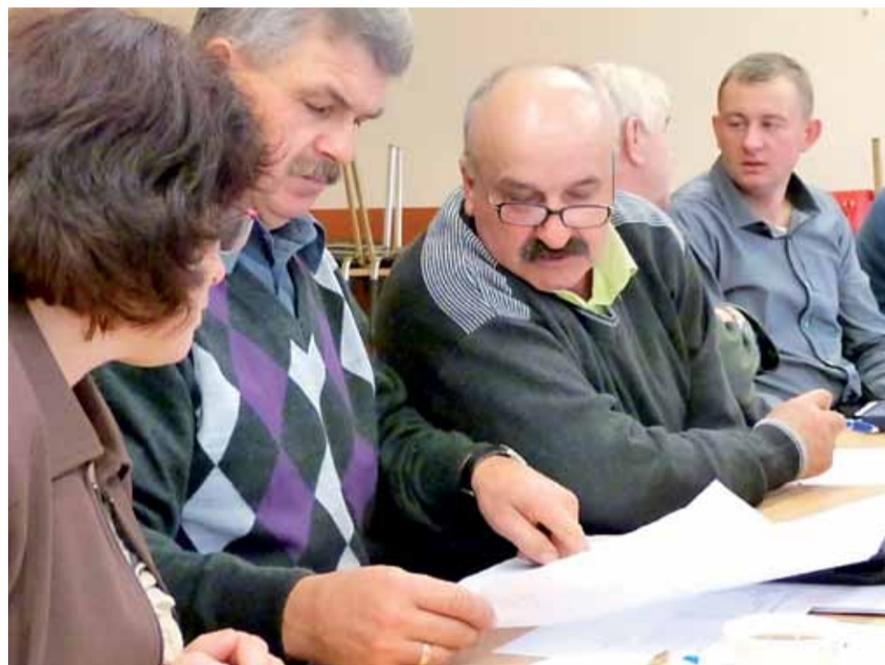
Przed dyskusją i podjęciem decyzji radni jeszcze raz przyglądali się mapie, na której zaznaczono lokalizację planowanych wiatraków.