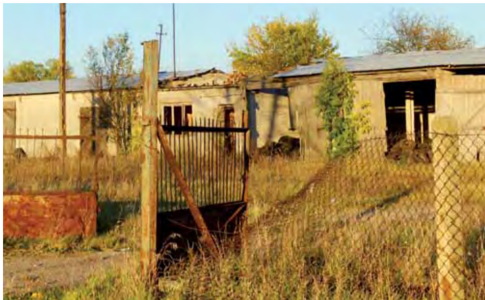
Dawna siedziba SKR w Strugienicach. W tym miejscu ma powstać nowoczesna oczyszczalnia ścieków.

Oczyszczalnia ścieków powstanie w miejscu dawnej siedziby kółek rolniczych, w pobliżu drogi ze Strugienic do Bochenia. Najpierw wykonawca uporządkuje ten teren, w tym dokona rozbiórki starych, zniszczonych budynków gospodarczych. Po zakończeniu I etapu inwestycji przepustowość oczyszczalni ma wynieść 350 m 3 na dobę, natomiast w przyszłości, po wybudowaniu drugiego reaktora, osiągnie 700 m 3 . Rozbudowa oczyszczalni nie jest jednak na razie planowana. Po zakończeniu budowy ścieki do nowego obiektu będą wyłącznie dowożone. Zwiększenie przepustowości nastąpi w przyszłości – wraz z wybudowaniem sieci kanalizacyjnej w Strugienicach, Maurzycach, Szymanowicach, Zdunach i Zduńskiej Dąbrowie.