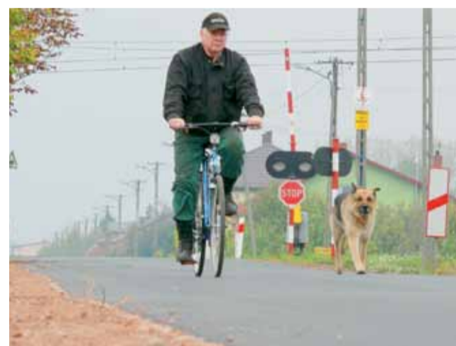
Droga pomiędzy Bednarami a Karolewem w stronę Jasionnej jest już dużo szersza i bezpieczniejsza dla kierowców.

Żeby jednak móc pracować w takiej aparaturze, konieczne jest wcześniejsze ukończenie odpowiednich szkoleń. Strażacy, którzy ich będą używali podczas akcji, odbyli takowe w jednostce w Piotrkowie Trybunalskim. Do tej pory strażacy z Łyszkowic posiadali 5 używanych aparatów powietrznych, które zostały odkupione od jednostki straży z Brzezina. Posiadanie takiego sprzętu jest jednym z wymogów, które jednostka musi spełniać, żeby należeć do Krajowego Systemu Ratowniczo-Gaśniczego. mak