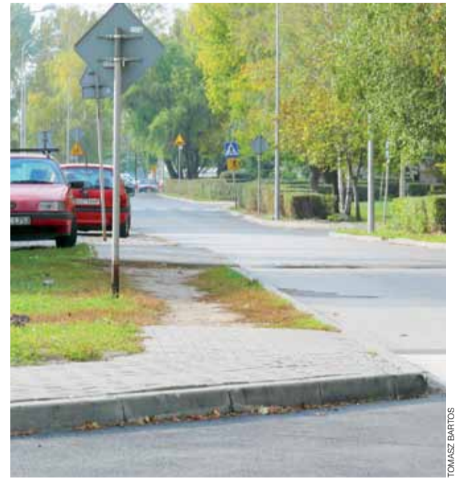
Brakujący fragment chodnika wzdłuż ul. Młodzieżowej sprawia, że uczniowie pobliskiej szkoły w deszczowe dni muszą iść asfaltem.