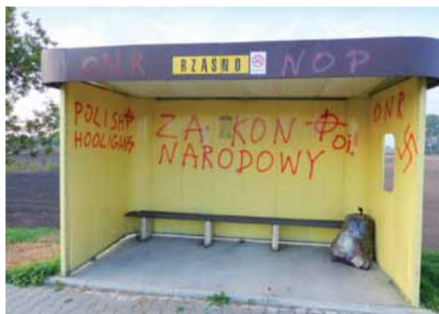
Nieznani wandalie pomalowali przystanek autobusowy w Rzaśnie w gminie Zduny. Pojawiły się tam m.in. znaki propagujące faszizm, co w naszym kraju jest zakazane. Ktoś namalował swastykę, a także krzyże celtyckie oraz skróty nazw polskich ugrupowań nacjonalistycznych. td