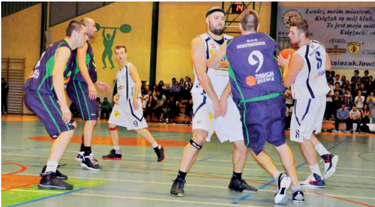
Emocji znowu nie brakowało , ale ostatecznie Księżak odniósł ważne zwycięstwo w koszykarskich derbach w II lidze męskiej.