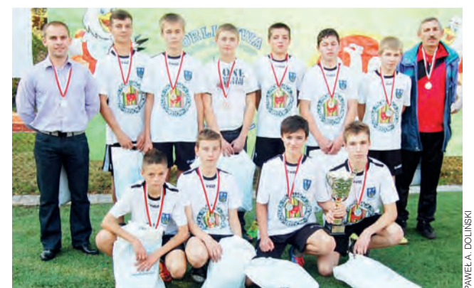
Ekipa z Błędowa wywalczyła drugie miejsce w finałach OLM.