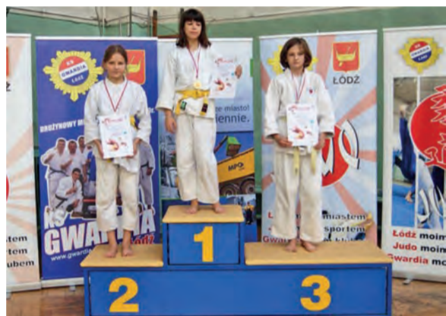
W pierwszych zawodach Ligi Judo Dzieci Zryw zdobył sześć medali.