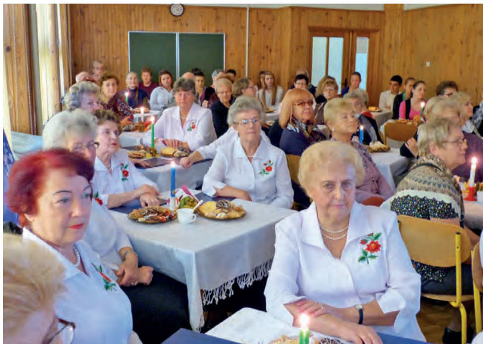
Seniorzy w świetlicy gimnazjum z uwagą słuchali występu młodzieży.