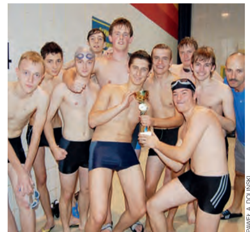
Bardzo zadowoleni z siebie byli uczniowie Pijarskiego LOKP.

Sport szkolny | PGS w sztafetach pływackich 10x25 m