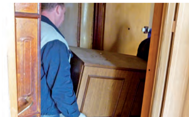
Eksmisja na ul. 11 Listopada. Samotny lokator był już spakowany.

Mieszkaniec nie stawiał oporu i współpracował z komornikiem i przedstawicielami ŁSM. Pogodził się z faktem, że będzie musiał opuścić lokal. Był już spakowany. Dłużnik będzie teraz przebywał w tzw. mieszkaniu chronionym, czyli w noclegowni przy ul. Świętojańskiej 2. Komornik zezwolił eksmitowanemu, ażeby ten zabrał ze sobą ubrania i najcenniejsze przedmioty. Meble i pozostałe elementy wyposażenia mieszkania zostały zabezpieczone przez spółdzielnię.