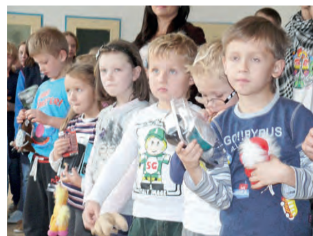
Dzieci w nagrodę za pierwsze miejsca w konkursie otrzymały aparaty fotograficzne, słuchawki a wszyscy jego uczestnicy maskotki.