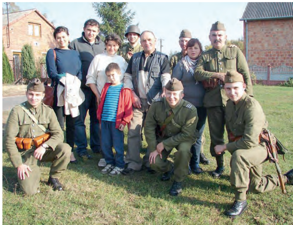
Członkowie Stowarzyszenia Historycznego im. 10 Pułku Piechoty w czasie jednego ze spotkań z mieszkańcami odwiedzanych miejscowości.

Dodał, że zapewne każdy z innych powodów przyjechał na kongres. Jedni sami chcieli, innych wytypował ksiądz proboszcz, to jednak, jego zdaniem, nie jest najważniejsze. Należy bowiem wierzyć w działanie Ducha Świętego. Skoro tu jestem, to ma to głębszy sens, którego może w tej chwili nie znam, ale który ma znaczenie dla mnie i mojego życia – przekonywał. Na kongres przybyły starsze osoby, młodzi i rodziny z dziećmi. str. 15