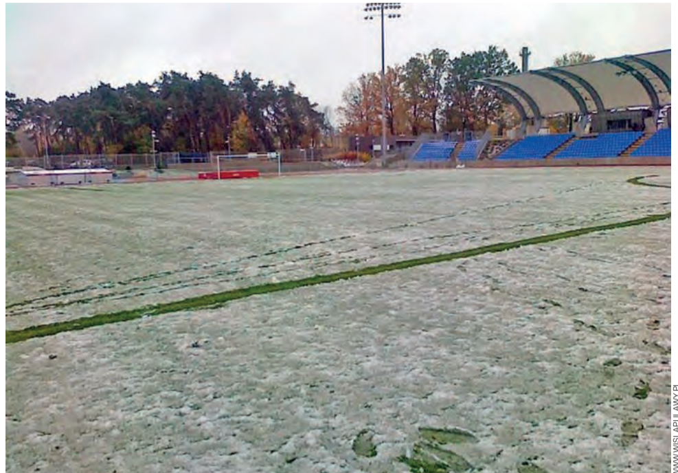
Boisko w Puławach nie nadawało się do użytku i stąd odwołany mecz Wisła - Pelikan. Dachy nie zamknęły!