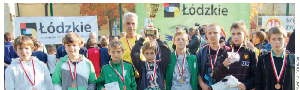
Na piersiach uczniów łowickiej Trójki zawiśły brązowe medale Orlikowej Ligi Mistrzów w rugby.

– Końcowa kolejność w obu kategoriach wiekowych pokazuje, że rugby tag może być doskonałą okazją do szukania talentów do gry nie tylko przy już istniejących drużynach – podsumowuje Jurzysta. – Pokazuje, iż z systemu rozgrywek szkolnych należy czerpać korzyści i pro-