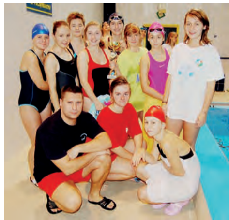
Po raz kolejny uczennice G 2 okazały się najlepsze w Łowiczu.