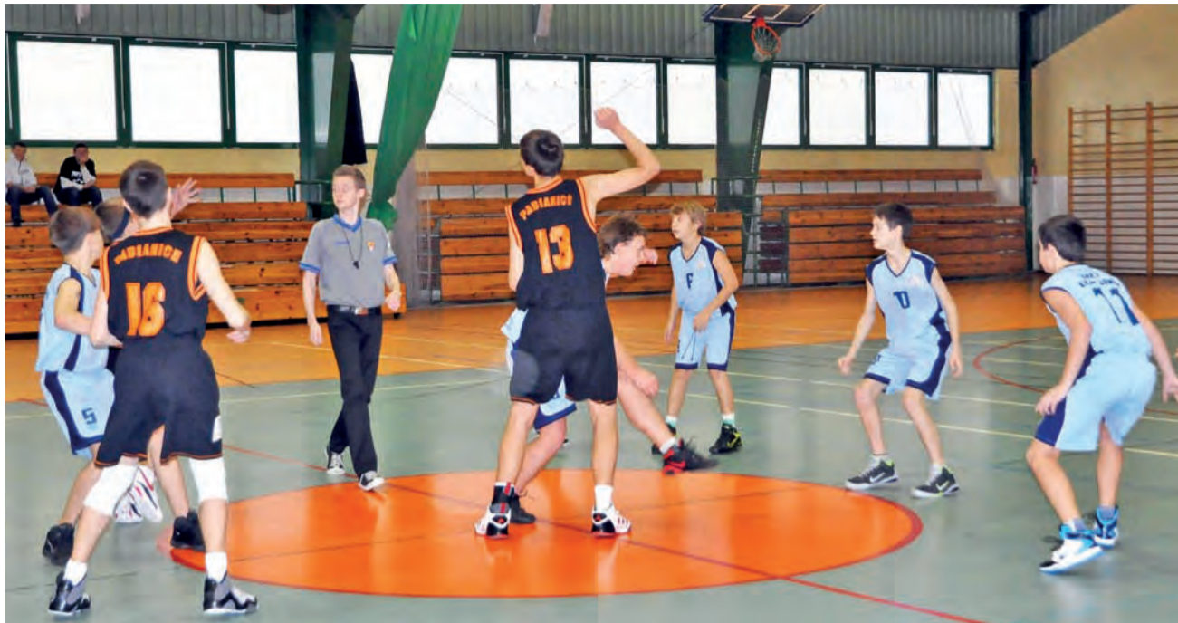
Pomimo porażki ekipa Księżaka-99 może być naprawdę zadowolona ze swojej postawy w pojedynku z faworytami z Pabianic.

Koszykówka | 4. kolejka wojewódzkiej ligi młodzików U-14