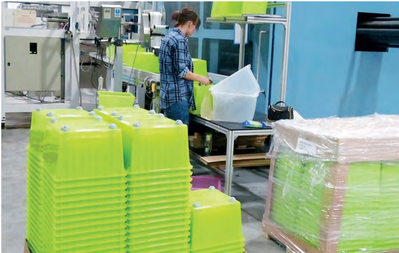
Lamela zajmuje się produkcją artykułów z łatwopalnych tworzyw sztucznych – polietylenu i polistyrenu. Widoczne na zdjęciu pojemniki trafiają do sklepów sieci Ikea.

Właściciele firmy kupili 100 kompletów tych urządzeń, płacąc za nie ponad 10 tys. zł z własnej kieszeni.