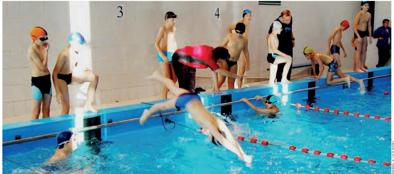
Technika startu najmłodszych pływaków była bardzo zróżnicowana.