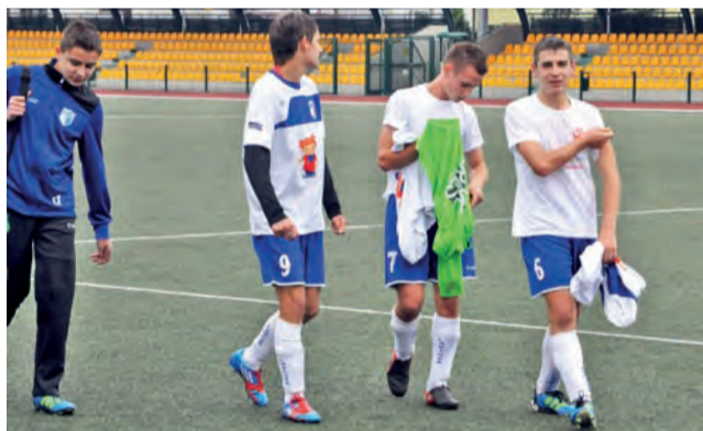
Piłkarze Laktozy-96 stracili już praktycznie szansę na awans.

Po tym голу wydawało się, że Laktoza grając z wiatrem jest w stanie przeważać losy meczu na swoją korzyść. Tym bardziej, że osiągnęła przewagę od pierw-