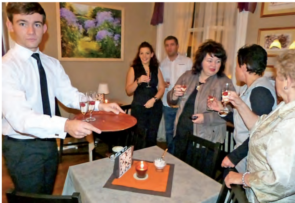
Goście nowej kawiarni wzniesli lampką szampa toast za powodzenie przedsięwzięcia.