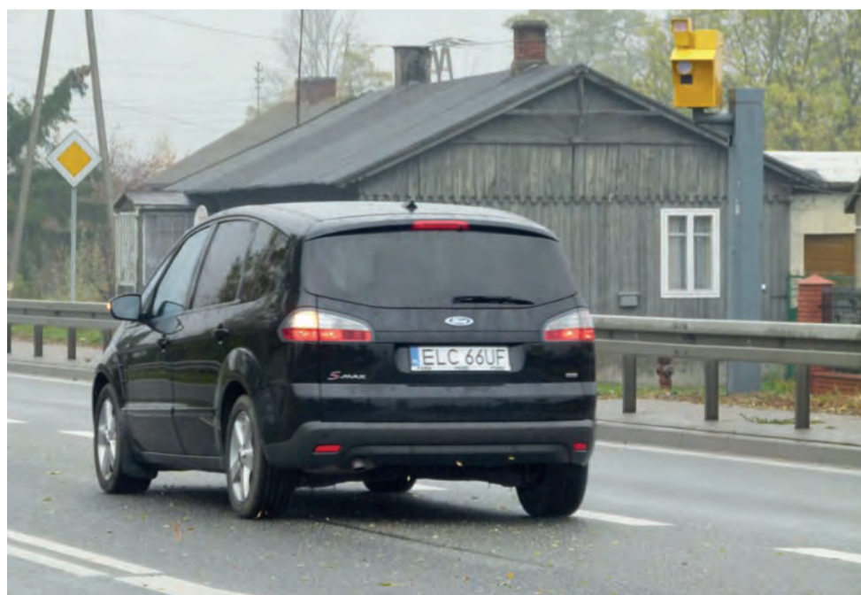
Działające fotoradary wyróżniają się żółtą obudową.