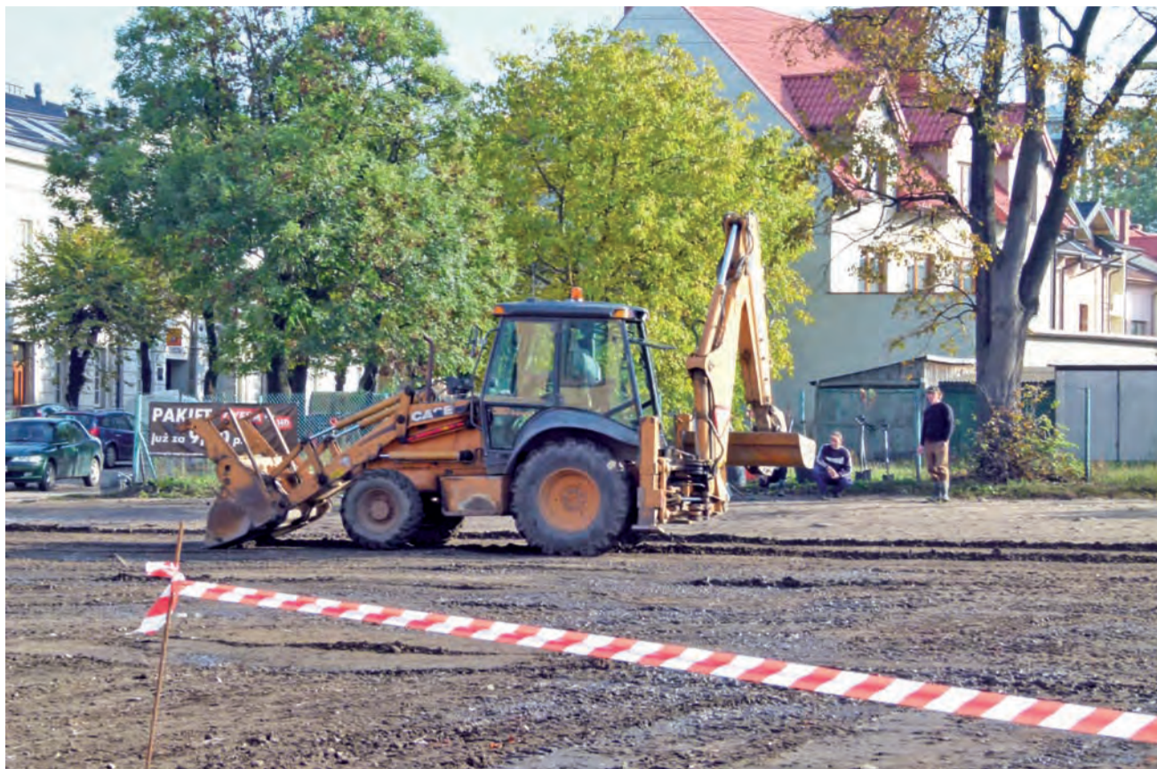
Równanie parkingu na rogu ul. Koziej i Podrzecznej.

Wykonawca wynajęty przez właściciela nieruchomości na ul. Koziej 19 października ogrodził plac i zamknął parking do 24 października. Teren równała koparko-ładowarka. W czasie prac parkowanie w tym miejscu zostało zabronione. Po ich zakończeniu plac ponownie został udostępniony kierowcom. – Znamy sytuację w Łowiczu, jest deficyt miejsc parkingowych w centrum miasta, dla-