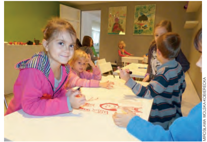
Zajęcia plastyczne podczas warsztatów polegały na malowaniu twarzy koleżanki lub kolegi, na którego nie można było patrzeć.

Łowicz | Warsztaty teatralne – strzał w dziesiątkę