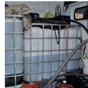
Auto, którym podróżowało 2 mężczyzn, podejrzanych o kradzież.

Funkcjonariusze policji od pewnego czasu pracowali nad sprawami włamań do stacji paliw, z których kradzione były tysiące litrów paliwa. Obserwo-