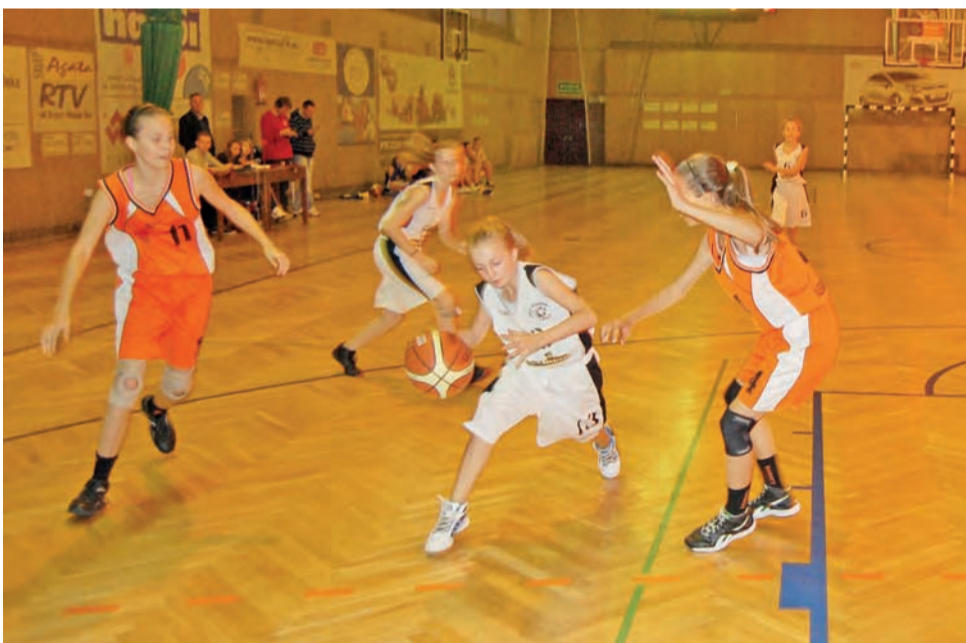
Znacznie wyższe rywalki z Aleksandrowa nie pozwoliły łowiczankom na zbyt wiele.