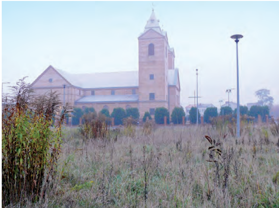
Teren przy kościele Dobrego Pasterza jest już wyposażony w latarnie oświetlenia ulicznego, aby powstał tam parking brakuje tylko kostki.

Parking przy kościele Chrystusa Dobrego Pasterza ma mieć powierzchnię 1200 m 2 ,