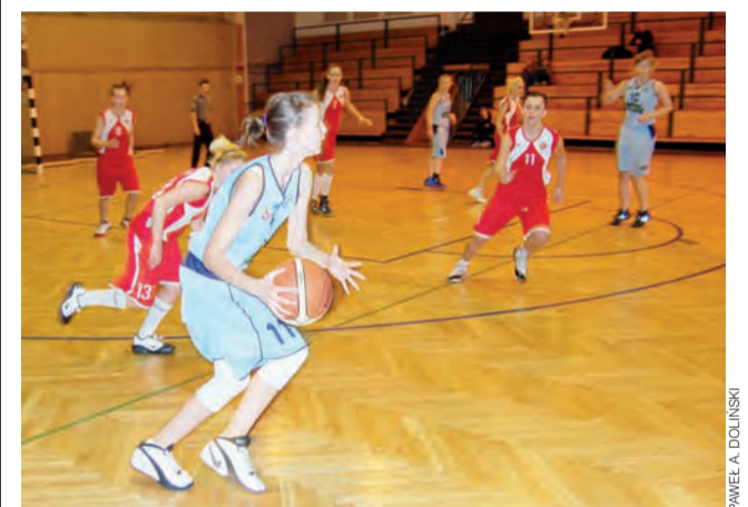
Juniorki z Łowicza tylko chwilami nawiązywały walkę z rywalkami.

■ ŁKS KK Łódź – Księżak Łowicz 136:25 (42:5, 22:10, 26:6, 46:4) Księżak: Aleksandra Wojda 13,