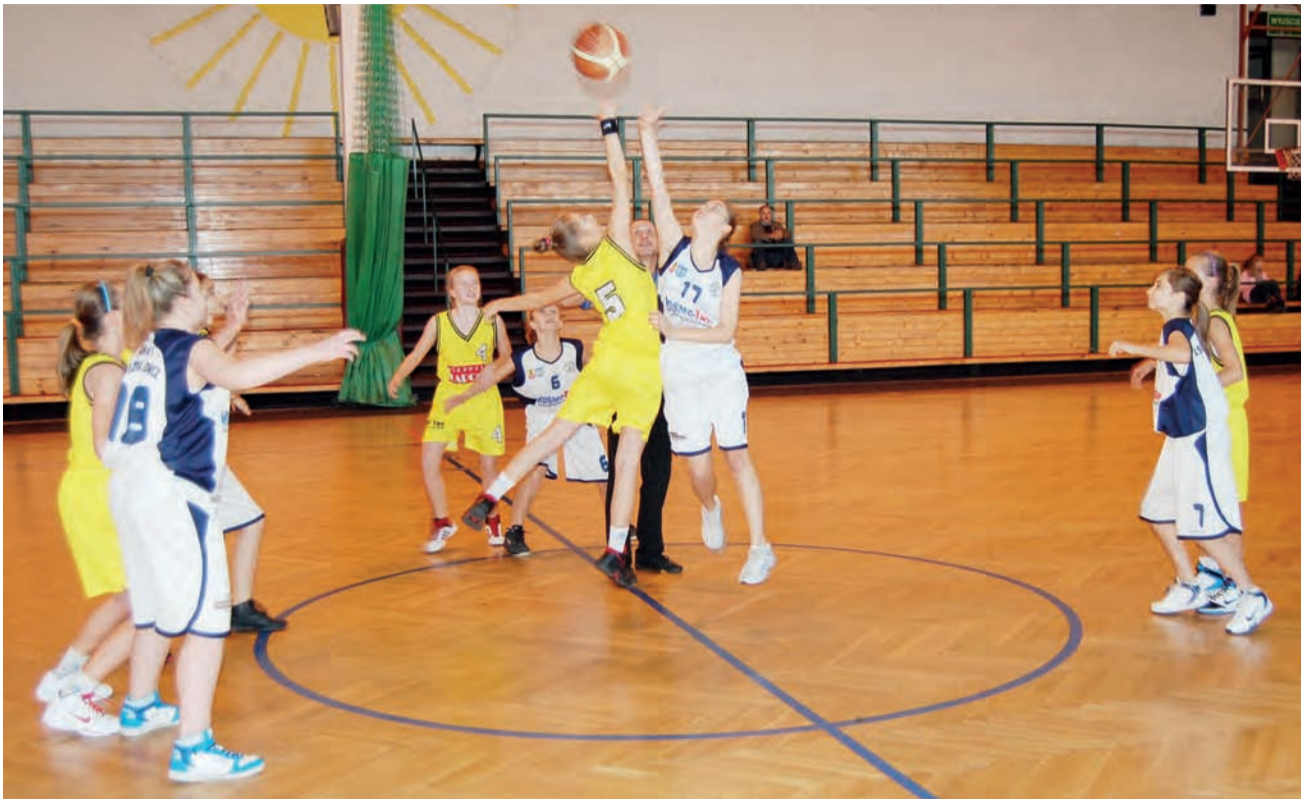
W przegranych meczu z Liderem dopiero po raz pierwszy w sezonie w ekipie Księżaka-99 zagrały już wszystkie najlepsze zawodniczki.

Koszykówka | Wojewódzka liga młodziczek U-14