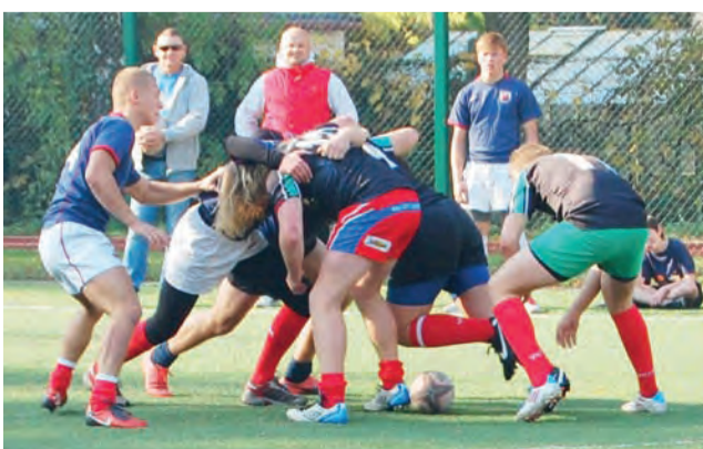
W pokazowym meczu zaprezentowany był m.in. „młyn”.