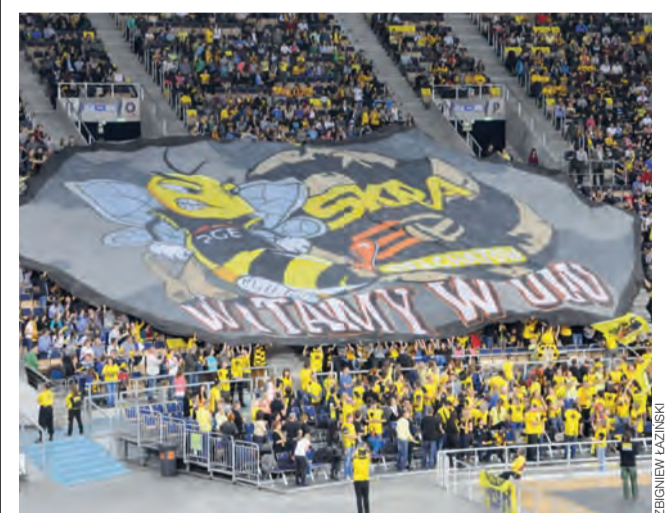
„Witamy w ulu”, czyli ciąg dalszy wspólniejszej współpracy Skry Bełchatów z samorządowcami z Łowicza, a efektem są setki młodych kibiców z naszego miasta w łódzkiej Atlas Arenie.