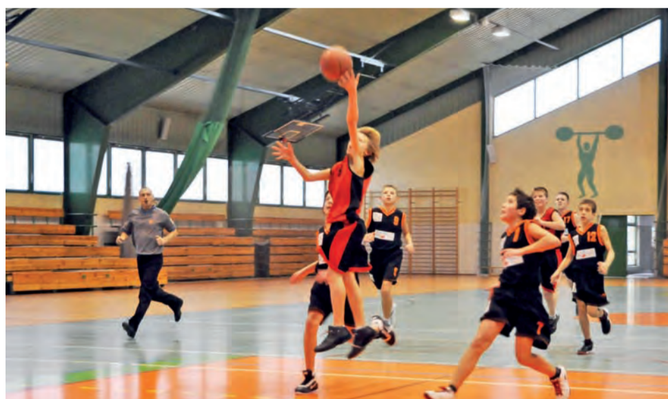
Młodzi łowiczanie potrafili nawiązać wyrównaną walkę z rywalami z Pabianic tylko do połowy trzeciej kwarty.