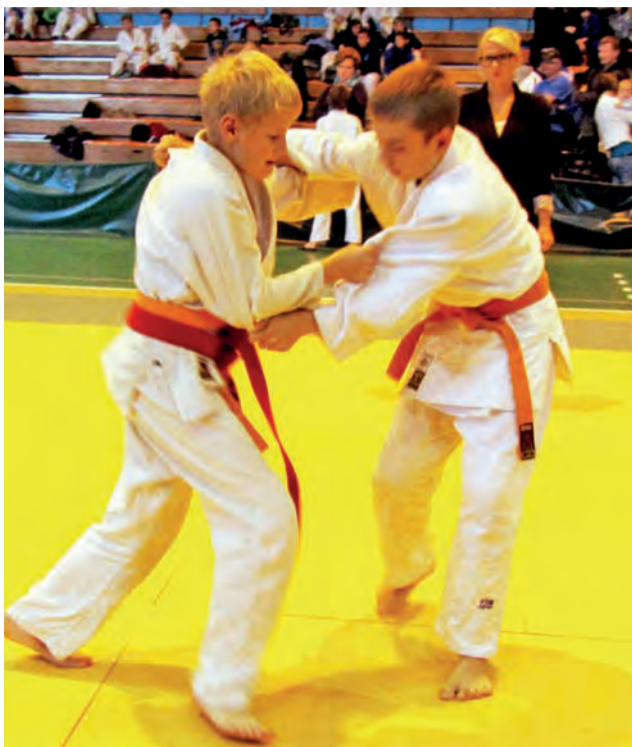
Młodzi judocy MKS Zryw wywalczyli w Grodzisku Mazowieckim aż jedenaście razy miejsca na podium.