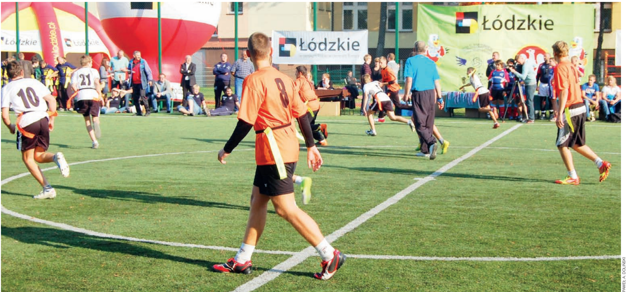
Zawodnicy Publicznego Gimnazjum w Błędowie w swoim ostatnim meczu pokonali rywali z G 10 Łódź, a potem była już tylko radość ze zdobycia srebra w Orlikowej Lidze Mistrzów w rugby tag.