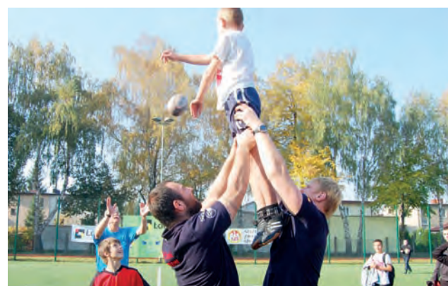
Ciekawym przeżyciem dla młodych rugbistów było „wynoszenie”.