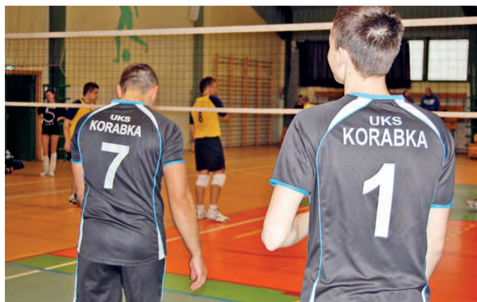
Korabka I po trzech kolejkach prowadzi i wydaje się znowu faworytem do mistrzowskiego tytułu.