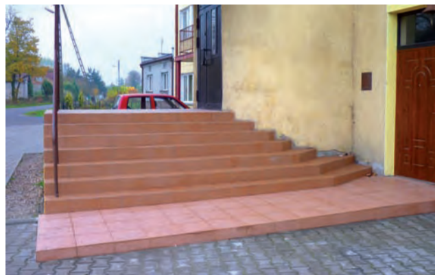
Nowe schody przed budynkiem SP w Skaratkach.

Teraz założono na schodach płytki antypoślizgowe. Prace remontowe sfinansowano z budżetu szkoły. am