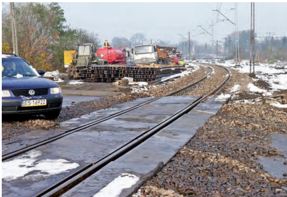
Wielu kierowców zaskoczył wczoraj wygląd przejazdu na ul. gen. Klickiego. Kamienie, które zostały na nim usypane, utrudniały przejazd.

6 wyjazdów odnotowano w sobotę, kolejne 3 w niedzielę. Przyczyną wszystkich interwencji było usuwanie konarów lub gałęzi, które utrudniały ruch bądź zagrażały bezpieczeństwu uczestników ruchu. 27 października strażacy interweniowali w Nieborowie, Otolicach, Brzozowie, Polesiu, Nowych Zduńkach i Ostrowie. W niedzielę 28 października straż pojawiła się w Bobrowej, Łowiczu (Łasek Miejski, ul. Bernardyńska) i Belchowie. pw