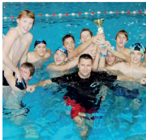
Chłopcy z G 2 wygrali, a potem wspólne świętowanie w wodzie.