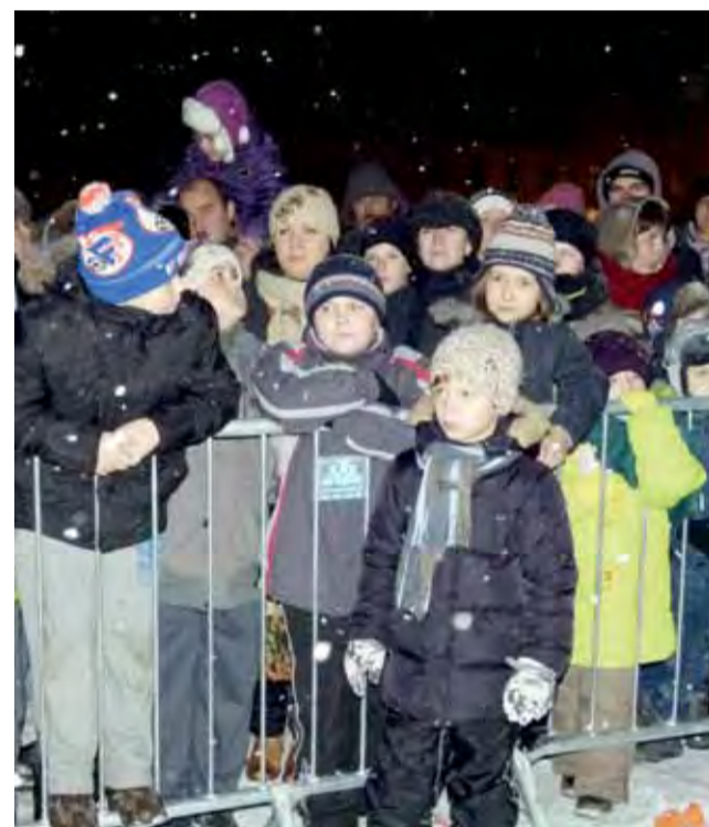
Na widowni najwięcej było dzieci, którym w większości nie przeszkadzał padający śnieg oraz mroźny wiatr szczypiący w policzki.

Choinka zakończyła się bardzo widowiskowym pokazem sztucznych ogni, które zakupione zostały także przez sponsorów. Rozświetliły one na kilkanaście minut niebo wieloma barwami. Publiczność dziękowała za pokaz brawami.