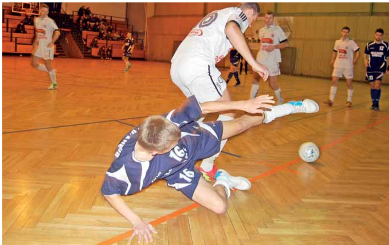
Niebezpieczna gra w łowickiej „halówce” musi być wyeliminowana, a wślizgi zostały znowu zabronione...

Kolejne mecze I ligi ŁoLiF zostaną rozegrane w weekend 15-16 grudnia: sobota – godz.