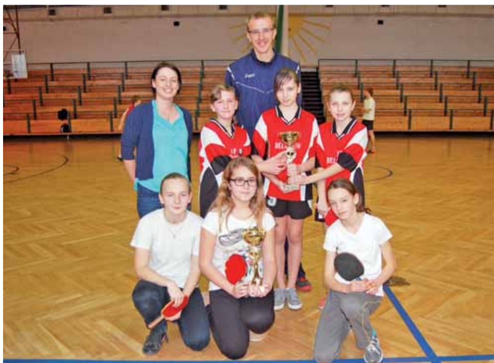
W turnieju dziewcząt najlepsze okazały się reprezentantki SP Belchów (stoją) i SP Sobota.