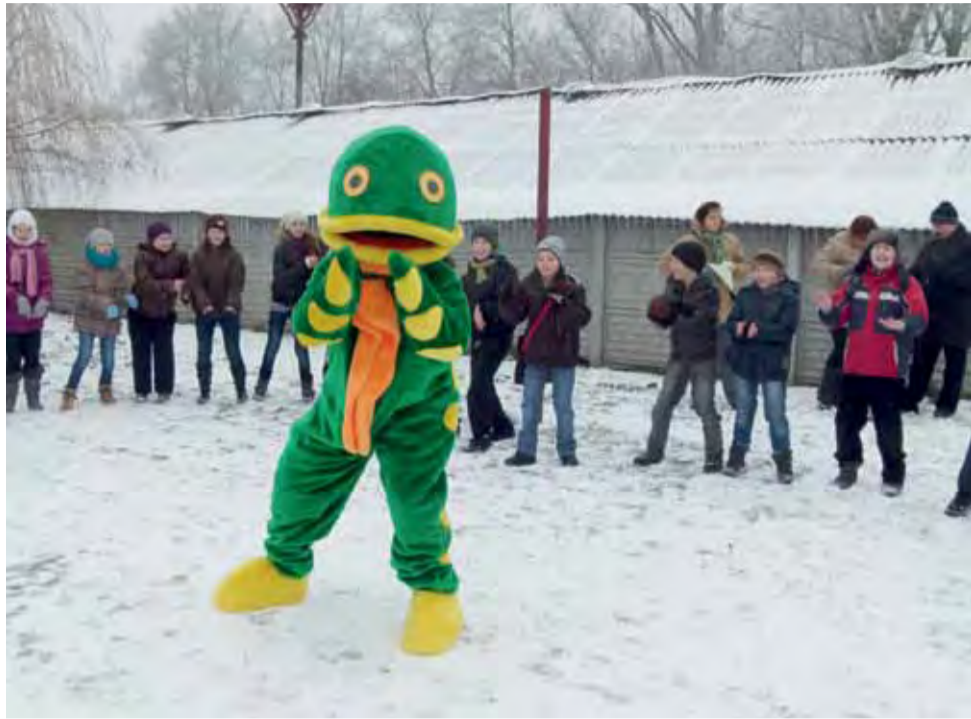
Dzieci bawią się z Panem Kapiem w kółku. Przy dźwiękach muzyki naśladują ruchy, jakie wykonuje animator.

Warto dodać, że wszystkie atrakcje podczas imprezy były bezpłatne, bo Spotkanie z karpem finansowane było z Europejskiego Funduszu Rybackiego. Do przygotowania imprezy zaangażowano agencję