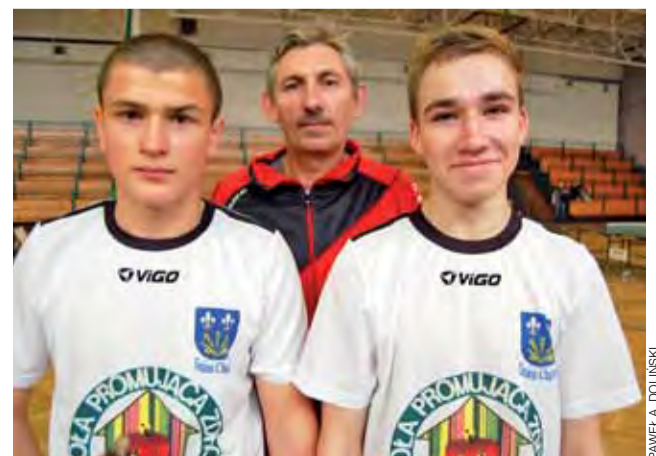
Chłopcy z PG Błędów zajęli 2. miejsce i awansowali do finału WGS.