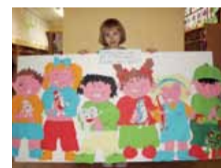
Ania Rudak z Przedszkola nr 3 trzyma w rękach pracę wykonaną przez czterolatki uczęszczające na koło plastyczne.

W konkursie dla przedszkolaki pt. Każdy z nas wie, jak z Państwami o ząbki dbać swe bierze