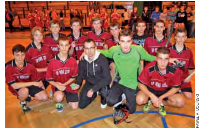
Drużyna z GP Nowe Zduna zajęła w Uniejowie czwarte miejsce.