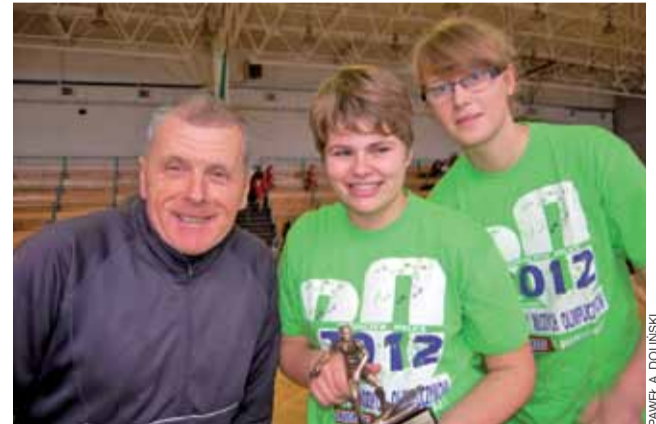
Drużyna z Domaniewicz wywalczyła w Białej Rawskiej trzecie miejsce.