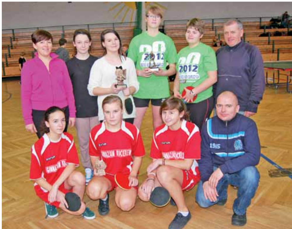
W turnieju dziewcząt najlepsze okazały się pingpongistki z Domaniewicz, Łyszkowic i Kocierzewa.