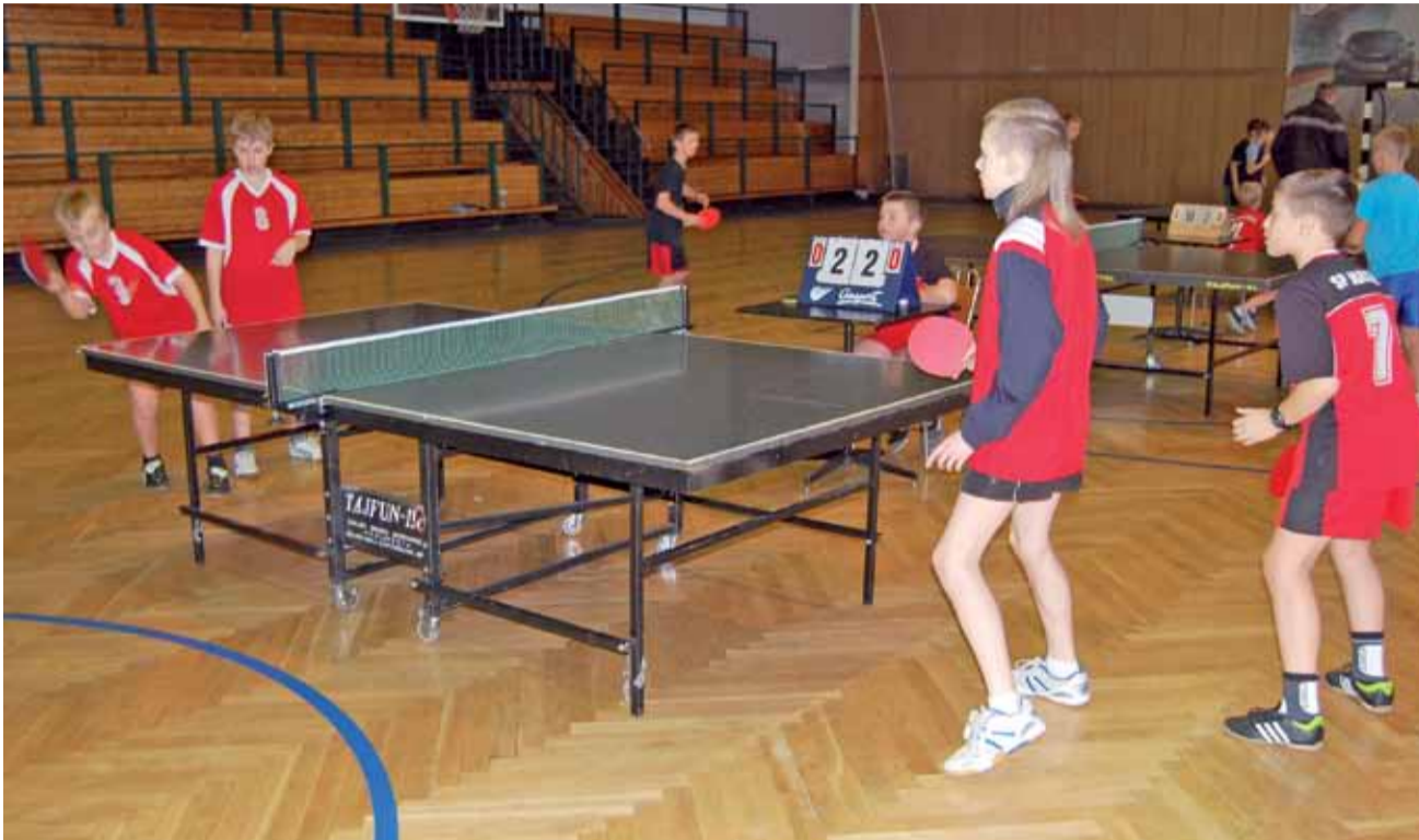
W finale turnieju chłopców pingpongiści z Mastek (z prawej) wygrali z reprezentantami SP Bobrowniki.

Sensacyjna porażka lidera SAM w derbach, po której będzie ciekawie. str. 41