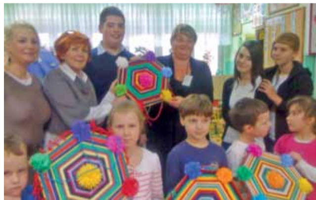
Delegacja z Gimnazjum nr 1 z wizytą w Przedszkolu Wiosenka, podczas przekazania pająków.

Termin kolejnego spotkania nie został jeszcze ustalony. Wiadomo jednak, że przedszkolaki pokażą gimnazjalistom swoje przedstawienie o Ekologicznym Czerwonym Kapturku. mwk