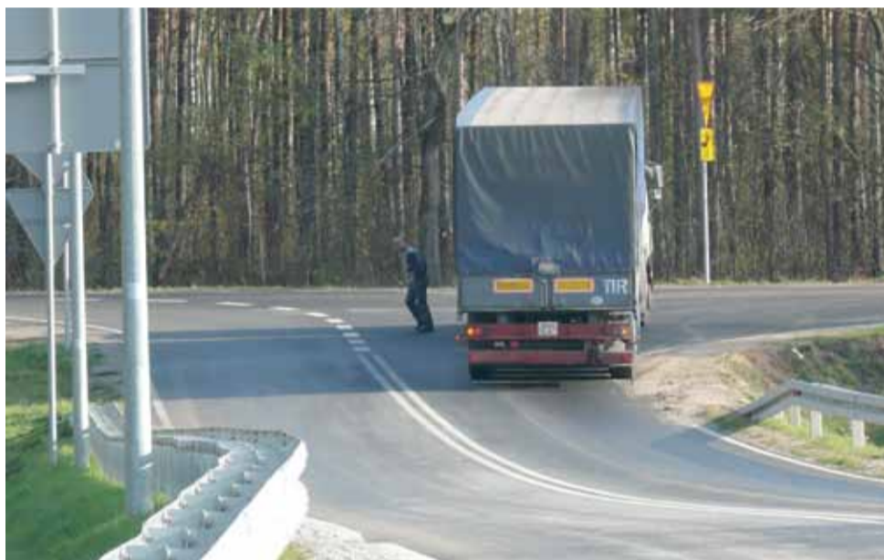
Kierujący TIR-em Białorusin zjechał na rondzie w Michałówku w kierunku lasu, szybko jednak zorientował się, że popełnił błąd i zawrócił.

Kierująca Volkswagenem była trzeźwa. mwk