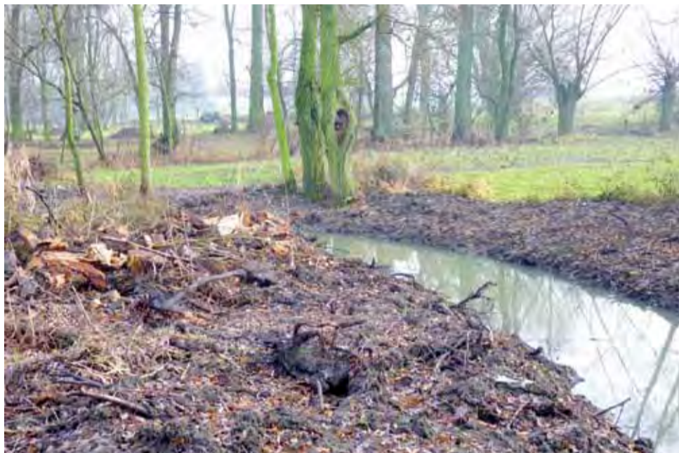
Przez kilka dni drzewa, które zostały wycięte leżały nad brzegiem rzeki. Firma uporządkowała teren dopiero w ostatnich dniach.