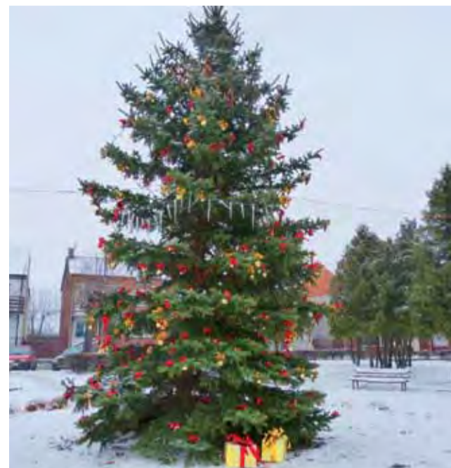
Wspaniała, kilkumetrowa choinka stała na rynku w Kiernozie 6 grudnia. Od najbliższej niedzieli zostaną na niej zapalone lampki. Tradycja dekorowania choinki w centrum Kiernozie sięga początku lat siedemdziesiątych XX w. jr