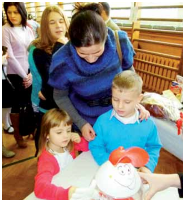
Najdłuższa była kolejka do stoiska z loterią fantową.

Piknik był okazją do złożenia świątecznych życzeń, ale też sposobem na pomoc dla szkoły. Dochód z kiermaszu zasili konto Rady Rodziców, która dofinansuje zakup szafek na ubrania dla uczniów. mwk