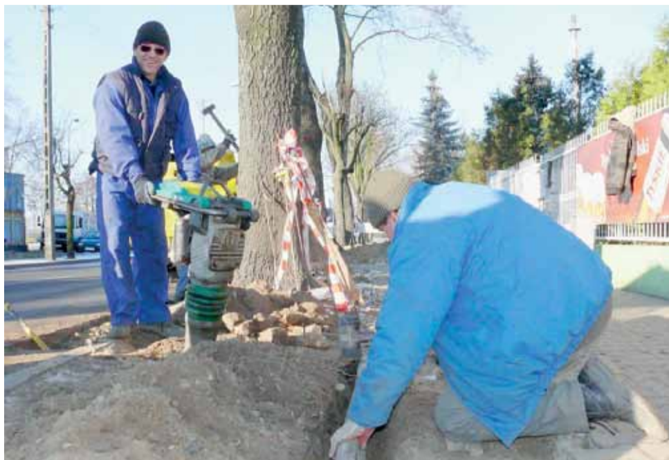
Pracownicy firmy Eurogaz w czasie utwardzania ziemi w miejscu, gdzie rozebrana była nawierzchnia, chodnika przy układaniu sieci gazowniczej.