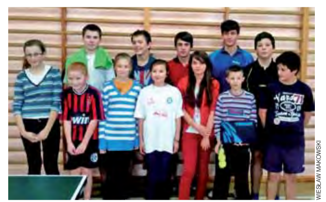
W Bąkowie zorganizowany został mistrzostwa gminy Zduny.