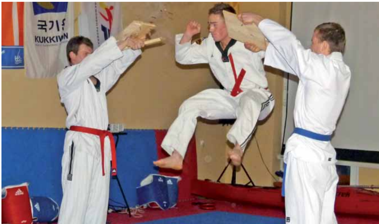
Pokaz taekwondo w wykonaniu zawodników Łowickiej Akademii Sportu.