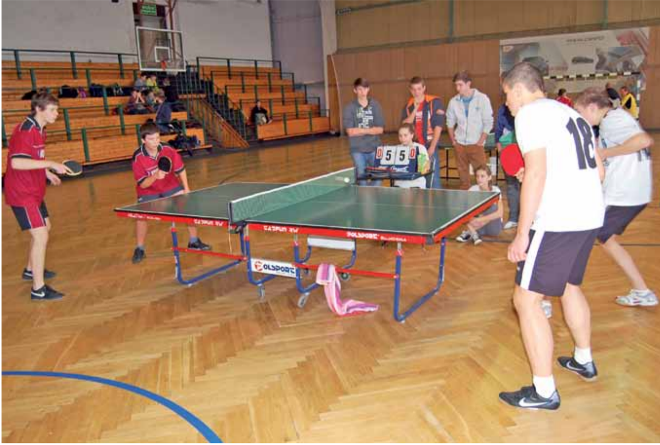
Finał w rywalizacji chłopców stał na całkiem niezłym poziomie.

Sport szkolny | Powiatowa Gimnazjada Szkolna w tenisie stołowym