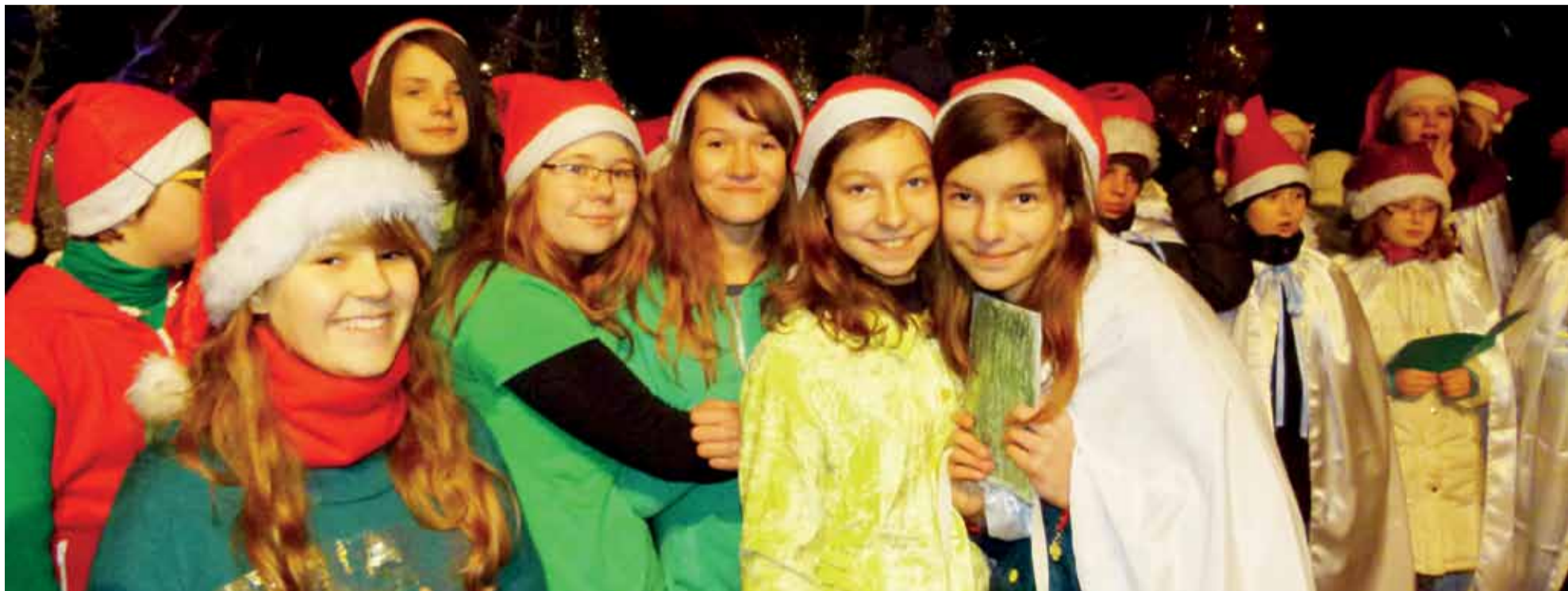
Na scenie występowali uczniowie Szkoły Podstawowej nr 2 w Łowiczu śpiewając kolędy i tańcząc. Emocje przed występem były tak duże, że nie czuli zimna.

Łowicki Stary Rynek | Kolędy i fajerwerki