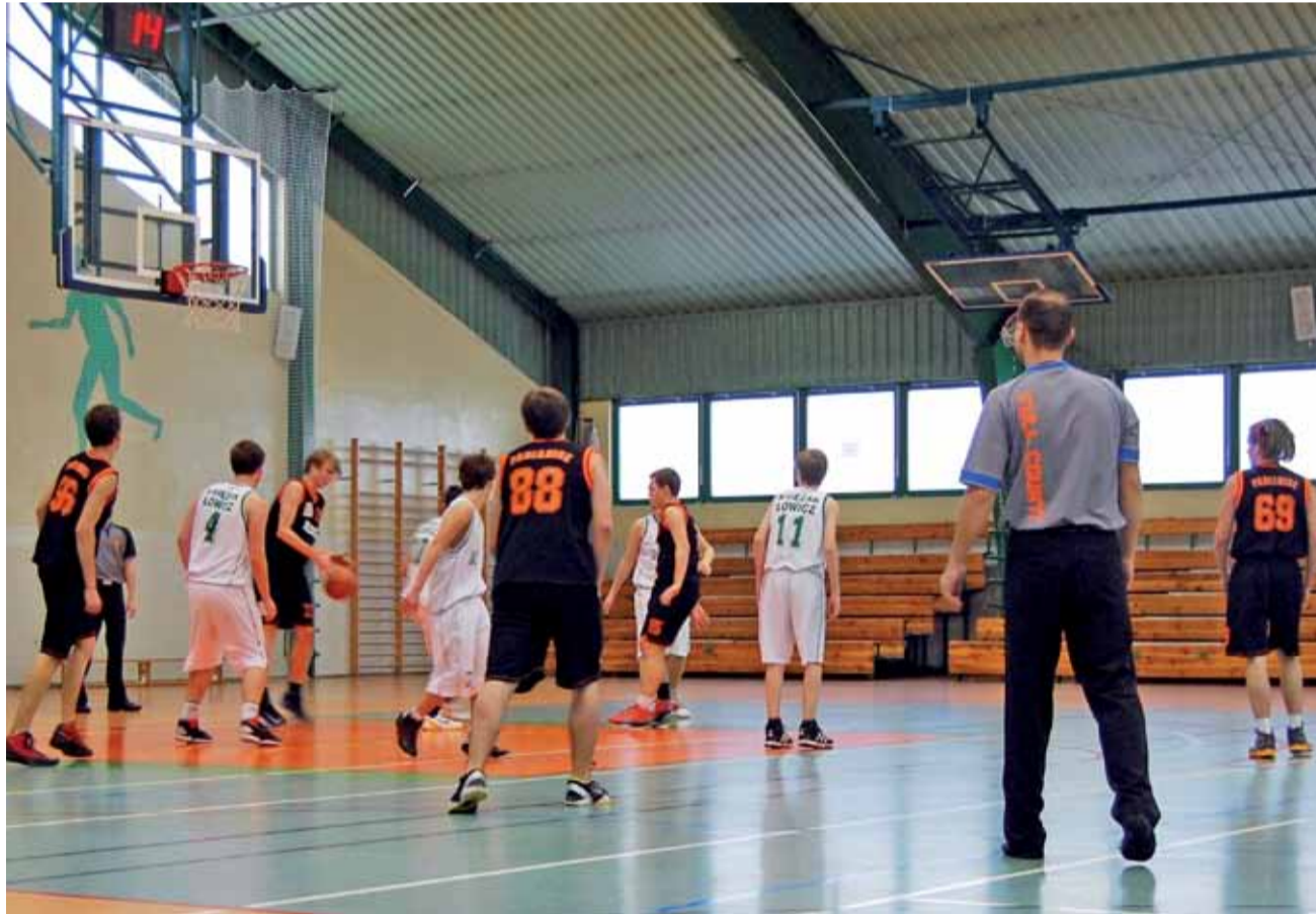
Miejmy nadzieję, że rewanżowym pojedynku z PKK 99 Pabianice, kiedy łowiczanie zagrają w optymalnym składzie, uda się powalczyć o wygraną.

Koszykówka | 9. kolejka wojewódzkiej ligi juniorów U-18