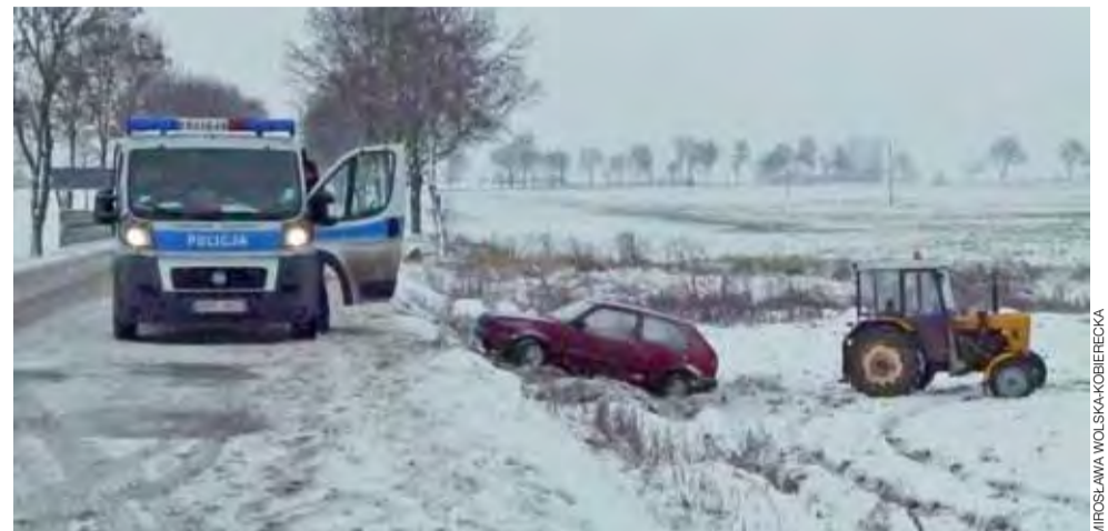
Samochód prowadzony przez 24-letnią kobietę wpadł do rowu, który w tym miejscu jest głęboki.