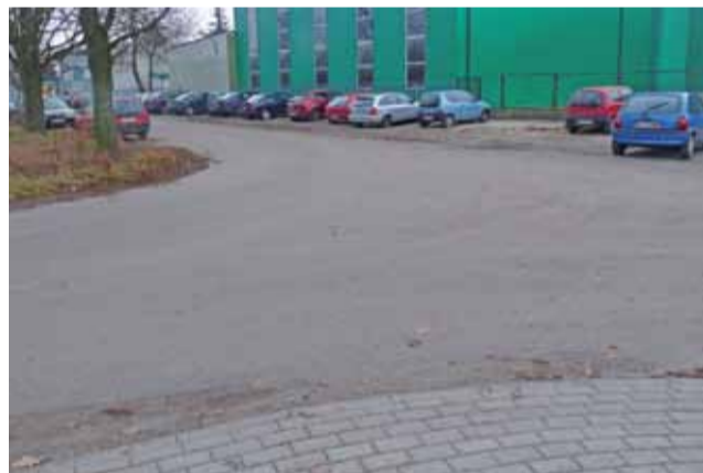
Chodnik kończy się przed zakładem. Dalej dzieci idąc do szkoły muszą iść ulicą.

nieruchomości są budynki mieszkalne lub ich części położone na gruntach gospodarstw rolnych – tak jest w gminie od zawsze. Nowością w uchwale jest to, że zwolnienia nie będą stosowane w przypadku tzw. pozostałych budynków, czyli takich, które są na gruntach o powierzchni poniżej 1 ha. Stawka podatku została jednak w tym przypadku zmniejszona z 4,52 do 4 zł. Zwolnione z podatku są też budynki wykorzystywane na potrzeby prowadzenia działalności kulturalnej, przeciwpożarowej oraz policji. Zwolnienia nie dotyczą budynków, w których prowadzona jest działalność gospodarcza. mak