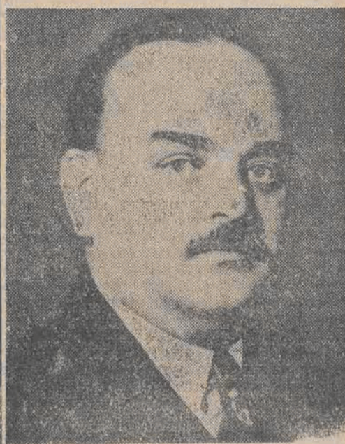
Przewodniczący Prezydium Rady Najwyższej ZSRR — Szvernik przyjął w dniu wczorajszym na specjalnej audiencji — delegację rządu bułgarskiego.

W drugą rocznicę podpisania układu o przyjaźni i wzajemnej pomocy między Rzeczypospolitą Polską a Federacją Ludową Republiką Jugosławii przesyłam na ręce Pana dla narodu Jugosławii w imieniu narodu polskiego i własnym najserdeczniejsze życzenia.