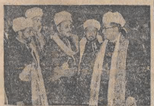
Król Transjordanii ABDULLACH w otoczeniu swojej świty.

żydowskie na Jaffę trwało nadal. Arabowie opuszczają miasto. Co godzina wyjeżdża 20 samochodów z uchodźcami. Do Libanu przybyło już podobno przeszło 20 tys. uchodźców arabskich.