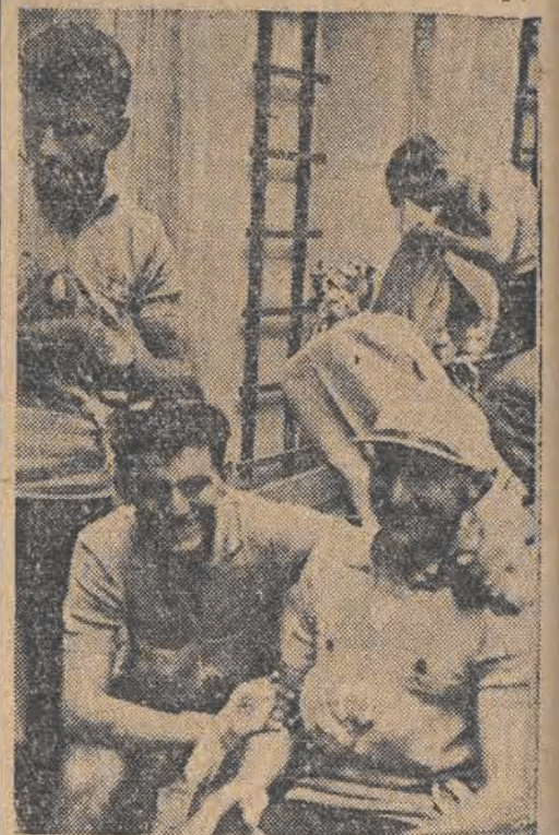
Kolarze Jugosławii zadowoleni są z przyjeżdżania do Łodzi. Tak można wnioskować z uśmiechniętych ich twarzy.

Dla wszystkich wyznaczonych zawodników do turnieju obowiązuje zakaz startu z dniem 18 maja 1948 r.