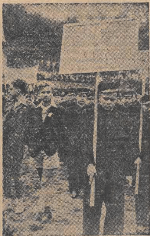
Delegacja młodzieży jugosłowiańskiej we wspólnym pochodzie 1 Maja