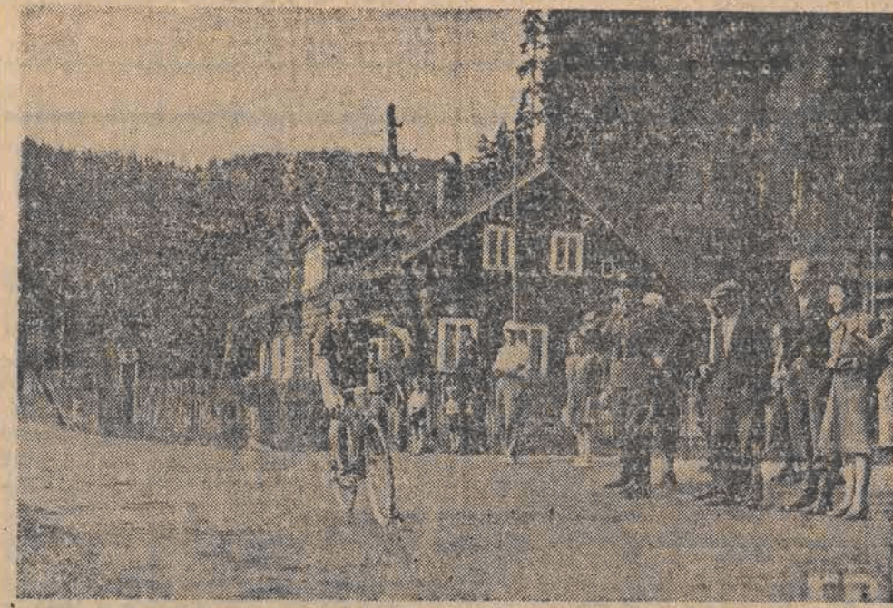
Na granicy czechosłowackiej — pierwszy zawody wielkiego biegu kolarskiego Praga — Warszawa

Bilety ulgowe wyłączenie do nabycia w lokalu DKS Aleksandrow.