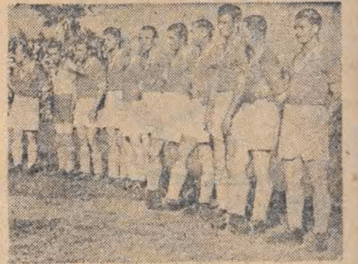
Drużyna piłkarska Jubilatów