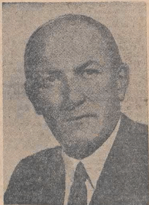
Premier Lajos Dinnyes

O godz. 13.00 minister spraw zagranicznych Republiki Węgierskiej Erik Molnar w towarzystwie wicepremiera spraw zagranicznych Sebestyena, szefa sekcji politycznej w msz Weltay'a i posła węgierskiego w Warszawie