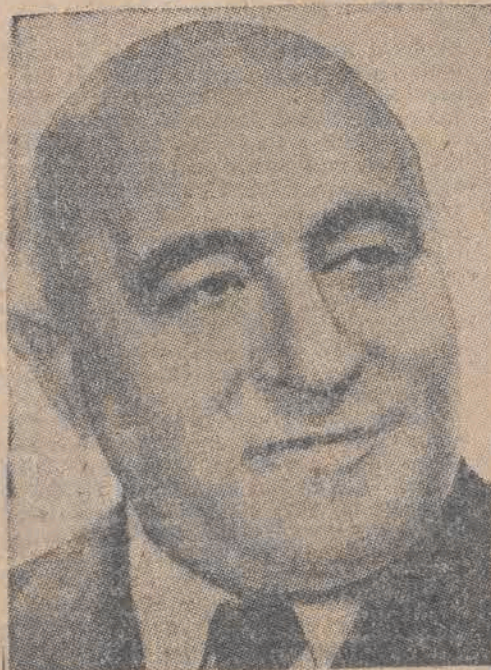
Wicepremier Mathias Rakosi

Delegacja rządowa republiki węgierskiej przybyła w dniu wczorajszym do Warszawy