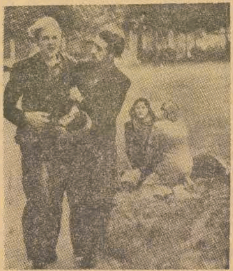
Górnicy francuscy po ataku policji Mocha na kopalnię w Bethune — udzielają pierwszej pomocy rannym towarzyszom.

PUR, gdzie poza przedstawicielami władz przemawiali również: przedstawiciel Zw. Zawodowego Górników i sekretarz Komitetu Powiatowego PPR.