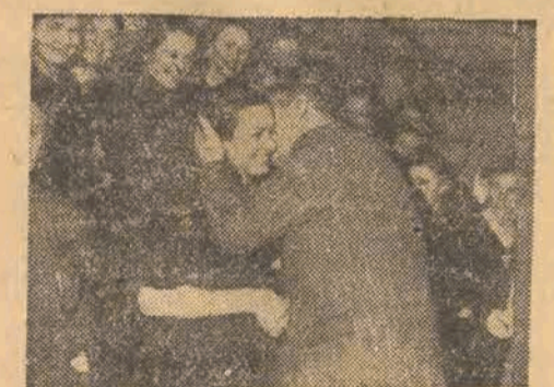
To tylko podziękowanie „naczelnego” za wykonanie planu...

Poza tym uchwalono rezolucję w sprawie jedności Światowej Federacji Związków Zawodowych postanowiono wysłać telegram do Światowej Federacji, zapewnijącej o solidarności polskiego ruchu zawodowego w walce przeciwko próbom rozwijania jedności ruchu zawodowego, przyjęto energiczny protest przeciwko prześladowaniu górników polskich we Francji, wysłano telegram do min. Modzelewskiego o pełnym poparciu jego stanowiska w sprawie stosunku rządu francuskiego do Polaków, zatrudnionych we Francji oraz uchwalono rezolucję protestującą przeciwko prześladowaniom działaczy związkowych w USA.