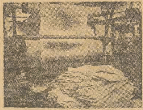
Ostatnia sztuka planu rocznego schodzi z maszyny

„Bardzo ważnym momentem było to wzwanie górników Zabrza. Stare tradycje współzawodnictwa między górnikami i włókiennicami, pragnienie uczczenia Zjednoczonej Partii w sposób nie gorszy od tych pierwszych, przeważało szale. Prócz tego bez przesady mogę stwierdzić, że nasza organizacja partyjna wiele też przyczyniła się do sukcesu. Wokół hasła: „Wykonamy plan przed Kongresem” zmobilizowaliśmy partyjnych i bezpartyjnych robotników. Za trzecią przyczynę należy uznać szeroko u nas rozwinię-