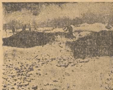
Na Placu Dąbrowskiego rozbijane są i usuwane bunkry, wybudowane tu przez Niemców podczas okupacji.