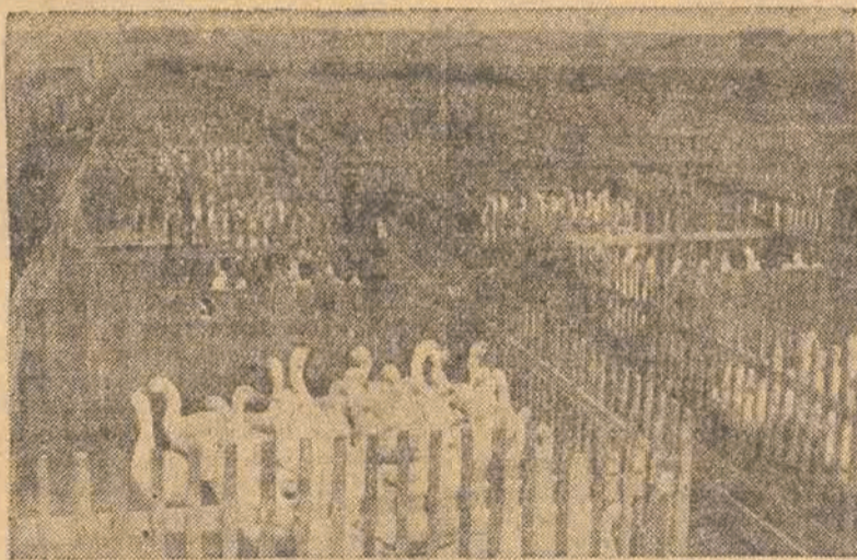
Tuczarnia gęsi w Kutnie prowadzona przez Pow. Zw. Gminnych Spółdzielni eksportuje miesięcznie 5000 gęsi

Powiatowy Zarząd Drogowy powinien zainteresować się tą sprawą i umożliwić tutejszej ludności komunikację z Kutnem.