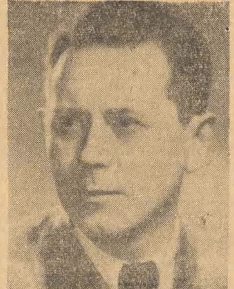
Tow. Eugeniusz Stawicki — prezydent m. Łodzi