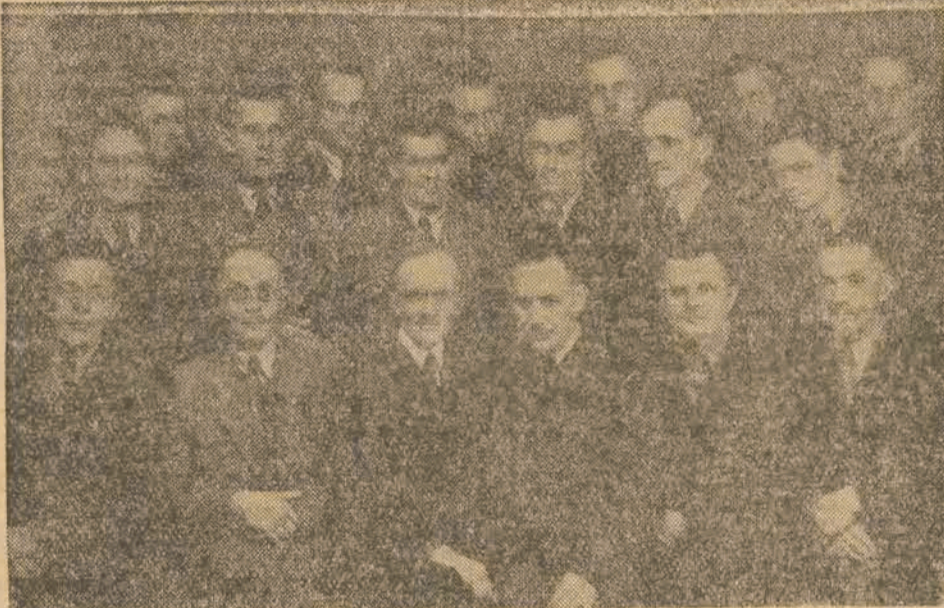
Zarząd Podokręgu Kutnowskiego i Kolegium Sędziów Piłkarskich

W każdym razie mamy nadzieję, że przyszły rok będzie pomyślniejszy dla naszych piłkarzy i przynajmniej jeden z miejscowych klubów zaawansuje do A klasy.