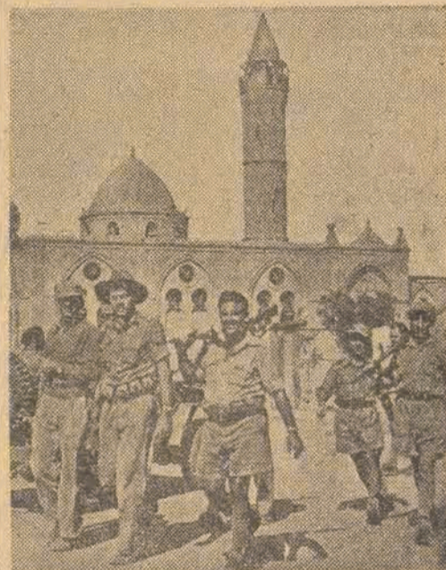
Oddziały żydowskie po zawieszeniu działań wojennych demonstrują na cześć pokoju na ulicach miasta Beersheba.