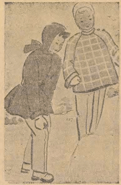
ubiorów dziecięcych oraz popołudniowych pantofelków.

Sukienki uszyte być powinny z tkaniny wełnianej. Do ich sporządzenia wystarczy dwa metry 65 cm. materiału szerokości 1,40. Oznaczają się one daleko posuniętą prostotą kroju. Na-