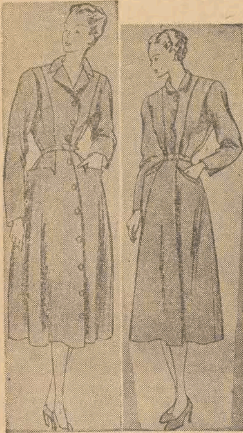
Na załączonych rysunkach przedstawiamy naszym Czytelniczkom wzory sukien zimowych.