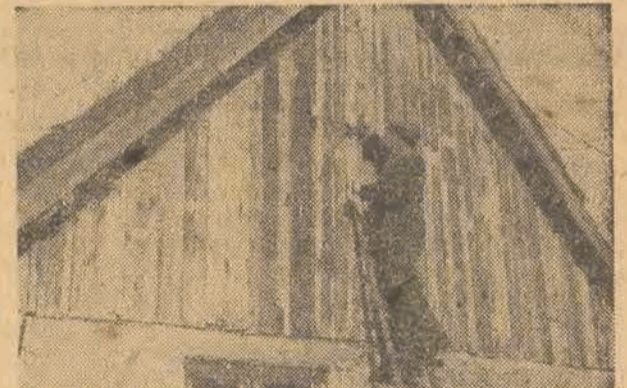
We współzawodnictwie pracy dla uczczenia Kongresu Zjednoczenia wzięła udział i wieś. Przyniosło to jej natychmiast bezpośrednie, konkretne korzyści: oto np. Makowice pod Makowem mają już światło elektryczne i „kontakt” z szerokim światem — radio.