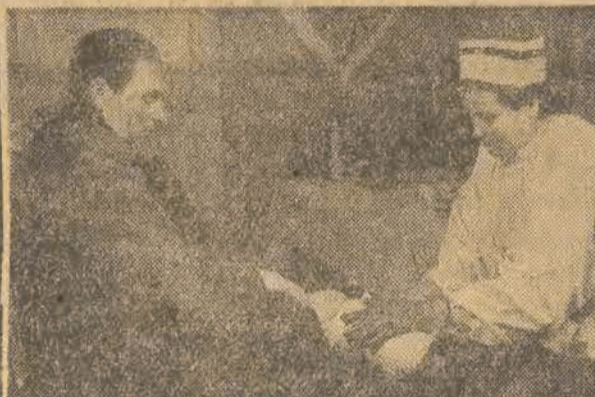
Lekarze-specjaliści szpitala Warszawskiego Korpusu Bezpieczeństwa zobowiązali się w każdą niedzielę nieść pomoc lekarską wsiom najbardziej zniszczonego w czasie wojny b. przyczółka pułtuskiego. Czyn w-w lekarzy zasługuje na gorącą pochwałę i — naśladowanie.