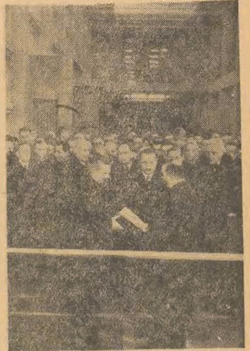
Wyrost z obrad Kongresu Zjednoczenia dostojnicy państwa z Prezydentem R. P., tow. Bolesławem Bierutem przybyli na uroczystość otwarcia centralnego gmachu Ministerstwa Przemysłu i Handlu.

Ojnarnej pracy górników polskich Polska Ludowa zawdzięcza najpocześniejsze osiągnięcia w dziedzinie odbudowy i rozbudowy gospodarczej.