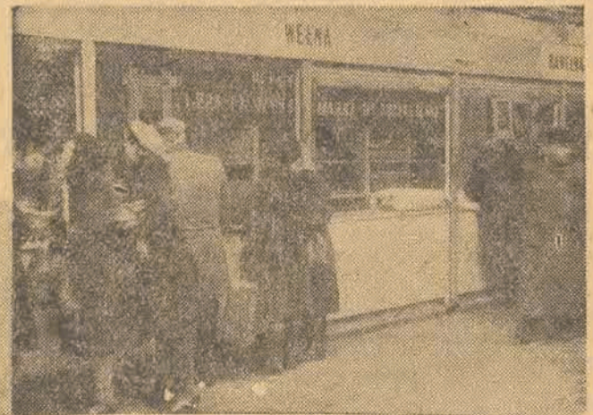
Mimo przedłużenia godzin handlu w okresie przedświątecznym we wszystkich sklepach od wczesnego rana aż do „zamknięcia” rojno było i gwaro. Zwłaszcza tłok panował w doskonale zaopatrzonych i uczciwie kalkulujących cenę sklepach państwowych i spółdzielczych.