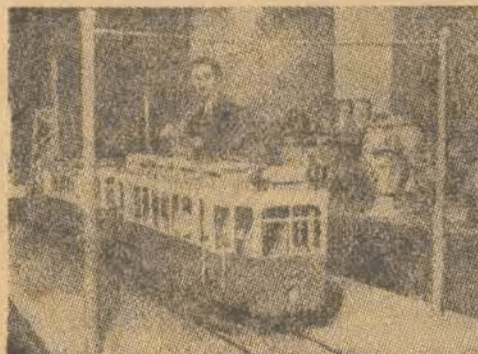
Kongres w czasie swych obrad utrzymywał bezpośrednią łączność z rozentuzjzowanymi masami pracującymi, które za pośrednictwem swych niezliczonych delegacji spieszyły z uroczystymi meldunkami o przebiegu planu produkcji i symbolicznymi podarkami dla Kongresu.