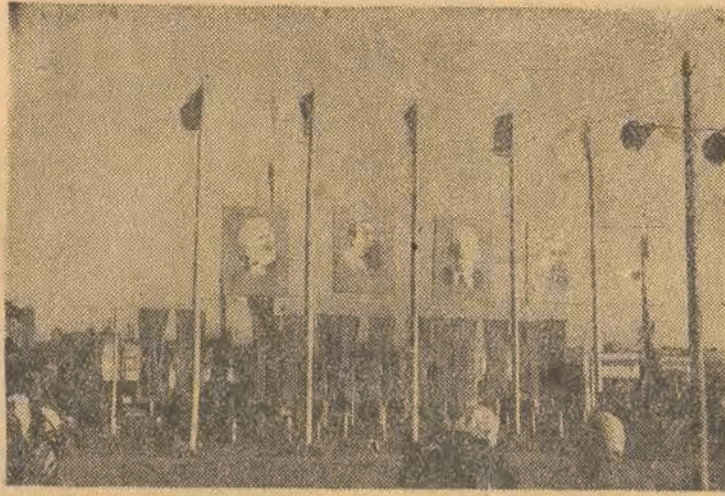
Historyczny Kongres Jedności Klasy Robotniczej zakończył w tym tygodniu swe obrady. Pod zwycięskimi sztandarami marksizmu-leninizmu, wypróbowaną drogą Marksa-Engelsa-Lenina-Stalina Polska Zjednoczona Partia Robotnicza powiedzie masę pracującą, powiedzie naród do dobrobytu i ustroju sprawiedliwości społecznej.