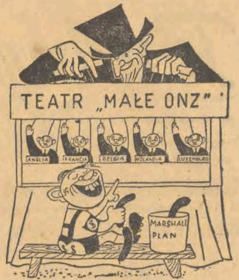
Rozrywki świąteczne niemieckich przemysłowców Bizonii