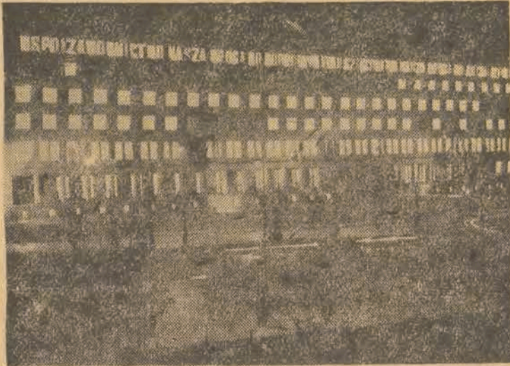
Oto tempo odbudowy i budowy: ten wspaniale iluminowany gmach — to nowootwarty budynek Ministerstwa Przemysłu i Handlu. Budynek ten powstał w rekordowym czasie 14 miesięcy, podczas gdy normalnie w Polsce przedwojennej i za granicą budowa takiego olbrzyma trwa 3—4 lat.