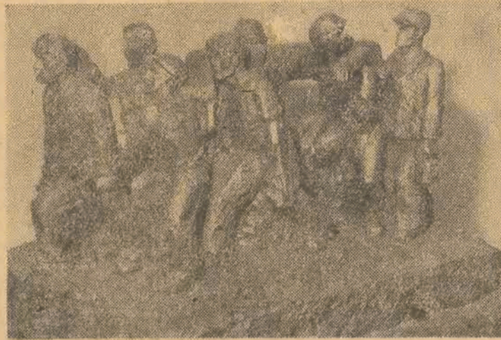
Polski przemysł węglowy wykonał 16 km. przedterminowo państwowy plan produkcyjny na rok 1948, wydobywszy 7.500 tys. ton węgla kamiennego.

Ojnarnej pracy górników polskich Polska Ludowa zawdzięcza najpocześniejsze osiągnięcia w dziedzinie odbudowy i rozbudowy gospodarczej.