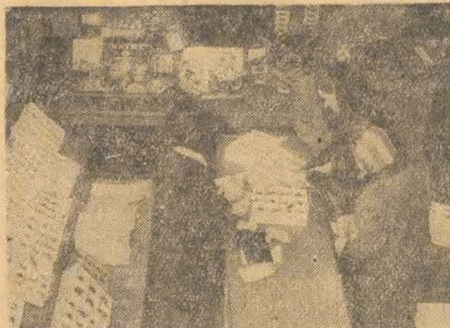
Kiedy w krajach t. zw. marshallowskich święta tegoroczne upływają pod znakiem zaciskania pasa — w Polsce wręcz przeciwnie: paska się popuszcza. W wykonaniu planu gospodarczego dobrobyt i stopa ludności wzrasta z roku na rok.