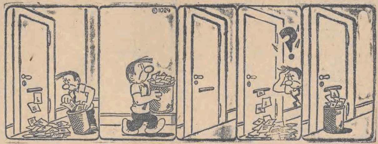
Co listów! Trzeba wyrzucić! Czysto! Znowu? Wynałazek!