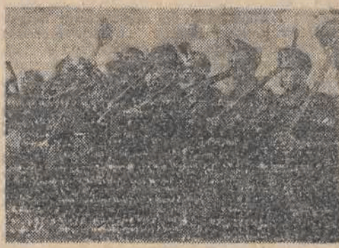
Brygada terenowa „Służby Polsce” dzielnie placuje przy odbudowie ważnego węzła kolejowego na linii Wdzew — Olechów.