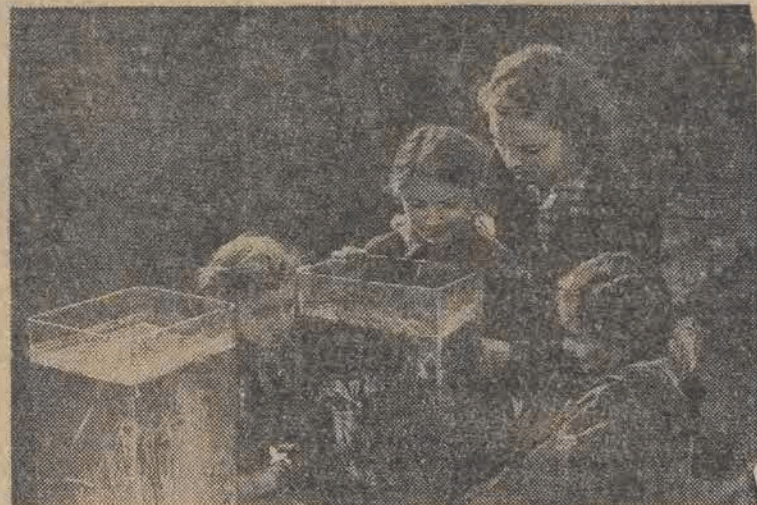
Pobyt w krainie przygody to nie tylko zabawa. Starsze dzieci w tajemnicząją tych najmłodszych w tajemki wiedzy o przyrodzie. Najmilsze chwile spędza się przy akwariach, gdzie pluszczą się tajemnicze rybki