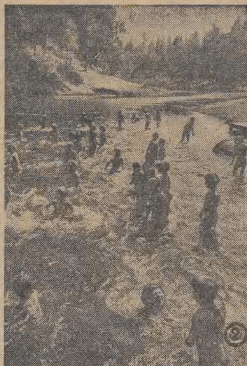
Leśny strumień zaroił się dziatwą z miasta. Co tu krzyku i wrzawy. Siedmiolatki pluszczą się w kryształowej wodzie jak rybki — pod opieką starszych pionierów, które czuwają nad wszystkim