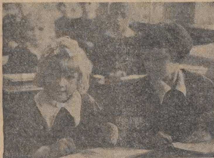
Siedmiolatnie dziewczęta nie mogą się doczekać końca lekcji. Już jutro pojadą własną koleją w daleki świat przygód, gdzie czeka na nie słońce, powietrze i woda