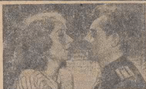
Z filmu „As wywiadu”.

Filmy radzieckie zyskują sobie coraz szersze uznanie na świecie. Obok ich pierwszorzędnych wartości artystycznych, doskonałej, wnikliwej gry, reżyserii wczuwającej się w najgłębsze tajniki sztuki odtwórczej — rzesze entuzjastów zdobywają radzieckie obrazy dzięki pełnej szlachetnych myśli i wielkiego człowieczeństwa ich treści.