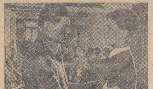
Film z życia młodzieży radzieckiej — „Czerwony Krawat”.

i której czyni rozplamienią wyobraźnię milio na młodzieńców i dziewcząt, kochających wolność i ziemię ojczystą, zdecydowanych krocząc w pierwszym szeregu na drodze do socjalizmu. Gierasimow wykazał przy realizacji filmu wielką odwagę i intuicję. Mianowicie zdecydował się na powierzenie ról „młodogwardzistów” uczniom Państwowej Szkoły Filmowej w Moskwie, którzy znakomicie wczuli się w intencje autora powieści i filmu, oraz w charakterystykę odtwarzanych przez siebie bohaterów.