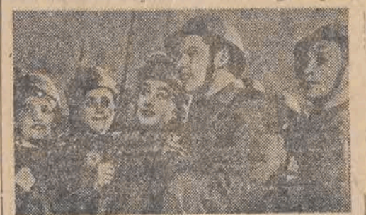
Scena z filmu „Aleksander Matrosow”

Wszyscy, którzy czytali znakomitą powieść Fadiejewa, ze wzruszeniem oglądali będą na ekranie znajome postacie młodzieży, która poznała całe barbarzyństwo niemieckiego najazdu