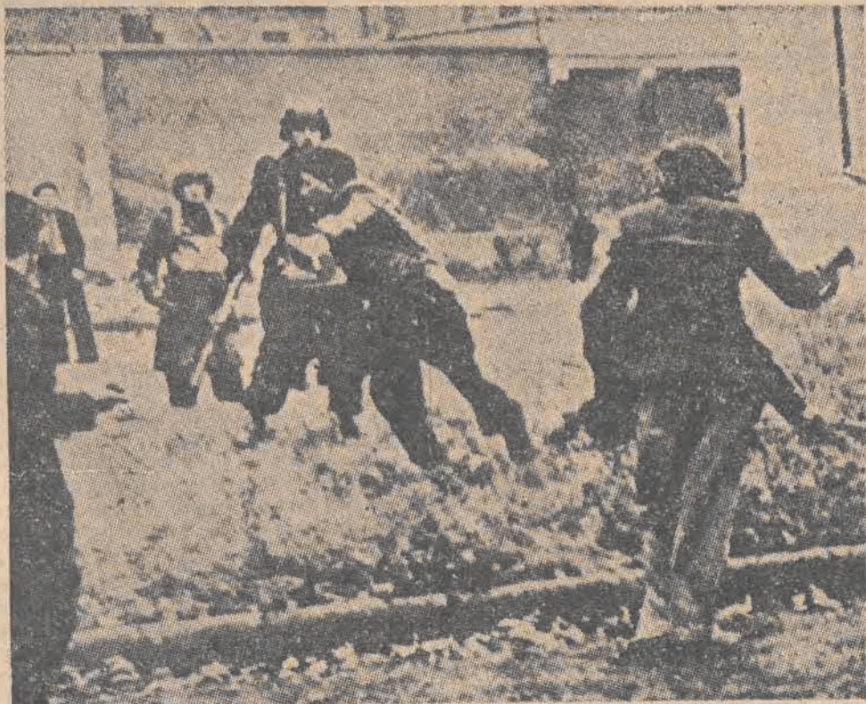
Starcia z uzbrojoną policją Mocha, atakującą wejścia do szybów górniczych w Bethune