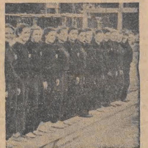
Drużyna żeńska SPK (Bratislava)

• • • Południowe części Związku Radzieckiego sa